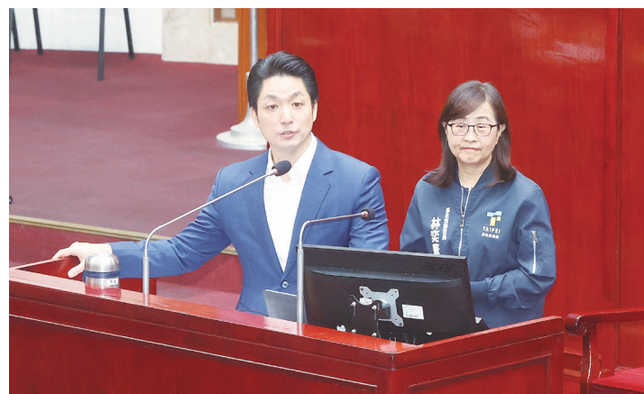
▲台北市長蔣萬安（左）27 日列席議會備詢，被問及雙城論壇舉辦時間時表示，目前規劃是 12 月底，但確切日期及行程等細節還在跟上海確認，拍板了一定會跟大家說明。右為台北市副市長林家華。