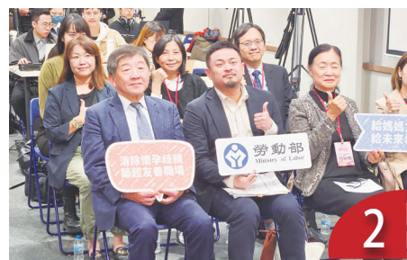
憂懷孕影響考績 違法將加強宣導