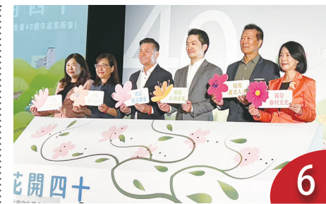
文基會 40 慶生 感恩茶會共許未來