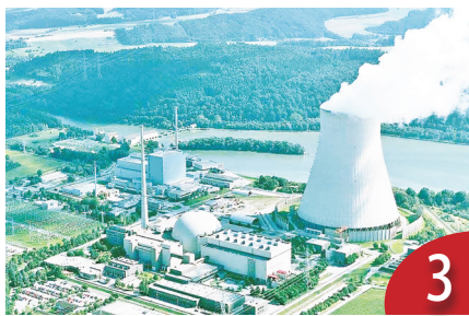
碳費收入公開 從重點產業做起