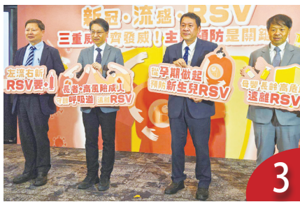
RSV 確診已超新冠 醫籲打疫苗