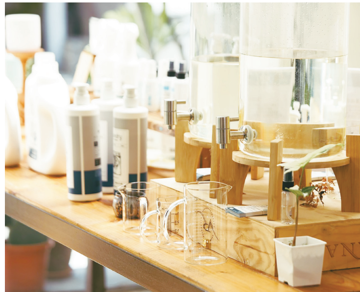
▲「料理乾淨」，前一詞雖是說吃東西，但當然也有「處理」的意思。(網路截圖)

或許可以這樣解釋：想要成為有料（有內涵者）的人，就必須以有料（付出一定的代價）為基礎吧。