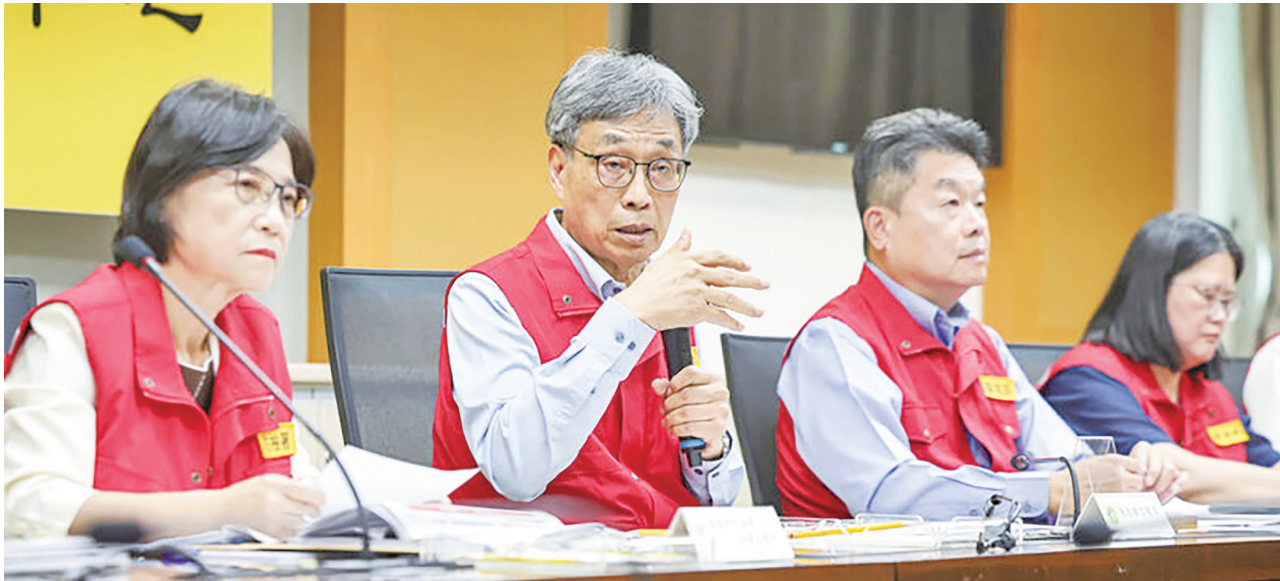
▲針對非洲豬瘟因應，農業部5日宣布，6日恢復活豬運載，7日恢復屠宰屠體運輸。

台中梧棲養豬場在10月22日爆發非洲豬瘟確診，農業部先啟動豬隻禁運禁宰與禁廚餘養豬等七項防疫作為，隨後啟動三階段、每階段五天的防疫措施。農業部長陳駿季下午主持非洲豬瘟中央災害應變中心記者會時表示，因為沒有新增個案，明天中午12時就會解除