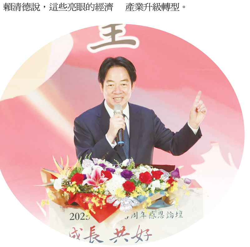
▲ 總統賴清德 5 日致詞表示，台灣 114 年經濟成長率預計會超過 5%，贏過日本、新加坡等國以外，也會贏過中國。（中央社）

【本報記者夏恩綜合報導】台灣今年經濟表現好，總統賴清德 5 日出席中國生產力中心「70 週年感恩論壇」時致詞表示，台灣經濟持續不斷成長，可以預期今年經濟成長率會超過 5%，這不僅僅是亞洲四小龍第 1 名，也會贏過日本、新加坡、美國、歐盟，今年也會贏過中國。