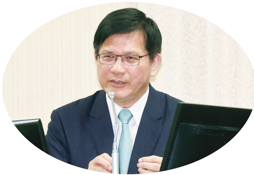
▲國民黨立委馬文君質疑近日外交負面新聞多，外交部回應說，有部分是認知作戰。圖為外交部長林佳龍。

林佳龍指出，加拿大的部分，該國代表處也已經有說明，至於愛沙尼亞的部分，由於6月該國國會才通過立法，因此目前還在針對各種議題（名稱、豁免特權）等進行協商中。馬