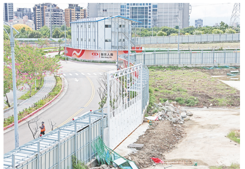
▲ 輝達台灣總部將落腳北士科 T17、T18 基地，台北市副市長李四川 5 日表示，已收到新光人壽提出解約金額約新台幣 44.7 億元，看起來還算合理，希望 7 日就能簽解約協議書。圖為北士科 T17、T18 現場情形。

台幣 44.7 億元，扣除本來就繳給市府的 34.4 億餘元，差額大概近 10.4 億元，會在與輝達協議權利金時拿回來。另外，與原先市府估算的 8 億多元相比，主要是因為新壽還有繳納約 1 億元稅金給中央，以及雙方對資金成本計算方式不同。