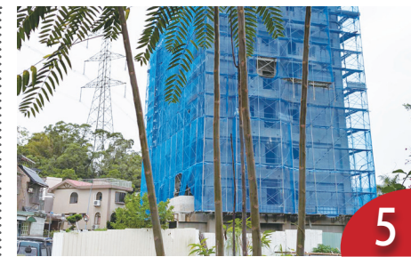
山坡地老丙建管理正義何在 (蕭家興)