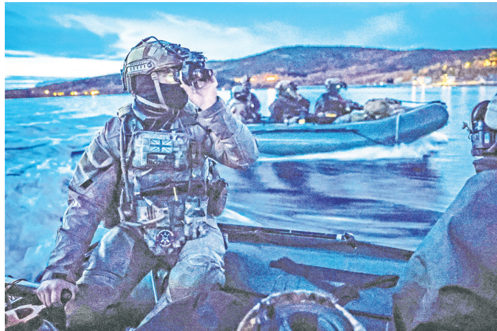
▲ 由英國主導的歐洲10國遠征軍聯合部隊（JEF）9月初至10月底舉行TARASSIS軍事演訓，涵蓋海、陸、空、太空和網路領域，規模刷新紀錄，非JEF成員國加拿大也加入。