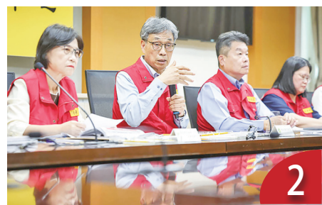
6日活豬可運載 7日復屠宰運輸