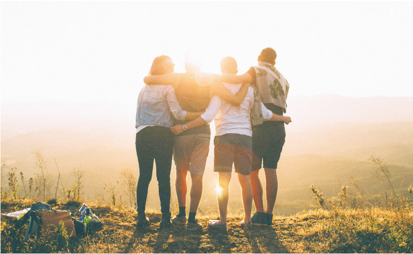
▲我們願意向他人敞開心扉、展現自己的脆弱，這正是我們之所以能對未來懷有希望的關鍵所在。（網路截圖）

為了關注其他科學家，我註冊推特（X，前稱 Twitter）帳號，卻發現自己被大量充滿憤怒、詐騙和個人品牌行銷的訊息所淹沒。過去我和太太舉辦婚禮的葡萄園，已經被加州大火所吞噬，當我們在結婚紀念日特地開車經過那片焦黑的廢墟，我不禁想著：世上還有多少地方將會變成這副模樣？而這一天，又會多快到來？