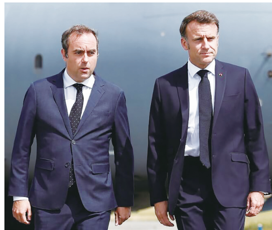
▼法國新任總理勒克努（左）5日雖公布新政府內閣名單，但變動少加上國會結構，外界擔心此屆法國內閣也不會持久。

此外，馬克宏原本在國會的盟友、中右派的共和黨擔心馬克宏受到左派壓力而在預算案與退休金等法案妥協，因此要求中間派的馬克宏要多納入右派的聲音；但左派聯盟中的最大黨「不屈法國」則持續要求馬克宏辭職、重新選舉讓國會與政府回歸新常態，才能順利運作。馬克宏在2024年解散國會後，陷入更嚴重的少數執政困境，在577席國會中僅有212席，反對黨、左派的新人民陣線（不屈法國、社會黨、綠黨等）則有193席，極右派的國民聯盟則有142席，因此三方陷入互相反對的僵局，馬克宏在1年之內因為政治僵局換了4任總理，目前施政陷入嚴重瓶頸。