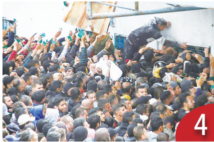
哈瑪斯答應部分條件 川普盼停火