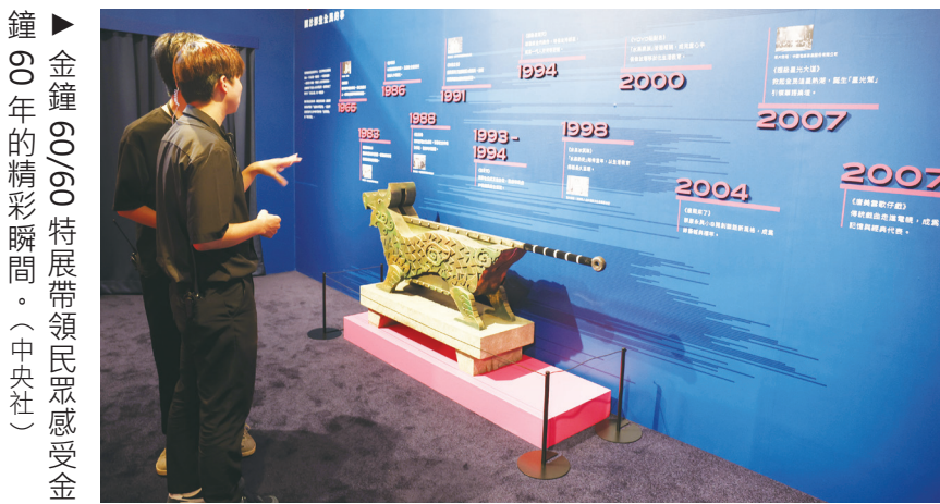
鐘60年的精彩瞬間。

【本報記者呂翔禾台北報導】《培梅食譜》、《包青天》與《水果冰淇淋》等經典節目，將在金鐘獎特展重磅回歸！今年是金鐘獎60周年，文化部即日起至19日在華山舉行《金鐘60/60特展》，將以4大主題展區，帶領觀眾回味台灣影視廣播60年來的發展。文化部長李遠笑說，自己以前曾參加過五燈獎，唱得五音不全被趕下台，這是很珍貴的記憶。