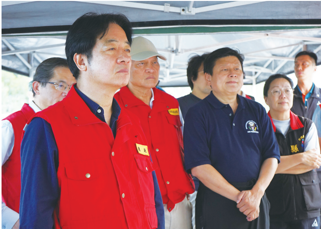
▲總統賴清德（前左）5日二度前往花蓮勘災，並視察馬鞍便道施工進度，國民黨立委傅崐萁（2排左3）、花蓮縣長徐榛蔚（2排左4）等人也在旁一同聽取相關簡報。

【本報記者呂翔禾台北報導】中央與花蓮罕見放下口水，一起應對災害！總統賴清德5日視察花蓮縣光復鄉中央協調所，花蓮縣長徐榛蔚、在地立委傅崐萁都到了，兩人陸續感謝總統，也在簡報後暢所欲言、提