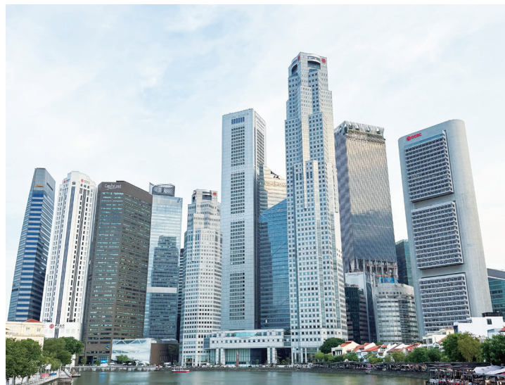
▲ 新加坡對國際貿易的依賴程度高，經濟表現往往被視為全球貿易環境的晴雨表之一。