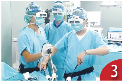
3 醫美限動刀 美容醫學會肯定政策