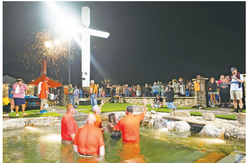
▲ 2025 FaithFest 戶外佈道有超過 1000 名與會者決定將自己的生命獻給基督，並約有 100 人當場受洗歸主。