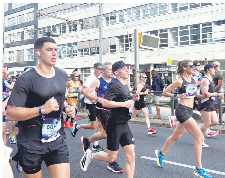
▲ 柏林馬拉松向來禁止配戴耳機，但未嚴格實施管制。如今放寬禁令，是否全面解禁引起討論。