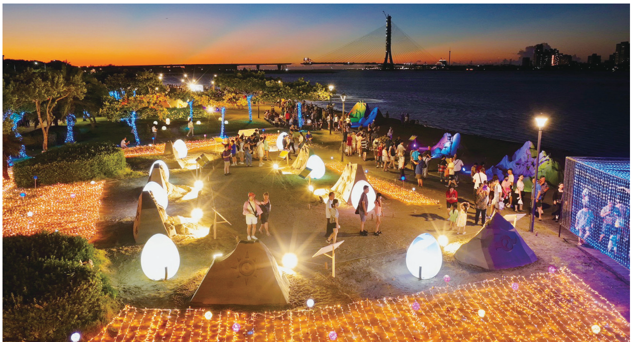
▲以國際藝術節吸引觀光人潮的啟發，各縣市紛紛以文化藝術為名舉辦各類節慶，猶如元宵燈會或花火節一般蔚為風潮。

我們樂見文化藝術創作能跟民眾對話，但美感培育要在家庭及學校生活中；公共藝術設計則要結合功能需求及生活地景，方足以成就建築及環境美學。