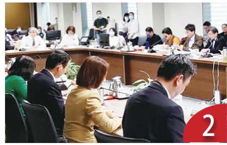
2 財劃法檢討 學者：瑕疵修正就好