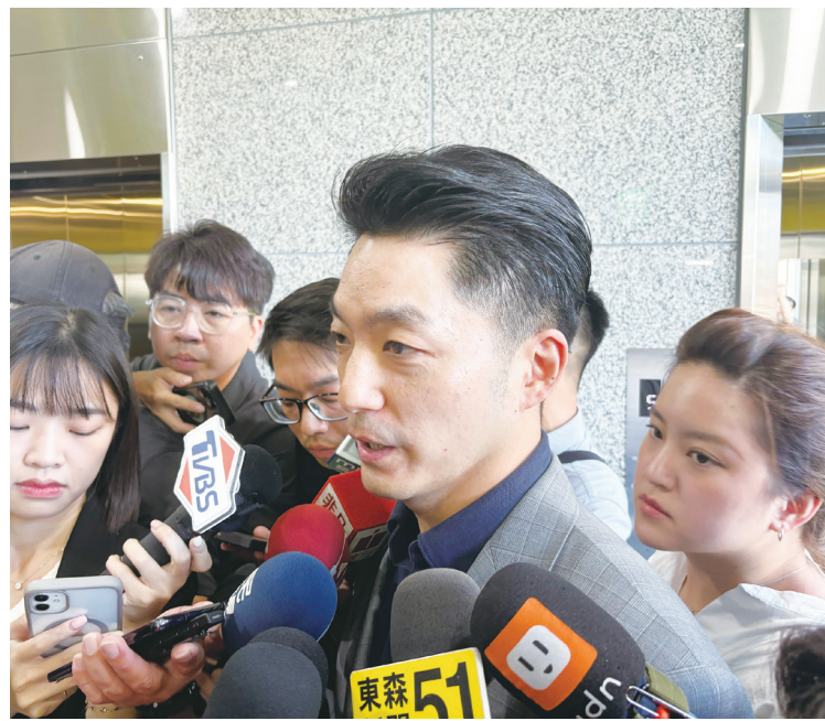
▲針對財劃法爭議，台北市長蔣萬安(前中)17日被媒體堵訪時表示，中央「左手給、右手扣」的兩面手法非常不可取，他支持台中市長盧秀燕、高雄市長陳其邁一同就捷運建設補助遭刪減向中央表達心聲，並向總統賴清德喊話，若賴總統真心要照顧民生，就請提出修法版本。