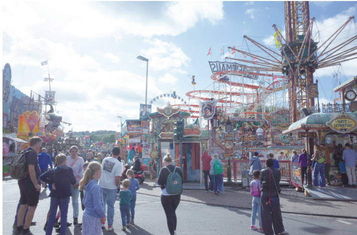
▲ 德國波昂的普茨琴市集（Pützchens Markt），有許多大型遊樂設施。9 月 13 日至 15 日吸引 60 萬人潮前往。