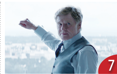
7 巨星風範：追思勞勃瑞福（藍趙蔚）