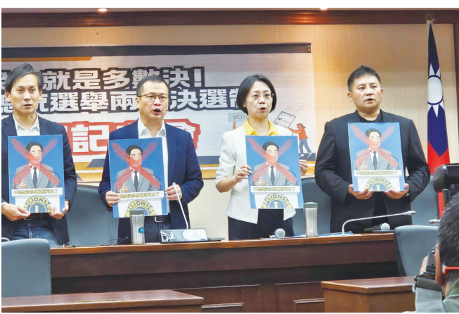
多位藍委 17 日倡議修憲，盼將總統從相對多數決改成若第一輪未有人選過半，採兩輪決選制。

林實芳強調，當初就是在民間團體號召、大法官釋憲下，才讓離婚後子女優先判給父親的落後規定遭宣判違憲。若大法官持續困在新《憲訴法》下，恐無法作出解釋。她指出，其實大法官陳忠五的意見書也呼籲大法官應解決問題，她也期盼整個憲法法庭能站出來。