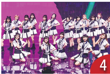
4 女團單曲比拚 AI 票選勝真人