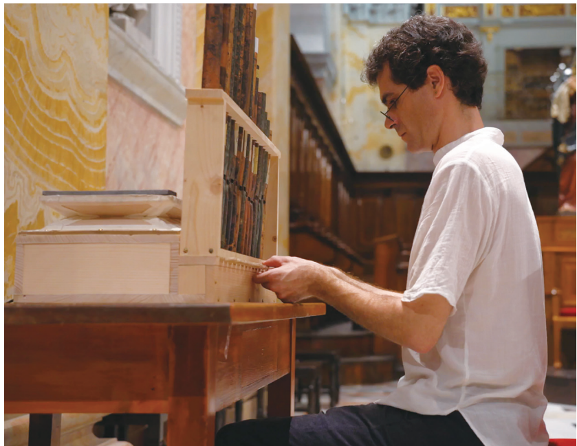
▲ 在沉寂 800 年之後，基督教世界最古老的管風琴再度奏響樂章。（影片截圖）

參與修復的管風琴專家范德林德表示，十字軍的希望沒有落空，這些管子在地下埋藏大約 700 年、沉寂了 800 年後再次鳴響，真是令人感動。