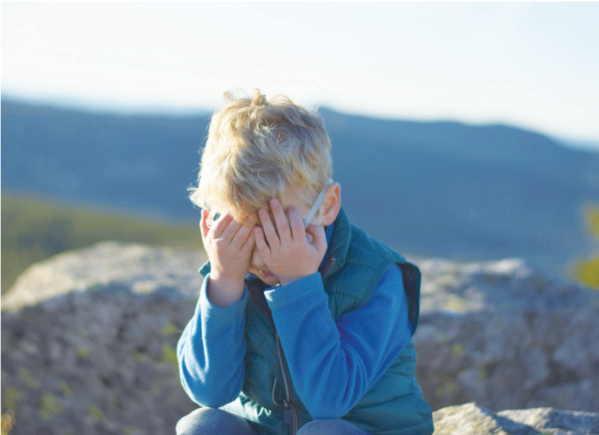
▲即使在精神分析這座備受尊崇的殿堂中，羞恥感也長期處於陰影之中，直到近幾十年，作家和臨床醫師才認知其重要性，並將其帶入公眾視野。(網路截圖)

神經生物學效應儘管令人不悅，卻十分引人入勝；同時，它也將我們的敘事扭曲成痛苦的故事情節。