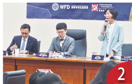
2 立院引 AI 應用 藍綠盼增立法品質