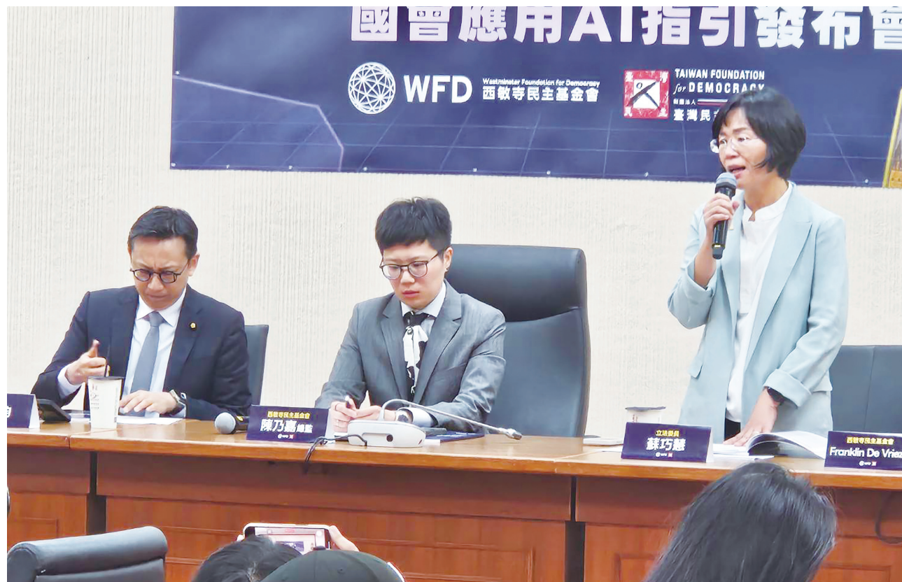
▲西敏寺民主基金會與立法院合作，將應用《國會應用AI指引》中文版，作為未來使用AI立法的參考依據。

包括即時字幕、口頭與書面質詢內容生成等，AI 應用得好可以改善立法品質、減少立法錯誤，但其中也有問題值得討論。