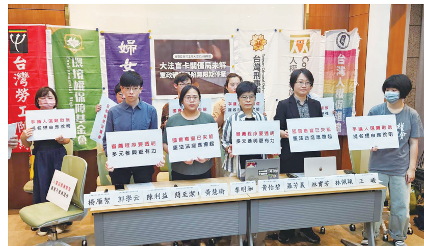
▲ 民間司改聯盟 17 日召開記者會，呼籲大法官主動審查《憲訴法》、總統提名要多元、立法院審查要理性。

「修憲、修法我們都要提！」國民黨立委吳宗憲強調，由於學界對於是否要修憲仍有不同意見，因此兩種修法路徑都會提，且修憲委員會已經成立，但他希望仿效法國第五共和，將相關規定直接入憲，可強化