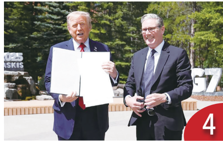
英美合作發展核電 滿足用電需求