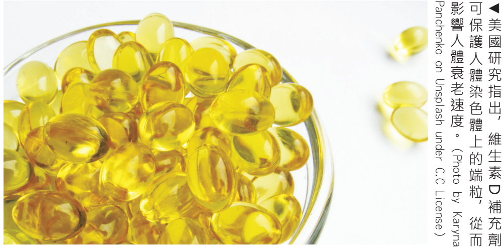
▲ 美國研究指出，維生素 D 補充劑可保護人體染色體上的端粒，從而影響人體衰老速度。