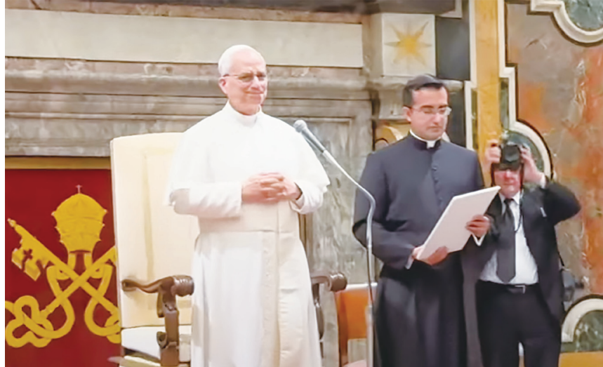
▲ 教宗良十四世在人類博愛世界會議呼籲：「人們更需要團結起來，彰顯人性中的慈愛與和平！」（影片截圖）