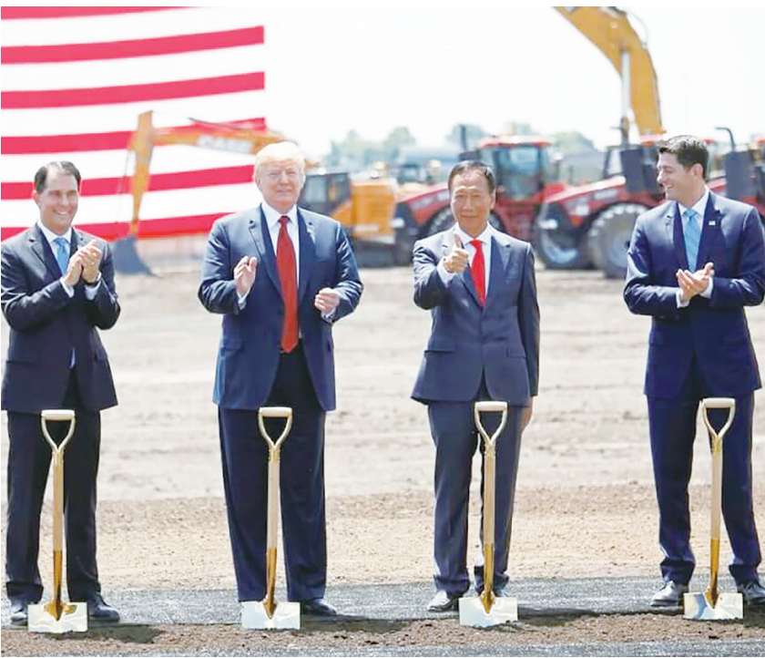
▲鎮上的支持者相信——或者宣稱他們相信——支持富士康計劃就是在幫美國再次偉大。(網路截圖)

些人被經濟發展專業人士拉攏的方式，就像婚禮策劃師被鄉村俱樂部拉攏一樣。這群顧問讓這套機器運作得轟隆作響，他們如法炮製出一堆報告，讓花在發展上的每一塊錢，看起來都像當年買微軟首次公開募股的股票那樣聰明。