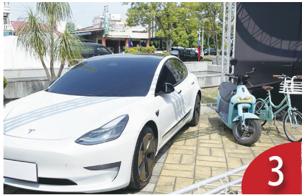
電動車免徵稅貨物稅 延 2030