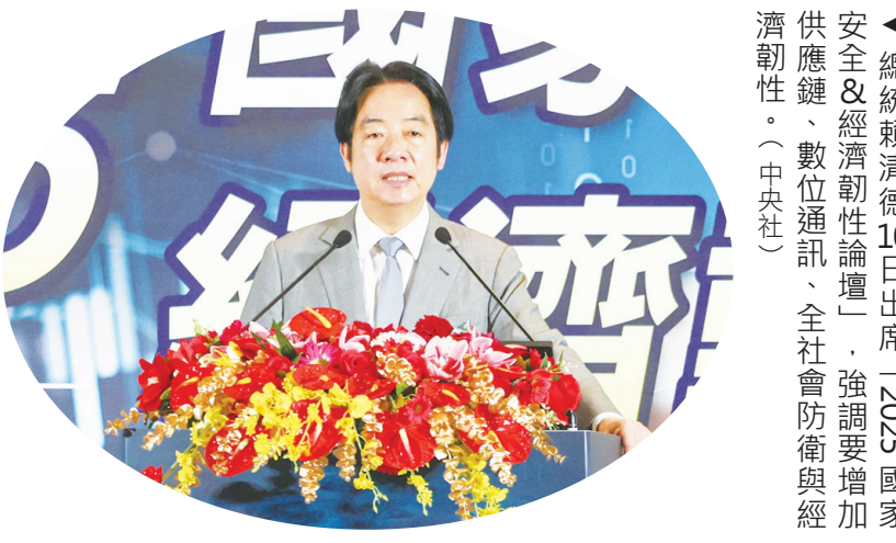
總統賴清德 10 日出席「2025 國家安全 & 經濟韌性論壇」，強調要增加供應鏈、數位通訊、全社會防衛與經濟韌性。

【本報記者呂翔禾台北報導】「台灣要強化供應鏈、數位通訊、全社會防衛與經濟韌性，銀行要多幫中小企業！」總統賴清德 10 日出席論壇時強調，台灣經濟上半年雖成長 6.75%，但面對美國對等關稅，政府會協助中小微企業轉型、強化關鍵數位基礎建設、提升資安防衛，也盼銀行在兼顧放貸管控下，多協助中小企業，「不要雨天收傘」。