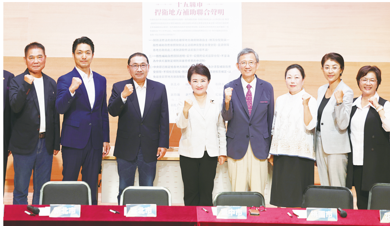
▲針對財劃法及統籌分配稅款議題，台中市長盧秀燕（左 4）10 日與新北市長侯友宜（左 3）、台北市長蔣萬安（左 2）、苗栗縣長鍾東錦（左）、桃園市副市長王明鉅（右 4）、花蓮縣長徐榛蔚（右 3）、南投縣長許淑華（右 2）、彰化縣長王惠美（右）等縣市正副首長於台北召開記者會，一同發表捍衛地方補助聯合聲明。（中央社）

財政部近日公布明年度統籌分配款試算金額，不少縣市金額不如預期，藍白 16 縣市首長赴台北南港區開記者會。