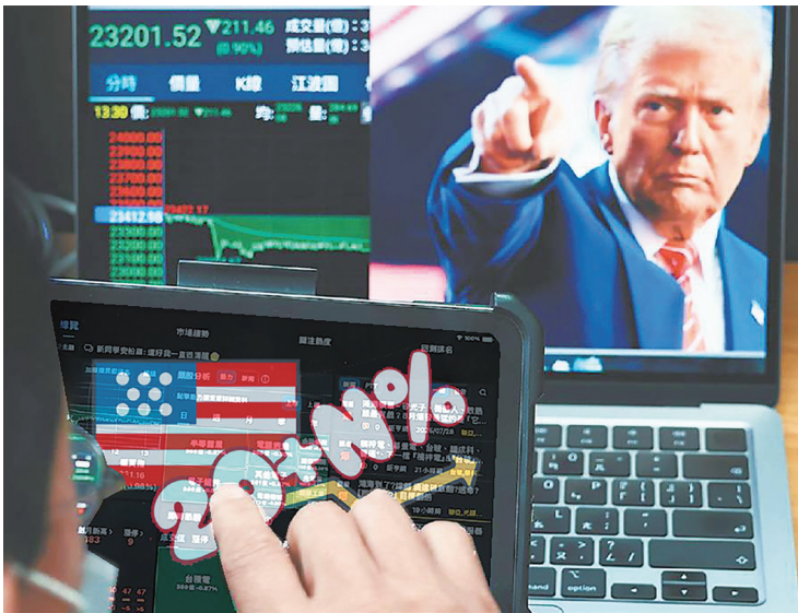
▲到底要「暫時」多久？N到底是多少？不管再怎麼問，都沒有答案，當局者只是回覆「還在討論中」。（網路截圖）

到底要「暫時」多久？N到底是多少？還有哪些附帶條件？究竟那些行業已遭到損害？或者因未定，所以沒事？眾產業該如何因應？政府有何對策？不管再怎麼問，都沒有答案，當局者只是回覆「還在討論中」。所以原本的醒世箴言，就變成可笑又諷刺的，「當局者清、旁觀者迷」了。