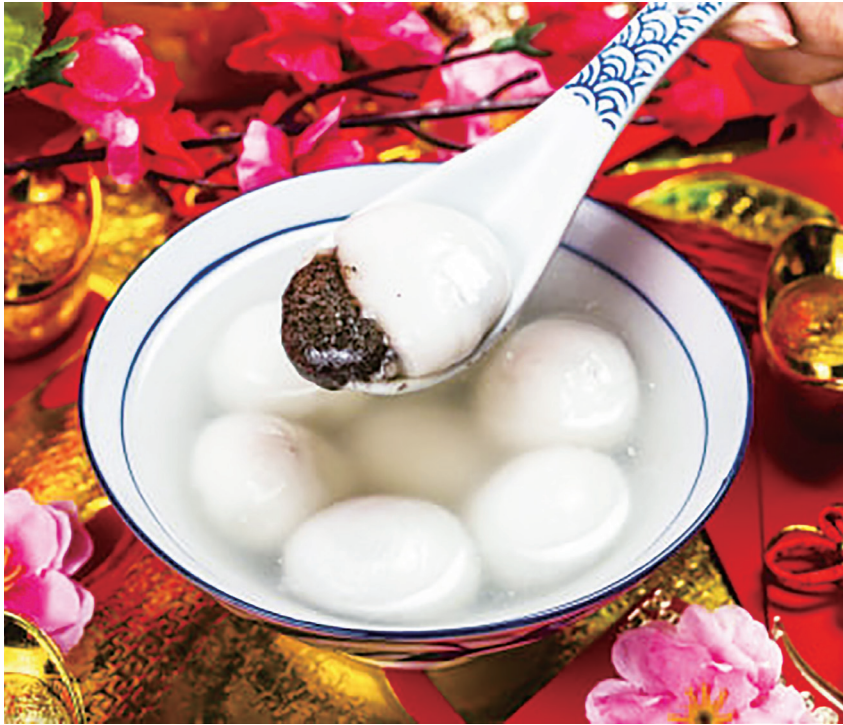
▲元宵口味五花八門，但最受歡迎的仍舊是花生、芝麻、紅豆這幾種傳統口味。(網路截圖)

燃燒有極大關聯，譬如鹽水蜂炮、臺東炸寒單爺、後龍攻炮城、平溪放天燈、社子島夜弄土地公等等。