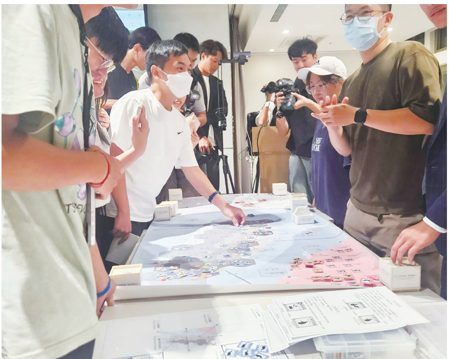
▲台大國安社 9 日晚間舉行科普兵推，邀請大學生參與模擬，並由前參謀總長、前美國國防部官員與學者評析。（Photo by 呂翔禾／台灣醒報）

疾管署、多個醫學會 10 日提醒民眾，確診新冠、流感帶給身體影響不可輕忽，呼籲民眾儘速施打疫苗。（中央社示意圖）