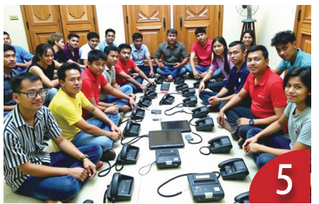
清除新南向政策下的治安隱患