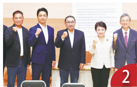
財劃法分配爭議多 政院地方角力