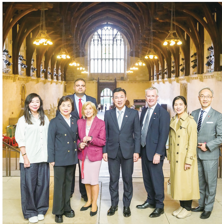
▲立法院副院長江啟臣 6 日率跨黨派立委訪問歐洲，10 日會晤多位英國國會議員。