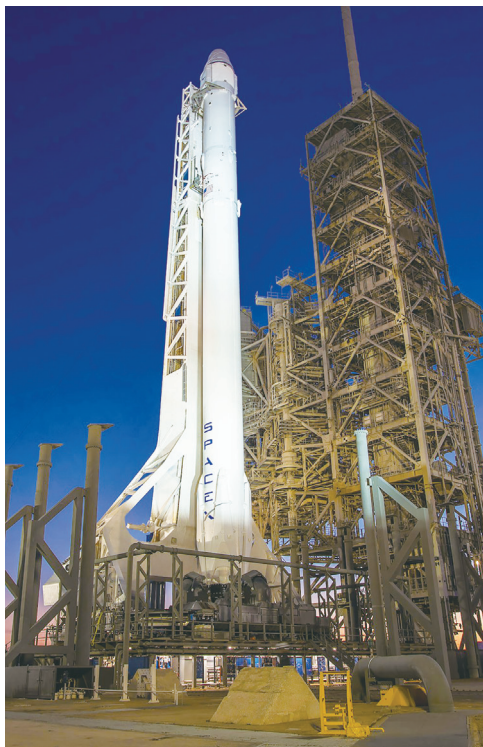
▲▼星艦將於德州當地時間下午6時30分(台北時間25日上午7時30分)，從SpaceX位於德州南部的太空港「星際基地」升空，進行第10次飛行。

2025年迄今3次試飛的火箭上段均以爆炸告終，兩次是在加勒比海島嶼上空，一次是在進入太空後。今年6月，在地面進行「靜態點火」測試時，另一枚上段火箭也爆炸。