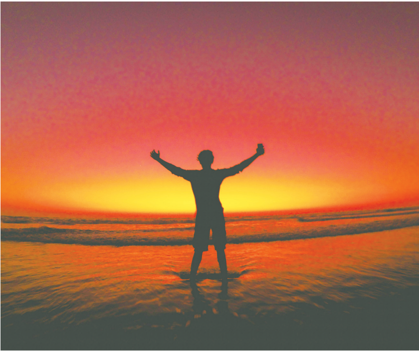
▲身為科學家，我一直都想找出「為什麼？」背後的答案，我覺得答案應該可以在童年找到。（網路截圖）

我們處於自我中心的狀態時，我們將自己視為宇宙的核心，人際關係對我們而言是單向的。我們會對他人產生影響，但他人對我們產生影響的力度不大，因為我們不會將他