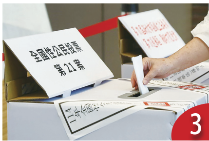
核三公投未過 沒核電難穩定供電