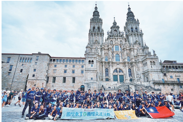
▲新竹市光武國中師生歷時16天完成西班牙國際走讀與主題學習，走訪多個歷史名城。圖為師生在聖地牙哥主教座堂前合影。