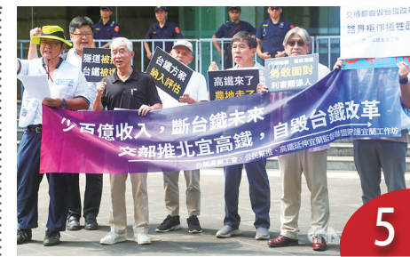
高鐵路、台鐵如何整合與轉型營運？