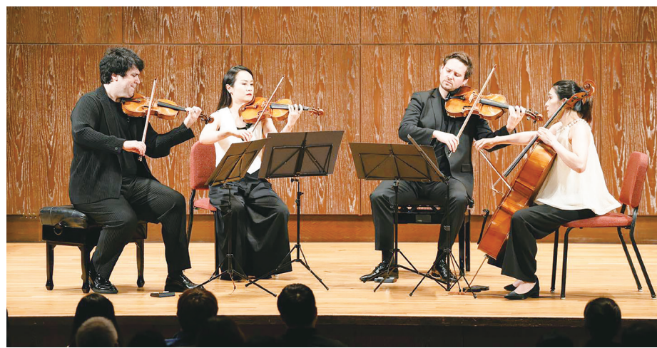
▲企圖心旺盛的4位樂手，果然竭盡全力，讓精彩火花四射。

合作又對抗，時而鏖鏘激動，有如生命的宣洩與吶喊，也見低吟哀嘆，綿綿愁思無盡頭，令人動容。