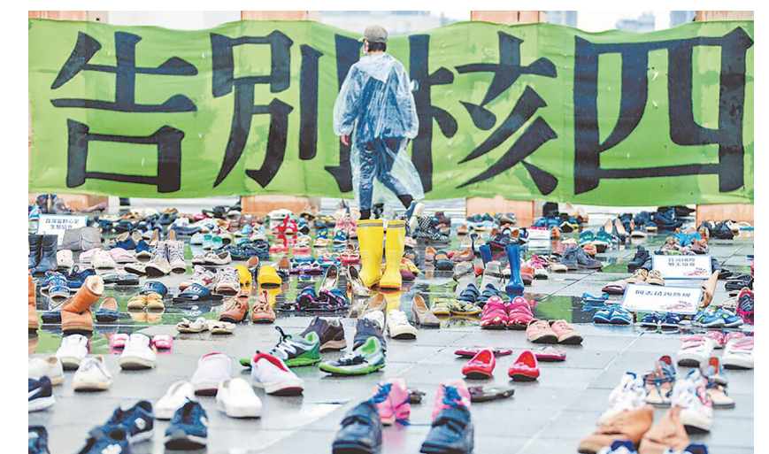
▲歷年幾次與核能有關的全國性公投，宛如狗吠火車，即使通過了政府也不執行。

【本報記者章文分析報導】公投核三延役是投心酸的？回顧在雙北的 2 次核四公投，都是因為沒有《公投法》而無實質影響力；等《公投法》上路後，2 次與核能有關的全國性公投，其中「以核養綠」公投要求廢除《電業法》中 2025 非核家園年限，獲 589 萬同意票通過，蔡政府卻全未改變能源政策，民眾投核電都宛如狗吠火車。