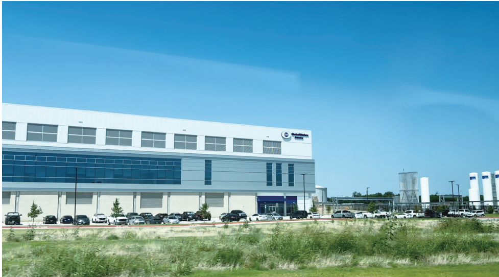
▲半導體晶圓大廠環球晶(GlobalWafers)美國新廠今年5月在美國德州北部謝爾曼(Sherman)開幕。