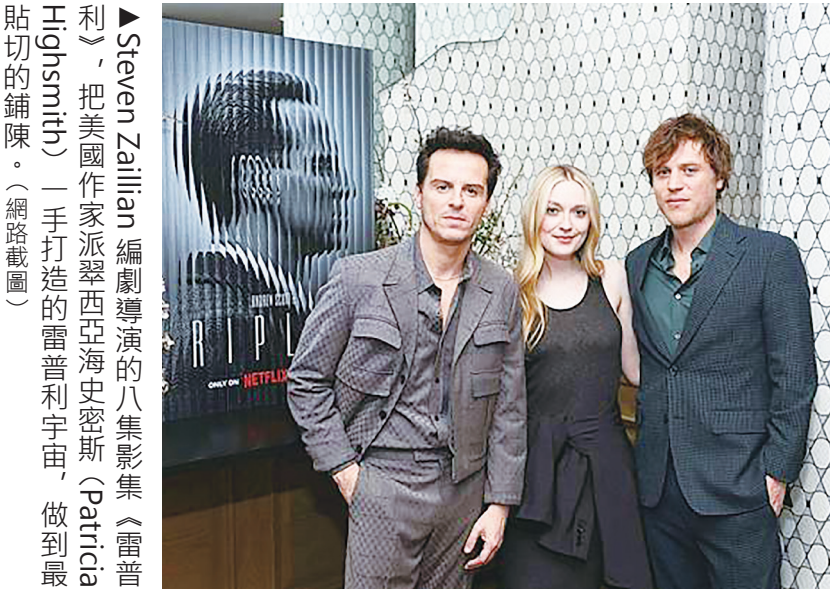
▲ Steven Zaillian 編劇導演的八集影集《雷普利》，把美國作家派翠西亞海史密斯 (Patricia Highsmith) 一手打造的雷普利宇宙，做到最貼切的鋪陳。

攝影師 Robert Elswit 的選景與構圖，讓每個畫面都美的像幅畫，不論是戲劇欣賞或城市行銷都居功厥偉。就罪惡懸疑而言，Steven Zaillian 編劇導演的八集影