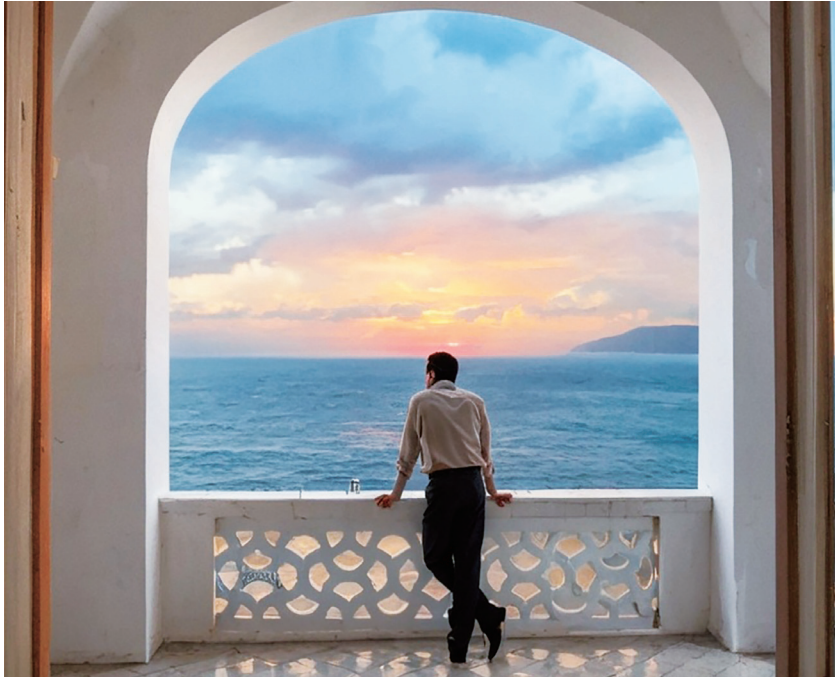
▲ 攝影師 Robert Elswit 的選景與構圖，讓每個畫面都美的像幅畫，不論是戲劇欣賞或城市行銷都居功厥偉。