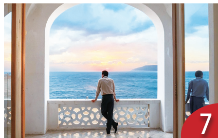
義大利風情畫 — 我看雷普利影集