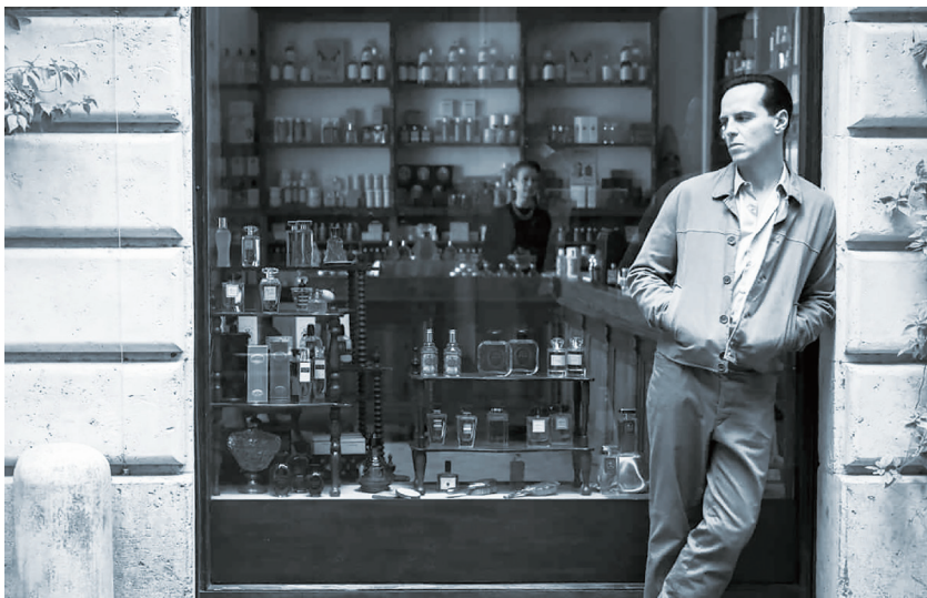
▲ 總共 8 集的迷你劇集《雷普利》，除了以黑白片的手法呈現，全片也無太多複雜的運鏡，大部份鏡頭都是靜靜地停留，如同一張張好看的黑白照片。（影集劇照）