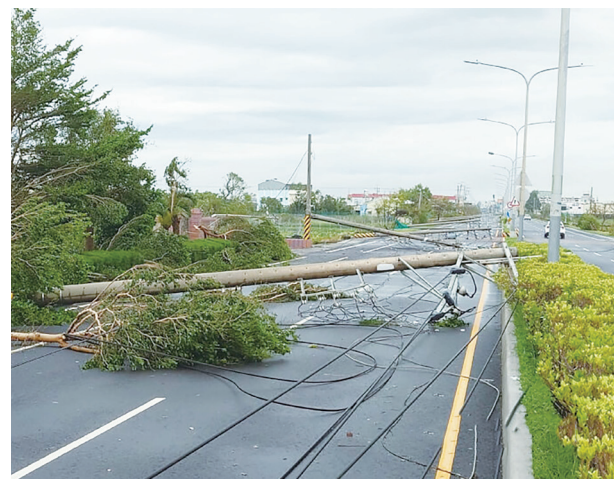
▲丹娜絲颱風造成南部嚴重災情，目前賑災善款已經至少 4.7 億元。

財團法人賑災基金會統計，截至 8 月 17 日止，丹娜絲風災募款專案總計接獲捐款近 2 萬 9000 筆，募得款項逾新台幣 4 億 7000 萬元；其中百萬以上捐款共計 85 筆，捐款逾 3 億 9000 萬元。