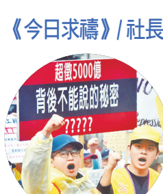
今日求禱 / 社長