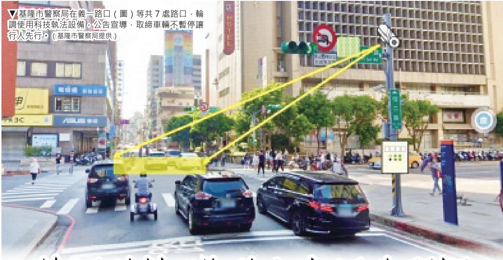
▼基隆市警察局在義一路口（圖）等共7處路口，輪調使用科技執法設備，公告宣導，取締車輛不暫停讓行人先行。