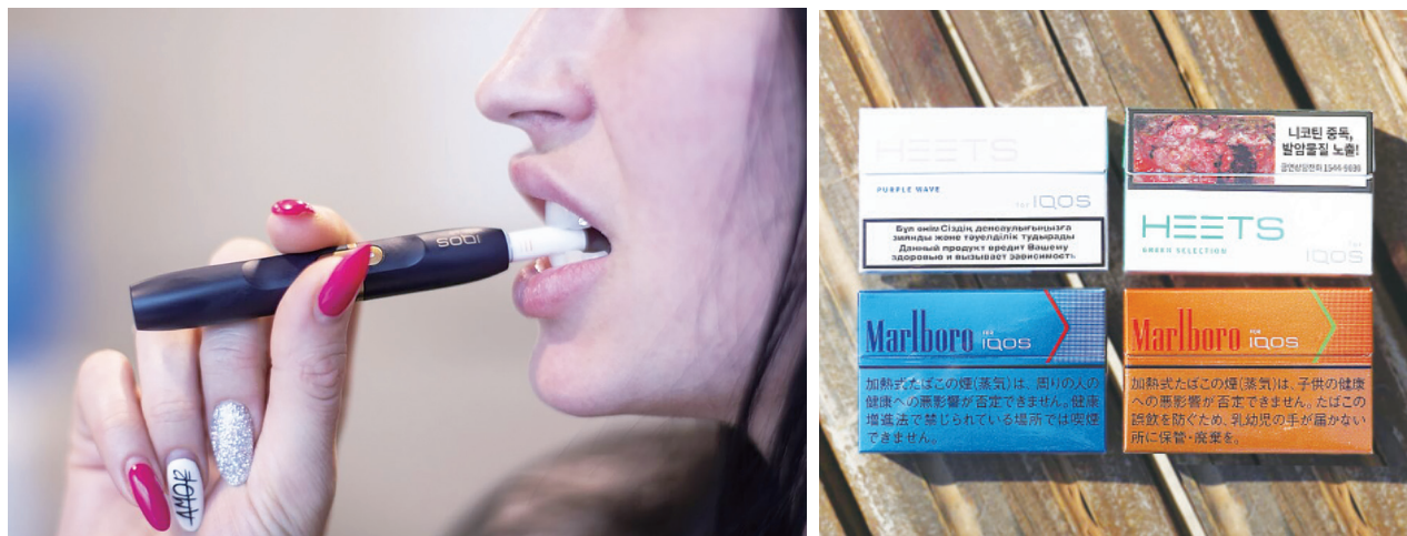
▲ 左圖為一名女性使用 IQOS 加熱菸，右圖為國外品牌加熱菸。

林清麗表示，任何菸品依《菸害防制法》規定，都不能在網路上販賣、廣告，但新型菸品加熱菸或電子煙，菸商都是採用同樣的行銷伎倆、廣告話術與通路販售吸引年輕人、迅速開拓市場。政府要保護下一代免於菸商的魅惑行銷。林清麗呼籲政府，必須將「衛生福利部電子煙查緝平臺」改為「衛生福利部新型菸品查緝平臺」同步確實監管，以防止對年輕人最有吸引力的新型菸品違法與擴大入侵。台灣醫界菸害防制聯盟秘書長郭斐然則指出，政府「有條件」通過加味的加熱菸是錯誤行為，有危害物質應該從嚴管理，呼籲以緊急命令暫緩加味加熱菸上市許可。