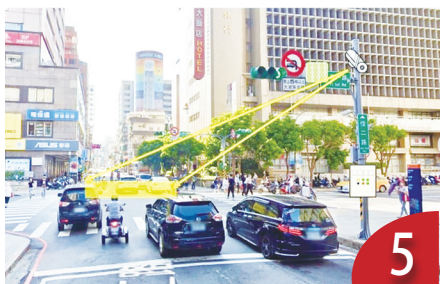
善用科技 導入人車用路習慣