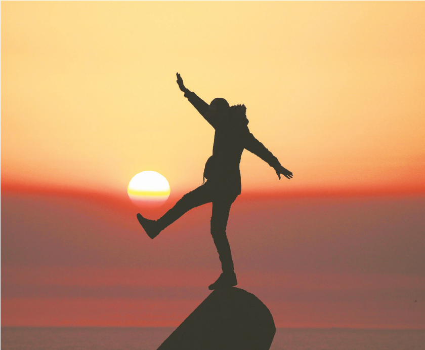
▲ 在人生的旅程中，有一個重要的時刻，那就是「折返點」。

不論是在筆記本上把它視覺化，這樣一來，以自己的價值觀為基礎，在收支失衡時，就能重新調整。尤其，我是愛操心的人，對於「萬一」這件事會比一般人加倍思考。