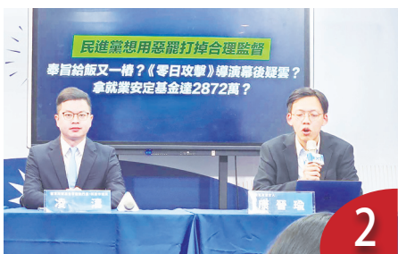
就安基金 5 千萬 零日拿一半？