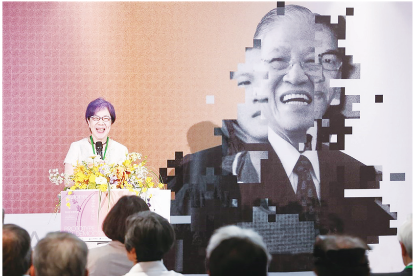
▲ 圖為「數位李登輝特展」開幕儀式。

李登輝基金會董事長李安妮 17 日表示，父親李登輝一生致力推動民主，這是他留給世人最深刻印記。然而，較少人知道李登輝對人文藝術的熱愛與耕耘，尤其是對音樂懷抱著深厚情感，早在 1979 年擔任台北市長時，李登輝便策劃舉辦「台北市音樂季」，在當時引發熱