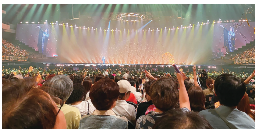
▲江蕙演唱會太受民眾歡迎，高朋滿座，場場爆滿，主辦單位很貼心，為民眾準備螢光棒，方便大家配合曲子的進行。

愛美，江蕙身材不差，精心設計的各式定製禮服，光鮮亮麗，她一套接一套地換裝，驚艷全場，讓人目不暇給。 現場效果 紅花綠葉 台北小巨蛋主場館座位數約為15,000席，江蕙演唱會太受民眾歡迎，高朋滿座，場場爆滿，主辦單位很貼心，為民眾準備螢光棒，方便大家配合曲子的進行，揮舞助興，果然搖曳生輝，全場熱鬧非凡。 為了該演唱會的 success，主辦單位不惜砸重金，讓聲光效果、舞台佈置，都在水準之上，現場樂隊、和聲伴唱，頗能發揮綠葉配鮮花的效果。 然而，目力所及，坐著密密麻麻的觀眾席間，大都是上了年紀的歐吉桑、歐巴桑。是歲月催人老，還是江蕙太資深了，她的歌聲，陪伴這一代人，從黑髮到白頭，更難能可貴的是，民眾對江蕙不棄不離，耐心等待她的復出，高度忠誠度，讓人嘖嘖稱奇。 大明星的高超魅力 根據媒體描述，江蕙這趟復出，一開金嗓就是23場，票房收入逾新台幣13億元，這種熱錢迅速入袋，是當代奇蹟，凸顯大明星的高超魅力，不同凡響，而流行歌曲市場大，消費威力強勁，純美術與古典音樂界，只能目瞪口呆，自嘆不如。 為了把餅做大，看來純藝術界，迫切需要走出「曲高和寡」的聖壇，向流行音樂界取經，尤其需要仔細研究天王天后的煉金術，好讓社會資源，雨露均沾，以改善生存環境，重塑生機！