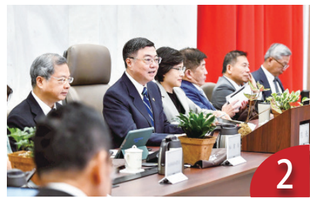
對美談判原則 政院允透明公開