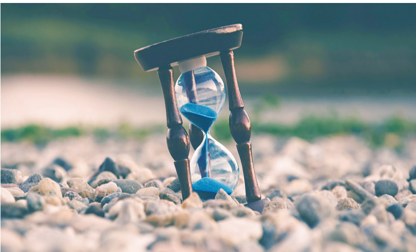
▲ 時間是世界上最公平的東西，每個人的一分鐘都一樣長，你無法用金錢買到時間，也無法跟別人借來使用，你只能將你的一分一秒做最好的利用。（網路截圖）

反之亦然。基本上對於將時間以「一小時」這種大單位來掌握的人而言，五分鐘或十分鐘算是「零數」。感覺上零數的時間好像什麼都無法做，便會將時間白白地浪費掉了。