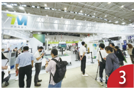
機器人展登場 聚焦 AI 機器應用