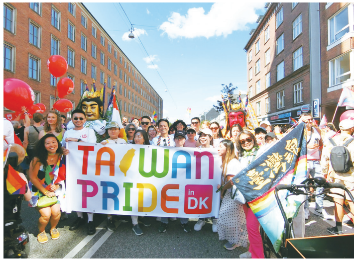
▲ 旅居丹麥的台灣僑民組「台灣隊」參與哥本哈根驕傲大遊行，讓世界看見台灣對人權與性別平權的重視。