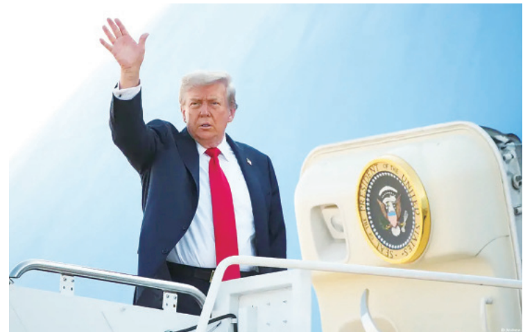
▲川普總統登上空軍一號前往阿拉斯加會晤俄羅斯總統普丁。（網路截圖）