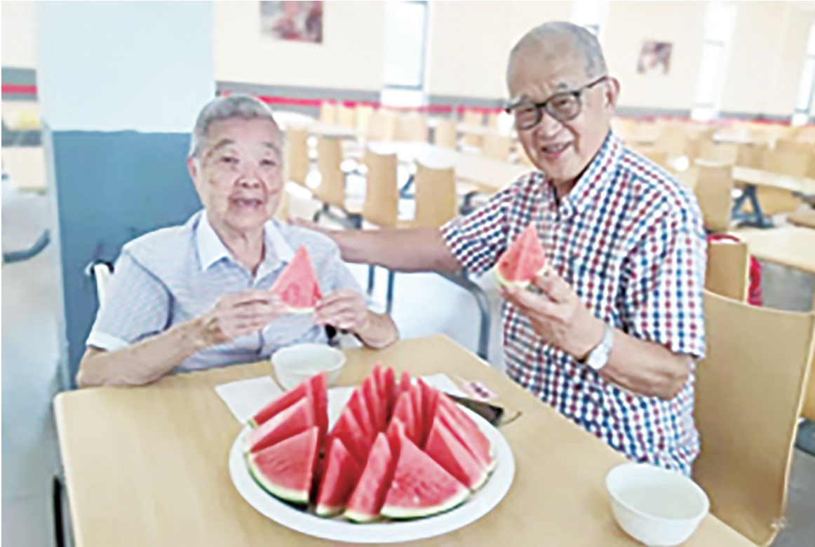
►真正恩愛的夫妻，雙方都會時時把對方擺在首位，好的都讓對方先享用。(網路截圖)

(本文由本報授權同步刊登於《中時電子報》、《風傳媒》、《優傳媒》與《遠見華人菁英論壇》等網站。)