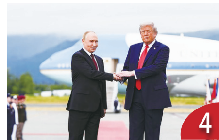
未達停戰協議 雙普會談令人失望