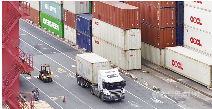
圖為高雄港區貨櫃車運載貨櫃出入。

公會指出，台灣機車外銷至日本、西班牙、義大利今年前 5 月的金額與年增率，分別為日本 8.58 億元、年增 132.9%；西班牙 4.08 億元、年增 115.5%；義大利 3.2 億元、年增 46.51%。