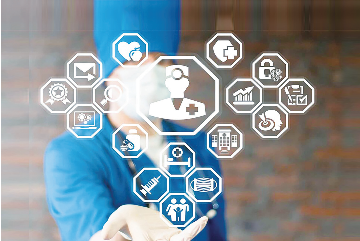
◀對於疾病，醫學上最高目標當然是根治，但要達此目標為「clear」的新詞。

醫學上，與 clear 很接近的字還有 cure(治癒)，前者用於公衛，後者用在治療。但二十世紀初美國醫師 Edward L. Trudeau 就曾感慨說，醫療是「有時治癒(cure)、常常緩解(relief)、總是安撫(comfort)」，雖然現代科技已比從前進步很多，但這句話過了一世紀依然適用，要什麼病都完全治癒或清零都只是理想。電腦軟體總是有蟲(bug)存在，需要經常更新，社會總是有壞人，世界總是有惡魔。姑息的說「和平共存」或許很鄉愿，但為要達到徹底的清零或治癒，我們將無法承受必須付出的慘痛代價。