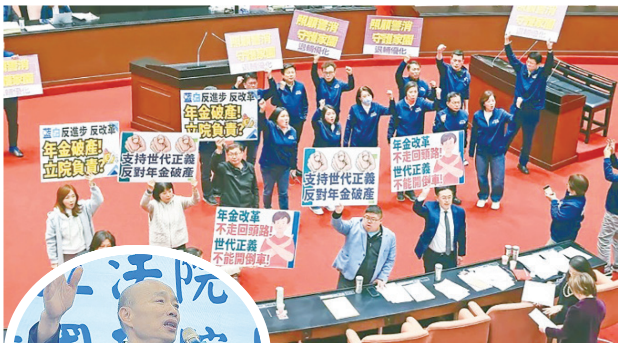
▲立法院年初表決警察人員人事條例時，國民黨立委高呼「照顧警消、守護家園」；民進黨立委則喊出「年金改革、不能倒退」，表達反對。

也有網友認為，「藍白立委全力合作定可成功，別再開公聽會了，拜託，那都是綠粉的拖延戰術，藍白要拿出魄力，不要讓支持者失望才對。」