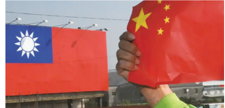
▲作者回憶起多年前中小學的課本，記憶中經常聽到的口號，包括「青天白日滿地紅的國旗，明年就會飄揚在我國首都南京的城牆上」等等。(網路截圖)

台灣年輕一代，已幾乎沒有。中國大陸是祖國或故鄉的感受，中國政府意圖從歷史觀點，強調台灣是中國一部分，必然需要面對年輕人根本不認同的抗拒。 但反過來說，兩岸政府多年前因政權爭奪結下的樑子，隨著時移勢遷、老成凋零，年輕人彼此間，已少有「敵我意識」存在，也是無可否認的事實。 規範與文化迥異，將使對岸的統戰完全失效，但長年的和平，彼此未曾結仇交怨，這方設計五花八門的認知提防，也根本激不起任何抗敵士氣。 兩岸有什麼理由，非要兵戎相見不可？