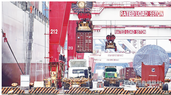
▲圖為高雄港貨櫃車正在裝卸貨櫃。

機械公會公布台灣7月機械出口值27.93億美元，較2024年7月出口24.64億美元，成長13.4%。若以新台幣計算約815.29億元，年增1.8%。