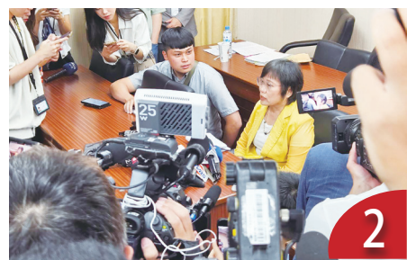
2 行政區劃法 立委盼設日出條款