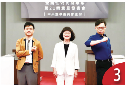
3 正方：反核即反美 反方憂核安