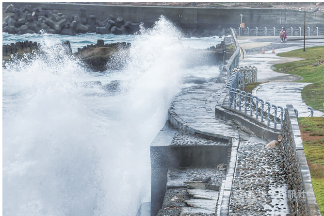
▲颱風楊柳預計12日將發布陸上警報，須注意強風、豪雨。

台灣颱風論壇指出，太平洋高氣壓很穩定的推著楊柳前進，預估颱風將在周三（13日）中午到夜間間穿越台灣上空，登陸地點稍微往南修正至「台東—花蓮」間，隨著持續往西移動受惠於高海溫、逐漸獲得水氣支援有利條件下，有機會進一步增強為中度颱風，提醒民眾儘早做好防颱準備。