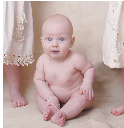
▲信仰以及經濟條件等因素，都讓美國人越來越不想生育。

對此，猶他大學社會學教授沃芬格指出，宗教與生育之間的關聯性不僅在於宗教的價值觀，還包括實際影響生活，包括尋找伴侶與生兒育女等行為，他表示，「一神教的信仰將家庭與生育視為其重要教義，而且信仰影響家庭行為是透過身體力行，而非只是口頭說說而已。」