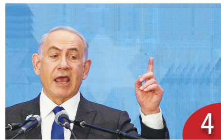
4 安理會齊批以 納坦雅胡堅持己見