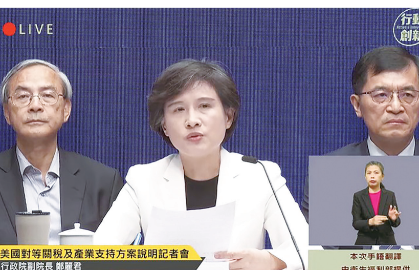
▲ 行政院談判團隊 11 日召開記者會表示，工具機、鬼頭刀與蘭花等產業會在對等關稅中影響較大，未來會協助轉型、並提供廠商關稅資訊，以利廠商調整。（直播截圖）

【本報記者呂翔禾台北報導】「初步預估工具機恐面臨日本與德國競爭，政府會協助業者開發非美國市場！」行政院秘書長龔明鑫 11 日於臨時記者會上表示，其他產業雖然影響較有限，但政府也會提出支持方案；行政院副院長鄭麗君也說，台、美還在談判中，未來會設有線上專區，將競爭國關稅比較、原始稅率、對等稅率等資訊整理，讓廠商有參考依據。