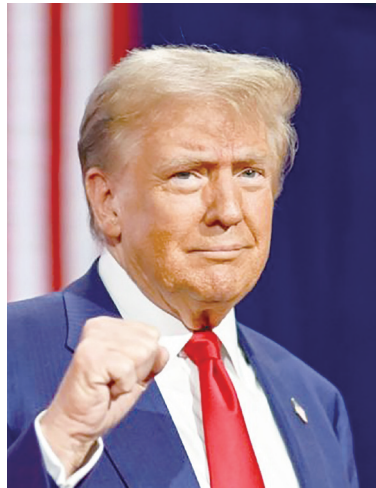
▲美國總統川普(左)表示，協議可能涉及「有利於雙方的某種領土交換」。而澤倫斯基(右)和他歐洲盟友認為，這只會助長俄國的侵略行為。中為俄羅斯總統普丁。(網路截圖)

目前還不清楚舍夫寧官邸會議是否取得任何共識，但澤倫斯基說這場會議具有建設性。他先前拒絕任何領土讓步之舉，並說「烏克蘭不會把土地交給占領者。」