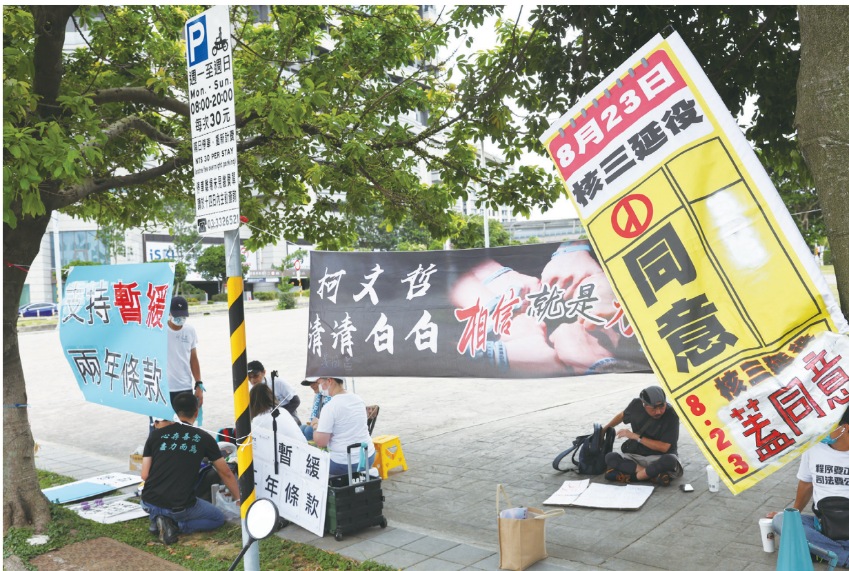
▲民眾黨 10 日上午在桃園舉行第 3 屆第 2 次黨代表大會，支持者在會場外掛「支持暫緩兩年條款」、「823 同意核三延役」等標語表達立場。

黃國昌表示，柯文哲愛才惜才，對黨內夥伴、同志永遠都是最寬厚地對待。柯文哲對於徐瑞希在外的言行非常寬宏、忍讓，不過徐瑞希既已公開宣布退黨，就尊重徐瑞希的決定。