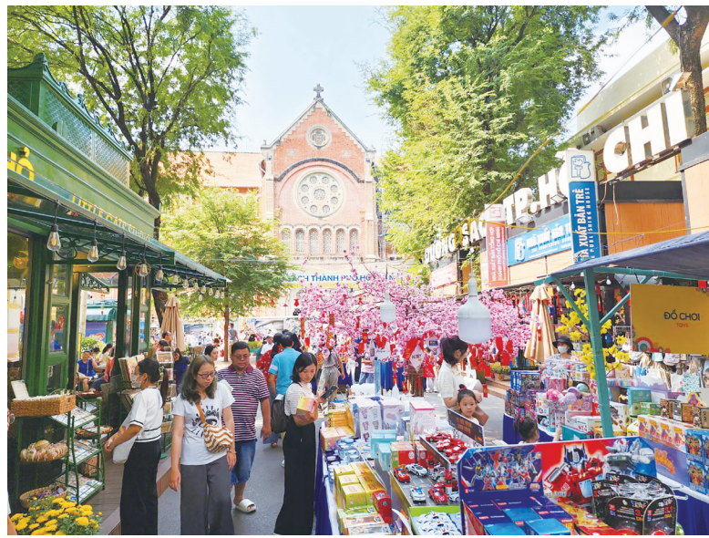
▲越南胡志明市書街，鄰近胡志明市聖母大教堂。充滿書香氣息，也經常舉辦藝文活動，為胡志明市重要文化地標。