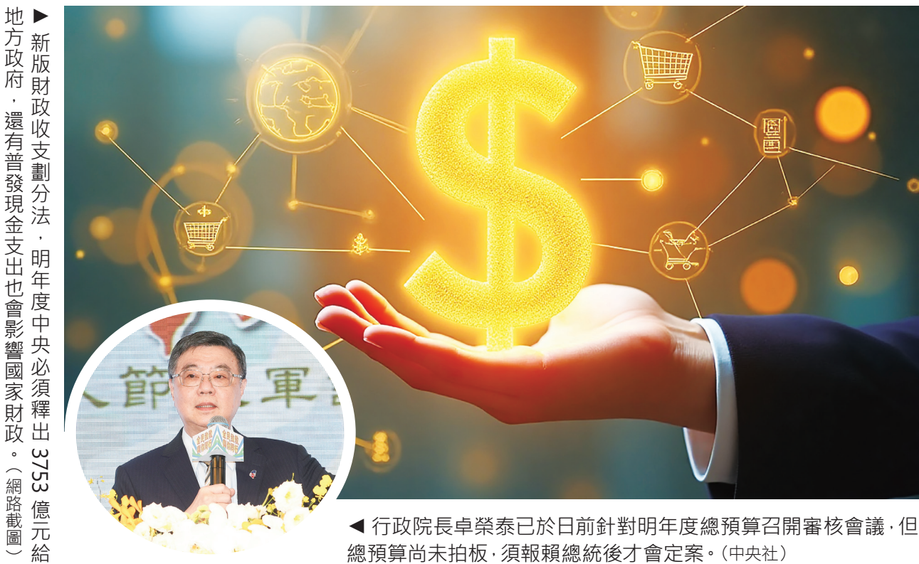
▶新版財政收支劃分法，明年度中央必須釋出3753億元給地方政府，還有普發現金支出也會影響國家財政。（網路截圖）

由於新版財政收支劃分法中央須釋出3753億給地方政府，國防預算又須達GDP之3%以上，總預算如何編列引發關注。