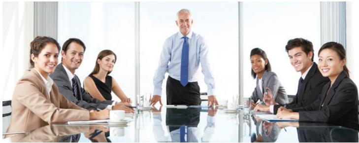
▲ 重要會議座次安排亂套、參與資源耗用龐大的計畫中，立場與地位認知偏頗等等，都可能造成「失之毫釐，差之千里」，讓人極感意外的慘慘結果。（網路截圖）

對絕大多數女士與可能佔比較少的男士來說，打理只有方寸大小的臉，使其保持得「美美的」，是比照顧身體其他器官還重要的事。所以「救命不如救醜」，為救命的醫療支出，遠遜於「寸土寸金」的整形美容，讓人感慨，但也無可奈何。