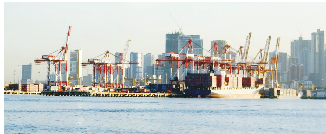
▲ 美國向菲律賓開徵的關稅稅率 19% 高於 4 月初訂的 17%，稅率不降反升，部分以美國為主要市場的出口導向台商，開始節省人力成本、轉戰菲律賓內需市場。圖為馬尼拉貨櫃碼頭。