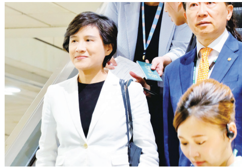
◀行政院副院長鄭麗君（左1）3日清晨搭機返台，她表示，「一談談判還要繼續努力，爭取更好的會繼續進行，我們會繼續努力。」