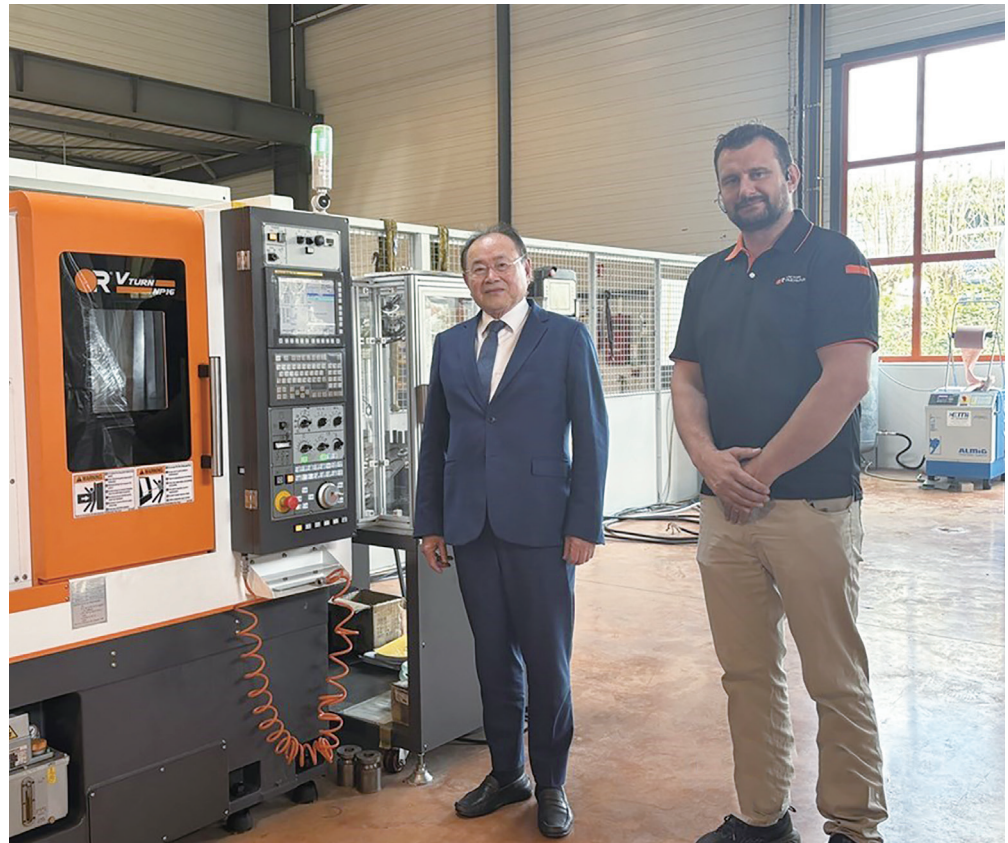
▲ 歐盟輸美產品關稅降至 15%，儘管重要細節還在進行談判，但可預期性重新回歸。

面對可能加劇的競爭，蔡國泰等歐洲台商因應的對策包括轉主打販售「高階產品」以增加利潤，開發重點在於提升「技術服務」。他說，「我們不會考慮去競爭價錢，會從提高品質、機器功能性與加強服務方面努力」。