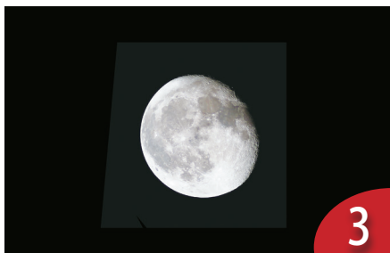
登月台不缺席 儀器 28 年升空