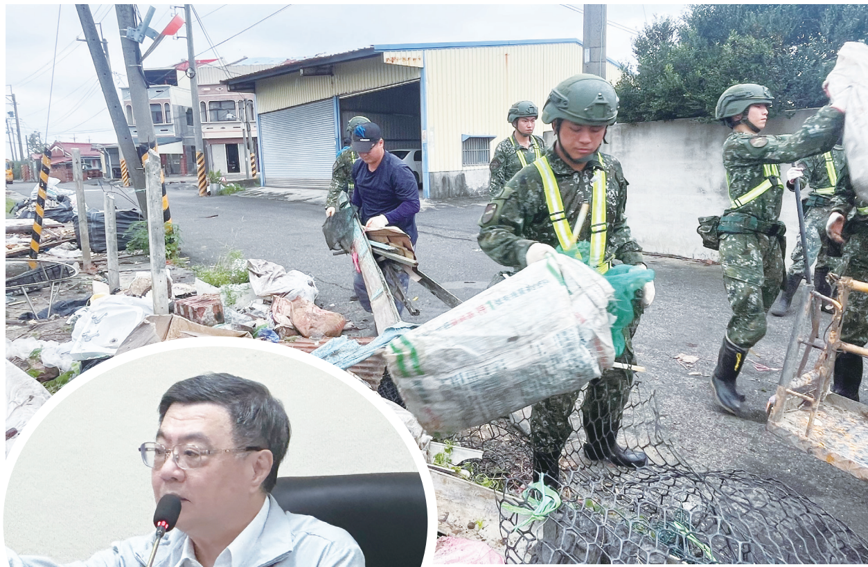
▲政院人士表示，近年中國不斷在區域持續擴張、意圖挑戰現狀，並以灰色地帶對區域各國侵擾，破壞區域乃至全球的和平與穩定現狀，因此，強化國土安全韌性已是台灣的全民共識，也是迫在眉睫的重要工程。（中央社）

►為因應美國對等關稅新政，行政院長卓榮泰1日主持會議時要求，一週內編列韌性特別預算送立法院審議，且須符合產業和勞工第一線的實際需求。（中央社）