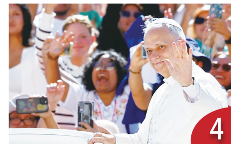
青年湧羅馬 教宗掀信仰熱情