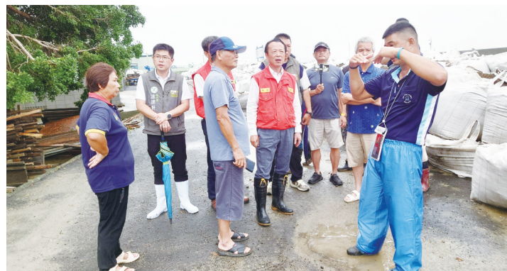
▲嘉義縣長翁章梁（中）3日上午視察朴子市竹村里鴨母寮排水堤岸臨時堆置沙包防洪情況，並聽取當地民眾防洪意見。