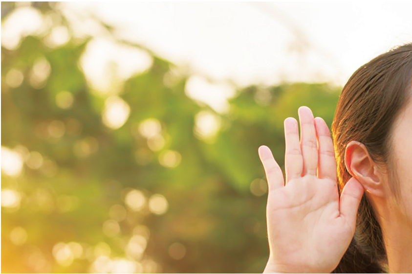
▲好的傾聽不僅是專心聆聽而已，還包括瞭解自己是哪一種傾聽類型，並涉及如何回應說話者。（網路截圖）