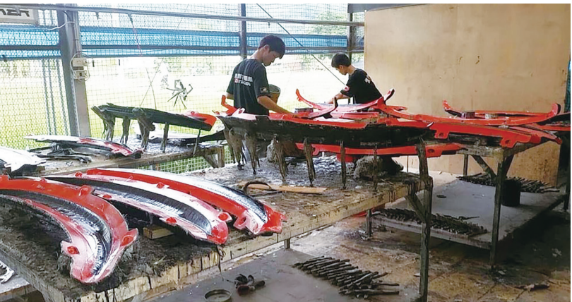
▲新竹市代理市長邱臣遠責成竹市府團隊聯繫桃園市、新竹縣與苗栗縣盡速開首長會議，跨縣市互相協助。圖為新竹縣1間外銷美國的汽車零件製造商工作情形。

產發處表示，邱臣遠已責成市府團隊持續關注，掌握中央政府因應方案，讓轄內企業有效掌握可運用資源，穩定當前產業運作，化挑戰為轉型契機，因應國際經貿變局的系統性衝擊。未來市府將透過產業座談會，主動邀企業了解應對需求並協助申請中央資源。