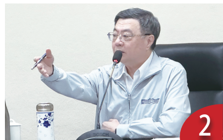
韌性特別條例修正 將朝野溝通