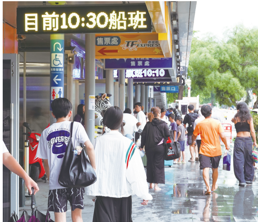
▲除了台北，這些離島目的地因其自然美景、悠閒生活步調以及深入當地文化的體驗，逐漸成為遊客長期旅行新選擇。

氣溫方面，中南部及花東高溫約 30～31 度，其他地區約 33～35 度。指出到 4 日前都受到西南風影響，雨勢仍明顯，周二起西南風逐漸減弱，高壓增強雨漸少。