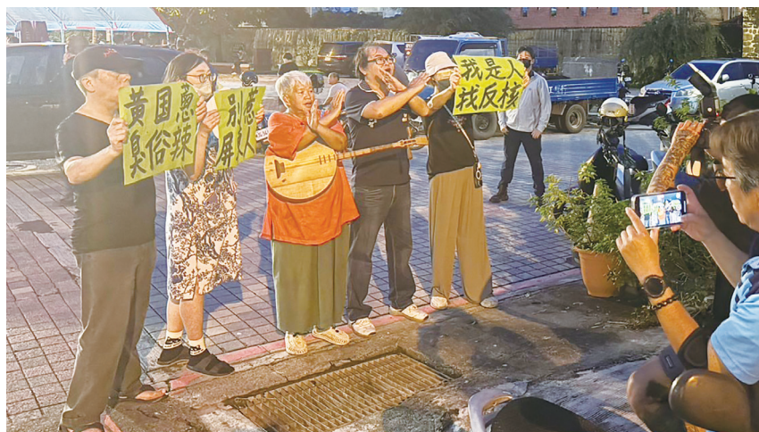
▲台灣民眾黨2日在屏東縣恆春鎮西門廣場舉辦核三廠延役公投說明會，場外則有反核人士高舉「別惹屏東人」等標語到場抗議。

【本報記者游清淵台北報導】民眾黨2日晚間在恆春鎮舉辦核三廠延役說明會，民眾黨主席黃國昌呼籲，23日公投台灣人民不要繼續為錯誤能源政策背書；場外則有反核人士高舉「別惹屏東人」標語抗議。