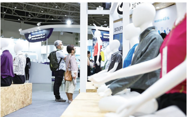
▲圖為民眾在紡織展觀看展出的衣飾展品。

川普關稅政策重要目的之一，是讓製造業回流，希望透過拉高關稅，迫使企業赴美投資、在當地生產。王健全表示，能去美國設廠的企業，大多基於4種條件，一是毛利率高，足以因應較高的生產成本，二