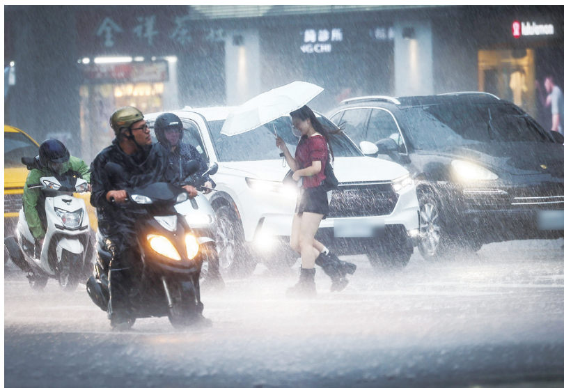
▲台灣受西南氣流持續影響，天氣相當不穩定，易有短延時強降雨，嘉義以南地區有陣雨或雷雨，台中至雲林地區及東南部山區有短暫陣雨或雷雨，並有大雨或局部豪雨發生。