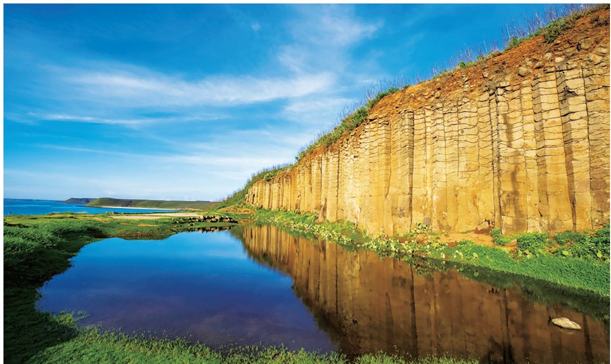
▲台灣的離島成為來自多個國家的旅客長期停留的熱門目的地，其中澎湖為來自香港、日本、菲律賓及新加坡旅客長期停留平均時間前 3 名城市之一。

Agoda 表示，南韓和泰國也持續受到喜愛，吸引許多旅客前往參與文化活動和美食冒險。越南的高性價比使其成為探索者的熱門選擇，香港則因為活動和娛樂項目的增多，穩居前 5 名。