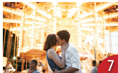
<醒小說> 過牆梯 (溫小平)