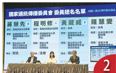
NCC 委員延宕 提名蔣榮先等四人