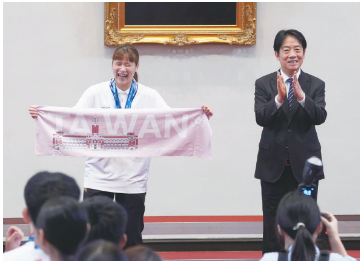
▲ 總統賴清德(右)31日在總統府接見「2025年第32屆萊茵魯爾夏季世界大學運動會代表團」選手、教練及隊職員，贈送紀念品給羽球混雙金牌選手楊筑宇(左)。