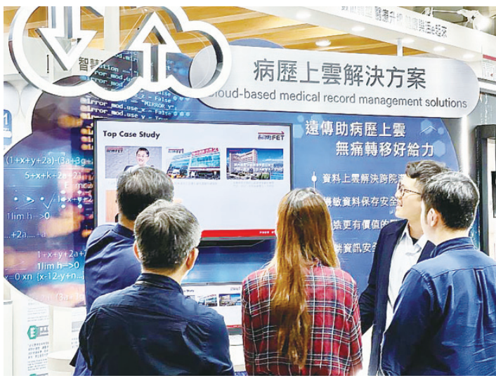
▲有沒有電腦的時代，看診都是使用紙本病歷，圖為病歷可上雲端。（中央社示意圖）

手寫病歷時代，某次遇到一位藥廠經理外國病人來到診間，當時的對話是：病人：「Please do me a favor！」，醫師：「What can I do for you？」，病人：「I need you do a『do』！」