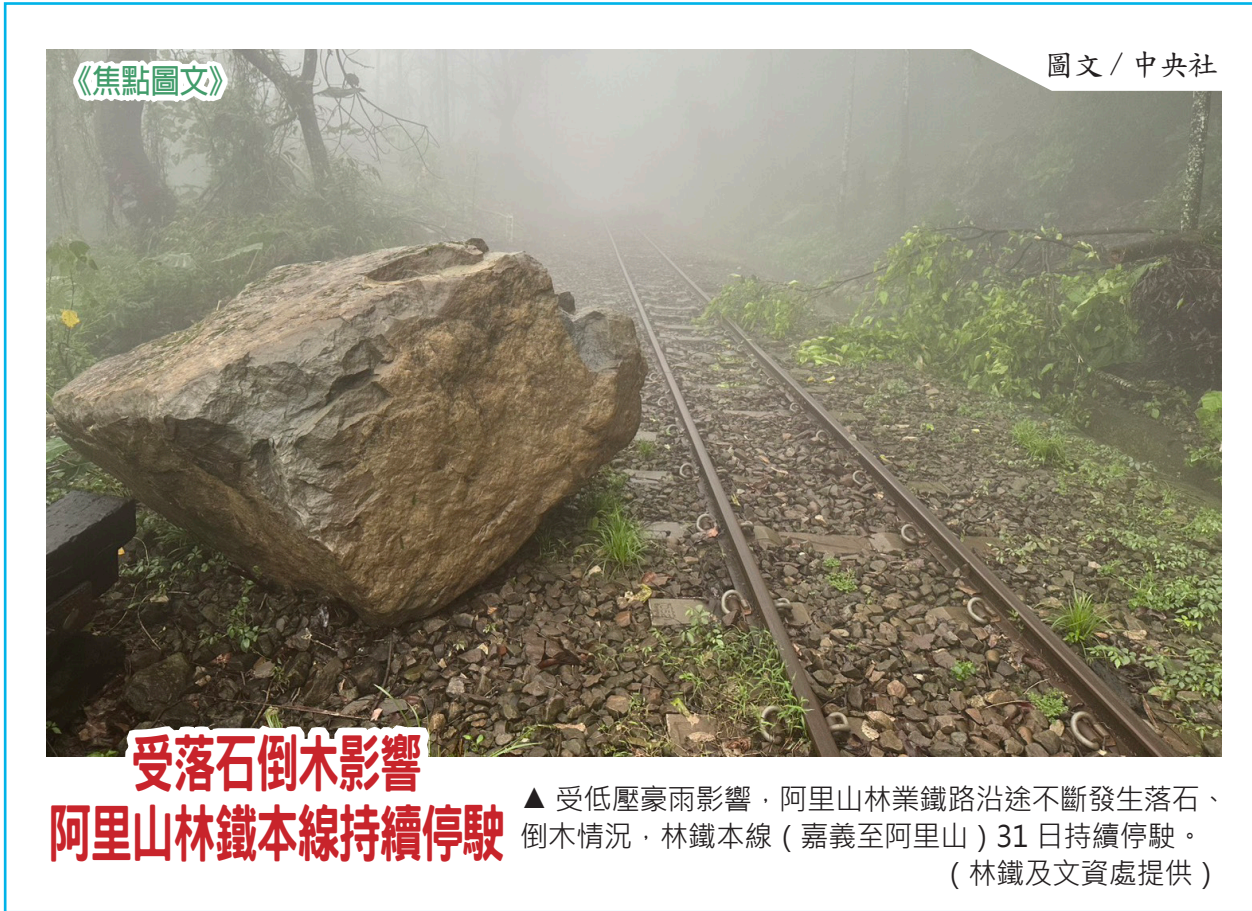
受落石倒木影響 阿里山林鐵本線持續停駛

調查方法上，由訪員進行的電腦輔助電話訪問方式（CATI），調查對象為設籍在全國 22 縣市，年滿 20 歲的民眾；抽樣設計上，住宅電話與行動電話雙架構抽樣，住宅電話以「等比分層隨機抽樣」後再進行隨機跳號處理，行動電話則依數位發展部公布的編碼字首進行後 5 碼隨機跳號處理。