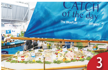
水產、加熱於開放 藍委疑美施壓