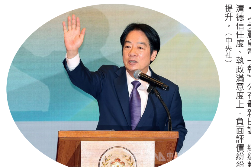
▲《美麗島電子報》公布最新民調，總統賴清德信任度、執政滿意度上，負面評價紛紛提升。

【本報記者余柏青綜合報導】賴總統滿意度雪崩式下滑！726 大罷免結果不如民進黨預期，賴清德總統的執政滿意度也同時重挫。親綠的美麗島電子報 31 日公布最新民調顯示，對賴總統的執政表現，「滿意度」從上個月 44.7%，下滑至本月剩 34.6%，再創新低，「不滿意度」則從上個月 46.8%，上升至本月達 56.6%，這也是賴總統上任來不滿意度的新高。