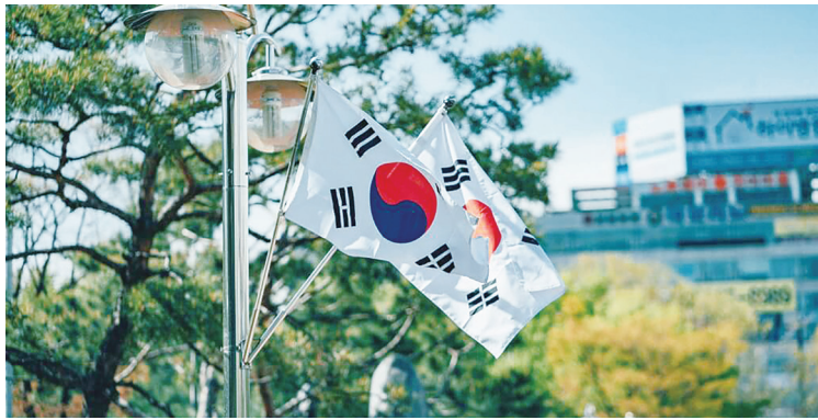
▲ 美國和韓國達成一項全面且完整的貿易協議，南韓將提供 3500 億美元用於他挑選的投資項目，並購買價值 1000 億美元的能源產品。(中央社)

美國近日陸續公布各國關稅，其中韓國原本面臨 25% 關稅，在韓國擴大協助美國造船、投資後降到 15%；印度原本關稅為 26%，但因為購買俄羅斯石油，美國總統