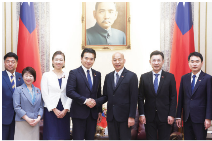
▲ 立法院長韓國瑜(右3)31日在立法院副院長江啟臣(右2)、民進黨立委陳冠廷(右1)等人陪同下，接見日本國民民主黨青年局長淺野哲眾議員一行，韓國瑜與淺野哲(左4)握手致意，誠摯表達歡迎。

【本報記者呂翔禾台北報導】「法務部修改死刑執行規則，違背 113 年憲判 8 嚴謹程序之精神，呼籲儘速改回過去規定！」廢死聯盟、人約盟等民團與 109 位法律學者 31 日表示，全球已經有 145 國實質廢除死刑，這才是國際多數，憲判 8 非常強調死刑執行的嚴謹性，但卻因法務部片面更改規定而鬆動，呼籲法務部儘速調整。