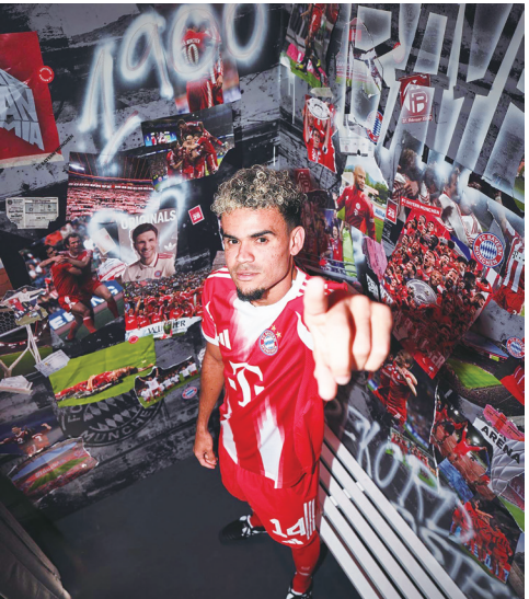
▲ 德甲豪門拜仁以 7500 萬歐元，買下英超豪門利物浦將邊鋒迪亞斯，成今夏第 16 樁高額引援。