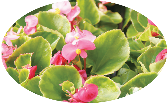
◀感情雖如海棠遭遇風襲，但他相信，他跟青梅竹馬的故事將會有不同的版本。（網路截圖）