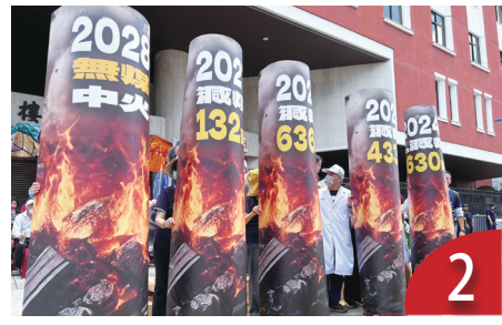
環團抗議 呼籲立院讓中火無煤