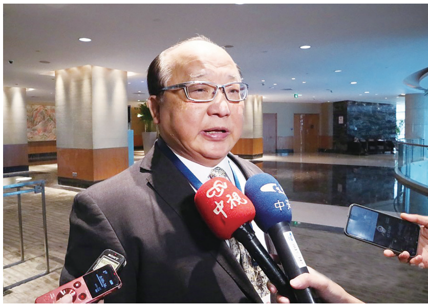
▲本書不僅忠實紀錄胡志強十三年市政生涯的關鍵抉擇與城市變革，也反映台灣地方政治與行政實踐中的制度與人性光影。

其實我自高中起有志於外交工作，如果將來有機會擔任大使、駐節一方，我就很滿足了。記得考大學時沒把握考上外交系，我還報考了軍法學校法律系，雖然也獲錄取，最後還是走上了外交之路。一路雖然稍有轉折，英國學成歸國時立志從事教職，其後還是走進了外交部部長室。