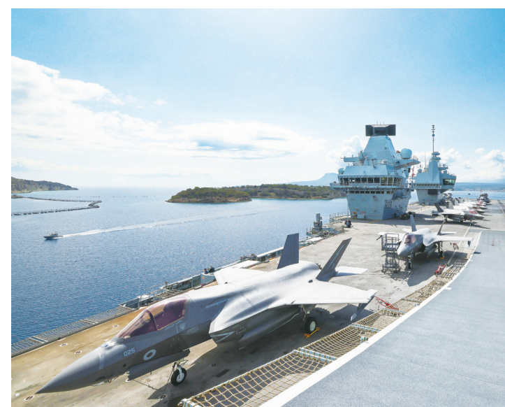
▲ 由英國最先進航空母艦「威爾斯親王號」領軍的艦隊打擊群，預計數週內進入印太區域水域。(英國國防部提供)

「CAR-T 細胞療法」透過基因改造自身細胞來消滅腫瘤，使得患者壽命延長機率達 40%。(Photo by National Cancer Institute on Unsplash under C.C License)