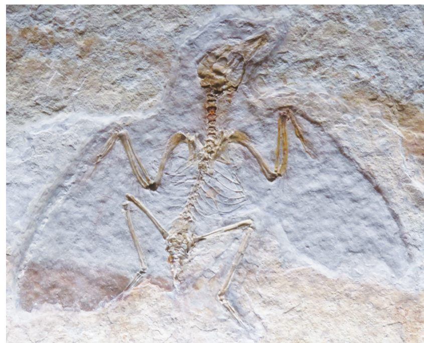
▲ 鳥類化石示意圖。阿拉斯加發現 50 多塊鳥類化石，將成為鳥類在極地築巢的最古老證據。