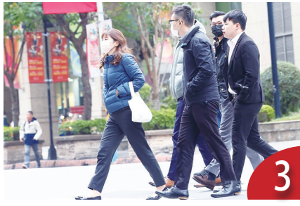
啟動退休準備年齡延至 39 歲