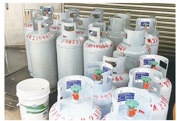
▲台灣中油公司宣布，6月分家庭用液化石油氣(桶裝瓦斯)價格皆不調整。

穩定物價政策，尚未調足的吸收金額達每公升新台幣15.6元，依公式計算結果，114年6月分液化石油氣每公升吸收金額縮小，但未回補的吸收金額每公升仍有13.4元，故114年6月分液化石油氣價格不調整，先回補部分吸收金額。