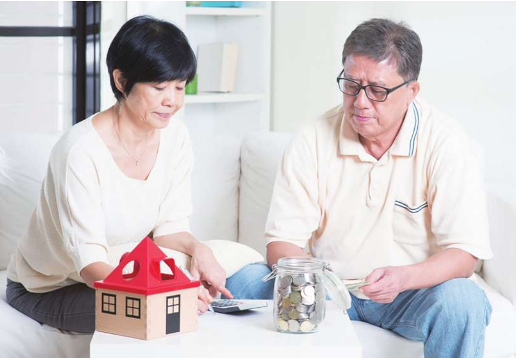
▲我們跟詐騙集團一樣，都希望父母能夠完全信任我們，然後穩定的、持續的跟著我們往某個目標走。（網路截圖）