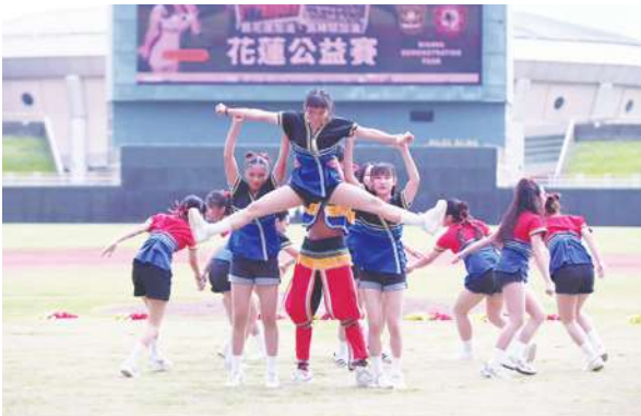
◀韓國明星棒球隊，不論是來欣賞比賽，或是來看樂天女孩啦啦隊，大家都度過了一個充滿陽光、盼望、開心的下午時光。

今天來看球的鄉親大約兩千多位左右。不論是來欣賞比賽、看韓國明星、或是來看樂天女孩啦啦隊，大家都度過了一個充滿陽光、盼望、開心的下午時光，重新迎接颱風過後新的挑戰。