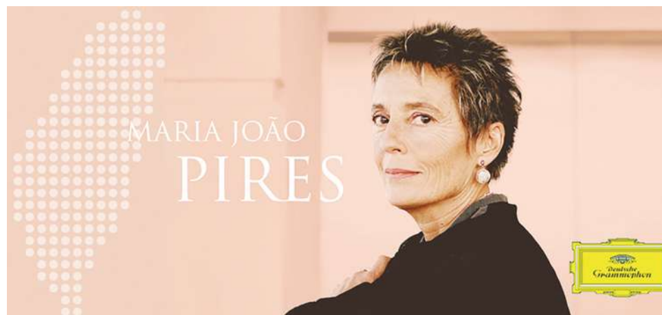
▲相較於上回在台北的貝多芬「震撼」，這次莫札特的演奏讓人從容聆聽，感覺是老去的優雅。

這是一場值得記在記憶最深處的音樂會，皮耶絲優雅地老去，但指尖仍然流露出珍貴的樂音。在如雷掌聲中，皮耶絲輕巧地安可了一曲，是我最愛的德布西第一首《阿拉貝斯克》（Arabesques），有什麼比這個更適合當整晚的結尾呢？