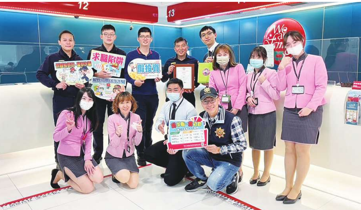
▲警政單位和銀行人員努力阻擋被害人匯款。