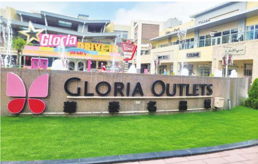
▲華泰名品城 2022 年以單店之姿擠入百億元俱樂部，也是唯一以單店營運衝上百億元的 OUTLET，營收達 103 億元，今年訂下 120 億元目標，力拚成長。（中央社）

有新光三越品牌招商力，總經理孫紹堃表示，30 至 49 歲客人占比約 66%，頗具消費力，「希望經營時髦的客人」，因此將打造時髦生活型態的專區，透過 Life Style（生活型態）與客人溝通，如設置高爾夫球專區、將運動品牌打造更齊全，持續導入輕奢品牌、餐飲優化等方向。