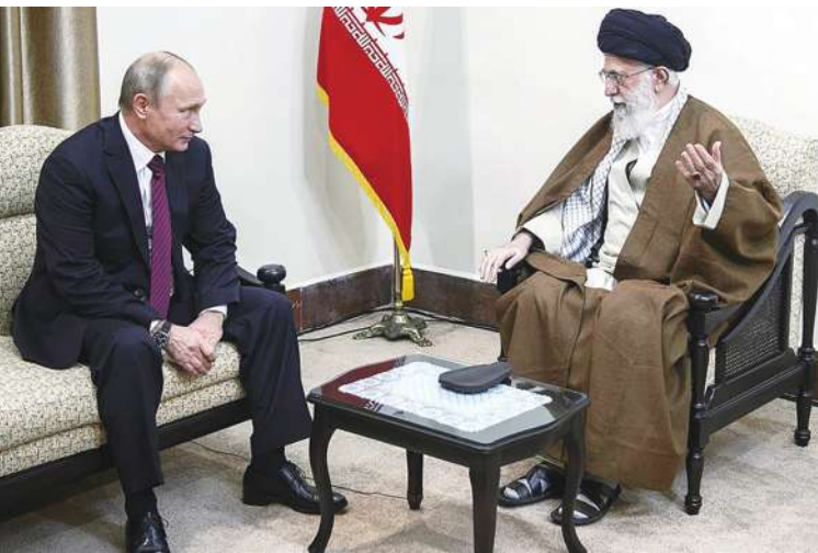
▲ 外媒分析俄羅斯如何看待中東衝突，是希望有衝突讓美國持續分心，但不希望戰爭擴大拖累自己。圖為普丁（左）與伊朗最高領袖哈米尼。

為俄烏戰爭與以色列問題分心，因此在中東保持混亂對俄羅斯還是有利，但不希望衝突擴大的前提下，俄羅斯也會透過伊朗要求真主黨行為克制。貝魯特學者雷瓦納指出，真主黨過去曾俘虜過蘇聯官員，因此與俄羅斯的關係並沒有想像中好，而且俄羅斯也介意真主黨在敘利亞的行動。 《CNN》提到，伊朗因為以色列將真主黨領袖納瑟納拉擊斃後，對以色列轟炸約180枚飛彈，但以色列仍持續對黎巴嫩進行攻擊，並揚言報復伊朗。目前戰況對真主黨不利，因組織與納瑟納拉可能的繼任者薩菲迪失去聯繫。以色列的空襲已造成至少1400人死亡、100萬黎巴嫩人流離失所。