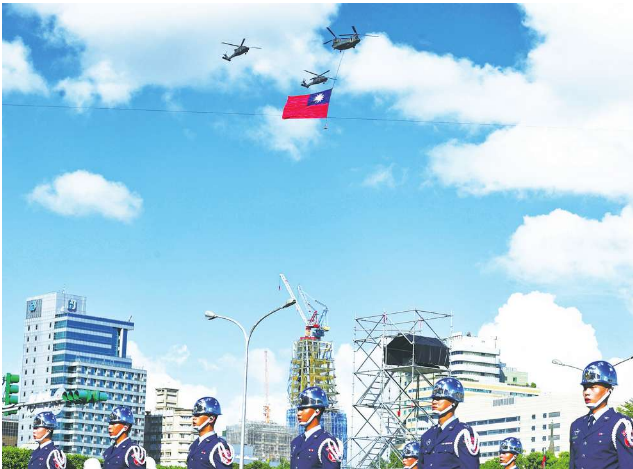
▲雙十國慶將至，國慶籌備委員會6日下午舉行預演活動，CH-47SD 契努克運輸直升機吊掛巨幅國旗飛越總統府前上空。（中央社）

在酷熱的凱達格蘭上，國慶日節目一一逼真預演。吸引了數千民眾扶老攜幼前來觀賞，演的、看的都揮汗如雨。