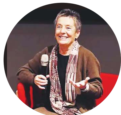
▲我能感受皮耶絲說的，演奏是「全身演奏」這件事，不是上半身，更不是手指在彈而已。（網路截圖）

皮耶絲 80 歲，沒有中場休息彈了一個半到兩個小時，體力、腦力都驚人（她曾說彈琴要思考）。考量之前她一度因健康因素取消亞洲音樂會，這次台灣演奏會特別不容易，國家音樂廳近乎爆滿。