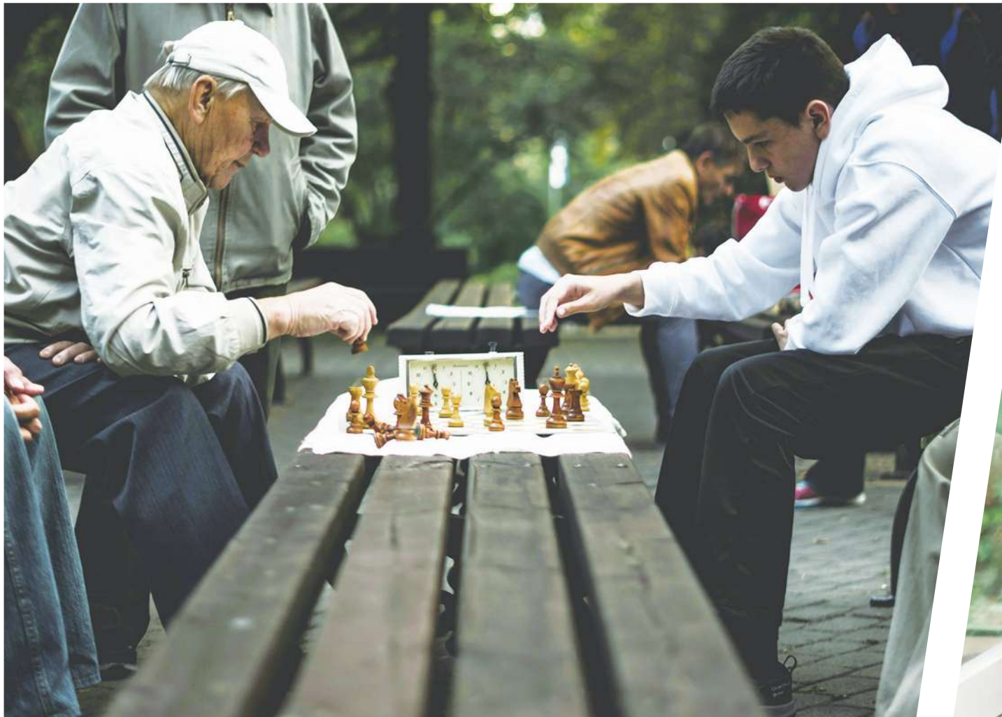
▲從某方面來說，我們跟詐騙集團一樣，都希望父母能夠完全信任我們，然後穩定的、持續的跟著我們往某個目標走。（網路截圖）

透過「向上教養」，我們可以幫助老年父母將接下來的人生過得更好，同時改善與父母的親子關係，讓彼此相處更少壓力。