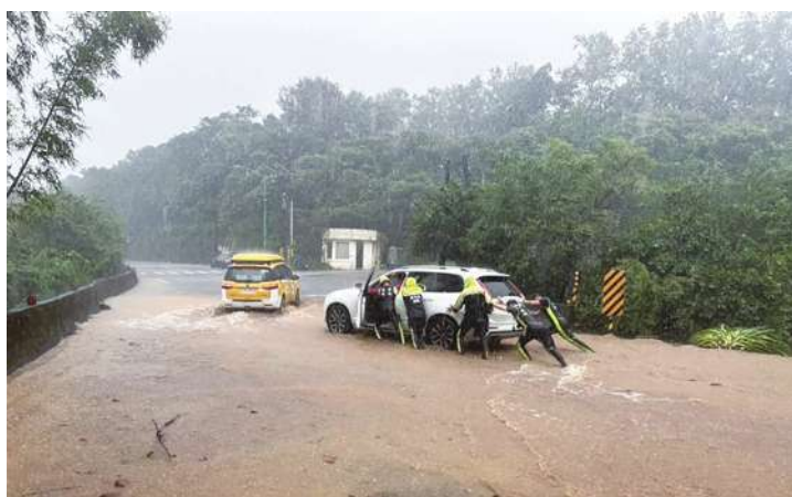
▲日前豪雨重創新北金山、萬里、石門、三芝淹水道路受阻。

【本報記者呂翔禾台北報導】「明年治水預算增加 159 億，盼立法院儘速通過預算，好強化萬里、金山治水能力！」總統賴清德 6 日一早在新北市長侯友宜、民進黨立委蘇巧慧與國民黨立委洪孟楷等人陪同下視察金山、萬里淹水的狀況。賴清德表示，若災民或攤商要更換因淹水而損壞的設備，可有節能最高補助 50 萬。賴清德表示，此區很久沒如此淹水，會與新北合作治水。