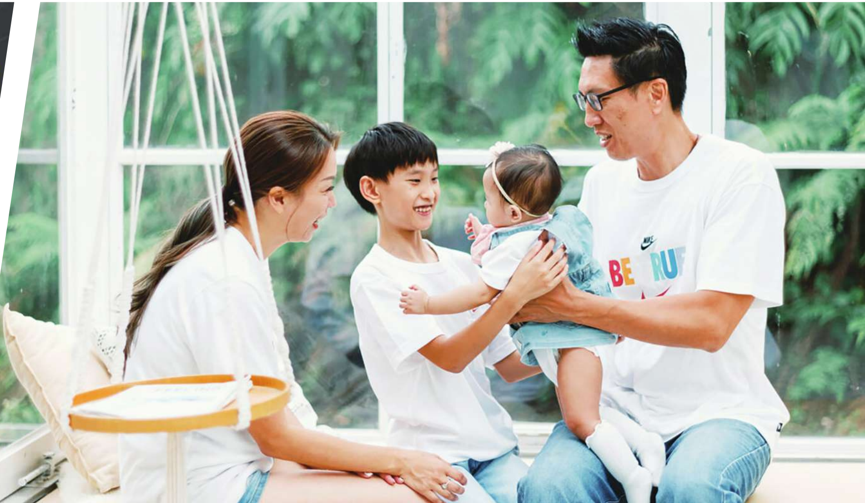
▲滿足家人情感需求，可以讓我們感受到人與人之間的連結，讓我們心中充滿愛，不會感到孤獨。

伴四歲小外甥的任務。 那時我停掉大部分工作，只留下幾個取消不了的課程和會議，因此白天總是能夠神清氣爽的迎接小孩到來，從早上八點就開始陪著精力充沛的小男生追趕跑跳碰。晚上等他媽把他領回家後，我還有精神逛逛網路、看看小說。