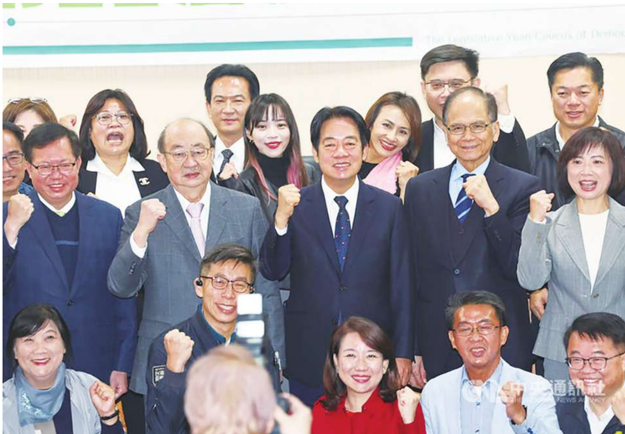
▲藍白希望行政院通過禁伐補償 50 億預算，但綠委堅持藍白主張不合理，看來總預算案解套還有段時日。

鍾佳濱質疑，難道這 50 億撥下來，在野黨就會放行整個總預算嗎？此外，退總預算也應該有一定程序，如今主計總處都尚未到立法院進行報告，「不是立委看看預算書，認為不合理就能擋，」鍾佳濱強調，應該經過質詢、審查等法定手段，否則以後都如此抵制即可，「每年都要審總預算，盼藍白能回歸理性討論，」鍾佳濱如此數說。