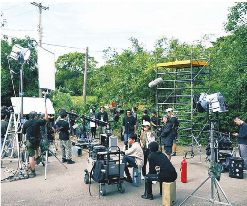
▲美國影視業在罷工後，面臨串流平台競爭，出現更蕭條的狀況。

美國電影的製片量更是減少40%，罷工加上串流平台崛起的影響，讓影視業重要的有線電視廣告收入銳減，而加州的高稅率也讓許多影視業選擇遷徙到稅率較低的地方，如洛杉磯等地方政府則在思考如何留住