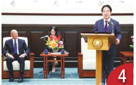
戰爭、和平繫於一念之間