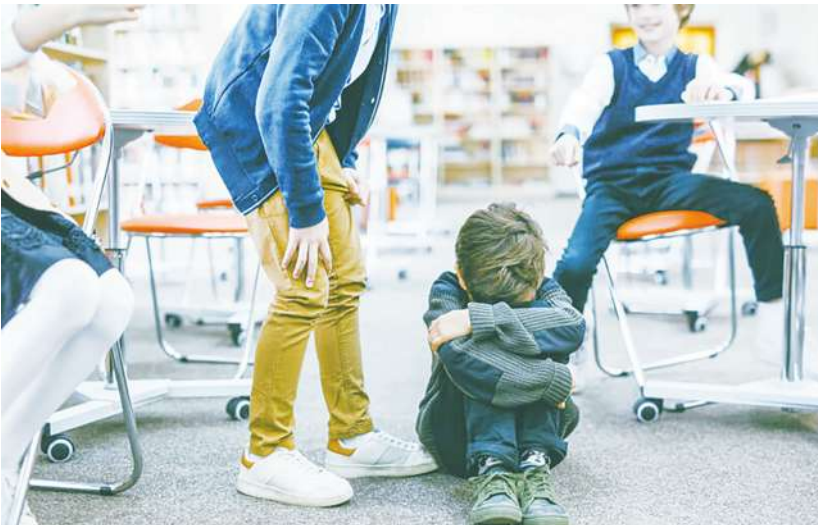
▲校園的學生間充滿霸凌，師生間關係緊張，學生家長跟老師間蠻橫對立。老師的管教因行政上級怕事而層層受限，動輒得咎。

只是，為人父母不可有主觀、專制、權威、易怒等激怒兒女的不當管教態度或行為，要照著信仰教訓及警戒，更要利用愛來養育兒女。