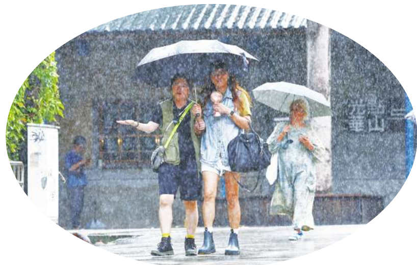
▲30 日桃園以北、南部將有降雨，基隆北海岸、東半部、恆春半島會有大雨或豪雨。圖為台北市中正區民眾撐傘降雨。

氣象署表示，颱風逐漸接近，先是強陣風逐漸增強，再來降雨會從東半部開始，北部也會增強，隨著颱風接近，中南部地區，尤其南部山區也會