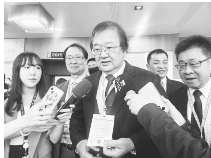
▲ 114 年診所護理師加薪財源未定，醫界呼籲健保總額持續編列，115 年比照醫院護理師由衛福部照護司公務預算扛起。

衛福部長邱泰源（中）29 日表示，不論是在醫院或基層，護理師加薪永遠是努力方向，護理師從業環境辛苦，支持醫療院所給護理人員更高待遇。