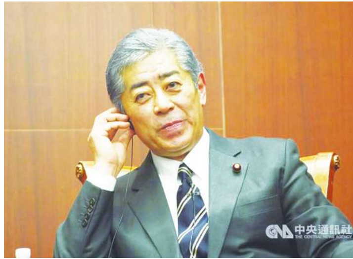
▲日媒報導，相關人士透露，10月1日將獲國會指名為日本新首相的自民黨新任總裁石破茂，正協調由67歲前防衛大臣岩屋毅擔任新內閣的外務大臣。

石破9月27日在自民黨總裁第二輪投票取得「逆轉勝」，當選自民黨第28任總裁。由於自民黨目前在參議院及眾議院掌握多數席次，預計石破將在10月1日召集的臨時國會上獲指名為第102任首相。新內閣預料也將在同日上路。