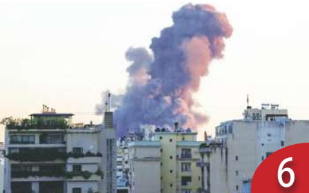
兩組織領袖遭以刺殺 伊朗難報復