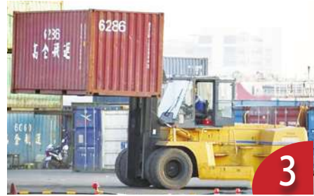
3 兩岸經貿不復以往 會逐漸脫鉤