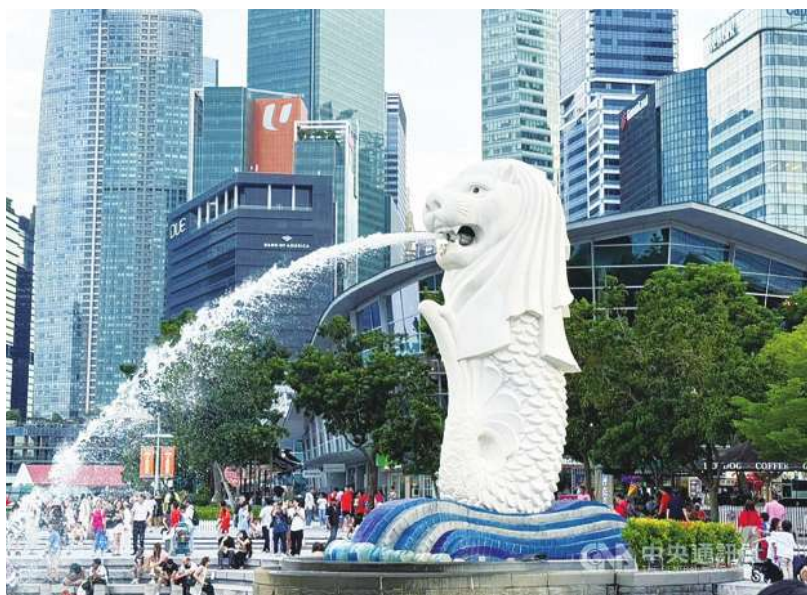
▲AI 人工智慧浪潮來襲、晶片需求旺盛，新加坡正準備擴大晶圓製造園區，以吸引更多半導體企業造訪。圖為新加坡知名地標魚尾獅雕像。(中央社)