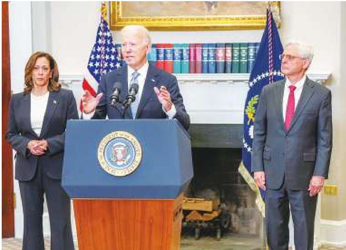
▲美國總統拜登在身體狀況受外界質疑時確診新冠肺炎，讓美國大選又多了不少變數。(POTUS via X)

針對國土署進行獨立調查，將確認為何川普13日在賓州出席競選活動時會遭到槍手刺殺，外界質疑特勤局在事前並未做好維安。川普在此次槍擊事件中雖未受傷，僅受耳部輕傷，但行兇的槍手身亡，同時造成1死2傷的悲劇。拜登在知悉川普遭遇刺殺攻擊時，曾第一時間發文譴責暴力，並要求重新檢視候選人的維安流程。美國眾議院國土安全委員會也發函要求國土署官員23日前出席聽證調查。同時也要調查中央情報局、聯邦調查局在情報掌握上是否失職。