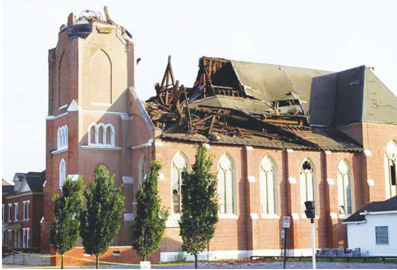
▲暴風雨席捲紐約州中部，威力強大足以吹動一架 B-52 轟炸機，一座 19 世紀教堂屋頂也被掀飛，並導致一名外出檢查古董車的男子喪生，目前仍有 3 萬 8000 戶無電可用。