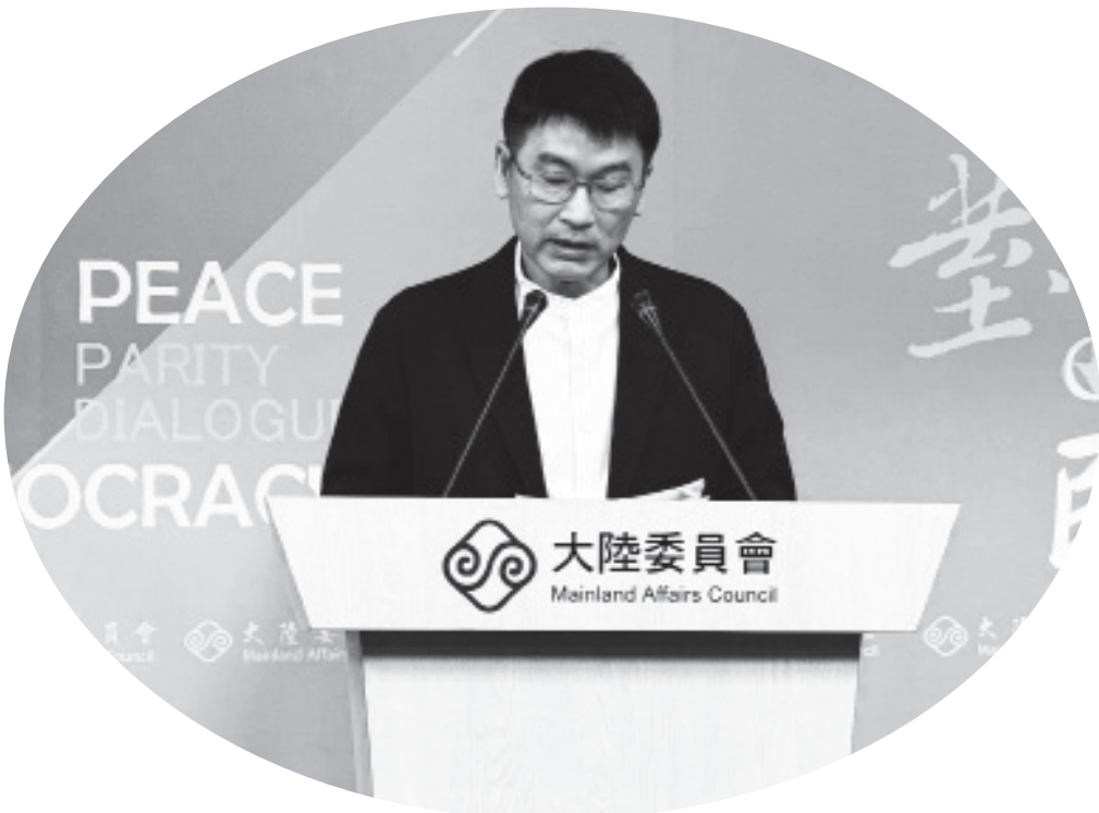
▲陸委會副主委梁文傑18日於例行記者會宣布，由副董事長許勝雄擔任海基會代理董事長。

他也指出，平潭航線風浪很大，遇到旅客訂票，卻無法出航，衍伸出消費爭議的問題，再加上旅客需求量並不大，所以還在考慮中，更否認「不開放平潭航線是基於國防安全」的說法。