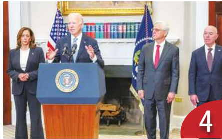
4 拜登確診增疑慮 查川普維安疏漏