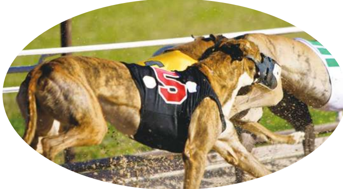
▲澳洲目前仍有最大的商業賽狗產業，2023 年營業額高達 56 億美金。

動保倡議人士指出，澳洲賽犬產業早於 2016 年就因為種種動物虐待的爭議而暫時中止，當時該產業有機會改善動物福利，但卻徹底失敗。她呼籲，政府仍應聆聽社區的聲音，全面禁止這個殘酷的產業。