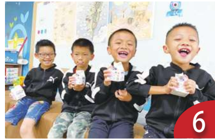
6 班班有鮮奶是產銷失衡例證