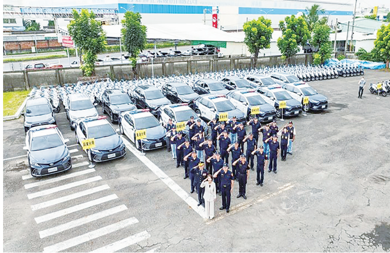
▲政府理應給予警察安全的執勤環境，提升警用車輛採購預算，保障員警執勤安全。

每位警察同仁皆是家庭及社會的重要支柱，由衷希望服勤員警皆能平安出門、安全返所，不要再響起「任務結束，一路好走」讓人心碎的聲音。