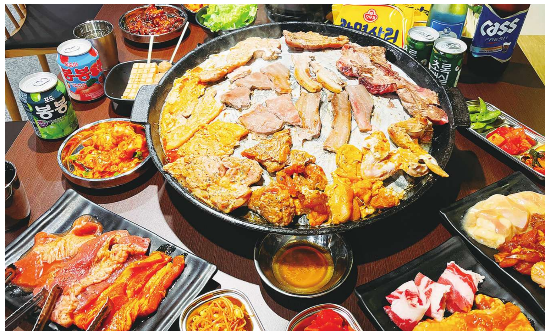
▲可以將韓式燒烤視為單純享受烤肉的方式，當作是一種文化，並非當作特定料理來看待。（網路截圖）

在餐桌間移動，並拉下天花板上的抽煙機，將之放置在靠近烤架的地方，以吸走煙霧。我帶著敬意觀賞她們以夾子和剪刀，熟練地翻轉和切割肉塊，彷彿那些工具就是自己身體的一部份。