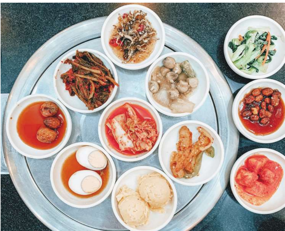
▲韓式小菜不只是韓國泡菜，還有韓國食材製作的涼拌海帶芽、韓式蛋捲，等都非常美味。

那些地方都是以特定菜餚而聞名的，通常都非常隱蔽，且不太引人注意。大多數人走過都不會多看一眼。小餐廳裡總是擠滿遊客，甘