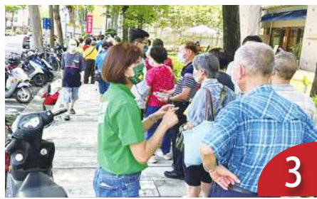
代排隊購物 各國都有商機