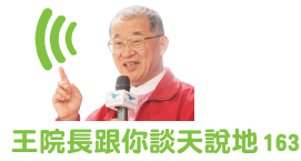
王院長跟你談天說地 163

(本文由本報授權同步刊登於《中時電子報》、《風傳媒》、《優傳媒》與《遠見華人菁英論壇》等網站。)