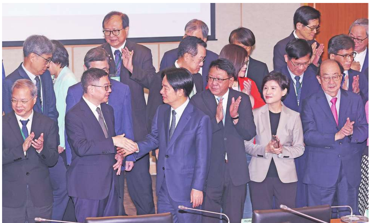
▲準總統賴清德（前左 3）雖交代新內閣要接地氣、積極與在野黨溝通，但目前民進黨立院黨團與內閣尚未展現如此氣度，外界恐難相信賴清德真心要溝通。圖為總統當選人賴清德、內定行政院長卓榮泰（前左 2）、內定副院長鄭麗君（前右 2）等新內閣成員。

如今，民進黨在總統與國會都是少數，即使執政，在國會若要通過法案，也必須要過藍白這關，可從近日國會改革、凍漲電價等議題來看，民進黨似乎仍未解過去行政、立法占多數的傲氣，但國會今非昔比，民進黨從官員到立委，是時候放下身段溝通，才有機會爭取更多民眾支持，否則自己認為的擇善固執，在外界看來不過是無理取鬧、徒增衝突。（相關新聞見 2 版）