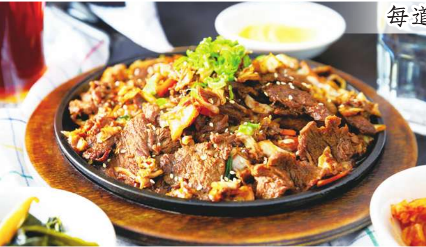
▼▲韓式燒烤的「肉」通常以兩種方式製備，而這取決於使用的部位——不是塗上濕潤的醬汁來嫩化並增添風味，就是簡單調味和醃製。

每道迷人的韓式料理之間散落著溫暖故事，這是一封母親送給女兒的情書，也是一冊關於移民與身分認同的書。