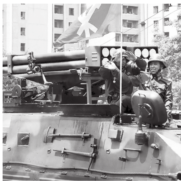
比俄軍常規飛彈差。

其實北韓自1980年就有對利比亞、敘利亞與伊朗出售飛彈，但當時被認為是轉售蘇聯的飛彈，其型號與性能都相對老舊，在去年10月哈馬斯襲擊以色列時，就有使用北韓出售的舊飛彈。但一月發現的北韓飛彈，性能已經提升不少，且CAR評估其性能可能不