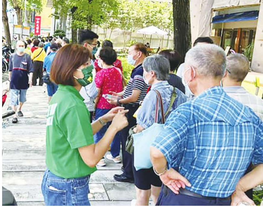
▲目前世界有許多地方出現專門代人排隊的職業，可以幫忙排隊買手機、掛號，甚至排熱門餐廳。

在英國的Task Rabbit和Bidvine網站廣告中都有幫民眾購物排隊的服務，每次收入