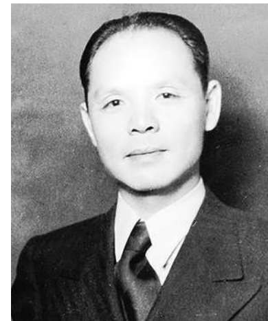
▲ 何鳳山大使的善行，大大的彰顯了人類崇尚公平正義的至高理想，為世人留下感人典範。(網路截圖)

園裡的石壁上刻著這些正義之士的芳名，並頒給「國際正義人士」(Righteous Among the Nations) 頭銜，其中最為世人知曉的，要數奧斯卡·辛德勒 (Oskar Schindler)，當時他以他經營的工廠需要工人為由，賄賂德軍，從集中營裡調了近千名的猶太人在工廠工作，從而使他們獲救。