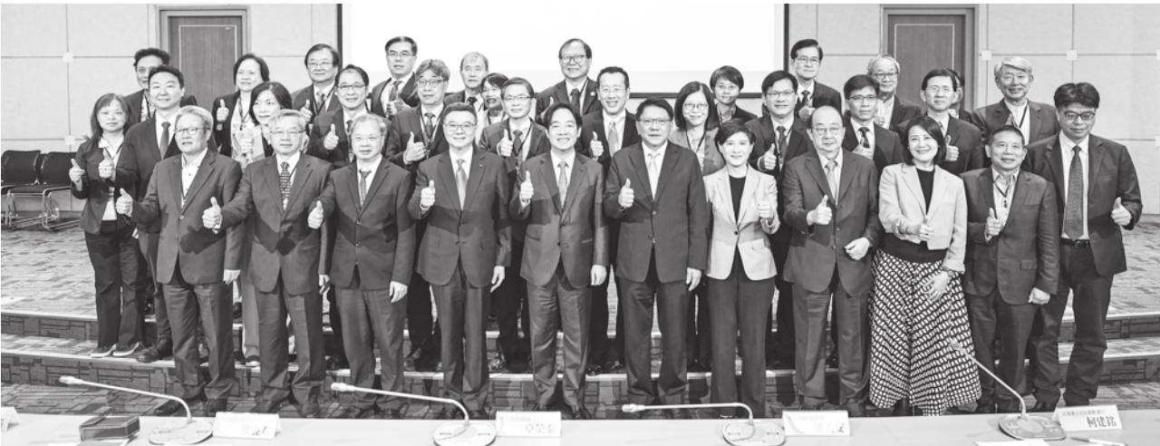
▲賴清德近日陸續公佈內閣首長與次長人選，但其中幾位成員爭議多，且很多還是落選立委轉任，引發討論。

【本報記者呂翔禾台北報導】準總統賴清德任命的新經濟部長郭智輝、勞動部長何佩珊、工程會主委陳金德等人，當人事命令出來後，外界多認為有爭議且不符期待，但賴紋風不動。加上國安團隊大多還是總統蔡英文的人，整體內閣新意不足，新官員大多也是學者出身，治理能力有待商榷。統計起來，新內閣平均年齡偏高、女性比例又偏低，婦團多表不滿。