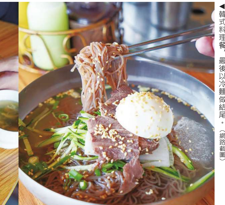
▲韓式料理餐，最後以冷麵做結尾。

我仍然記得，那升起的煙霧讓我睜眼因快樂而濕潤，以及那杯檸檬汽水喝起來有多酸甜。我們的臉泛著溫暖的光澤，炭火的味道殘留了好幾日，不時提醒自己品嚐過的美食。我依舊熱愛在餐桌上以炭火