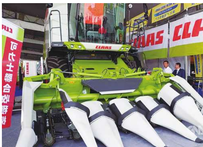
▲ 農業部農機署曾表示，政府為改善農村耕作條件，106 年開始已補助農民購買 18 萬台農機，共花了 80 億元。

儘管準農業部長再次宣示「以農為本、光電加值」的基本立場，實際上卻以種電為優先，有許多土地不該用來種電如：砍伐樹林、填平埤塘、破壞候鳥棲地、打壞海岸生態……等等。