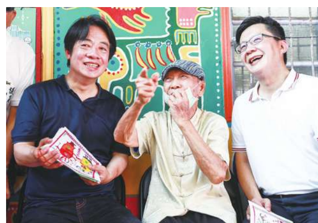
▲賴清德 5 日公布各部會政務次長人選，教育部、衛福部有前立委加入，其他部會多為學者。圖為賴清德與張廖萬堅。（賴清德臉書）

【本報記者呂翔禾台北報導】準總統賴清德 5 日透過黨中央宣布內閣政務次長人選，其中財政部、經濟部現任政次都留任，內政部則由學者馬士元、董建宏出任，過去爭議甚多的花敬群並未被留任。教育部政次如外界預期，由前立委張廖萬堅、台大教授葉丙成出任，衛福部也納入前立委林靜儀擔任政次。