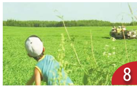
極品電影遠山的呼喚 (藍祖蔚)