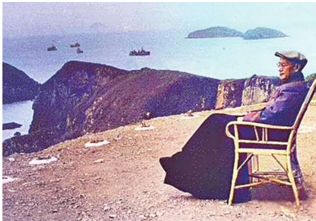
▲反共救國軍生活報告的狀況，到了 1954 年 5 月，蔣中正親自巡視大陳島時留影。圖為蔣中正總統於巡視大陳島時留影。（圖中左側為胡為真，右側為蔣中正）

當時即先調訓班排級官兵九百人，編為一個大隊，二個月結業，再遣回原部隊。他希望繼續招考臺灣反共志士多多參加受訓，只可惜奉命調回臺灣後，後繼者未能持續，以至於學校只辦了兩期，未能繼續。