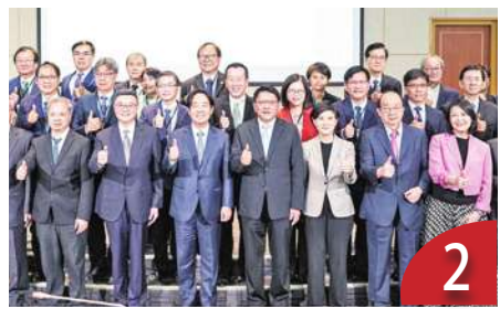
賴內閣多爭議 施政挑戰重重