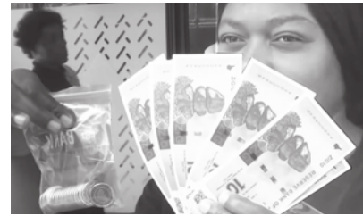
▲辛巴威近期發行新貨幣ZiG，盼解決國家經濟不穩定，並減少國內市場對美元的依賴。(網路截圖)

【本報記者莊宇欽綜合報導】辛巴威發行新貨幣ZiG(Zimbabwe Gold)，將有助於減緩居高不下的惡性通膨？辛巴威幣長期處在通貨膨脹之中，迫使政府推出各種貨幣取代方案，而ZiG擁有外匯及黃金儲備的支持，成為人民交易貨幣的新選擇。然而，美元目前仍為辛巴威的強勢貨幣，人民對ZiG的信心將取決於通膨能否有效減緩！