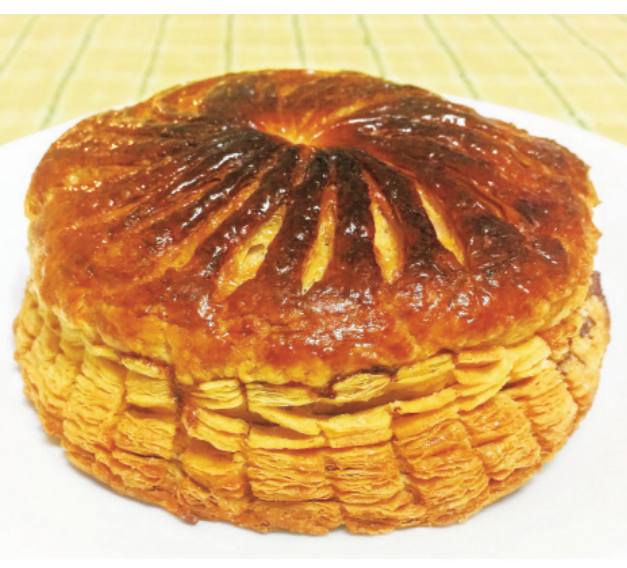
▲皮蒂維耶酥皮餅，酥鬆派皮配上杏仁奶油，芳香滋味難以忘懷。(網路截圖)

從那天起，我在哪裡都會看到一張照片。總是這同一道「法式肉派」，看來有著難以置信的完美無瑕。然後有一天，一道「庫利比亞克」(kouloubiak)出現了。它威嚴而龐大，比「法式肉派」要大得多。我不得不搜尋我的記憶，因為縱使這名稱我不陌生，但只有在翻譯艾斯科菲的《京饈指南》(Le Guide culinaire)時，我才想起幾十年前吃過一次「庫利比亞克」。那是一種軟熟的