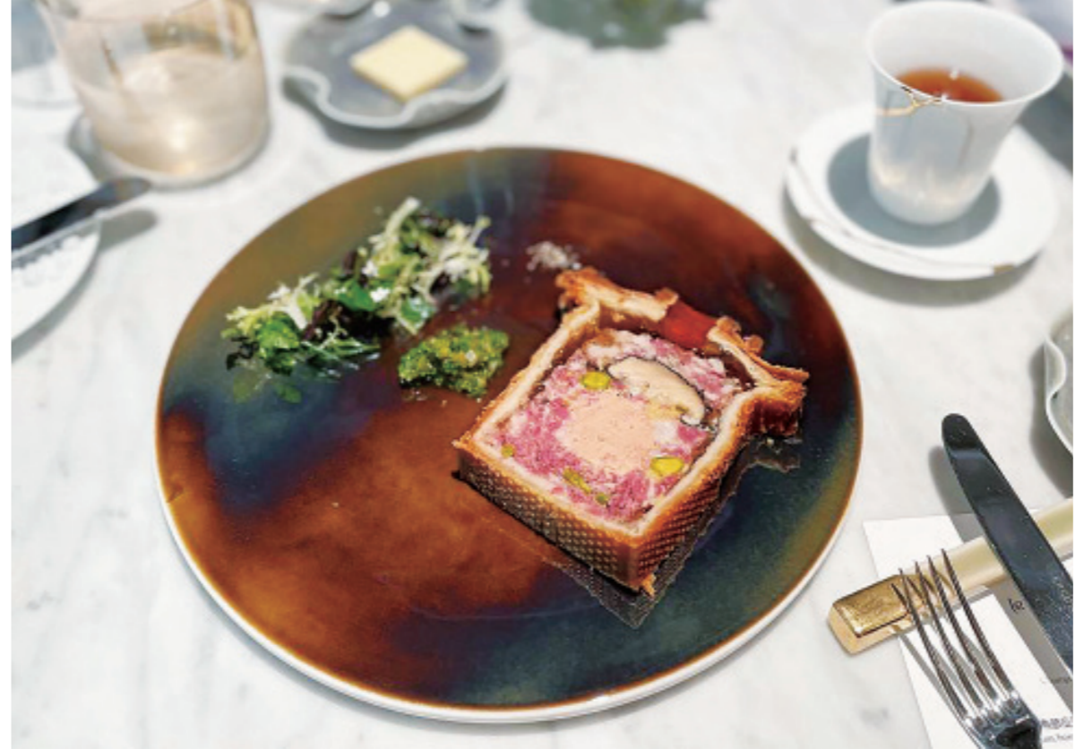
▲法式酥皮肉派，肥鴨肝，酸黃瓜香醬醬，風味也是眾多肉派裡屬於台灣人會喜歡、吃不膩的風味。(網路截圖)

接著，牙齒輕柔而堅決地將它咬碎。它既不鬆軟，也不會太乾。它既不會太硬，也不會太潮，沒有絲毫瑕疵及不均匀之處，這泡芙級質地絕對均勻。