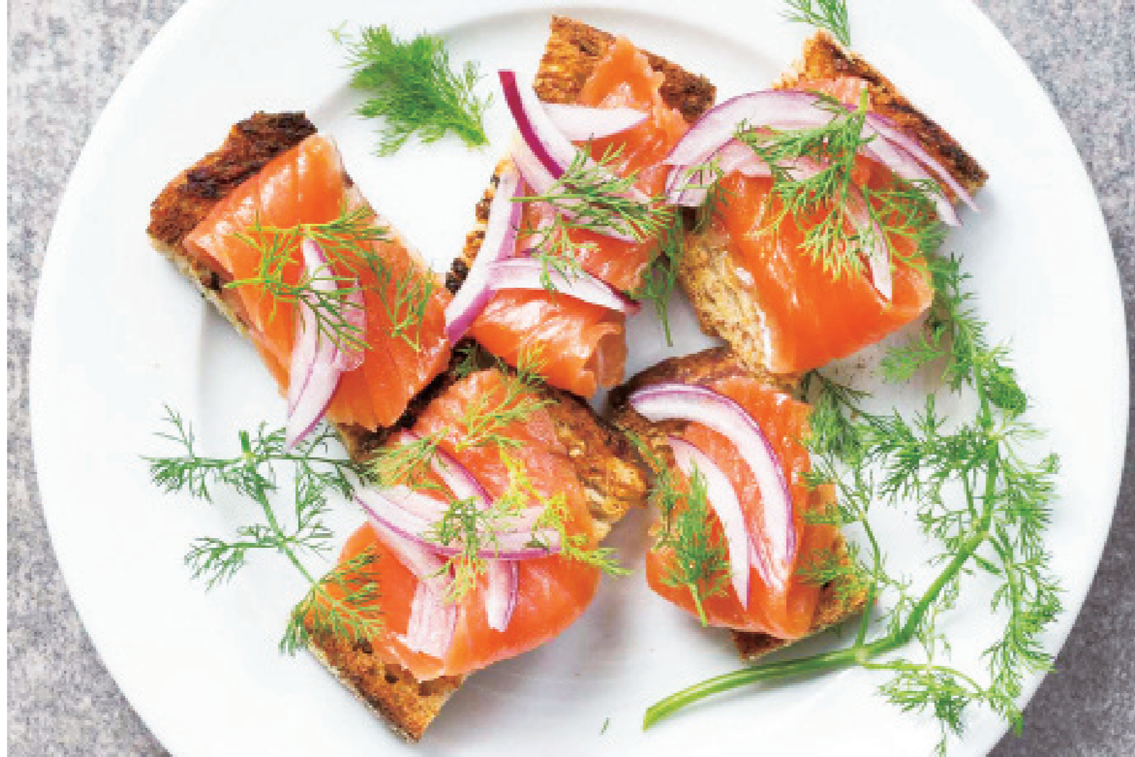
▲醃製鮭魚來自萊芒湖(Lac Léman)白鮭魚肉質地純淨、緊實，風味也同樣澄澈。維持著一派優雅。

好吞嚥？酥皮會不會和它美麗木質般的外表一樣堅硬？另外還有規則排列成兩行的六粒蘆食，不曉得是開心果還是蘑菇。這樣的幾何排列好入口嗎？美味可口嗎？這種完美的對稱