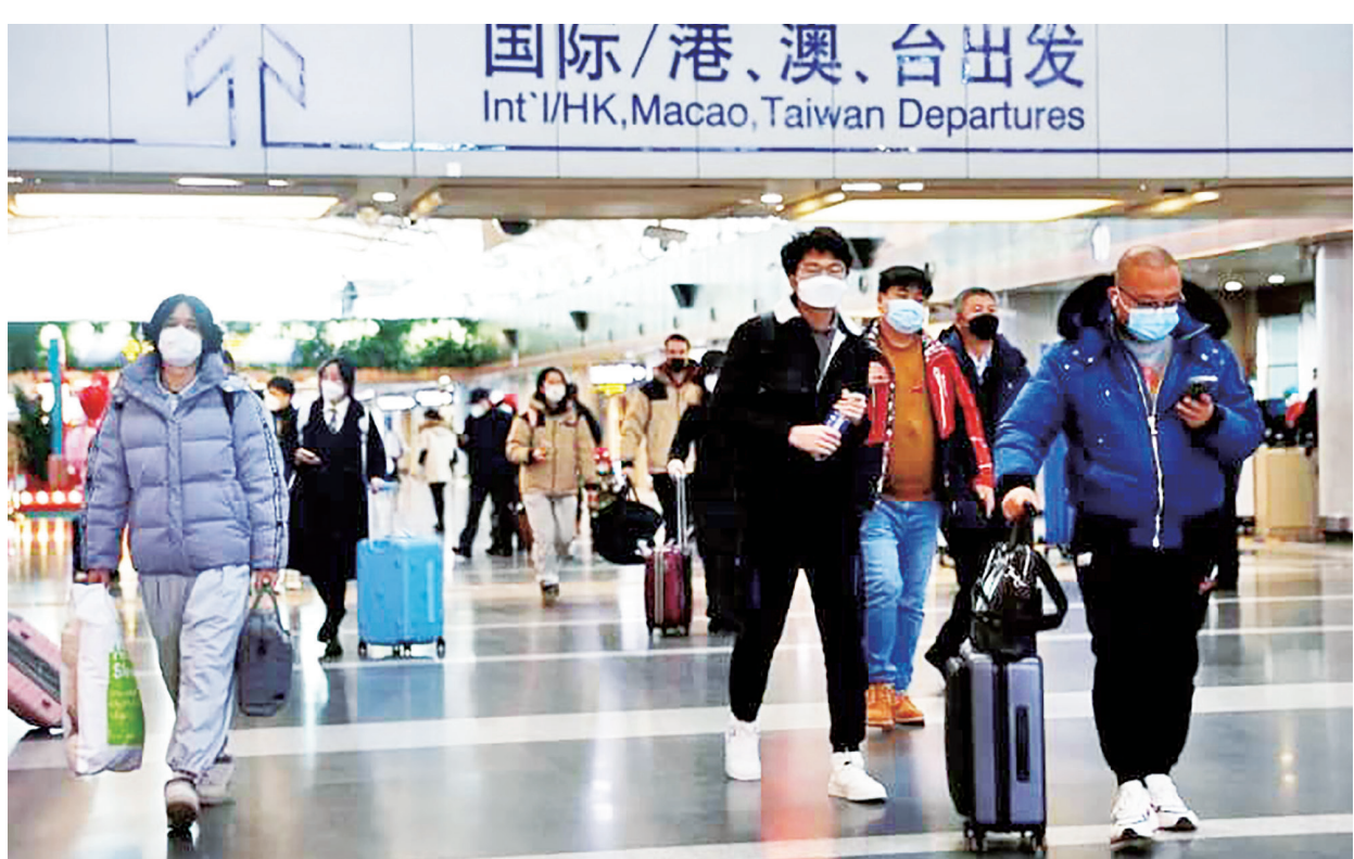
▲ 近日中國宣布恢復福建省居民到馬祖旅遊，藍委呼籲政府取消禁團令彰顯善意，但綠委對此多抱有質疑，認為以小利換大利，並呼籲中國要更擴大開放。