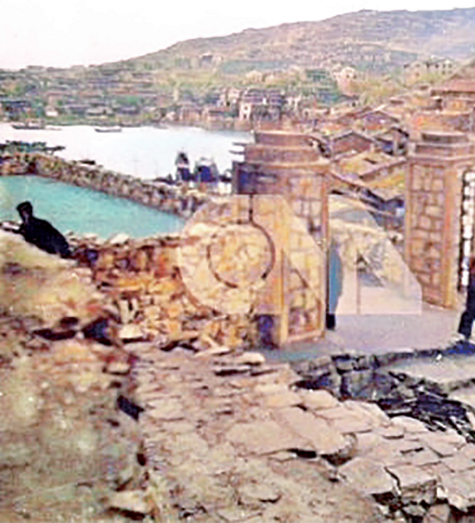
▲胡宗南到達大陳巡查各島之後，看到洞頭島的重要性，便電請國內在中共尚未注意到時迅速調派一師陸軍及砲兵一營駐守該島。

於是華東軍區司令部便於6月15日頒佈「對解放上下大陳島登陸作戰的指示」，目的是「徹底擊滅浙南沿海殘敵，打通南北航運，並為解放金門、臺灣創造先決條件」。但是中央軍委副主席兼國防部長彭德懷頗顧慮因為韓戰尚未結束，屆時美國海空軍可能會參戰，主張暫緩行動。此議獲得軍委主席毛