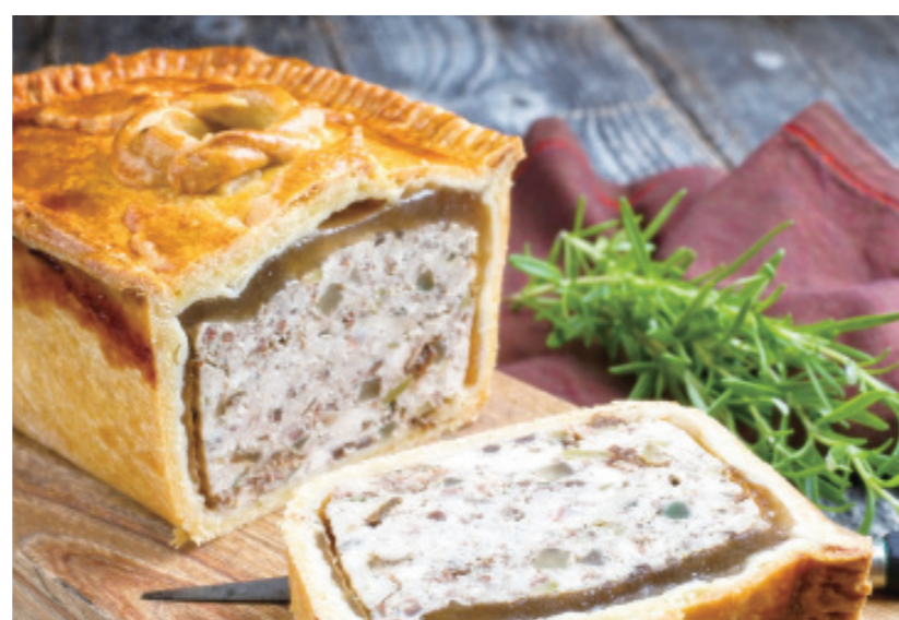
▲法式肉派，通常以酥皮包覆內餡烘烤而成，經典的內餡為豬絞肉、蛋、蒜泥、蘑菇等。還會加入鴨肝等頂級食材提升濃郁滋味。

派餅，切開後有過熱的鮭魚和菠菜，上面覆蓋著濃稠的醬汁。這是一道過時、陳舊的菜餚，很久沒有人會做了。但是這位先生所製作的「庫利比亞克」顯然非常酥鬆，呈現