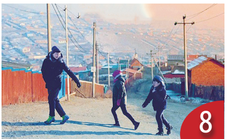
8 如果我能夠冬眠：赤子