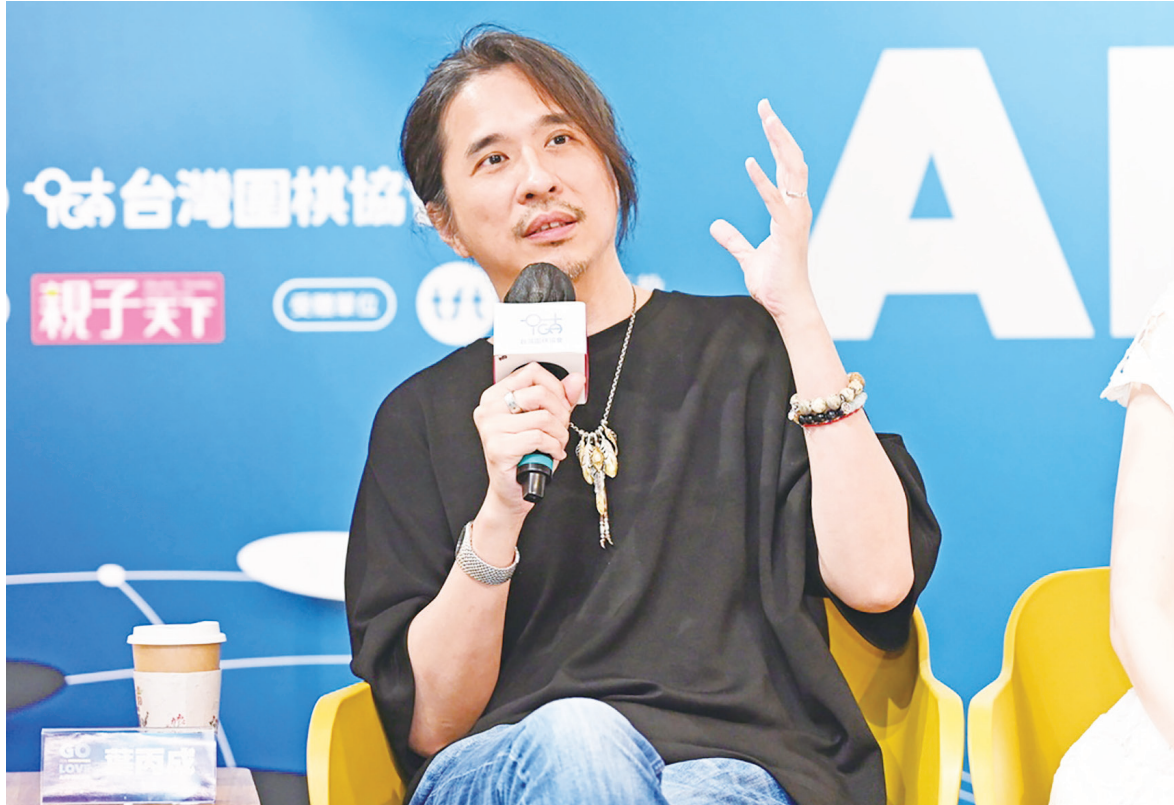
▲翻轉教育推動者葉丙成擔任教務部政次，引發教師、學生擔憂，他將強勢推動「翻轉教育」或「實驗教育」。

位，若要沿用到公共事務政策上，勢必要有所調整。期盼他多傾聽各方聲音，瞭解教育的現狀和文化脈絡。