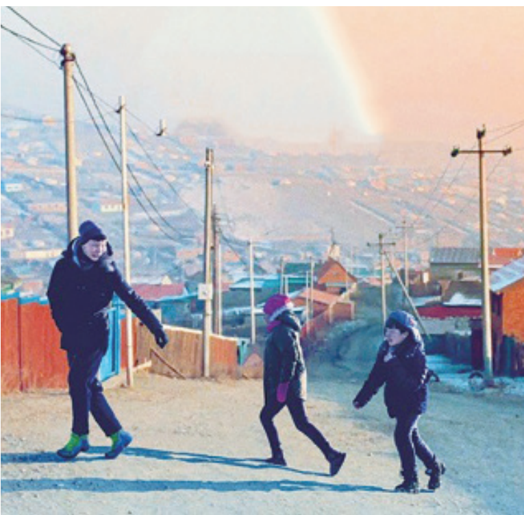
▲《如果我可以冬眠》透過住在蒙古裡的男主角烏爾一家人看見巨大的貧富落差現況，以及不甘心被貧窮擊敗的志氣。(電影劇照)

《如果我可以冬眠》是一部蒙古電影，講述一家人看見貧富落差而不甘心被貧窮擊敗的志氣。