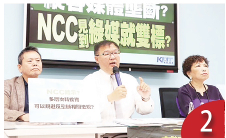
2 NCC 政黨比任命 學者：合理