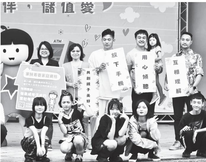
家扶基金會 28 日舉辦兒少宣傳活動，盼宣傳兒少保護知識，招募寄養家庭。

【本報記者呂翔禾台北報導】親子互動需理性溝通、多稱讚、少批評，才能減少家暴！家扶基金會 28 日於動物園舉行「好好陪伴、儲值愛」活動，透過闖關遊戲與魔術，宣導兒少保護知識與招募寄養家庭。現場並邀請台北市社會局長姚淑文、富邦悍將選手戴培峰共襄盛舉，家扶盼透過活動宣傳親子互動撇步，減少家庭不和睦與家暴的狀況。