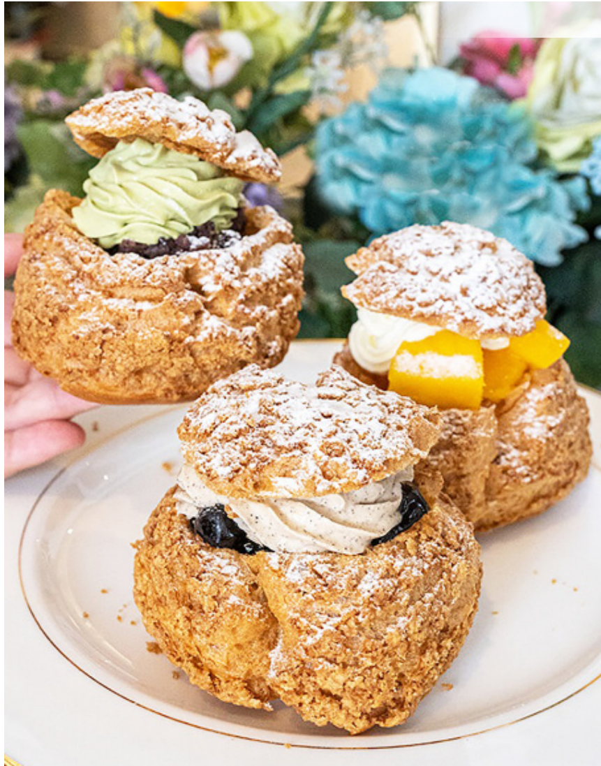
▲卡倫·托洛桑的泡芙既不鬆軟，也不會太乾、太硬和太潮，這顆泡芙非比尋常。（網路截圖）