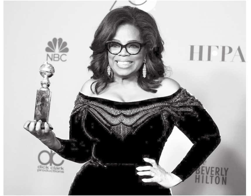
▲《歐普拉脫口秀》受訪來賓有人因悲劇、背叛或失望而備受打擊。作者用和大家分享經驗的方式，教授大家如何獲得幸福學。(網路截圖)

如果你閱讀本書是因為你覺得自己沒那麼幸福，可能是你正在遭受什麼苦難，或是你的生活「表面上看起來」一帆風順，但總覺得不滿意或不稱心，那麼你就是我最能夠理解與產生共鳴的那種人。我們是心靈契合的有緣人。