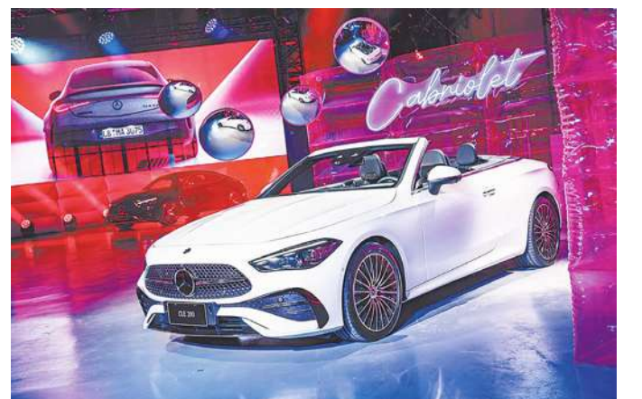
▲ 賓士新款CLE系列推敞篷車。

賓士汽車新成員CLE也是一例,CLE的軸距與C-Class相同,但車長與E-Class接近,以長車頭比例加上跑車斜背式設計,讓車身線條呈現絕美姿態,內裝依舊鋪陳豪華氛圍,給乘客較寬敞空間。此外,亦加入AMG E 53 HYBRID 4MATIC +車款,3.0L六缸引擎搭配電動馬達,提供585hp馬力,0-100km/h加速只要3.8秒,純電動極速140km/h、可行駛100km以上。