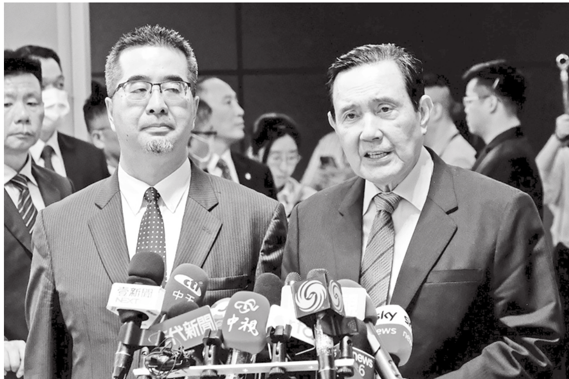
▲前總統馬英九(右)1日將訪中，據傳本日本日就會見到國台辦主任宋濤，8日會見到習近平。左為馬英九基金會執行長蕭旭考。

唯一能做的僅是盡一己之力，推動兩岸青年交流，推動兩岸民間減少敵意、累積善意。馬英九指出，去年他們證實這個