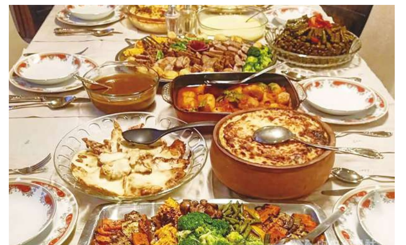
▲全球慶祝「國際零垃圾日」，逾1億人口的埃及也積極推動不同的綠色倡議，不但設法減少每年2400萬噸垃圾量，更從減量開齋飯食材做起，達到控制價格、促進循環經濟，並兼顧「Less Is More」(少即是多)的環保目標。