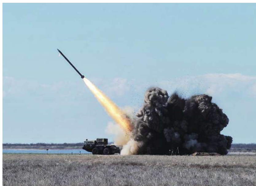
▲ 俄軍再度集中火力攻擊烏克蘭發電基礎設施，而烏克蘭在缺乏防空飛彈下更顯吃力。

《衛報》提到，澤倫斯基也發出復活節訊息給全民表示，俄羅斯的攻擊不分日夜，但烏克蘭不會放棄。不過目前美國對烏克蘭的援助依舊卡關，僅有法國將初步援助老舊軍車與新型地對空飛彈，法國國防部透露，未來將會提供更全面的援助，包括堪用的舊軍備與新飛彈。