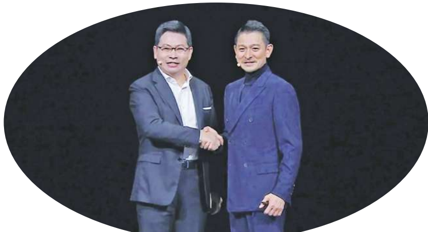
▲ 華為推高端品牌「非凡大師」,找劉德華代言,順便拉拔新款電動車。(華為官網)