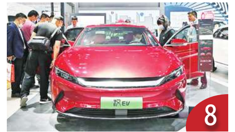
國產車式微 中國製大舉來台?