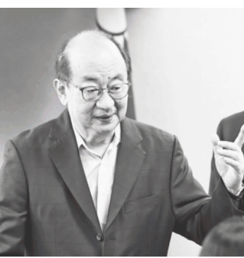
▲學者認為，柯建銘會如此自信說要釋憲，恐是因為國會聽證權與監察權有衝突，違憲的機會很高。

不過，民眾黨立委黃國昌1日質詢時指出，柯建銘過去曾要求前總統馬英九到國會國情報告並即問即答，在總統蔡英文2016年的國會改革政見也包括國會聽證調查權。國民黨立委羅智強也說，2012年，時任立委的陳其邁就曾提案，