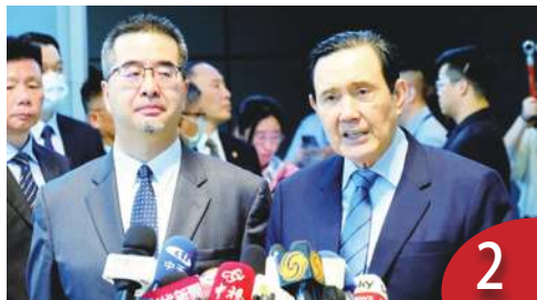
馬英九訪中 盼傳遞台人心聲