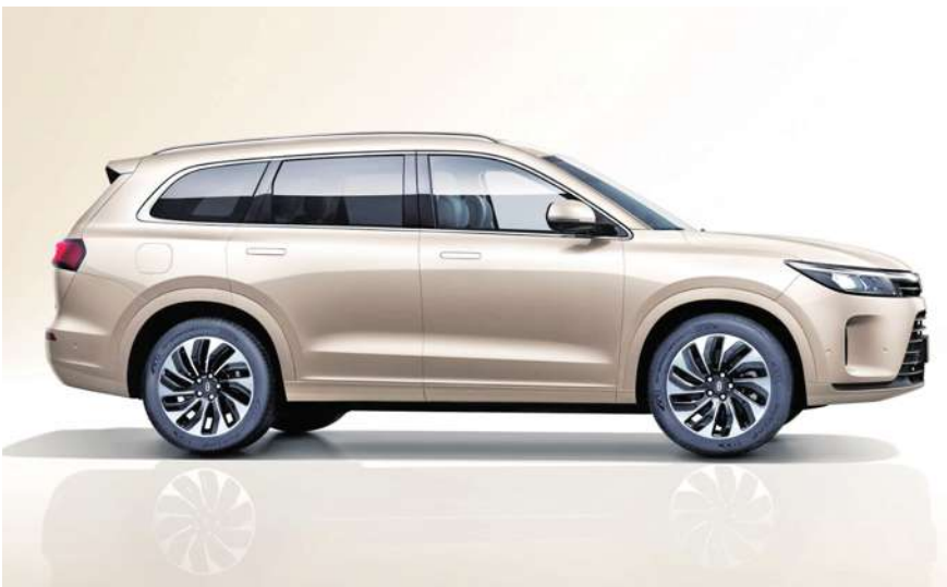
▲ 中國華為問界休旅車,宣稱目標德日豪華車市場。