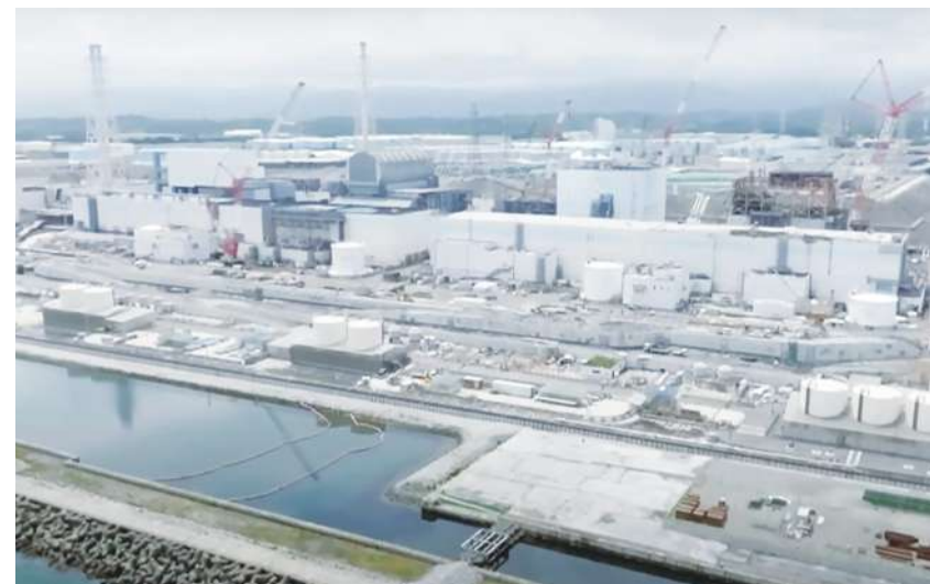
▲ 日本在會談中稱核廢水排放無安全疑慮，並強調符合科學依據，盼減緩中國對此事件的擔憂。(網路截圖)

造更多水箱，但為了從三個受損反應器中清除放射性燃料和碎石，因此決定將原先儲存約 134 萬噸福島核廢水排入太平洋。針對日本一再堅稱排放過程符合科學依據，中國仍將處理後的廢水稱作「核污染」，並對去污的有效性和數據的可信度提出質疑，雙方尚無結論。