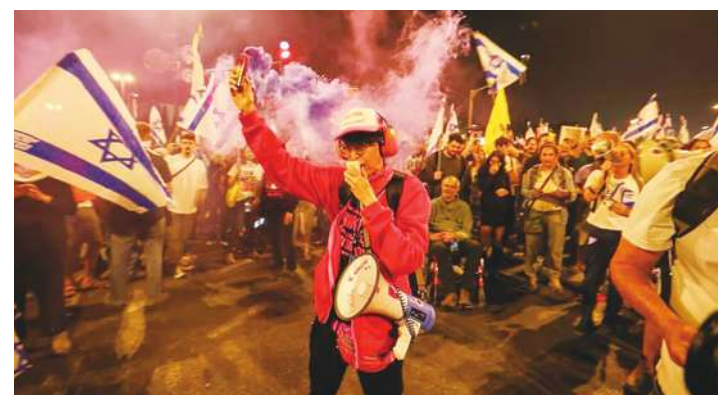
▲ 數千名以色列人 1 日走上耶路撒冷 (Jerusalem) 街頭，要求當局讓遭挾持至加薩的以色列人質回家，以及總理尼坦雅胡下台，這是耶城連續第 2 晚大規模抗議活動。