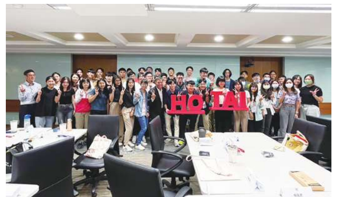
▲ 第四屆和泰汽車TOYOTA WAY 菁英研習營正式開跑。(網路截圖)

● 豐田汽車集團總代理和泰汽車,為進一步培養學生競爭力,提前了解職場趨勢。從2019年起規劃「和泰汽車TOYOTA WAY 菁英研習營」,邀請大專院校學子到和泰汽車學習豐田精神,了解真實職場如何執行專案