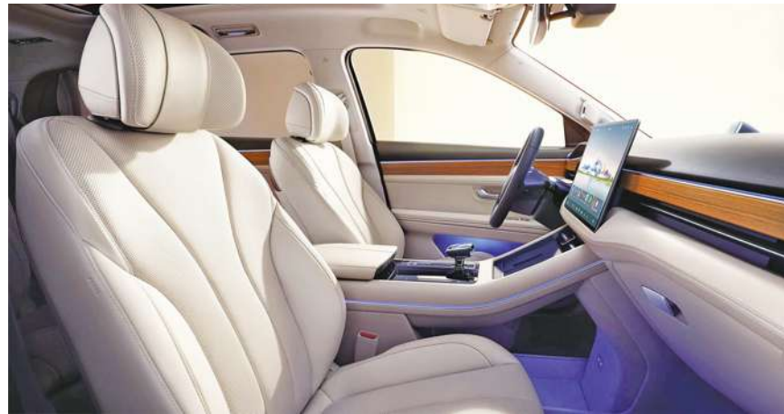
▲ 中國華為問界休旅車,有5、7座分類。