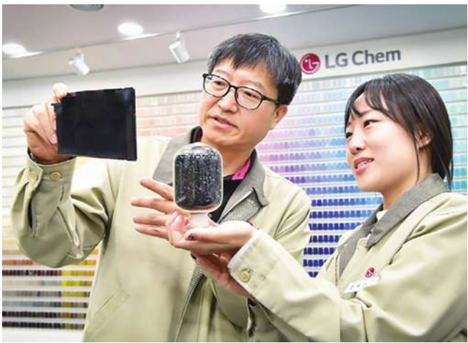
▲目前耐燃性最高的阻燃塑膠，防火膠可耐1,000°C高溫超過400秒。

據統計，消防單位要使用比一般燃油車多出40倍的水量才能撲滅電動車火災，一台電動車發生火災的耗水量高達15.14萬公升，如果失火處沒有足夠的水源或消防栓措施，大多導