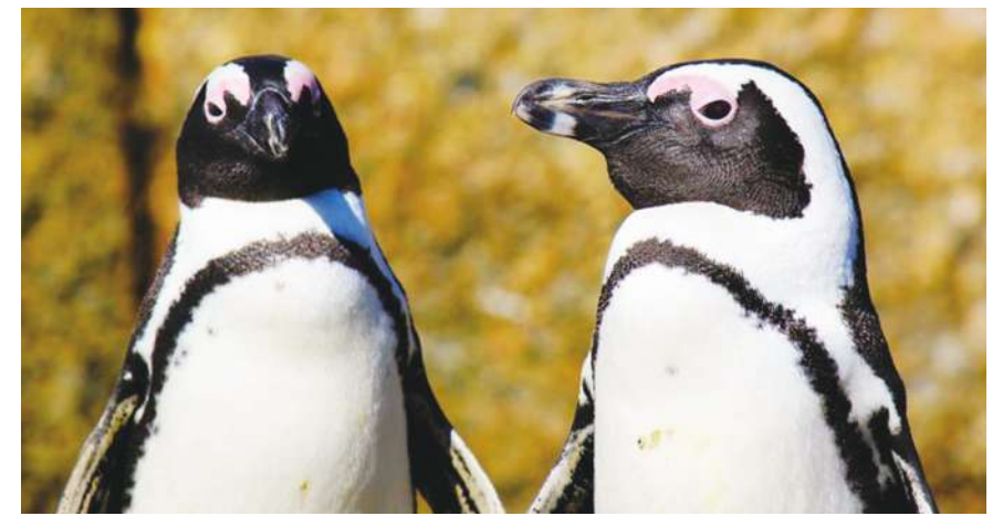
▲海鳥類保護基金會(SANCCOB)邀請人們「領養一顆企鵝蛋」，募集捐款將作為孵化非洲企鵝蛋的費用。

她表示，若按照每年損失8%非洲企鵝的速度，預計2035年就會全數滅絕，而目前野生族群的數量仍不足以維持生存。尤其，商業捕魚奪走牠們的食物來源(沙丁魚和鳳尾魚)，加上南非週邊航線的噪音汙染，都成為嚴重的威脅。