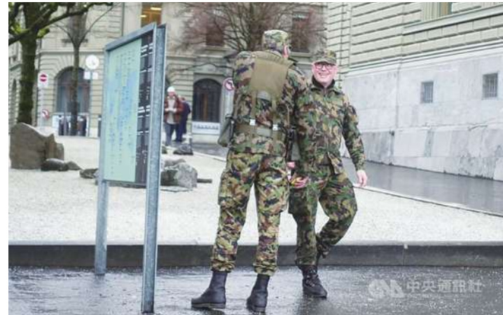
▲ 雖然瑞士是中立國，但是一直實施男性得當兵的義務役制度。在街頭或搭火車的時候，經常會遇見身穿迷彩服的軍人，他們多半是義務役的民兵。