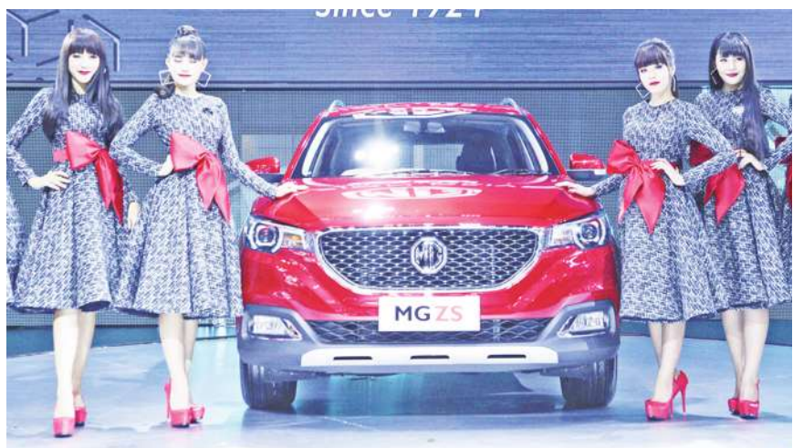
▲ 中國MG名爵攻進台灣,驚嚇國人。(網路截圖)