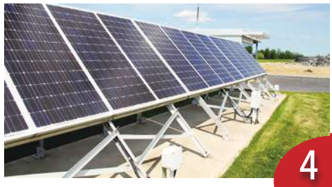
太陽能板漸退役 憂成環境危機