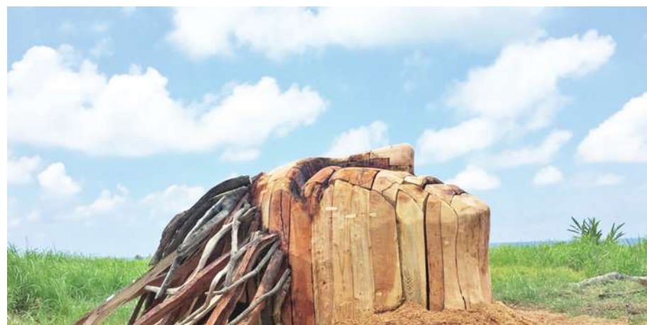
▲拉飛邵馬在長濱的裝置作品。(網路截圖)