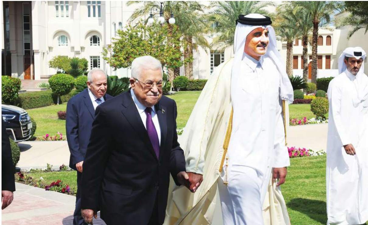
▲ 巴勒斯坦的派系問題相當複雜，且國際對哈瑪斯支持態度不一，即使以哈有機會停戰，巴勒斯坦未來仍充滿不確定性。圖左為巴勒斯坦政府現任總統阿巴斯。