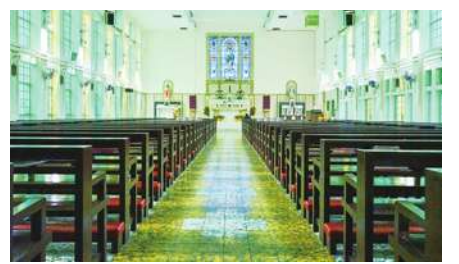
▲ 香港神職人員認為，國安法對於教會服事是一種阻礙。(Photo by Warren R.M. Stuart on Flickr under Creative Commons license)

【本報記者莊瑞萌綜合報導】香港國安條例讓神職人員進退兩難。香港立法局上週火速通過香港基本法23條，禁止叛國、煽動叛亂等行為以及處罰得未通報。對此，天主教會神職人員認為，當中規定得知未通報將會連帶受罰，因此，恐違背信徒告解內容不得透露的信條。