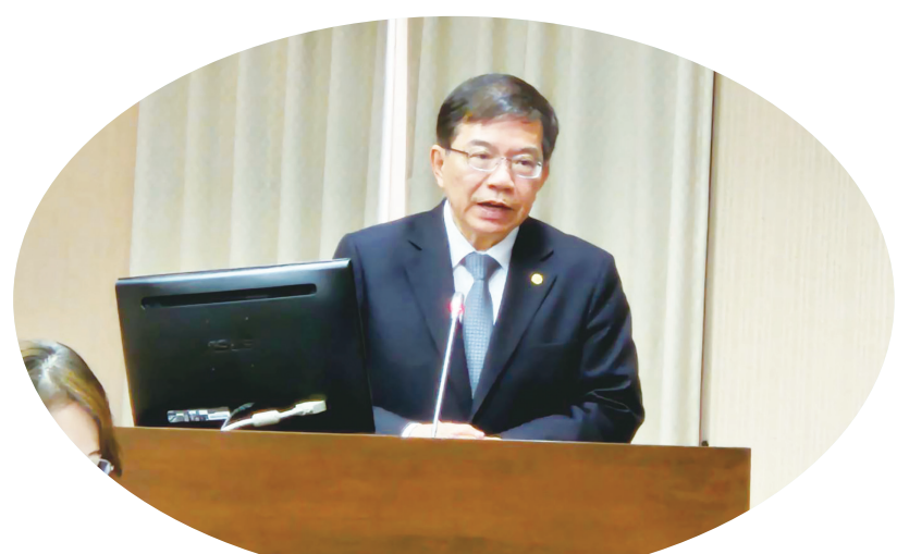
▲國民黨立委傅崐萁25日批評交通部任意解釋法律，但交通部長王國材回應說，相關計畫已經進入可行性評估。

國民黨立委黃健豪問王國材，《花東快條例》是預算案還是法律案？王國材回說是法律案，黃健豪不滿說，既然不是預算案，交通部不該在報告說此案違憲，若有窒礙難行應該依照《憲法增修條文》第3條提出覆議案。同黨立委游灝也說，先前立法院因應疫情也通過授權預算的法案。