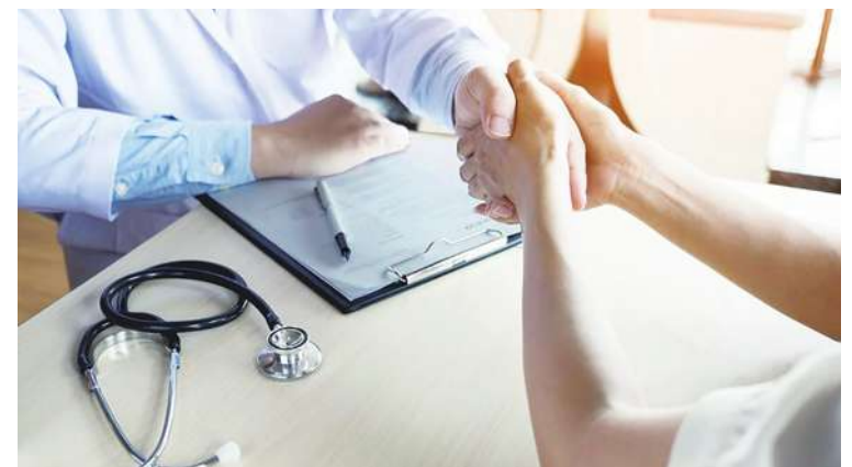
▲醫師聽病人講述症狀，也是治療的一部分。(網路截圖)

壓力需要出口，不由得想起電影「侏儸紀公園」的名言，生命會自行找尋出路(Life will find its way out)。