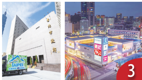
北基延續施政出包 為前任收殘局