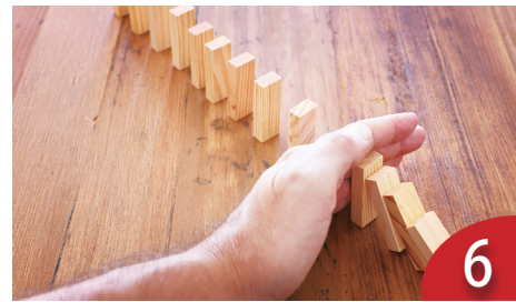
失敗讓我學習的事 (方儉)