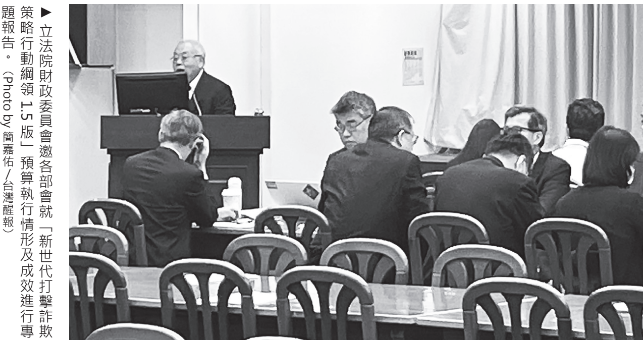
立法院財政委員會邀各部會就「新世代打擊詐欺策略行動綱領 1.5 版」預算執行情形及成效進行專題報告。

立委質疑，簡訊短碼氾濫該如何加強防詐？數位部回應，未來八大行庫將導入 111 簡訊短碼。