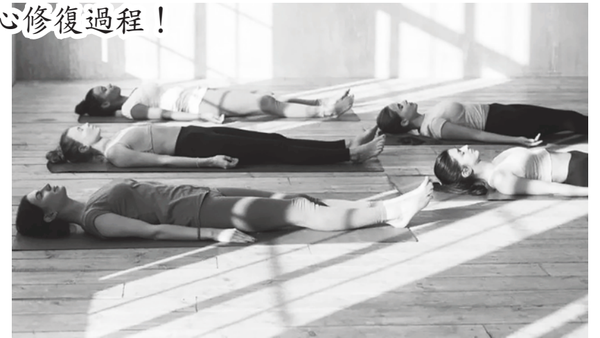
▲ 為什麼要在瑜珈課睡覺？但其實大休息並不是真的在睡覺！閉上眼睛，想像身體緩緩下沉，有意識地休息，讓負重慢慢離開身體。

透過這項腦科學研究，我們能了解腦力消耗不是一種心理感覺而已，更是一種大腦生理現象，恢復的關鍵在於排除大腦累積的廢棄物。一般情況下，我們會避免進一步消耗腦力，選擇休息讓腦力得以緩緩恢復。