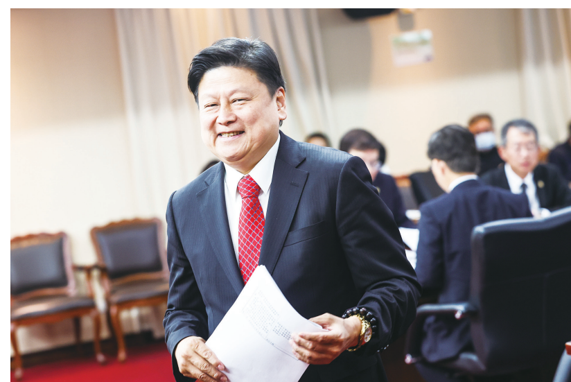
▲立法院交通委員會審查國民黨立法院黨團總召傅崐萁(圖)所提花東快速公路建設特別條例草案。由於朝野立委在逐條審查時，針對每一條條文都無法達成共識，最後全案保留送黨團協商。

另外，未來若環評審查決議不宜開發，將造成本條例無法執行，且快速公路經過原民部落，相關開發計畫應諮詢原民部落同意。交通部也指出，該計畫建設規模及經費龐大，