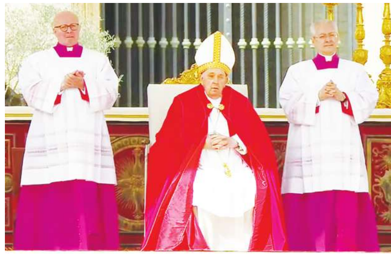
▲ 教宗方濟各24日在梵蒂岡舉行的棕樹主日彌撒儀式上，沒有上台講道。

儘管如此，方濟各在彌撒期間仍宣讀祈禱文給予祝福。禮拜結束後，他也提及烏克蘭殉難的人民及遭受戰爭苦難的人們，並坐在輪椅上單獨向紅衣主教致意，隨後登上專車向廣場上的人群道別。