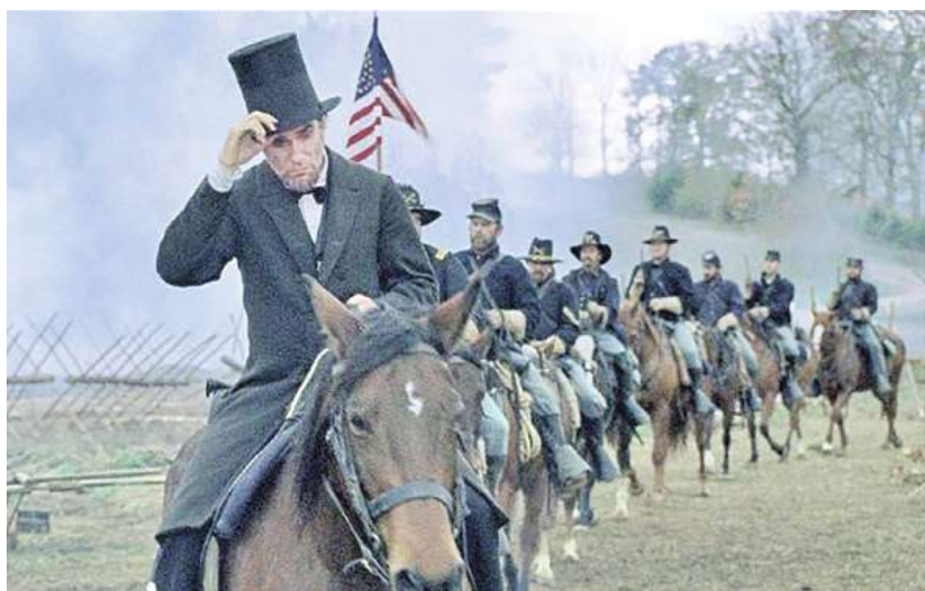
▲美國政治人物為題材的影視傳記雖多，卻只有一部在奧斯卡角逐中脫穎而出。（《林肯》劇照）

首開其端的是獲第3屆最佳男主角獎的喬治·亞理斯，他在《英宮外史》（1930）中飾演足智多謀的首相班傑明·迪斯雷利，以投資買下蘇伊士運河而知名。亞理斯曾在默片和有聲片兩度扮演同一角色。三年後，查爾斯·勞頓在《英宮