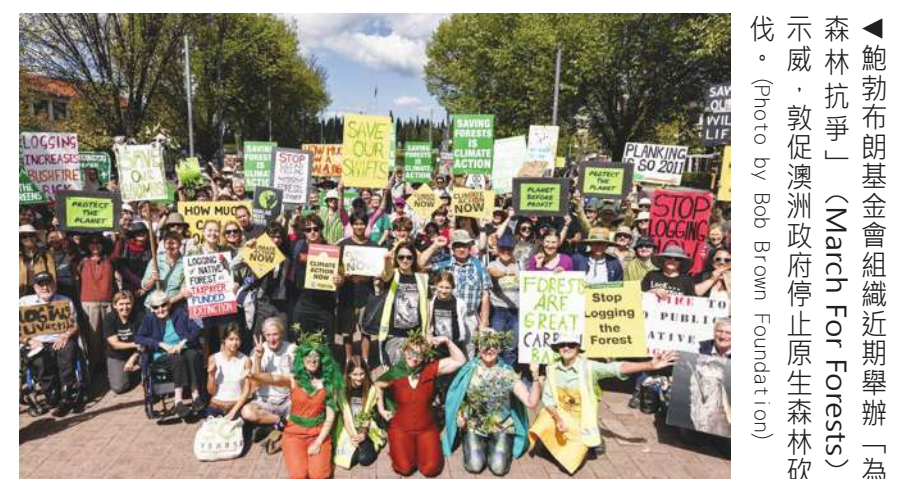
▲ 鮑勃布朗基金會組織近期舉辦「為森林抗爭」(March For Forests)示威，敦促澳洲政府停止原生森林砍伐。

《紐卡索週報》指出，在地球生物圈遭到破壞的時代，鮑勃布朗基金會關心生態環境議題，並以樂觀態度促進生態環境永續。創辦人布朗也提及，基金會的目標是維護自然生態，並成為環保人士重要支持。