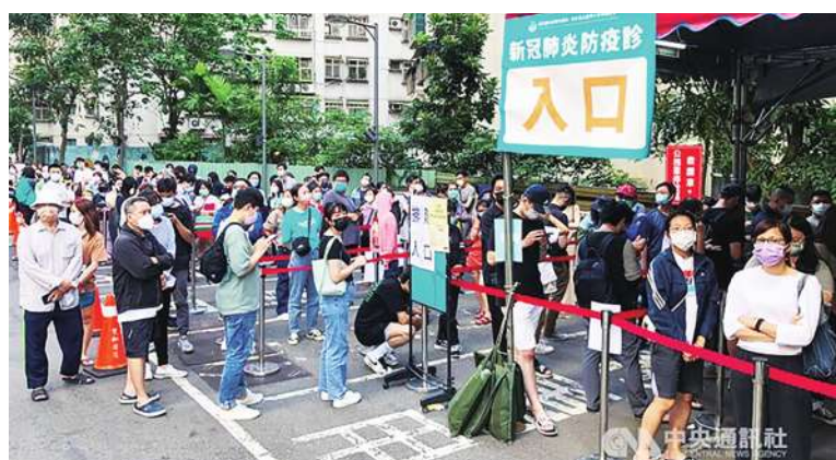
▲如「疫情」其實是一直存在的，解封後，乃至於現在，可能病毒對我們侵襲更勝於昔，我們還要考慮再「封控」嗎？

我們和病毒的競爭，只有失敗，或是共存，而我只會從失敗中選擇共存的方式，我不能也不敢想去消滅病毒。多曬太陽，增加維生素D，可以增強免疫力，免於病毒的危害。