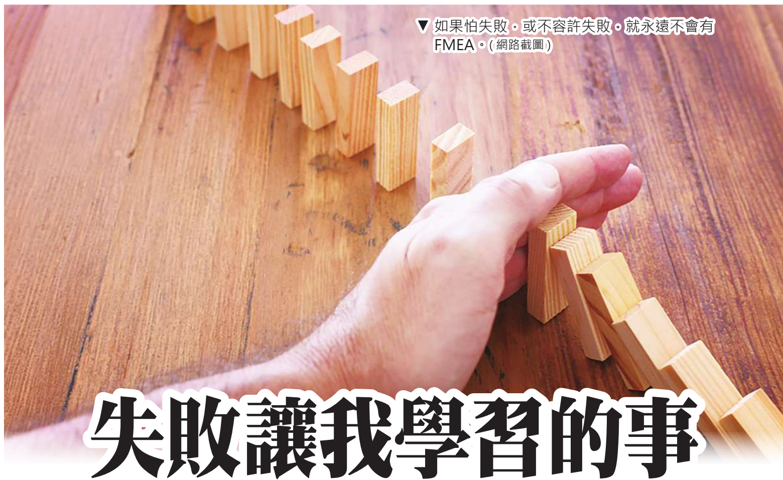
▼如果怕失敗、或不容許失敗，就永遠不會有FMEA。