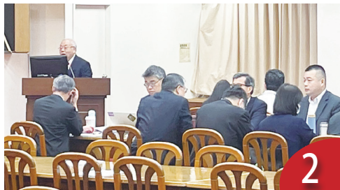
行庫導入防詐 立委問詐騙戰犯