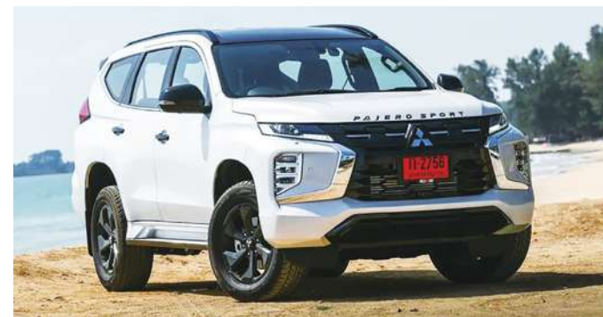
▲ 小改款的日本三菱 Pajero Sport 在泰國發表，車頭造型吸睛。(網路截圖)

另一重點是動力升級，新款 2.4 升柴油引擎可有 184 匹最大馬力，扭力達 43.9 公斤米，仕紳板也有四驅車型，具備多種越野模式，展現強大的地形征服能力。