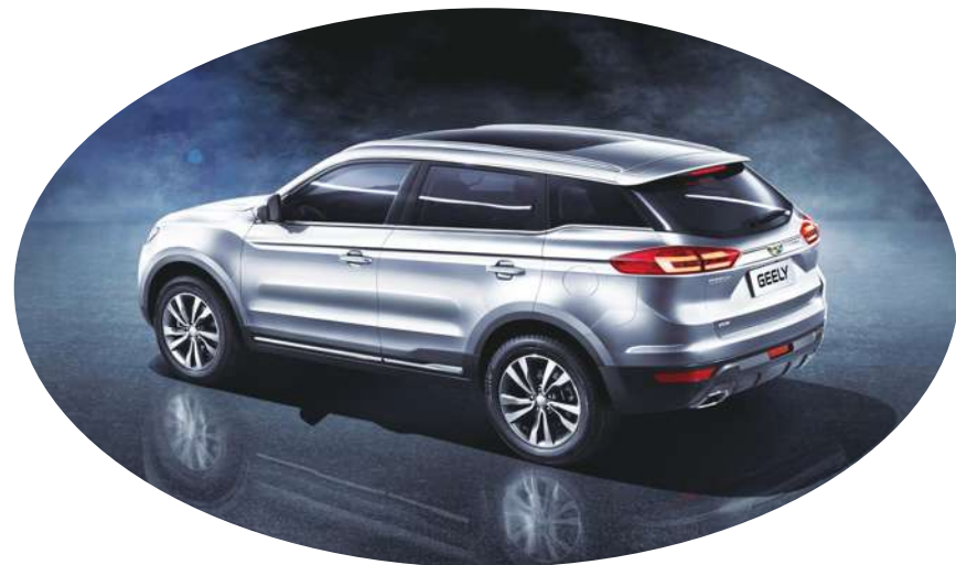
▲ 在蘇俄銷售甚佳的中國吉利汽車之一。