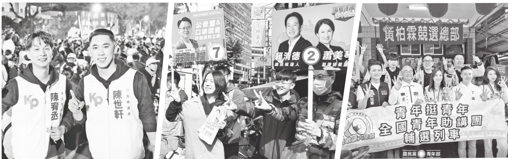
▲ 選後藍綠白三黨不約而同都有重大計劃或改革，盼透過調整組織、舉辦新活動，吸引更多青年參政。

青年部則指出，成立青年部是希望透過各類型的活動，讓更多青年認識民眾黨，並為青年提供投身公共事務參與的機會。近日將會舉辦「眾議匯聚-青年論政座談會」活動，並邀請黨主席柯文哲、秘書長周榆修與黨內的年輕民代及黨公職，一起討論 2024 總統大選的啟發、民眾黨政治定位等議題。