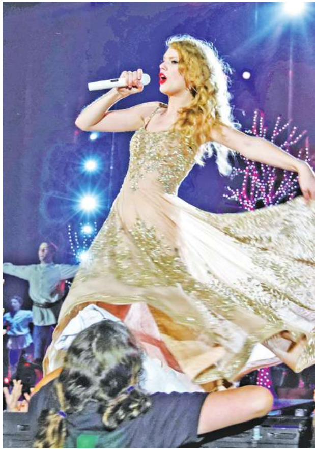
▲歌手泰勒絲於「Speak Now」演唱會吸引粉絲注目。

泰勒絲橫跨5大洲舉辦152場的巡迴演唱會，她在新加坡的演出更破紀錄成為總票房超過10億美元的演唱會。