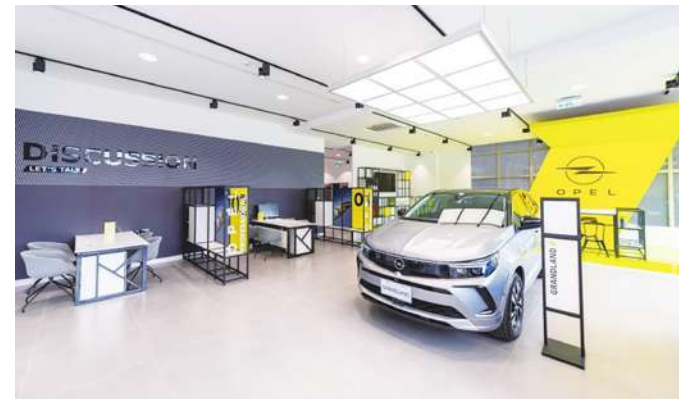
▲ OPEL 旗艦展示中心開幕推出聰明買車新選擇。

台中、永康、北高雄等展示中心後，不久前攜手泰達資訊，打造北市旗艦據點——內湖旗艦中心。