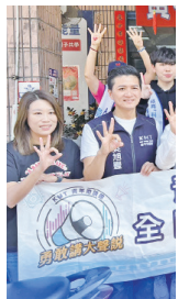
1 爭青年票 各黨敲鑼打鼓辦活動