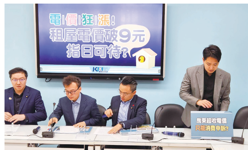
▲ 國民黨團 20 日呼籲特定族群緩漲電價，以減輕物價負擔。

因此，他呼籲農、漁、教育與 330 度以下的小戶都凍漲，避免電價上漲再次影響到物價。同黨立委鄭正鈞則說，行政院去年才在各地推出「交通通勤月票」，但中央補助 30 幾%預算，地方要負擔 60 幾%，