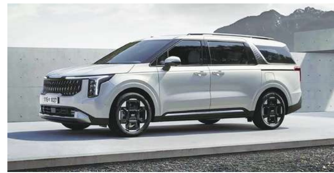
▲ 很快就小改款的韓國起亞 Carnival 跟進純電車系的風格，有全新家族化面孔。(網路截圖)

樣小改款的 Sorento 相同的 1.6 升渦輪油電動力可供選擇，企圖爭取更好的節能表現。