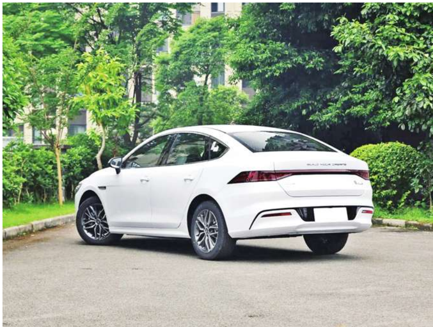
▲ 中國比亞迪的【秦】系列。