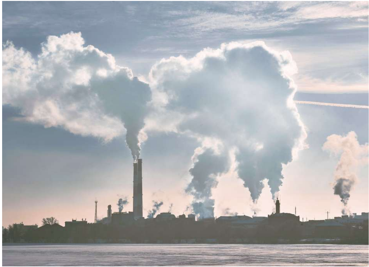
▲ 瑞士空氣品質組織 IQAir 的報告中，只有七個國家符合世界衛生組織對車輛和工業排放 PM2.5 的指標，其餘國家絕大多數都未能達標。

報告指出，全球僅有澳洲、愛沙尼亞、芬蘭、格瑞那達等7國的空氣品質有符合乾淨標準。