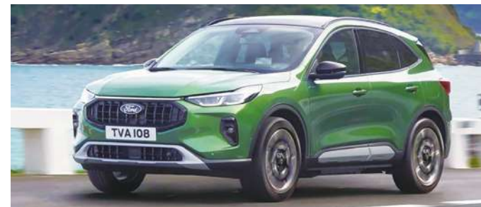
▲ 小改款的福特 Kuga 測試車身影已在台灣現身。

節前。動力方面應是維持現有配置，包括 1.5 升 EcoBoost 三缸渦輪引擎，輸出 180 匹馬力與 26.3 公斤米扭力；頂規仍是 2.0 升 EcoBoost 四缸渦輪引擎，最大馬力 250 匹、扭力 38 公斤米。