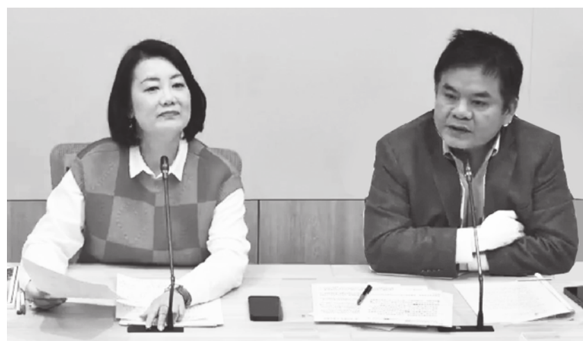
▲ 針對台北虐童案，民進黨幹事長吳思瑤(左)20 日於黨團記者會說，「民進黨不迴避，深刻反省檢討」。(直播截圖)

薛瑞元誠摯的道歉之後，地方政府這一層卻沒有道歉，也沒有提出精進的檢討報告，呼籲地方政府正視，讓社會安全布得緊密且厚實。