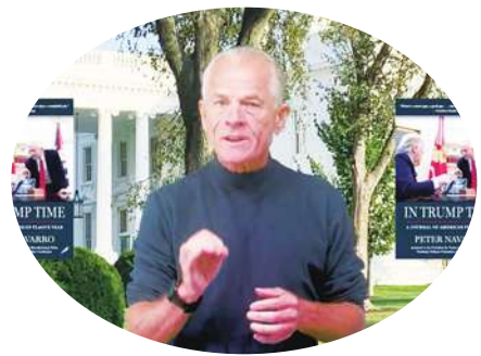
▲ 川普前貿易顧問納瓦羅 19 日因拒絕出席國會聽證會，將入獄服刑。(影片截圖)

【本報記者呂翔禾綜合報導】因拒絕出席眾議院對國會暴動調查的聽證會，前川普資深顧問納瓦羅將入獄服刑！他被判「藐視國會罪」，將在佛羅里達服刑 4 個月，但他在入獄前還召開記者會，痛批民主黨欺騙美國社會。至今還是有很多人不相信 2020 年美國大選結果，前總統川普目前也因疑似煽動當時闖入國會的暴動，面臨司法訴訟。