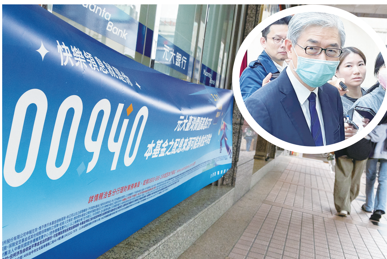
▲▲ 金管會主委黃天牧 (右上圖) 18 日於立法院備詢說，ETF 商品本身是中性的，但問題在於業者未能充分揭露商品資訊，網紅誇大行銷的亂象。