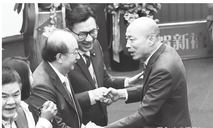
▲立法院 18 日就 15 日立委質詢影響的議題進行非正式協商。並未正式協商。

立法院會 15 日下午施政總質詢，因有立委改書面質詢，影響後續質詢的立委未能提前趕到議場質詢，進而導致議程結束。多名民進黨立委向當天主持議事的韓國瑜抗議，並提出補救訴求；韓國瑜表示，願意協助儘速邀集 3 黨團總召協商，