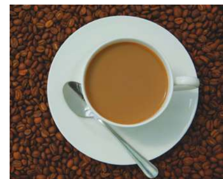
▲ 全球約 7 成的咖啡都是由「阿拉比卡豆」製成，因為其風味受到民眾喜愛，但該品種也有不耐寒、抵抗蟲害能力弱的缺點。

提供速成即溶咖啡，所以對咖啡豆的品質相對沒有要求，長期都是「量多價低」的經營策略。然而，如越南的 AeroCo 咖啡種植園等地都試著種植「優質」的羅布斯塔。