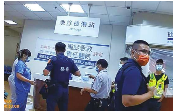
在急診醫學與軍事上，「一級」意謂著嚴重，但國家社會上有許多情境或態勢的評估標準，則剛好完全相反。(中央社)

而判斷好人與壞人的依據是什麼？這個問題倒是可說有唯一的標準：政治正確就是好人，意識形態錯誤就是壞人。