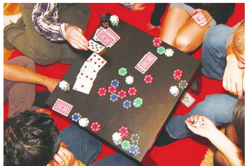
▲ 英國去年9到12月，就有近3成的民眾接觸線上賭博，人工智慧恐進一步加劇狀況。

然而，《BBC》報導，博奕業者也開始使用人工智慧，宣稱更能「增強用戶體驗」，甚至能提供用戶更多操盤意見，還