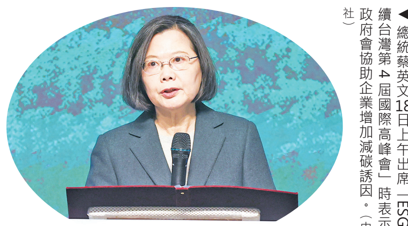
▲總統蔡英文 18 日上午出席「ESG 永續台灣第四屆國際高峰會」時表示，政府會協助企業增加減碳誘因。

她強調，隨著我國陸續成立碳權交易所、碳費審議小組與 2025 年開徵碳費，因此除了宣布「2050 淨零碳排」外，還有 12 項關鍵戰略產業與疫後特別條例，撥了 3 年的預算，協助