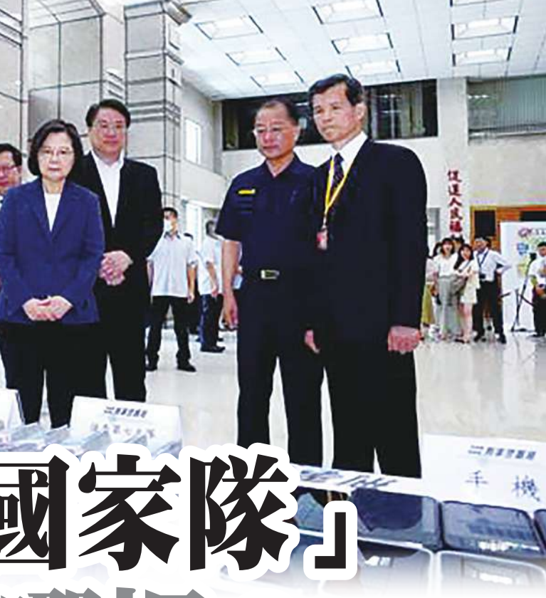
▼打詐國家隊成立，投入龐大的預算及經費，詐欺案只見繼續爆增，不見成效，人民持續受害。

2020年之後，犯罪案件陡升，當年度共有23054件，金額42.5億元，2022年29702件，金額69.6億元，去年再創7年新高。