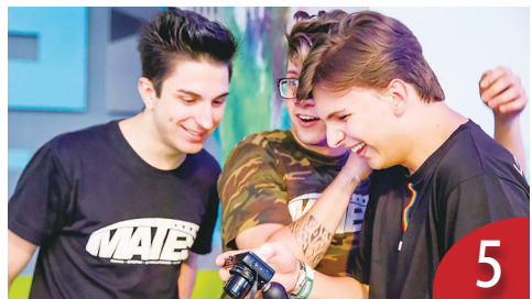
5 巴西基督徒網紅 影響力超過牧師