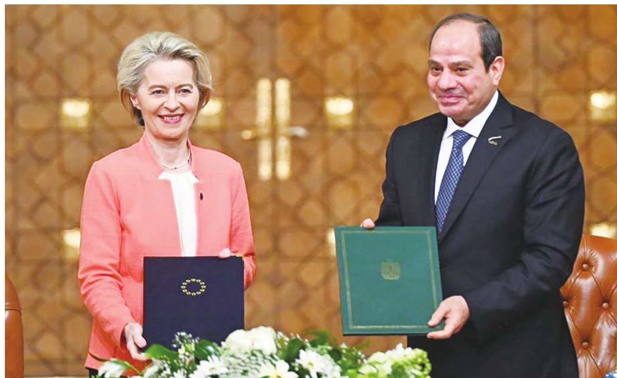
▲ 歐盟17日宣布援助埃及80億美元，盼協助控管移民進入歐洲。左起馮德萊恩與塞西

但人權團體批評，這些國家的人權狀況並不好，尤其是埃及。《人權觀察組織》指出，歐盟與埃及的協定恐促進專制主義，與歐盟的基本價值相悖，且埃及政府曾任意逮捕移民，國內人權狀況不佳，且國際貨幣基金組織（IMF）與阿聯已經有給埃及援助，歐盟這樣做實無必要。