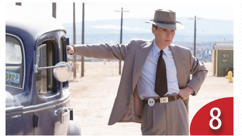
8 奧斯卡的最愛：名人傳記電影