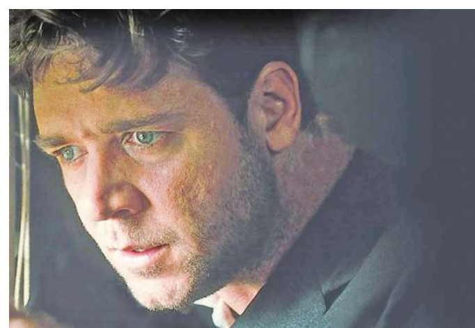
◀《美麗心靈》講述患有妄想型精神分裂症的美國數學家約翰·納什發明了著名的「博弈理論」的獨特經歷。（《美麗心靈》電影劇照）