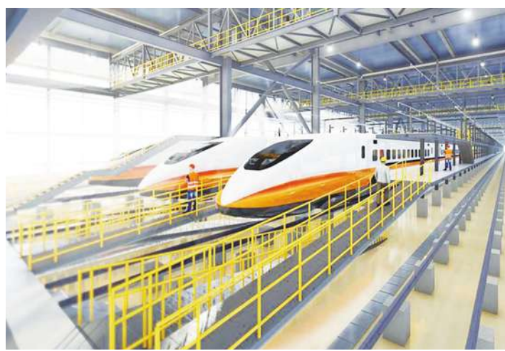
除了宜蘭站與屏東站，更要連結花蓮台東。

始動工、2030年完工通車；向南延伸到屏東，初估完工日期是2031年。交通部長王國材談到宜蘭高鐵站址時曾表示，站址還需考慮未來路線的延伸，工程技術只會越來越強，強調「環島高鐵不是夢」。