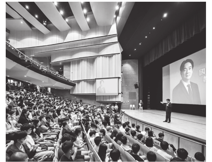
民進黨總統參選人賴清德，選舉前至大學演講，發表政見，最終贏得總統大選。

我很少讓同一位撰稿師跨足兩種不同類型的稿子，這兩種講稿的寫作訓練也大不相同。而且我還堅持：撰稿師負責的