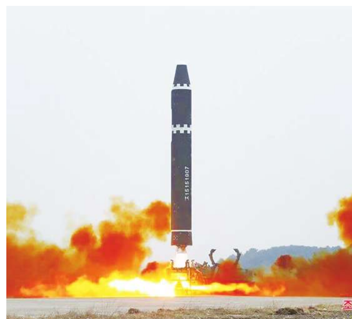
▲ 北韓18日上午發射數枚短程彈道飛彈，依飛行距離判斷，可能用於瞄準南韓軍事設施；南韓執政黨憂心，平壤當局圖藉此影響國會大選及韓美關係。