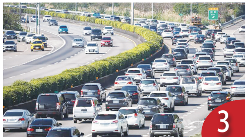
3 國道六號東延 成本難度是挑戰