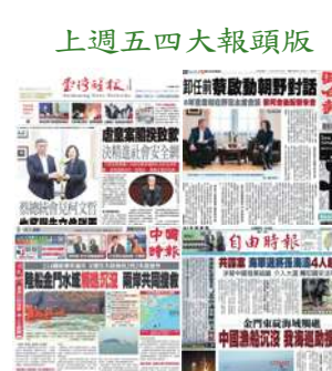
上週五四大報頭版