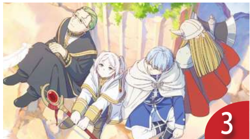
日動漫風靡台 芙莉蓮老少咸宜