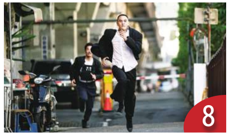
從編劇看《周處除三害》熱潮