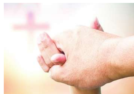
▲ 我們都是罪人，只有照神所吩咐的，學會先去饒恕別人，神就會饒恕我們的罪過。(網路截圖)

同學家長說：「我們借給你的也是辛苦錢，現在不催你還，等你企業經營好轉時，再將本息還給我們。」但借債的家長不同意，最後只還了 20%，其餘 80% 就賴掉了。就在同一時間，另外一位同學家向這位欠債不還的家裡週轉了一筆很小的錢，也還不出來，希望有辦法時，再將本息奉還，但他們不肯，還把他告到法院去