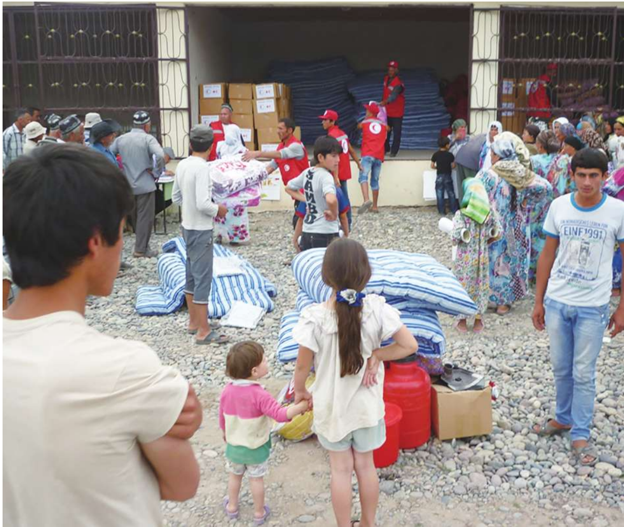
▲ 德國總理蕭茲近日呼籲國際對加薩走廊更多人道支援，並批評以色列的軍事行動沒必要。(示意圖 from Wikimedia Commons)

以哈衝突剛開始時，德國曾相當支持以色列自衛權，但如今也開始對以色列的軍事行動不滿，德國總理蕭茲呼籲各界對加薩走廊人道援助。