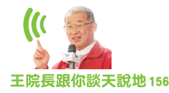
王院長跟你談天說地 156

(本文由本報授權同步刊登於《中時電子報》、《風傳媒》、《優傳媒》與《遠見華人菁英論壇》等網站。)