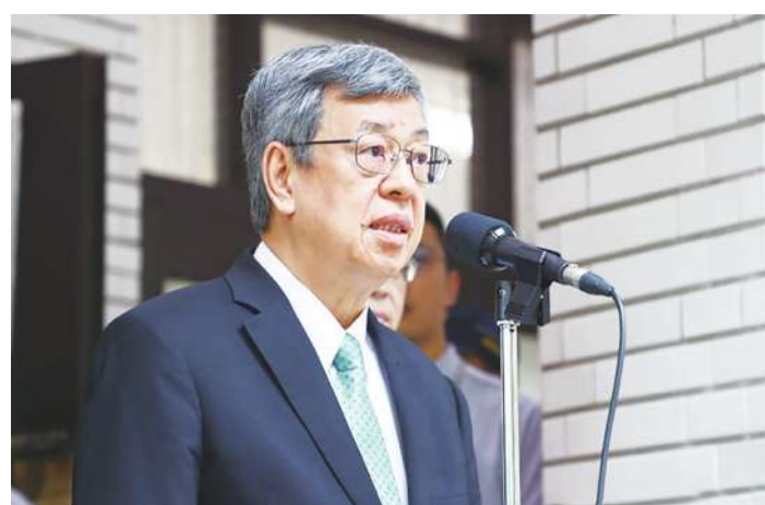
▲ 行政院長陳建仁 17 日出席開幕式時受訪表示，電價會在穩定物價、供電充足前提下調整。(中央社)

【本報記者簡嘉佑台北報導】四月電價再飆漲 10%，用電大戶電價恐飆破 8 元？行政院長陳建仁 17 日受訪時表示，民生電價會針對大小商店、企業進行細緻調整，避免影響物價。台電則強調，電價調漲的事尊重審議會的審議，尚未定案，且過去經驗來看，1001 度以上用戶的電價調漲，已顯著促進節電效益。