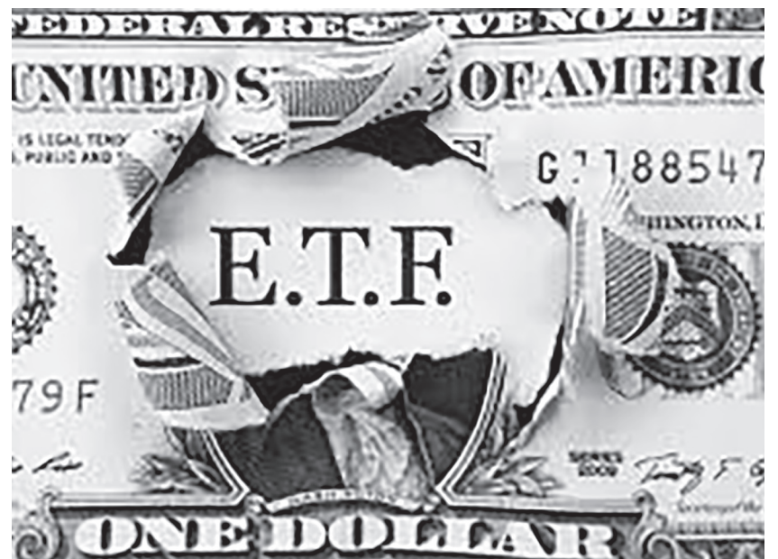
▲「S&P 500」涵蓋了美國最大的五百家上市公司，廣泛地反映了美國大型企業的經濟活動。(網路截圖)