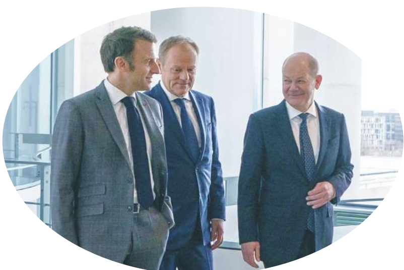
▲ 法國總統馬克宏(左1)近日雖加強對烏克蘭的支持，但因其多說少做的特性，讓各界對其轉變多感質疑。

【本報記者呂翔禾綜合報導】法國總統馬克宏從希望歐洲與俄羅斯對話，到呼籲歐洲支持烏克蘭，其中除了維護歐洲安全以外，還有他個人的選舉考量！由於歐洲議會選舉將至，外界認為馬克宏要透過積極表態支持烏克蘭以爭取選票，但他的言論讓德國很不滿，認為對戰爭太過狂熱，加上他常對自己宣傳太過自信，此舉無法獲得國內外的肯定。