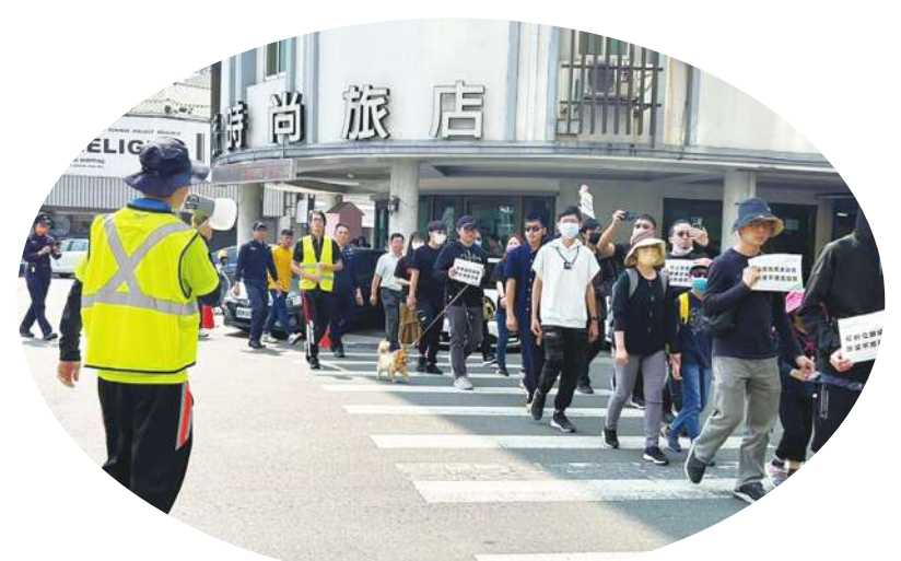
▲ 路權團體 17 日在全台 7 處快閃過馬路，表達對交通部修法「違罪不記點、不開放檢舉」規定的不滿。

【本報記者呂翔禾台北報導】「交通違規微罪不記點，恐讓交通意外繼續發生，立法院應退回修法！」行人零死亡推動聯盟 17 日於全台 7 地快閃過馬路，抗議交通部取消微罪（1200 元以下）違規不記點的規定，恐損害行人路權，也無法讓交通意外死傷數降低。路權團體呼籲立法院退回修法，政府更要從工程做起，徹底改善交通。