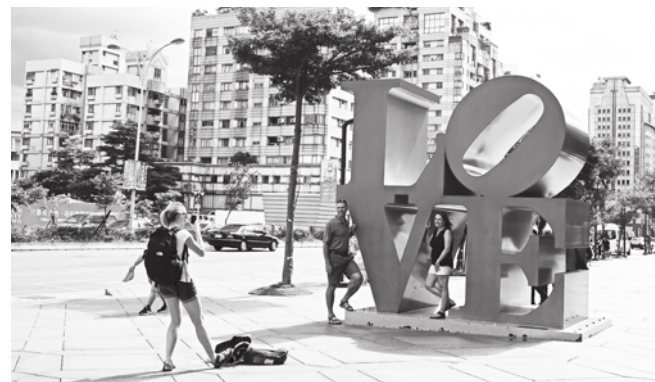
▲中央氣象署指出，21 日冷氣團減弱，加上高壓迴流影響，各地氣溫不僅會回升轉暖，各地都會是多雲到晴的好天氣。

【本報記者簡嘉佑台北報導】18 日全台氣溫驟降，北部、東北部地區氣溫下探 12 度，還會出現暫雨！天氣風險預報員林孝儒表示，因為大陸冷氣團與鋒面影響，全台氣溫 18 日都會下降，民眾應注意保暖。中央氣象署指出，21 日冷氣團減弱，加上高壓迴流影響，全台氣溫不僅會回升轉暖，各地都會是多雲到晴的好天氣。