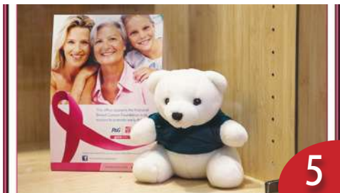
數十萬乳癌資料 可估罹患機率