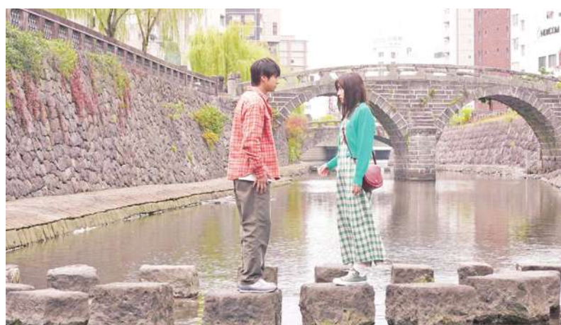
▲▲ 日本長崎知名景點眼鏡橋是日劇「因為你把心給了我」的取景地，吸引旅客前往踩點，帶動旅遊熱潮。(長崎縣觀光連盟提供、日劇劇照)