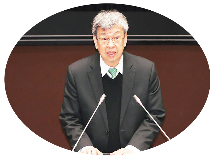
▲ 行政院長陳建仁14日針對虐童案，向外界表達歉意。

陳建仁指出，有關於虐童致死案，對於失去一條無辜的生命，他感到非常地痛心與不捨，這是一件地方跟中央政府必須要共同面對、共同檢討的問題，包括出養制度的審定、委託安置的保母或機構的挑選與督導、地方政府執行訪視作為的過程有無疏失，以及事後的通報調查流程，都有檢討與改進的必要，才能使我們的社會安全網更加完善。