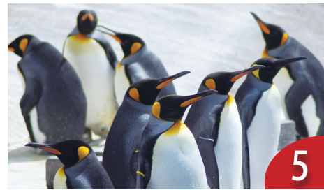
企鵝確診！禽流感波及南極洲