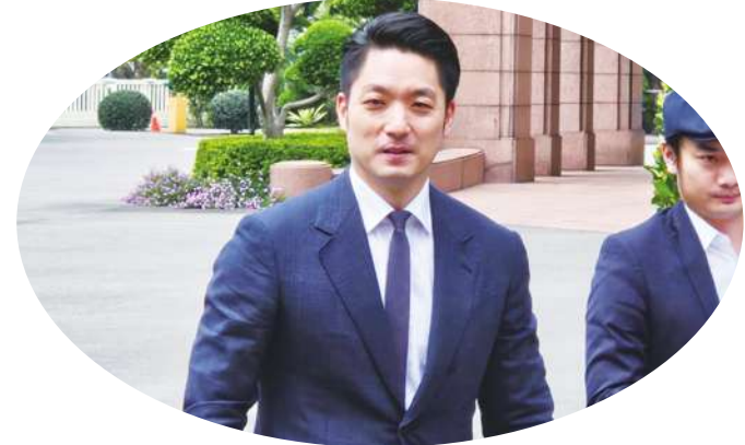
▲台北市長蔣萬安14日特地出席行政院會，就虐童案向中央提出4點建議。

「希望建立保母查詢平台！」蔣萬安強調，他會建議中央設立「保母評鑑推薦平台」，希望由中央統一起來規範，因為很多案件是跨各個縣市，甚至到中南部縣市，有這樣的評鑑推薦平台，未來所有家長，或是有需求的民眾，可以透過資訊的共享在平台上，找到最適合最安全的收養家庭。