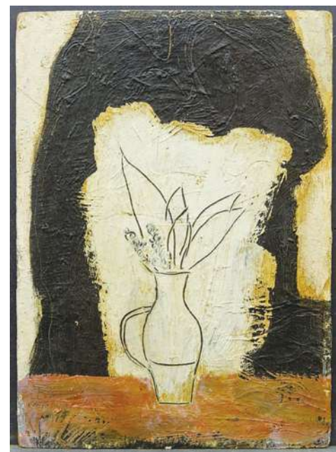
▲常玉生前創作慾望高昂，但生活潦倒，沒有能力購買新畫材，只好把早期畫過裸女的舊作塗掉，重新創作《瓶中花卉》。