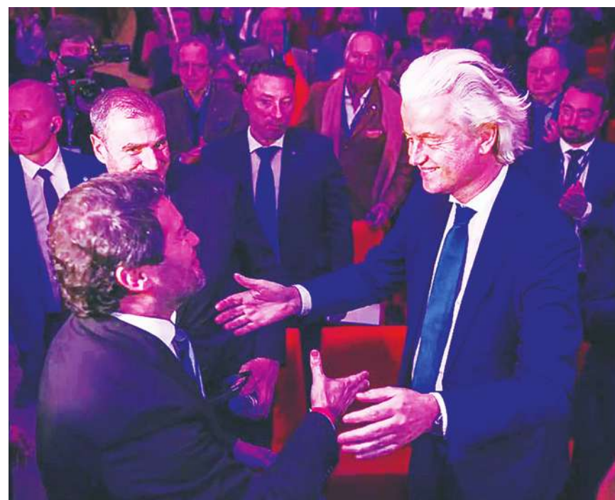
◀荷蘭極右派13日宣布組閣失敗，但這不代表歐洲極右派勢力有消退，且荷蘭政局仍處於不確定狀態。圖為維爾德斯。

荷蘭在去年大選前，長年由自由民主人民黨的呂特擔任首相，他從2010年就任至今，但在去年7月7日，因為政府內部對移民政策有重大分歧，呂特最終向荷蘭國王威廉提出辭呈，並宣布退出政壇。近年來歐洲再度吹起反移民、俄烏戰爭的右派浪潮，包括法國、德國、斯洛伐克與匈牙利都出現右派成長的狀況。