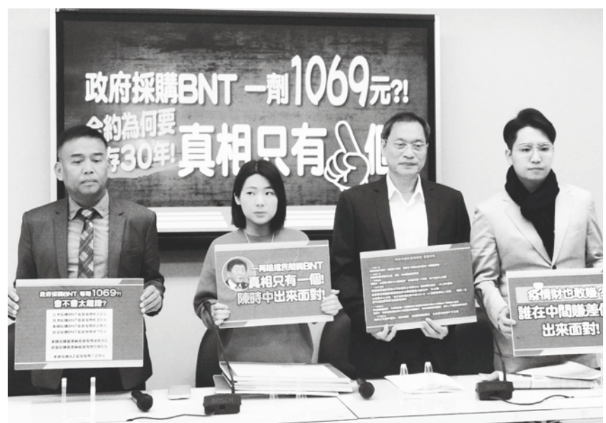
▲ 國民黨團 14 日召開「政府採購 BNT 一劑 1069 元?! 合約為何要封存 30 年! 真相只有一個!」記者會。

苗採購單價係受購買數量、供貨快慢及有無包含冷鏈物流配送等多重條件影響，我國政府於 2021 年 1 月與德國 BNT 公司洽談 500 萬劑疫苗採購合約，且要求首批到貨時間為 2021 年 3 月，但因該公司放棄而未完成簽署，而企業團體於同年 7 月