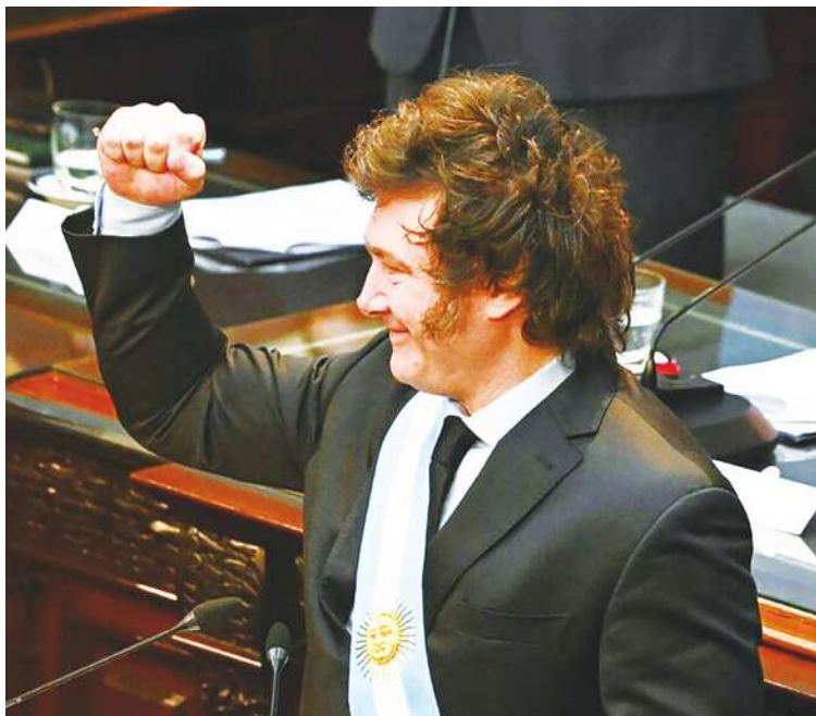
▲阿根廷連兩個月通膨下降，總統麥利自誇是因為財政紀律政策生效。

根據《美聯社》報導，阿根廷統計局12日公布2月通膨率為13.2%，比起1月20.6%與去年12月的25.5%都低，也是該國少數出現通膨率連續2個月下降的狀況。但官方預測3月恐止跌回升，因為能源、燃