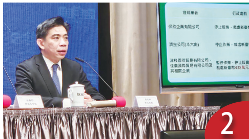
蘇丹紅事件 政院提跨部會檢討