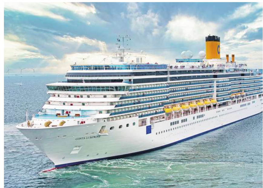
▲ 遊輪示意圖，澳洲富豪帕爾默第三次啟動鐵達尼號計畫 (Titanic II)。