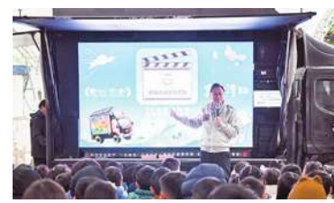
▲美力台灣3D行動電影院開進大園國小，桃園市長張善政期許學生透過電影賞析感受土地之美。

張善政表示，美力台灣3D協會導演曲全立耗盡積蓄，拍攝立體電影並推動行動電影車巡迴計畫，已巡迴全臺逾2000間學校，將3D電影帶進校園與孩子共賞。教育局表示，曲全立透過