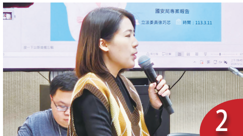
綠營醜聞孰真孰假 有介選疑慮