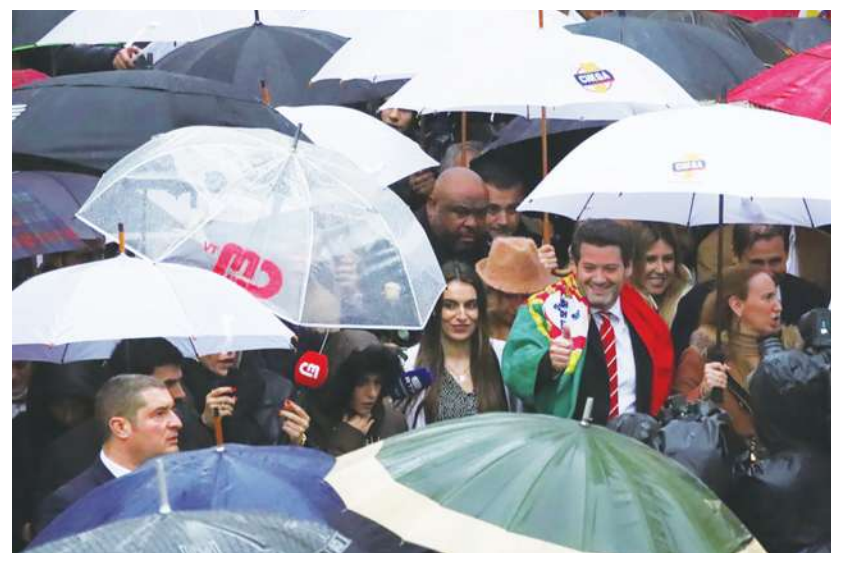
◀葡萄牙大選結果出爐，極右派掌握了關鍵少數，但主流政黨與其結盟機率並不大。圖中為夠了黨黨魁維特拉。

《歐洲新聞網》提到，雖然社會黨讓葡萄牙去年經濟成長回到2.3%，但國內低薪、高物價（尤其是房租）的生活環境，還有執政黨的貪汙醜聞，都讓許多民眾轉向支持極右派的夠了黨，該黨反歐盟、支持警察享有罷工權、呼籲化學閹割性侵犯與恢復終身監禁等主張，吸引了很多選民支持。