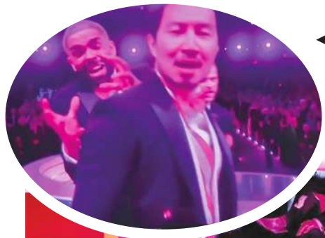
劉思慕在雷恩葛斯林的歌舞表演中客串。