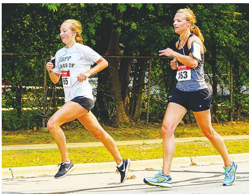
▲運動時化妝，會增加皮膚的負擔。

紐約皮膚科醫師坎普指出，「睡前卸妝是因為化妝品可能會與油脂和死皮細胞結合，堵塞毛孔並造成痘痘形成。同樣的情況也適用於運動時化妝。這項最新研究還指出，運動時化妝可能會讓皮膚更加乾燥。」他認為，雖然睫毛膏、眼線和口紅在運動時可能會為皮膚帶來較少問題，因為不是塗在