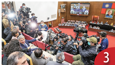
藍提國會改革 5 法 大多不違憲