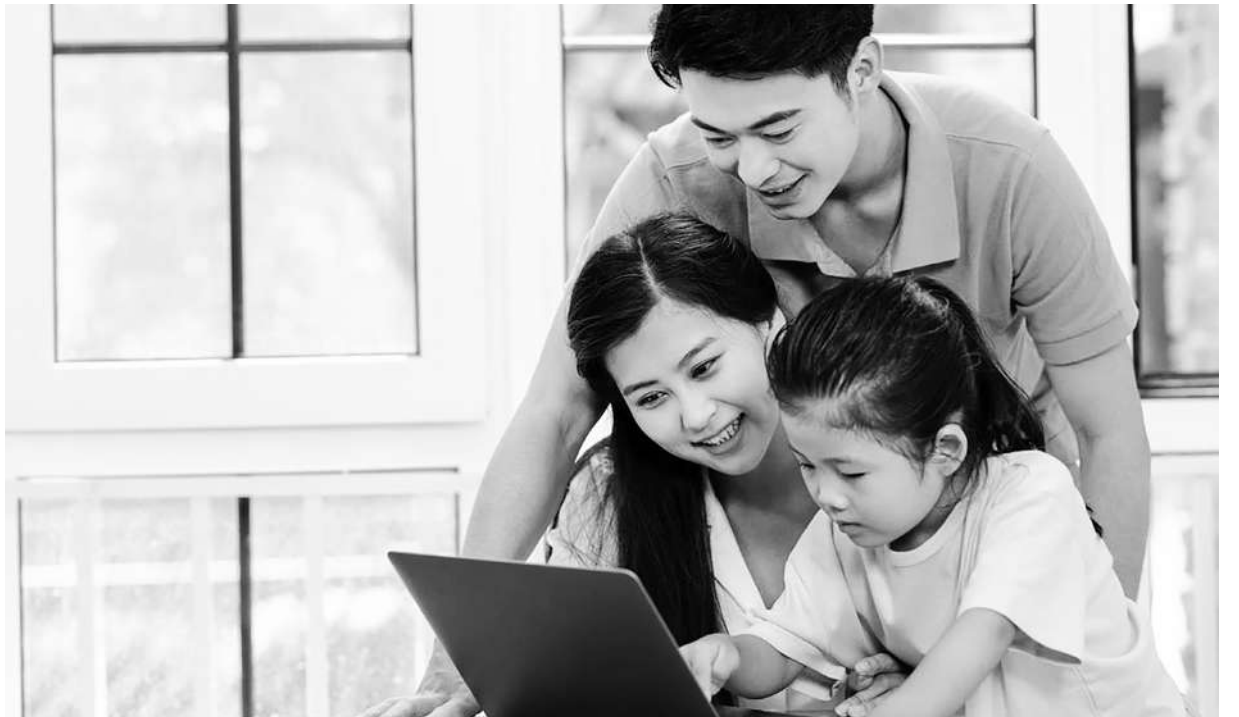
◀ 在孩子需要的時候可以提供陪伴和幫助。

子找到自己的願景(vision)，自我察覺後發現自我能力和願景之間的落差，該採取什麼樣的策略(strategy)去減少差距，當中有哪些方法(approach)可以解決，最後採取實際的行動(implementation)。