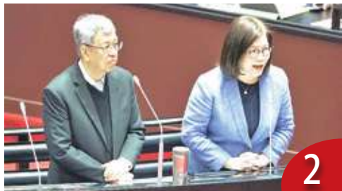
看守官成戰狼 幫下任得罪人？