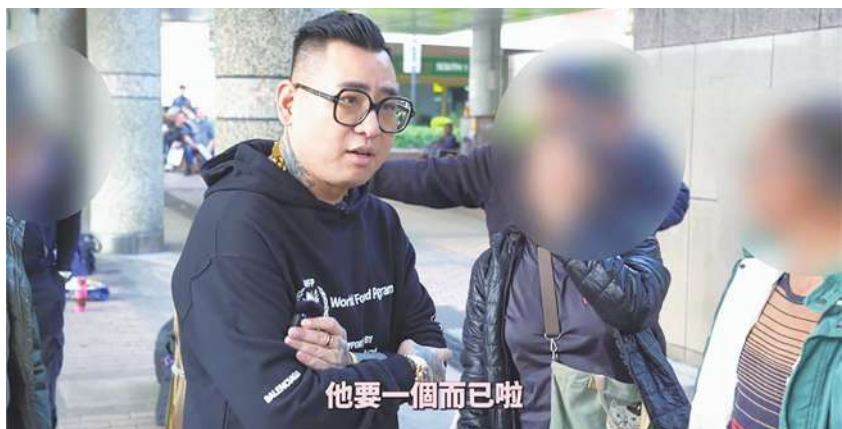
▲ 採訪過程中發生一段插曲，被採訪的街友無預警的吆喝，這裡有人要採訪街友，一個給 1000 元喔，話聲剛落，網紅被一群掛著貪婪嘴臉的街友包圍。(影片截圖)

這幾年學校多了很多慈善團體設立的獎助學金，這些事業有成的叔叔阿姨，希望可以提供家庭弱勢學生經濟援助，讓他們可以專注學習，我也常常