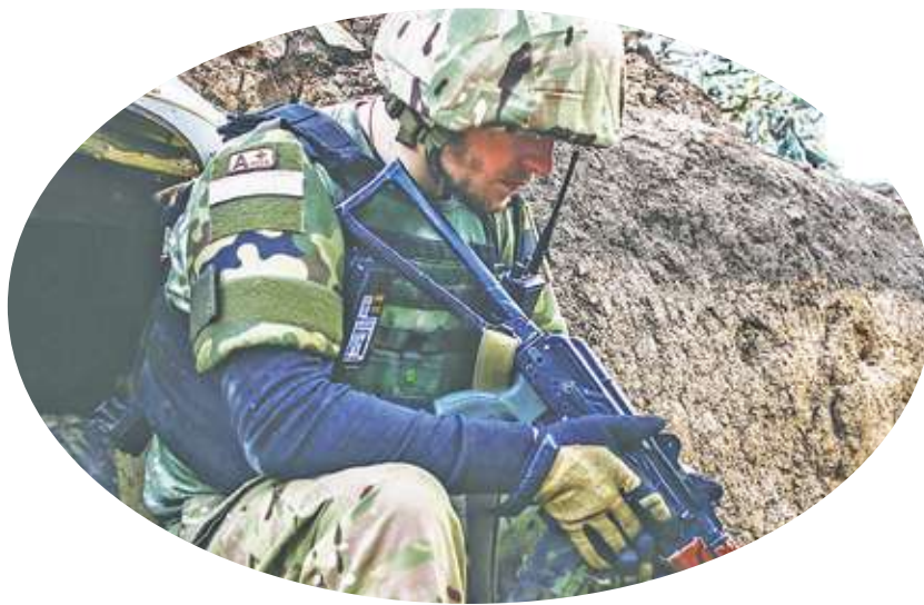
▲由於西方的軍援未到位，烏克蘭甚至考慮與南歐國家聯合生產武器與彈藥。

《WION》提到，由於主要援助烏克蘭的美國，軍援仍在眾議院卡關，讓澤倫斯基非常焦急，近日他頻頻出訪沙烏地與南歐國家，分