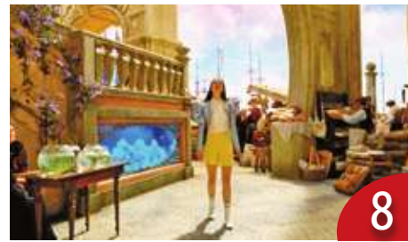
我們都是「可憐的東西」