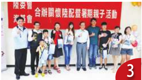
不放寬陸配入籍 民進黨有說法