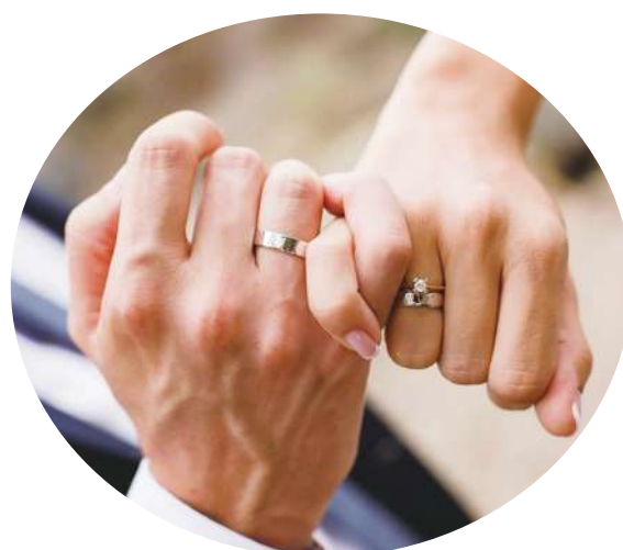
◀ 妻子即使不能做到凡事順服，如果對丈夫多一點尊重，美滿婚姻即有可期。(網路截圖)

網紅還有第二集企劃，他決定主動提供工作給這些他採訪過的街友，要來驗證他們工作可以撐幾天，讓我們拭目以待。