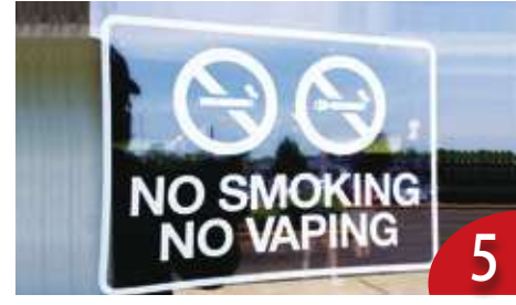
英、紐兒少吸電子煙 政策導致