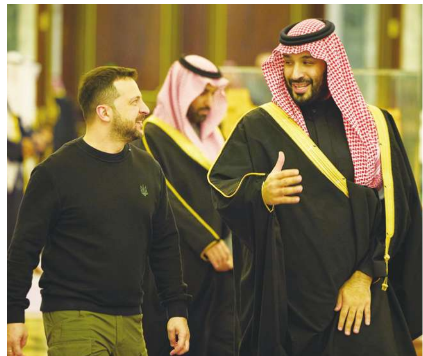
▲ 烏克蘭總統澤倫斯基 27 日訪問沙烏地，盼透過沙國王儲薩勒曼促成俄烏停戰談判。

雖然國際近日有瑞士等國家呼籲中國再次介入俄烏戰爭調停，但因為中國與俄羅斯已經是「無限制戰略夥伴」的關係，讓西方擔心中國不願譴責俄羅斯。