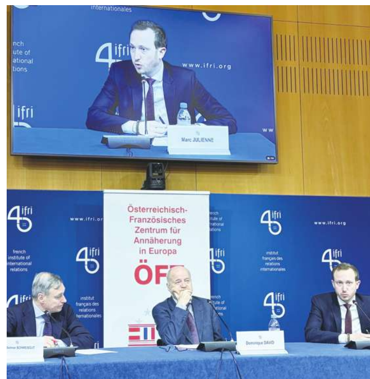
▲ 智庫法國國際關係研究所 27 日舉辦研討會，由智庫主席顧問大衛(Dominique David)(中)主持，邀前歐盟駐中國大使史偉(左)和法國國際關係研究所亞洲研究中心主任朱利安(右)談歐洲的中國戰略，台海局勢是重點之一。