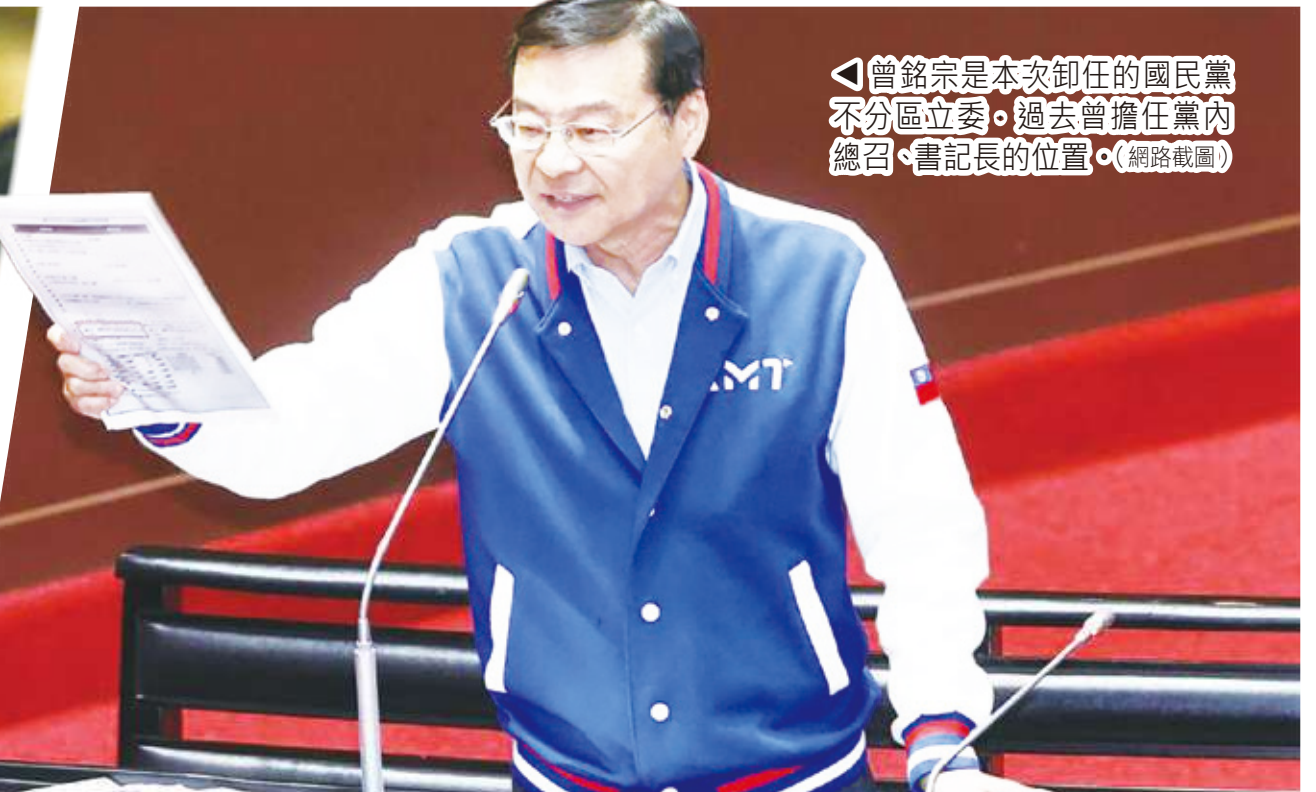
◀曾銘宗是本次卸任的國民黨不分區立委。過去曾擔任黨內總召、書記長的位置。