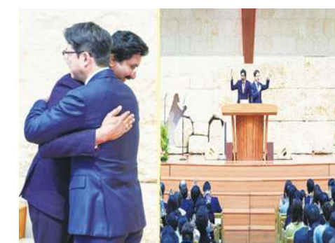
▲ 印度的各各他教會會友人數多達30萬人。

印度是全世界排名對基督徒最不友善國家第11名，當地許多省設置反改宗法以嚇阻基督徒。不過，庫瑪表示，「越多的迫害，就會讓教會越加成長，這就是印度目前的景況。」目前每個月約有3000名印度人信奉基督教。他因此指出，「上帝將一個負擔放