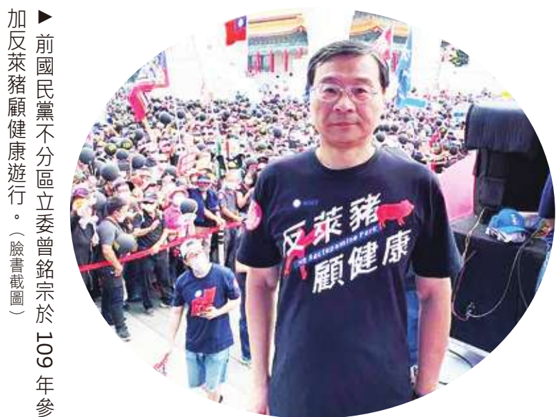
▶前國民黨不分區立委曾銘宗於 109 年參加反萊豬健康遊行。

問：展望國內外，我們的國家未來在金融秩序或改革上，你有沒有什麼建議？ 答：第一個，整個國內的金融太過零碎，太過虛胖，希望能進行合併；二、金融創新，包括數位化、產品創新、通路創新都要進行；三、保護消費者權益，則應督導金融業者，並在販賣金融商品，把風險講清楚。 問：那你個人離開立法院以後，現在的生活是怎樣，可以跟大家分享一下嗎？ 答：我可能暫時先休息一段時間，有機會再出來服務社會或國家。