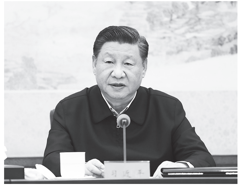
▲習近平在經貿上推動「一帶一路」戰略布局，在軍事上接任中央軍委主席的位子獨佔軍權，在外交上以反西方價值塑造新的國際秩序，這些都在讓中國走向更加極權的時代。

百六十艘各式戰艦，包括護衛艦、軍艦和導彈驅逐艦等，還有一支由六十多艘潛艇組成的潛艇部隊，其中一些潛艇配備俄羅斯製造的專門用來對付航母的巡航飛彈。二〇一二年，中國的洲際彈道飛彈技術不斷推進，提高向美國發射核彈頭的能力。該年年底，中國第一艘航空母艦下水試航——這艘船是在原蘇聯的一艘舊船的基礎上改造的，被命名為「遼寧號」。