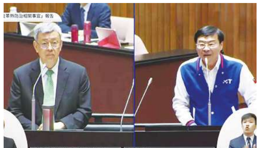
▲前國民黨總召曾銘宗 (圖左) 當任立委期間於立法院院會質詢行政院長陳建仁 (圖右)。