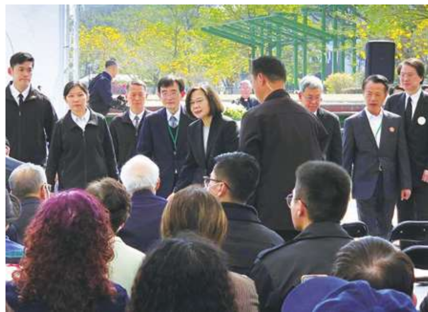
▲總統蔡英文(中)在嘉義縣政府前廣場向受難者家屬致意。

他也指出，近年《蔣中正日記》、《蔣經國日記》陸續出版，他平時也看前總統府資政辜寬敏與前行政院長郝柏村的回憶錄，即使兩個族群差異這麼多的人，都一起為台灣的未來努力，記住歷史教訓的同時，他也會更努力促成台灣成為更加多元尊重的和諧社會。