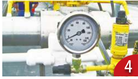
綠氨搶商機！肥料也能做燃料