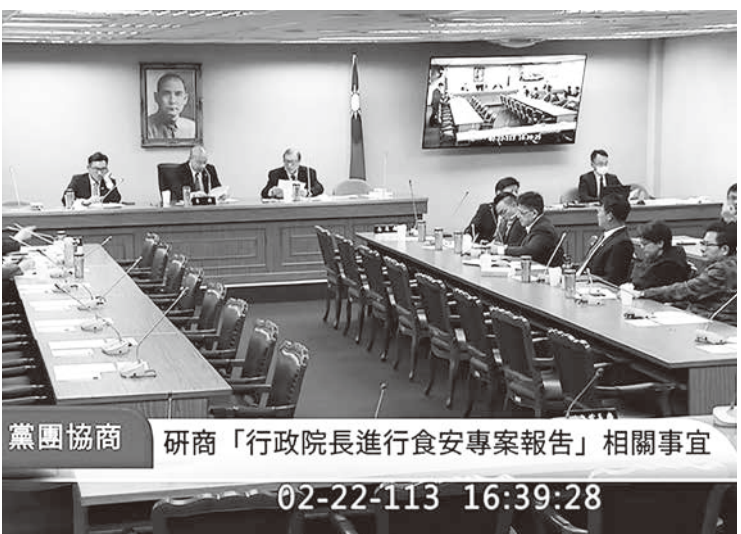
黨團協商 研商「行政院長進行食安專案報告」相關事宜 02-22-113 16:39:28

國民黨、民進黨與民眾黨分別推派 7 位、7 位與 1 位立委質詢，每位委員詢答時間 15 分鐘，質詢順序依例授權議事處辦理。名單請於 23 日上午 8 時 30 分前送交議事處彙整。