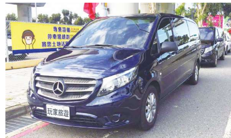
▲ 賓士9人座休旅車。