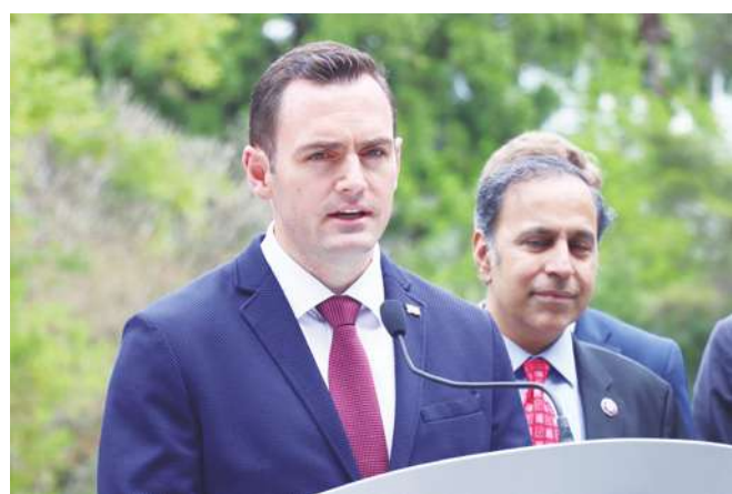
▲美國眾議院美中戰略競爭特別委員會主席蓋拉格說，美台應與夥伴建立經濟協調機制，抵制經濟脅迫行為。

【本報記者呂翔禾台北報導】「即使是美國前總統川普當選，從政府到國會都會支持台灣！」美國眾議院「美中戰略競爭特別委員會」主席蓋拉格22日率團訪台，被媒體問到若川普當選是否會支持台灣？蓋拉格表示會，且國會將透過立法，確保無論誰上台，援助台灣都有法律依據。針對軍購持續延宕交貨，眾議員克利什納穆希表示會協助催促。