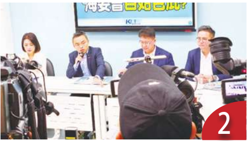
2 陸船翻覆無錄影？藍促說清楚