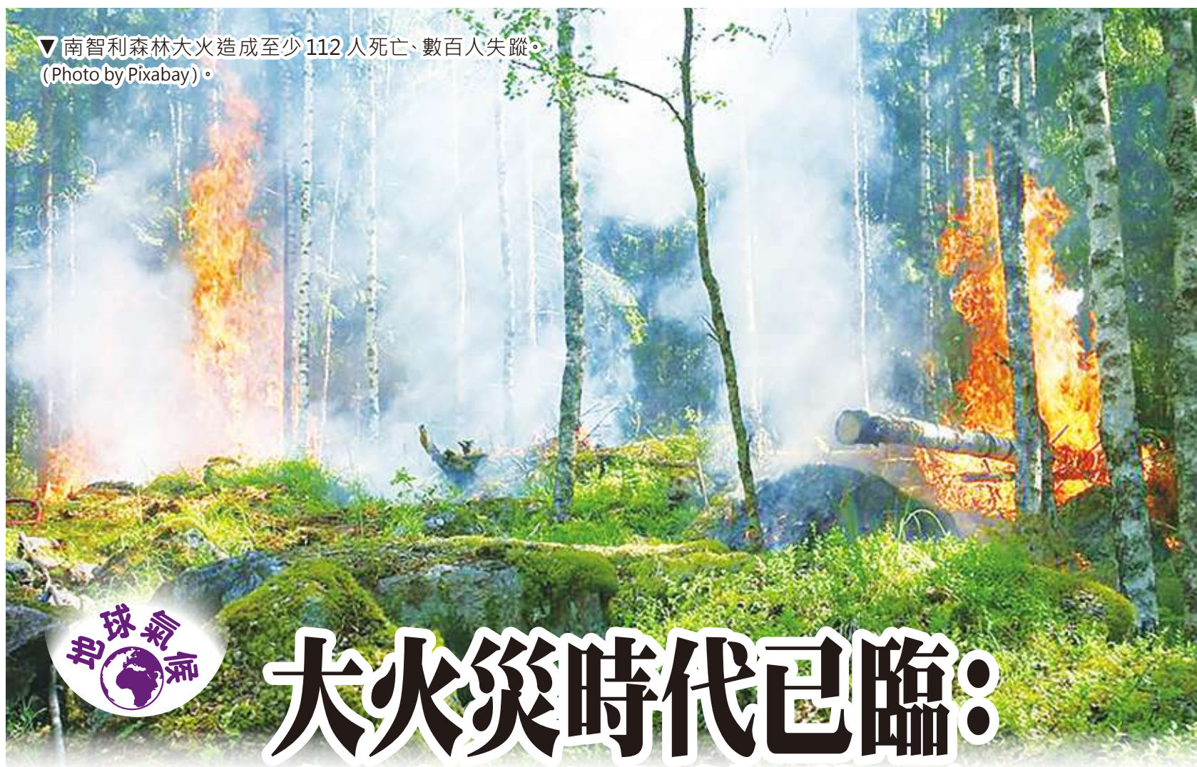
▼南智利森林大火造成至少112人死亡、數百人失蹤。