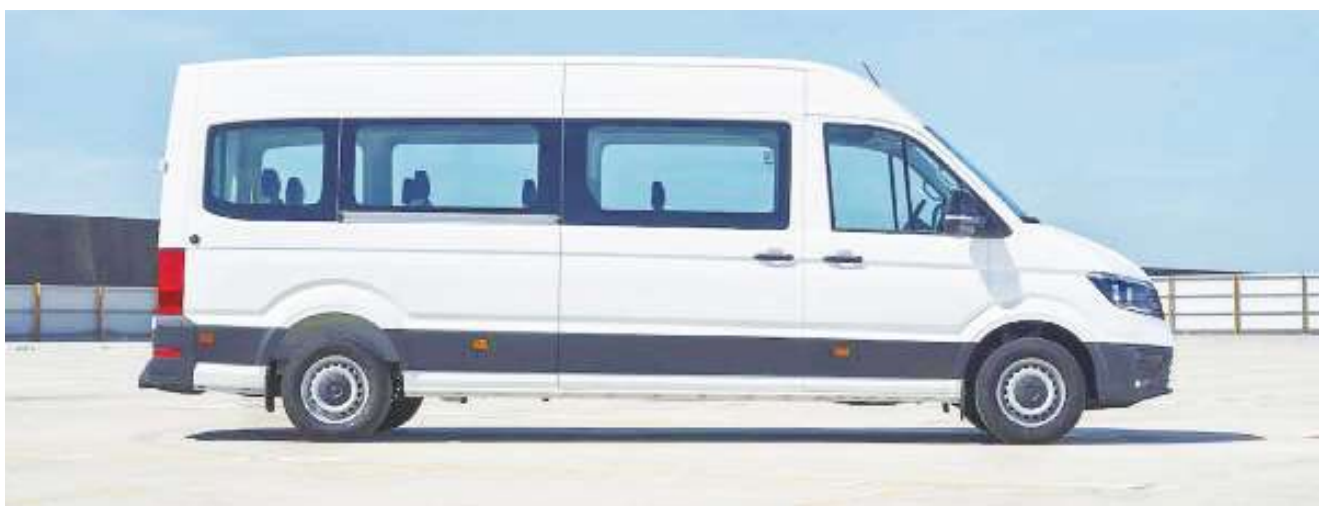
▲ 台灣特有超長9人座小客車。(網路截圖)