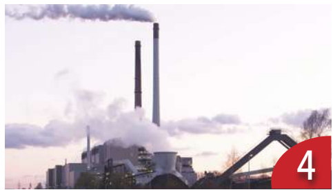
4 中國能耗超經濟 難達成減碳目標