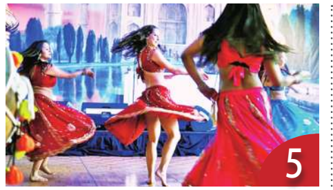
5 寶萊塢發威 印度電影特效重鎮