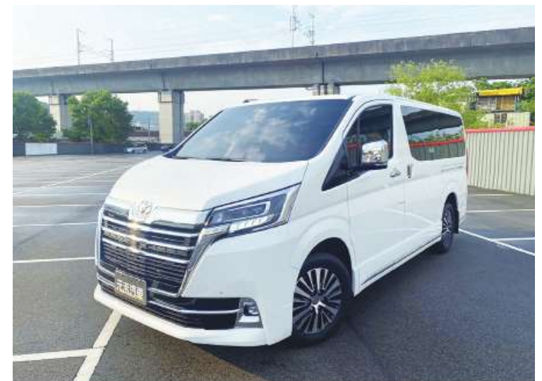
▲ 豐田9人座休旅車。