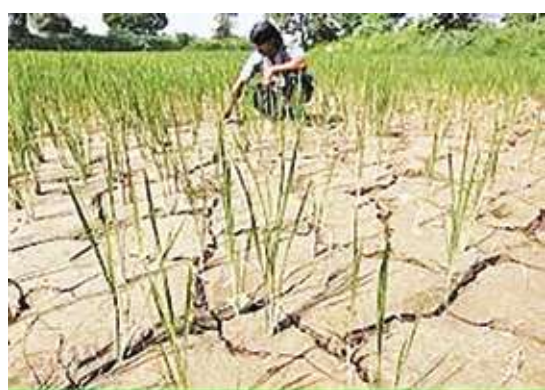
▲智利中部地區正經歷一個百年來持續最長的乾旱，降雨長期不足以致土壤十分乾燥。

實際上，從二月二日開始，智利中部和南部就爆發了一系列嚴重的森林大火，全國共有近2百起火場。該國總統宣佈