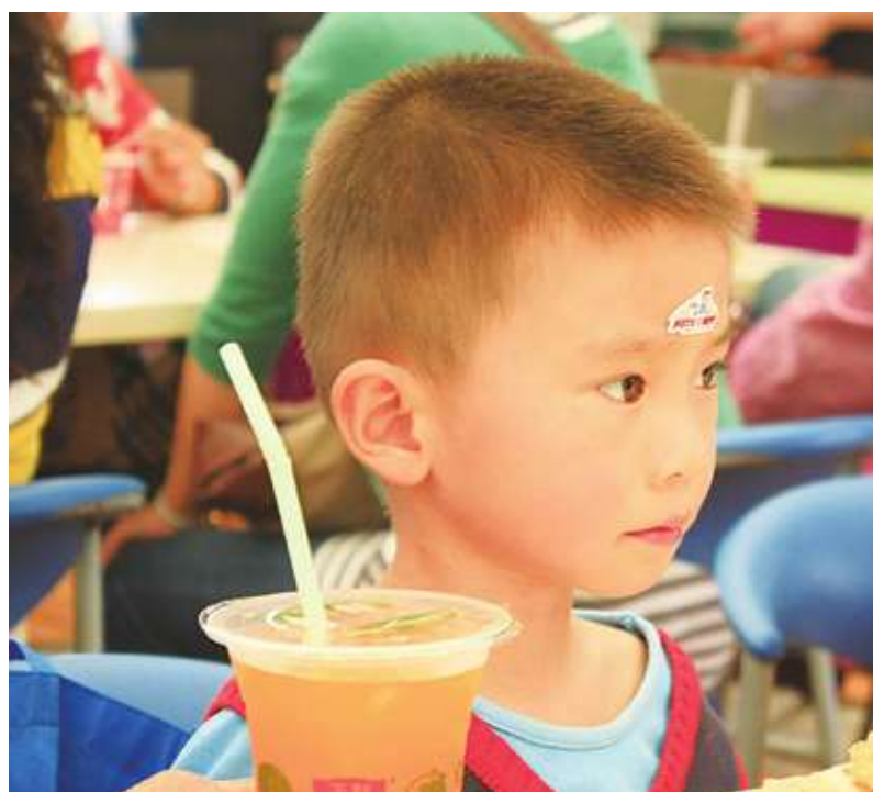
▲ 在中國養育孩子，讓女性的工時與薪資也跟著降低。

孩子在上小學之前，祖父母參與 8 成育兒工作，上小學之後則佔 60%，如果女性生完孩子後想要保住工作，祖父母是不可或缺的。