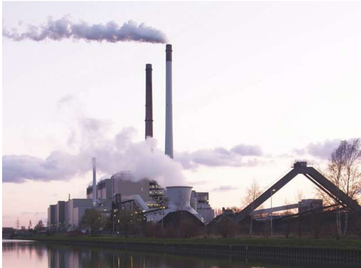
▲ 中國再生能源雖以每年 8.5% 的幅度增長，但仍難讓中國達到 2025 年的減碳目標。

【本報記者呂翔禾綜合報導】雖然中國積極發展再生能源，但仍難壓下碳排成長速度！外媒報導，中國去年能源消耗量比前年成長 5.7%，且在近 3 年還以每年 3.8% 速度成長，若照此下去恐難達成 2025 年非化石燃料 20%、減少碳密度 18% 的目標。但中國清潔能源的發電量也有以每年 8.5% 的速度成長，但仍難覆蓋碳排成長速度。