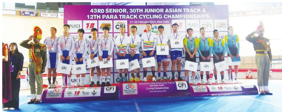
▲第 43 屆亞洲自由車場地錦標賽暨第 30 屆亞洲青年自由車場地錦標賽 21 日在新德里登場，台灣隊在男子青年團體（正中 5 名白衣者）追逐賽項目勇奪金牌。