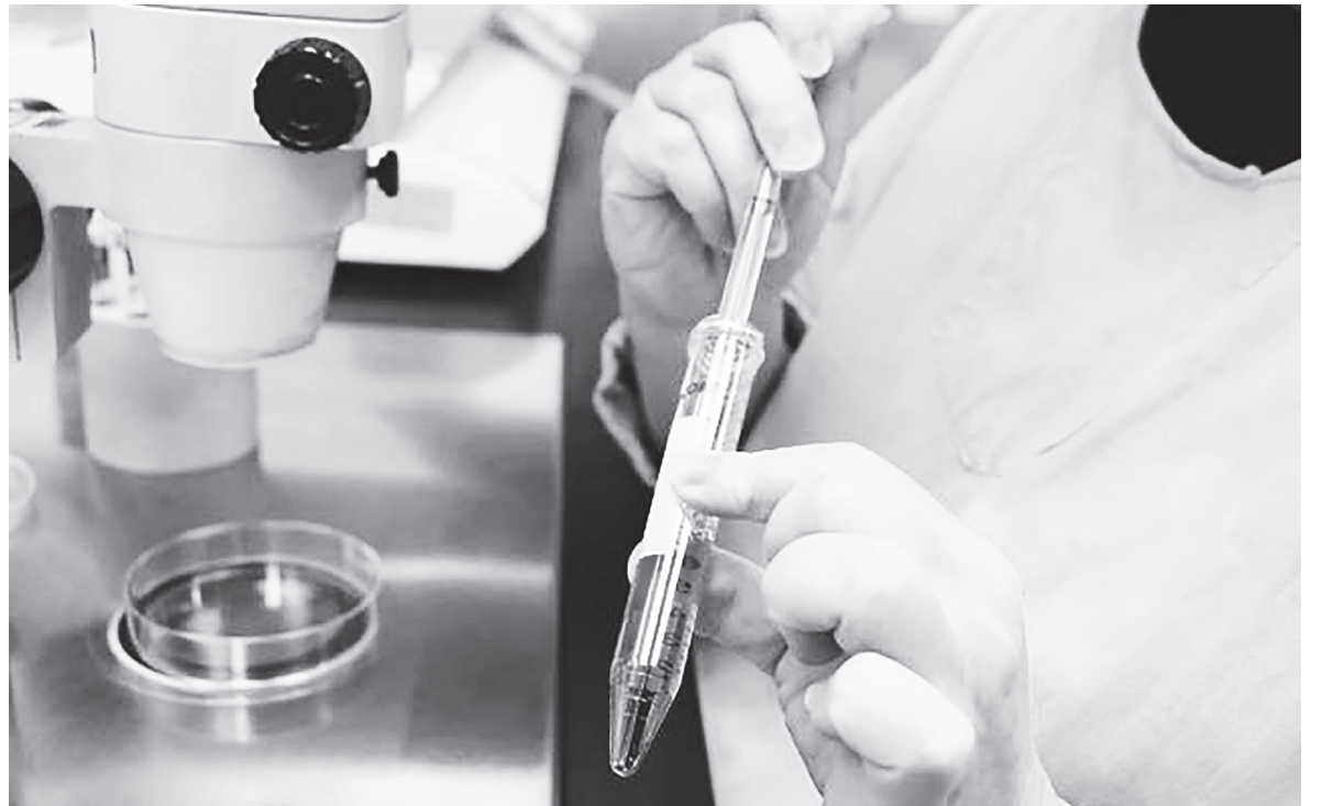
▲國健署鬆綁試管嬰兒補助資格後，有2萬多不孕夫妻進行試管嬰兒療程。

這樣的說法是不是充斥在你的日常生活中？有些人寧可抱持神農嘗百草的精神，盲信「寧可信其有」而採用各種調養偏方；有些人則像縮頭烏龜，害怕正視自己的生育問題。對於想懷孕的夫妻，這些都是