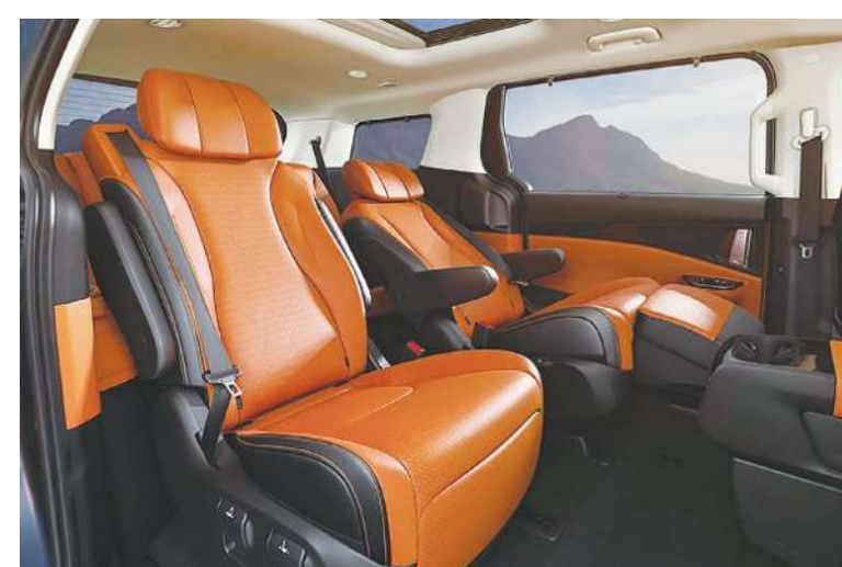
▲ 大型休旅車強調舒適內裝。(網路截圖)

如果自有車輛的車況不是很好，或者年份久遠，都應該考慮租用較新車款出遊。如果是人數問題，更是不妥妥協的項目。另外是傳統地圖最好還是買來備用。現今時代雖然網路發達，GPS好用，卻是還有英雄無用武之地的時候，特別是往鄉下、山間的風景區，網路還是有中斷的情況。所以買一本新版的地圖書是需要的。