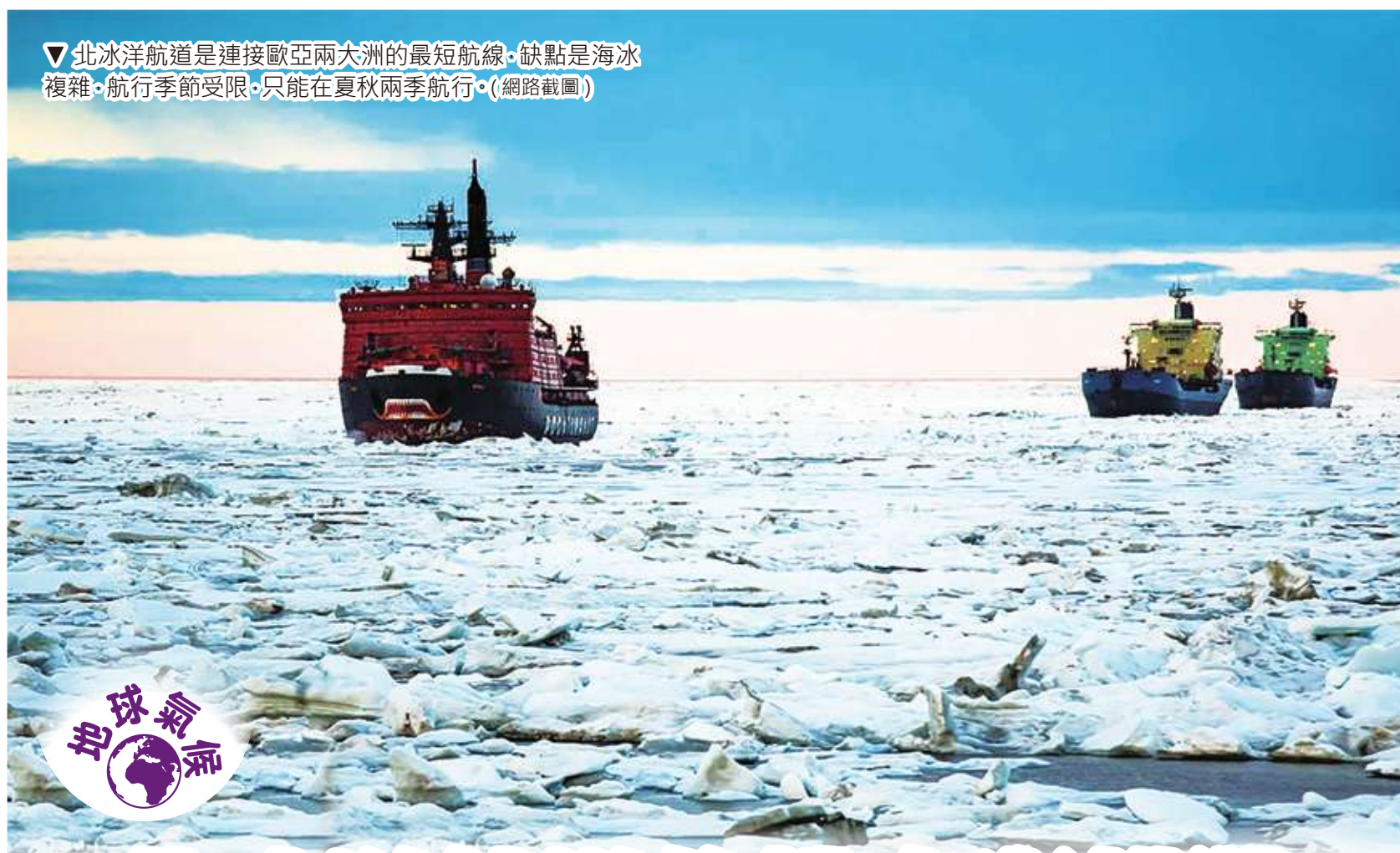
▼北冰洋航道是連接歐亞兩大洲的最短航線。缺點是海冰複雜、航行季節受限，只能在夏秋兩季航行。