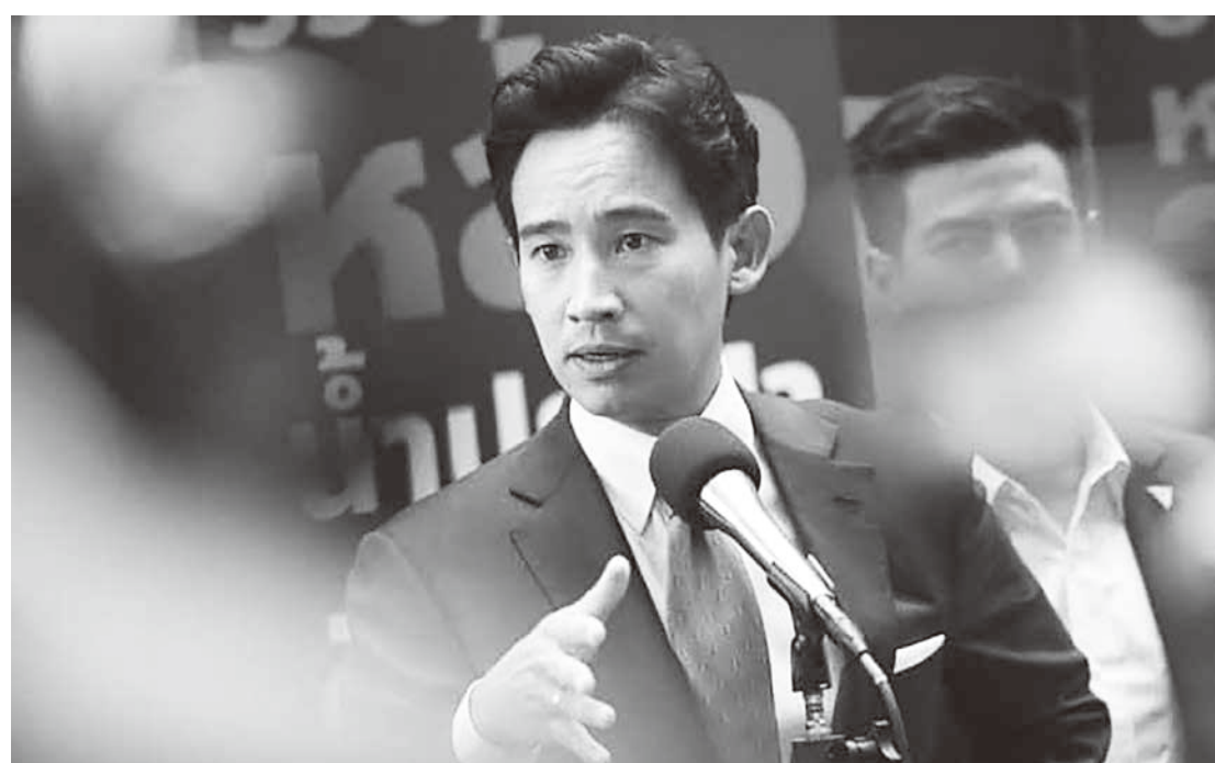
▲ 泰國最大反對黨近日因證件遭法院認定違憲，恐面臨被解散的命運。圖為皮塔。

率領前進行動黨獲得國會多數，被王室與軍方認定為威脅既有勢力存在的隱患，因此在軍方掌握的參議院遲遲不通過皮塔的組閣方案，也讓他最後無法擔任總理，便由其他小黨組成聯合政府。