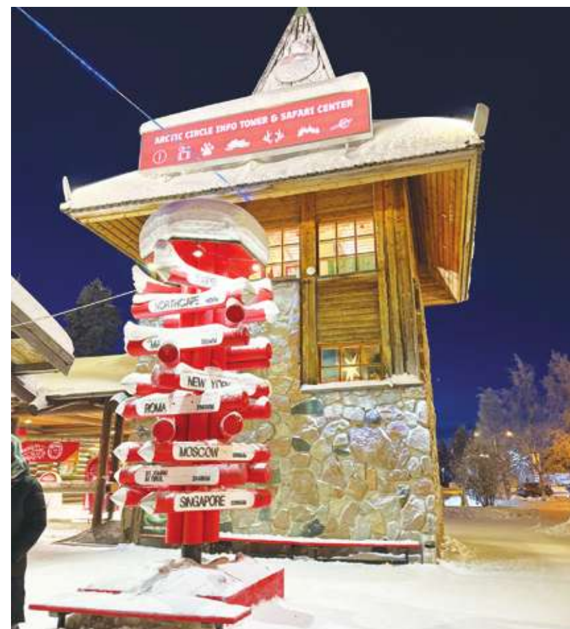
▲ 台北距離耶誕老人村 7804 公里，不是最遠卻列城市之塔頂。

有一隻藍眼的哈士奇被單獨拴在戶外，她好奇地圍繞人打轉，我給了她一塊餅乾，卻只見她不慌不忙地嚼起餅乾，走到角落刨了個洞，用鼻鏟雪把餅乾封藏起來，懂得冬藏，真不愧是最聰明的狗。