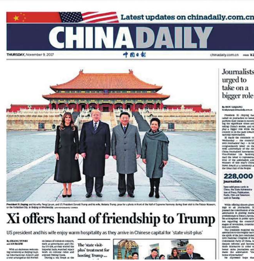
▲中國日報過去三年半共砸下一九〇萬美元，在美國媒體上付費刊登看似一般新聞報導的廣告插頁，進行政治宣傳的居心至為明顯。（中國日報網頁截圖）