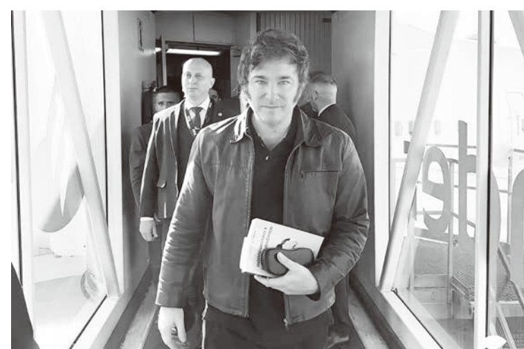
▲ 阿根廷總統麥利31日推動經濟改革法案，但目前遭遇不小阻礙。(Javier Milei/FB)

拉丁美洲國家過去經濟大多以進口替代為主，多數國家由左派政府執政，但後來並未能延續經濟發展動能，因此成長不如預期。以智利而言，在獨裁者皮諾契特將軍於1974年推翻原左派總統阿連德，政變上台後，也將過去智利偏左派的經濟體系，交由右派經濟學家改革。