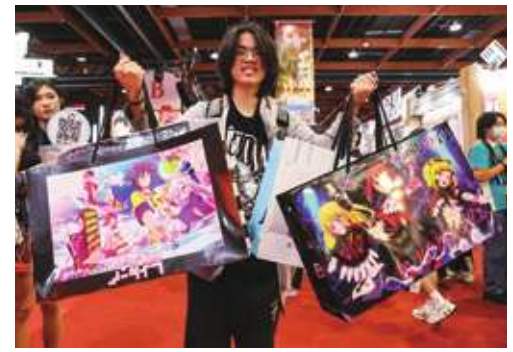
▲第12屆台北國際動漫節1日上午在世貿1館盛大開幕，吸引許多動漫迷前來逛展，有民眾開心秀出購買的福袋、周邊商品。（中央社）

近動漫出版同業協進會永久顧問、前民進黨立委賴品好表示，擔任立委時，就相當關注多媒體科系的發展，今年動漫節也特別展示台灣Vtuber（以虛擬人物形在網路平台上傳影片或進行直播的創作者）聯名攤位，也讓她不禁產生興趣。