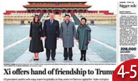
百位外媒記者參與的中國變遷