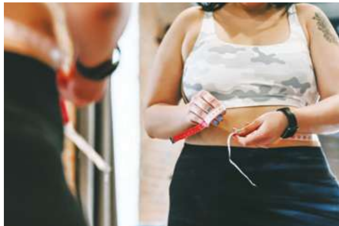
研究就指出，不僅 BMI 指數愈高，民眾是猝死的高風險族群。

冬天因為溫度下降，血流速度變慢，身體更容易出現微型的血塊，如果有心臟力道不足、慢性發炎或血管冠徑過窄等狀況，就從微血管堵塞，開始出