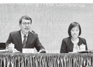
▲國發會 1 日在行政院推出「地方創生 3.0」，盼擴大協助青年就業與地方發展。

國發會官員表示，希望引進更多民間企業參與地方創生，目前地方創生累積通過案數從 2019 年到 2020 年的 68 項，逐漸提升到 2021 到 2023 年的 318 項，並透過與教育部、經濟部、原民會與交通部等部會