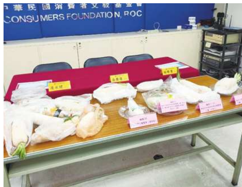
▲ 消基會召開「市售白蘿蔔農藥殘留檢測」18 件樣品有 5 件不合格」記者會，消基會呼籲食藥署強化抽驗，農業部加強產地用藥輔導。

消基會於去年 11 月至 12 月在六都及南投縣的批發市場、農會生鮮超市、連鎖超市及傳統市場等地購買 18 件樣品僅 8 件樣品未檢出農藥，其餘樣品至少檢出一項農藥，還有 1 件更檢出 11 項農藥殘留。