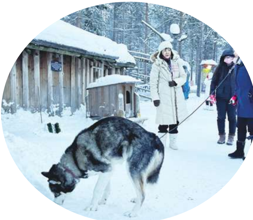
▲ 哈士奇用鼻鏟雪把餅乾封藏起來，懂得冬藏，真不愧是最聰明的狗。