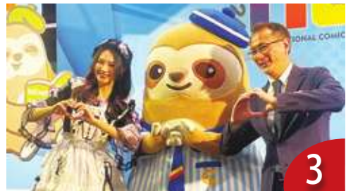
動漫展成長 4 成 Vtuber 成趨勢