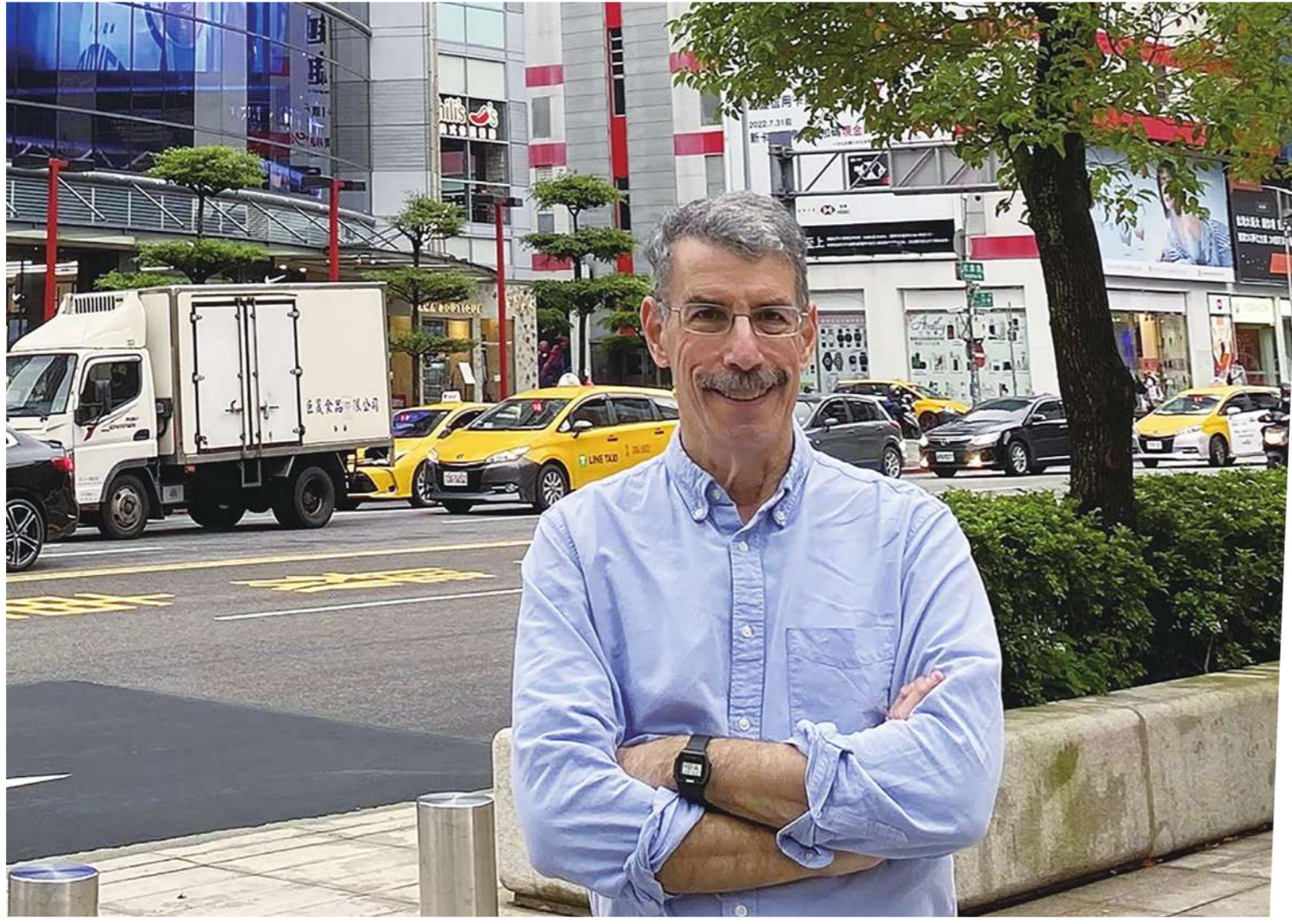
▲齊邁可表示：駐華記者的共同挑戰，如何在不信任外界的中國報導真相。本書帶我們從駐華記者的視角，親臨歷史現場。（網路截圖）

從一九四〇年代的國共內戰到 COVID-19 疫情，齊邁可匯集了上百位傑出記者的口述經歷，呈現報導歷史性時刻的幕後故事。