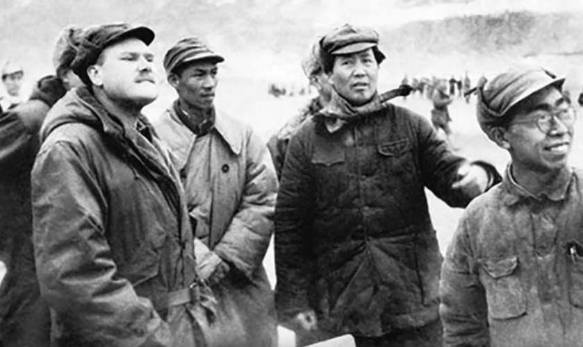
▲美資深記者約翰羅德里克（左一）與毛澤東在延安機場等候國共談判代表周恩來。