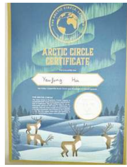
▲ 聖誕老人村遊客會獲贈北極圈證書。