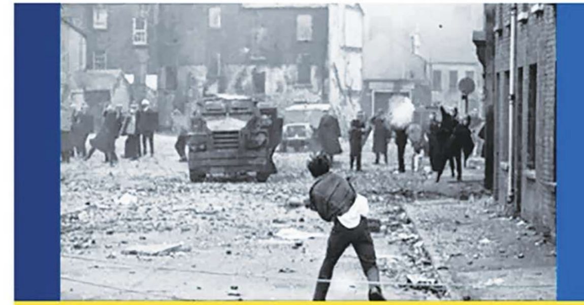
Back to the future: Protests that heralded civil strife in Northern Ireland, left, seem to echo in