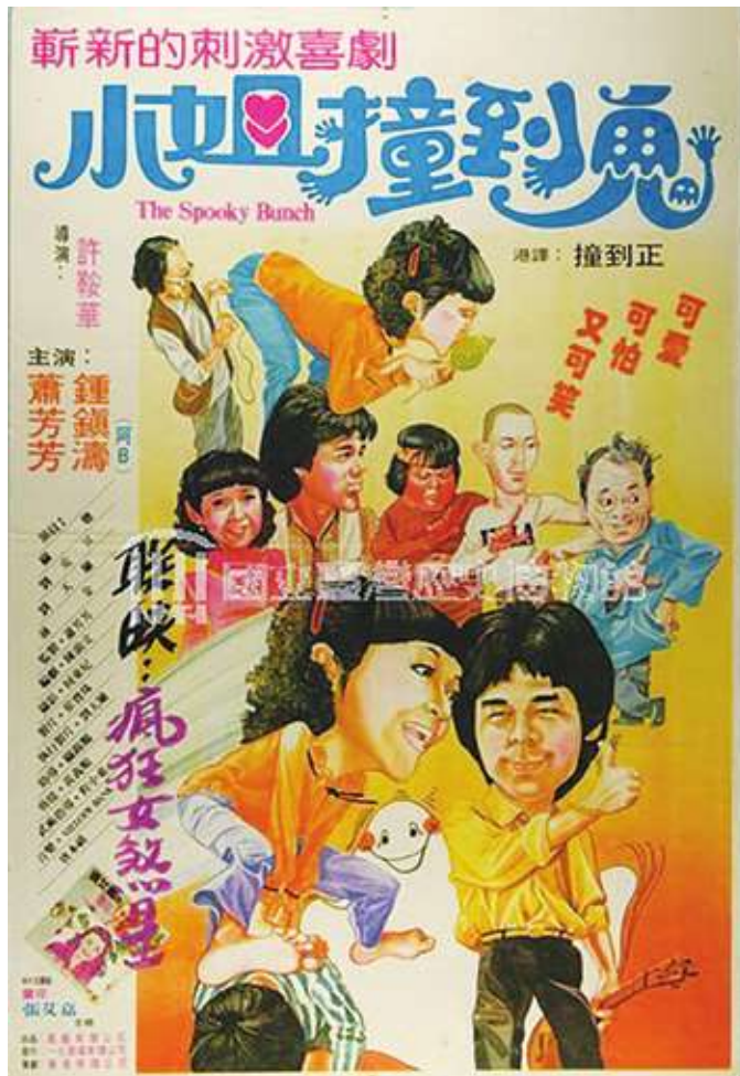
香港片《小姐撞到鬼》為第17屆金馬獎的觀摩作品之一。(電影宣傳海報)