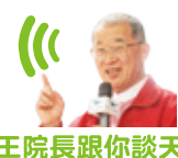
王院長跟你談天說地 150

(本文由本報授權同步刊登於《中時電子報》、《風傳媒》、《優傳媒》與《遠見華人菁英論壇》等網站。)