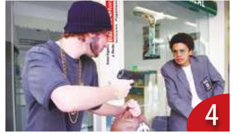
搶劫輕罪化 美國治安瀕臨失控