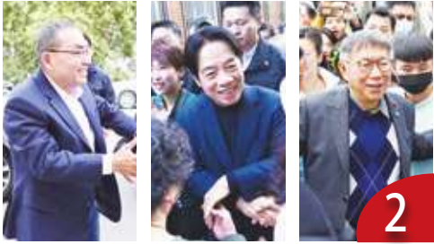
謝票造勢 藍綠白選後續比人氣