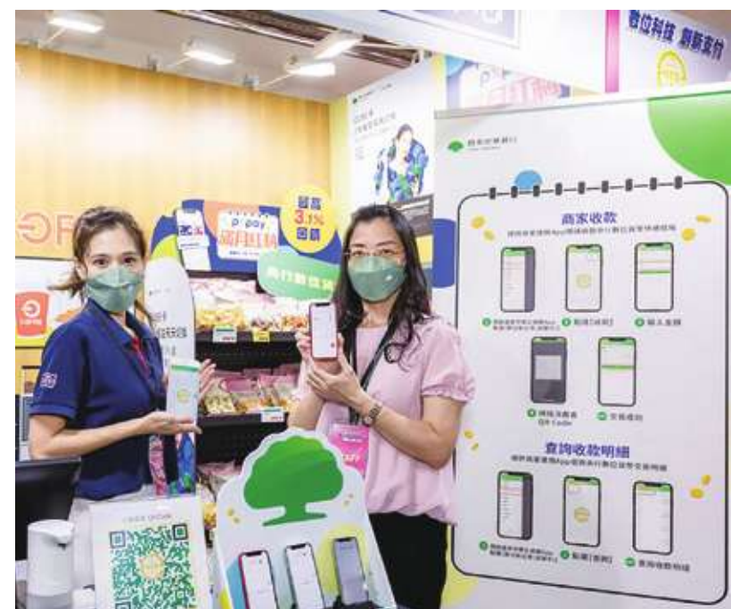
▲支付管道多元，企業有許多選擇，票據減少是可以預期的現象。

央行統計，去年 12 月票據交換張數為 380 萬 4464 張，較 11 月減少 24.53%，票據交換金額為 1 兆 31 億元，較 11 月減少 8.27%。觀察 2023 年全年表現，在 2022 年全年退票金額下探 349.3 億元的歷史新低後，2023 年雖略有回升，也僅 351.6 億元水準，寫下歷史次低。