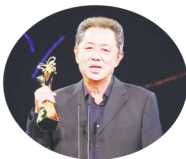
臺灣電影導演朱延平。