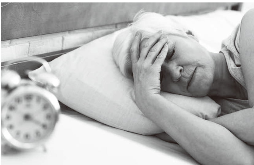
▲ 老人家睡不著覺，其影響並不足以致命。如果晚上睡不著，就改睡午覺吧！(網路截圖)

因為生存價值是主觀感受，無法刻意創造；算再怎麼焦急尋找，也未必能夠找到，且越是焦急，越是容易令自己陷入痛苦。