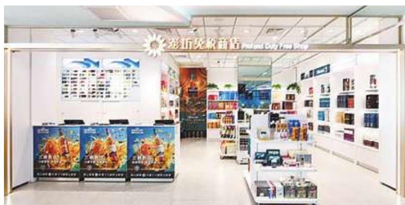
▲圖為小琉球免稅商店。若入境免稅額拍板調升至 3.5 萬元，調幅也與物價漲幅大致相當，推估最快可望於今年上半年以前實施。(網路截圖)

財政部決參考物價漲幅與國際標準，簽報行政院調高免稅額，具體調幅待拍板後正式對外公告，最快於上半年實施。