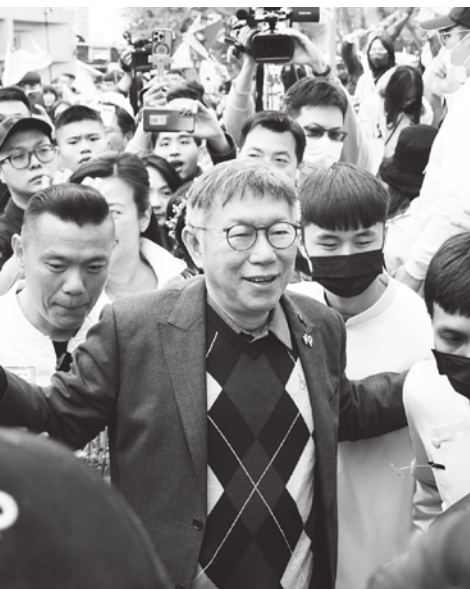
▲藍綠白近日週末都展開謝票行程，雖然選舉結束，各黨仍認真謝票，彰顯支持向心力強大的現象。

【本報記者呂翔禾台北報導】政黨競爭不會因選舉結束，各黨也互相比拚誰的謝票場子較火熱！