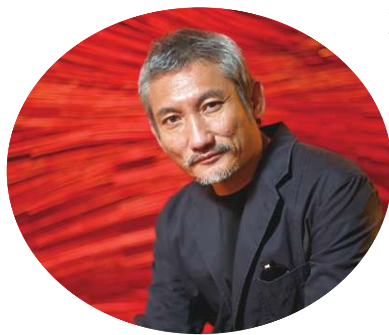
徐克為華語電影導演、編劇、監製、演員。