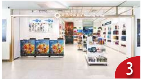
入境免稅額 3.5 萬 估上半年落實