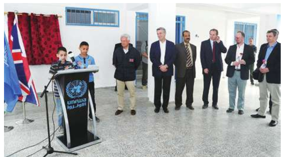
▲聯合國巴勒斯坦人道辦公室27日遭爆有恐怖份子混入，西方國家紛紛暫停援助。