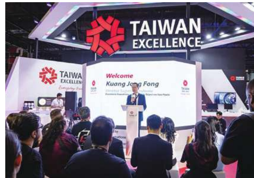
▲預期 2024 年全球半導體銷售額有望成長，有助於帶動台灣外貿表現回溫。圖為經濟部國際貿易署及外貿協會共同策劃的台灣精品館。

台經院景氣預測中心主任孫明德分析，紅海危機和聖嬰現象導致全球物流混亂，貨輪因蘇伊士運河風險改繞行好望角，巴拿馬運河因聖嬰現象造成乾旱而運量減半，都將進一步推升貨運物流成本。