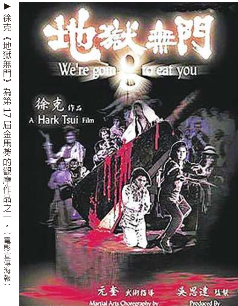
徐克《地獄無門》為第16屆金馬獎的觀摩作品之一。(電影宣傳海報)