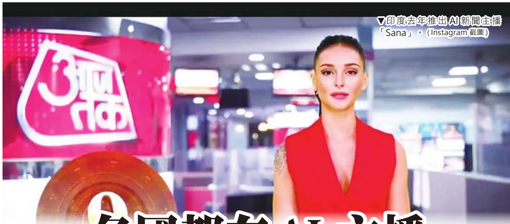
印度去年推出AI新聞主播「Sana」。