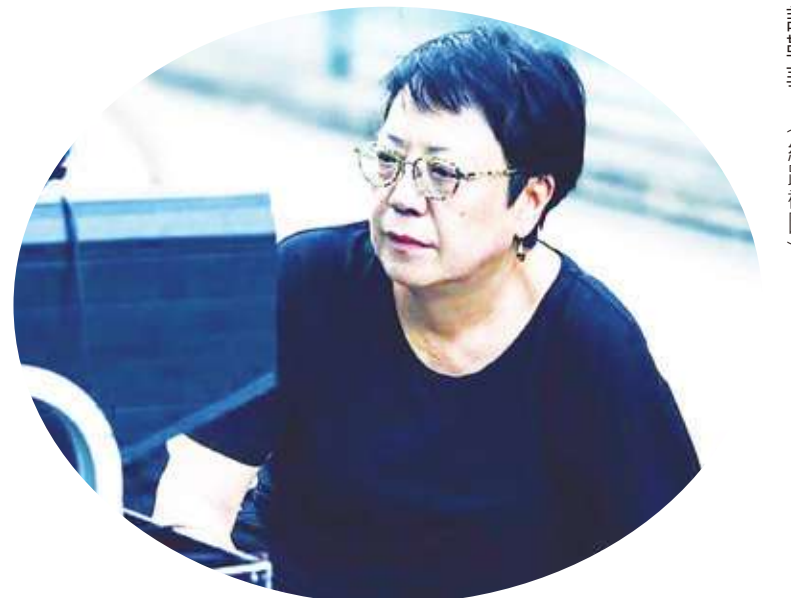
全球首位獲威尼斯影展終身成就獎的女導演許鞍華。(網路截圖)