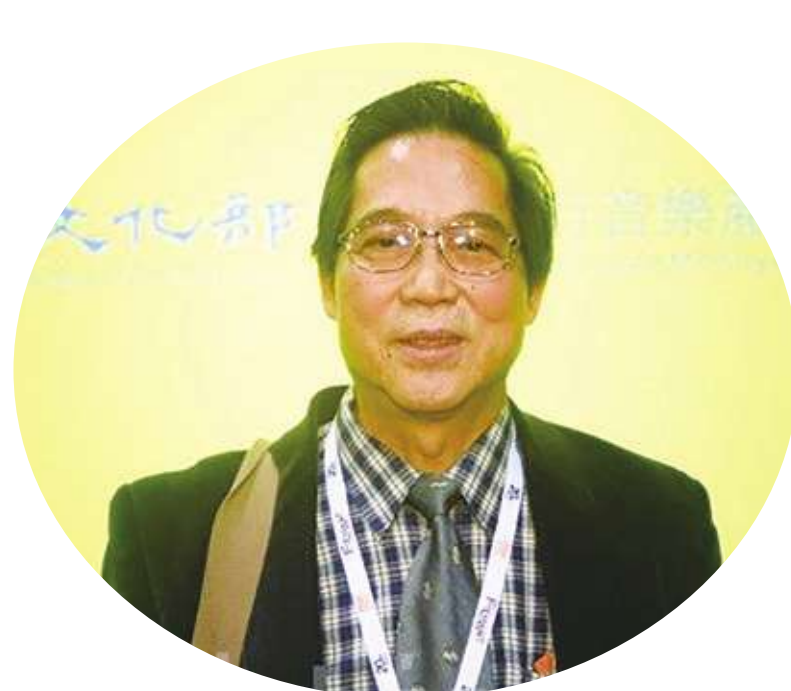
台灣電影編劇、導演林清介。(網路截圖)