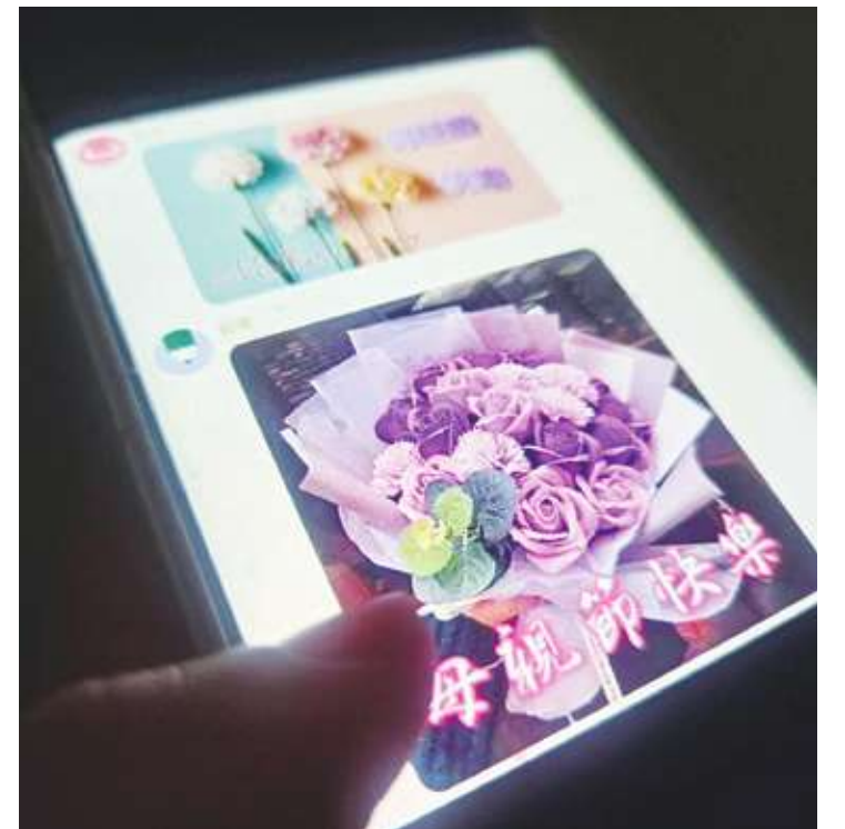
▲ 根據美國最新研究發現，老年人患消化系統疾病，更易感到孤獨和憂鬱。專家表示，隨著高齡社會的到來，許多慢性病常伴隨心理因素，身心共病現象需要大家多留意與重視，別小看傳長輩圖，這是增進人際互動的解憂神器。