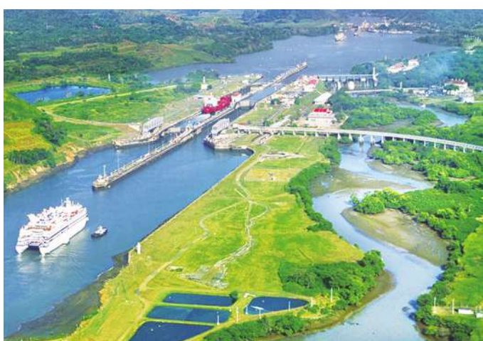
▲ 交通動脈的巴拿馬運河水量不足，航運流量大減。

該報告指出，單單在2022和2023年乾旱就影響了18.4億人，幾乎佔了地球總人口的四分之一，其中絕大多數都是生活在低收入的國家。特別是去年夏天開始出