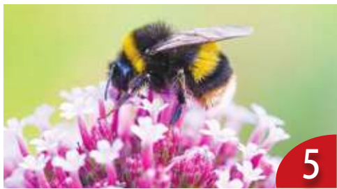
蜜蜂減少 植物自花授粉增加 5