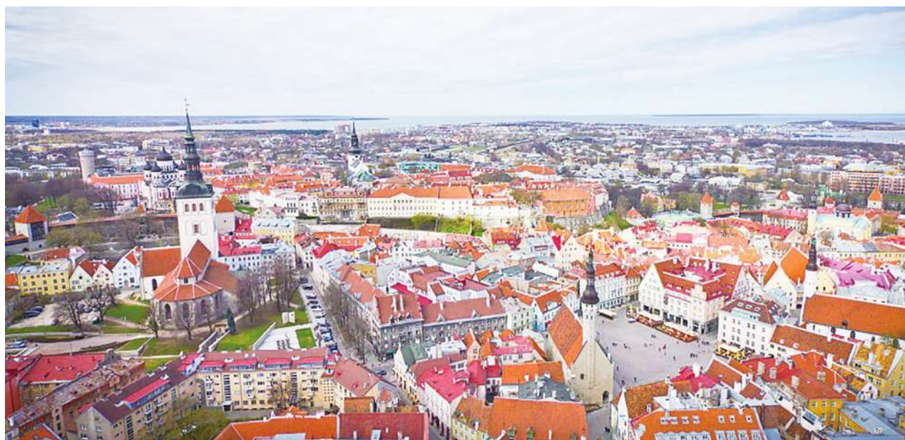
▲ 他蹙了蹙眉，逗著她說，「只要妳猜對了我為什麼喜歡愛沙尼亞這個國家，就答應妳買。」

他過於疲累，反應慢了半拍，整個人被撞飛出去，即使戴了安全帽，因為撞擊力量太大，當她趕到醫院，面對的卻是渾身血跡斑斑、已經沒了溫度的他。撫觸著他腳上的愛沙尼亞襪子，他的皮膚卻是冰涼一片，她不停哭泣，彷彿他的死，也有她的一份責任。