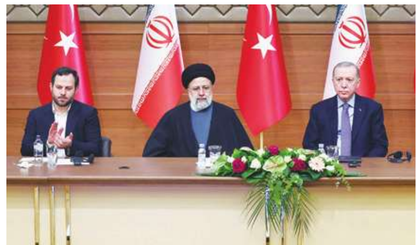
▲ 由於親伊朗勢力遍及中東，土耳其近日拉攏伊朗，盼其不要使中東局勢惡化。( @RTERdogan via Twitter )

《CNN》提到，以哈戰爭已造成超過 2.5 萬名巴勒斯坦人死亡，以色列還提出以巴之間要建立「緩衝區」，但遭到美國國務卿布林肯拒絕。以色列近日則對南部地區擴大攻擊，到處可見坦克車與無人機進行轟炸。