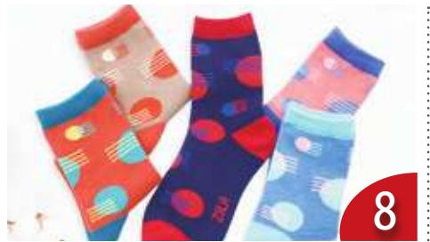
愛沙尼亞的襪子 (溫小平) 8