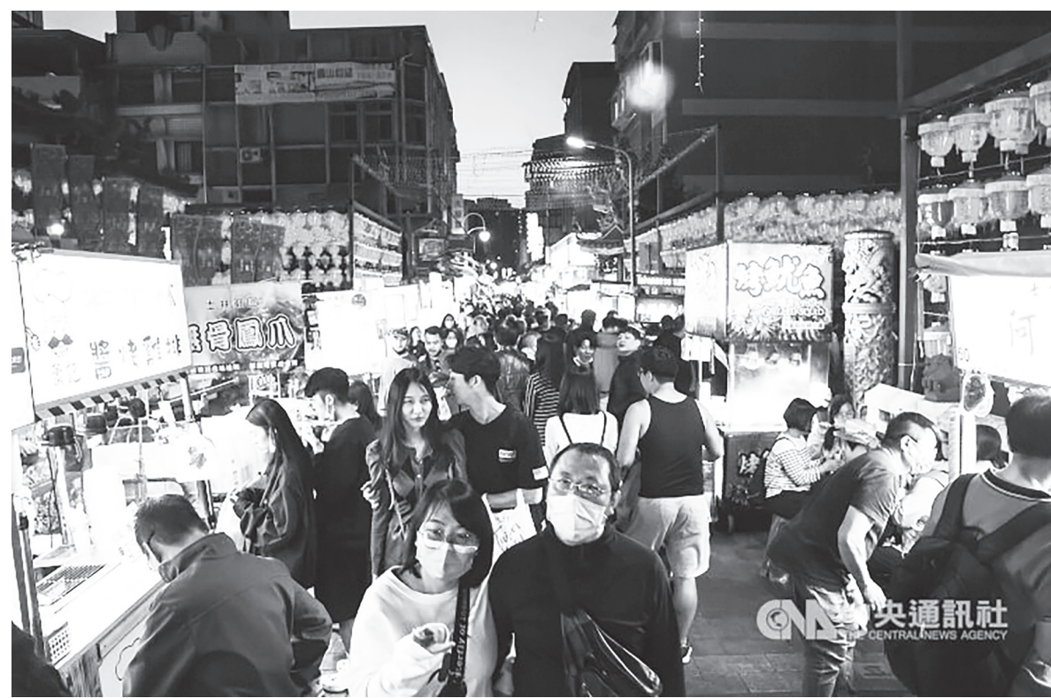
▲過年將至，行政院各部會 25 日宣布各類年節措施與方案，盼民眾多留意。

春節期間各縣市仍持續提供長照服務；過年金流量大，民眾也要提防詐騙，銀行則會加強臨櫃關懷。