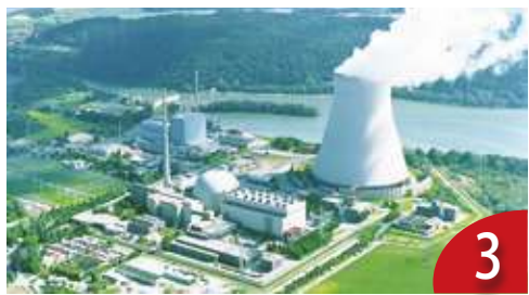
核電重啟？卡在安全與核廢 3