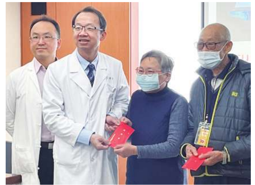
▲ 台北榮總 25 日舉辦「神波助攻 遠離顫抖人生」記者會。

罹患帕金森氏症的馬女士，透過神波刀治療顫抖後，形容「彷彿得到重生一樣」。她更於現場書法寫作，寫了「春」與「龍」字，絲毫不見顫抖的狀況。