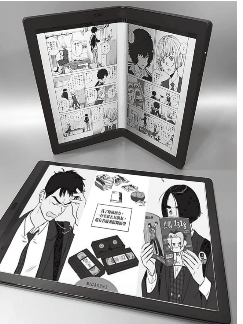
▶ 網漫《奶酪陷阱》(作家：純 kiki) 就是非常具有代表性的作品。(網路截圖)

因為對許多讀過殭屍相關創作的讀者來說，這已經是非常熟悉的世界觀。這部作品的獨特之處不在於世界觀，而是主角撫養變成殭屍的女兒這個「事件」。一般來說，家人變成殭屍這類的事件，通常都是在敘事中被當作轉捩點；但是在這部作品中，故事卻是從女兒變成殭屍開始講起。