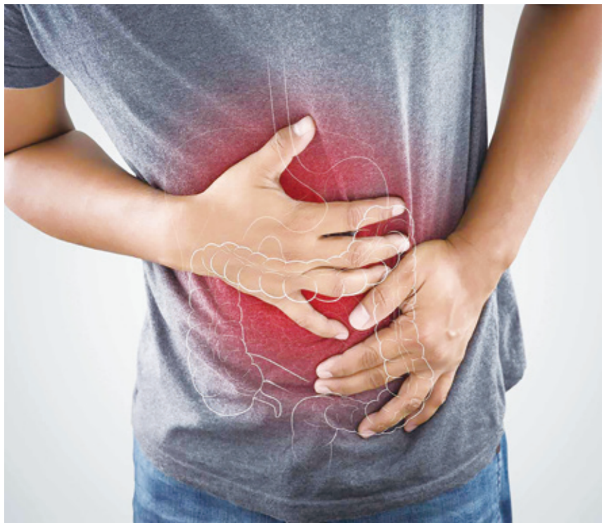
▲控制腸道細菌來預防或逆轉疾病正處於發展階段，是一個潛力無窮、正在興起的診斷與治療市場。(網路截圖)