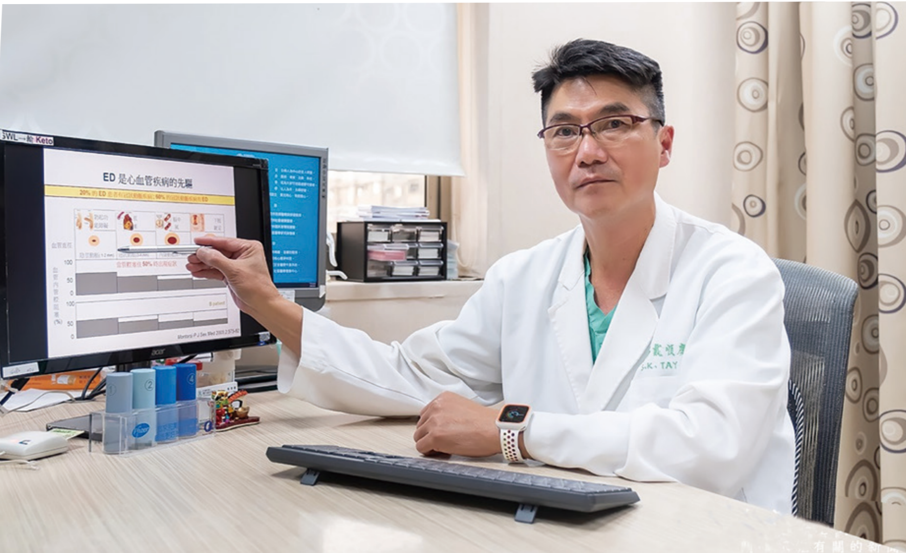
▲專門治療自體免疫疾病的風濕科醫生提出另一種看法：重度發炎。

沒被看見的是一個緩慢曲折的過程，就像隱性發炎本身一樣。這需要無數科學家盡畢生之力才能做到，我將在這本書裡介紹其中幾位。科學家對發炎的探索始於十九世紀的重大發現，直到今日，這場探索仍未結束。