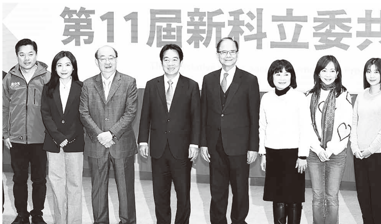
▲ 民進黨立法院黨團 23 日上午舉行新科立委共識營，民進黨主席、總統當選人賴清德（左 4）、立法院長游錫堃（右 4）、民進黨立法院黨團總召柯建銘（左 3）等人出席，與新科立委合影。

副總統賴清德 23 日作為新科總統當選人，前往立法院參加民進黨立院黨團的「新科立委共識營」分享，會前賴清德與立法院長游錫堃和民進黨立院總召柯建銘三人在會議室門口向媒體揮手致意，但面對媒體追問未來是否到國會進行國情報告等問題，賴清德並未回答，