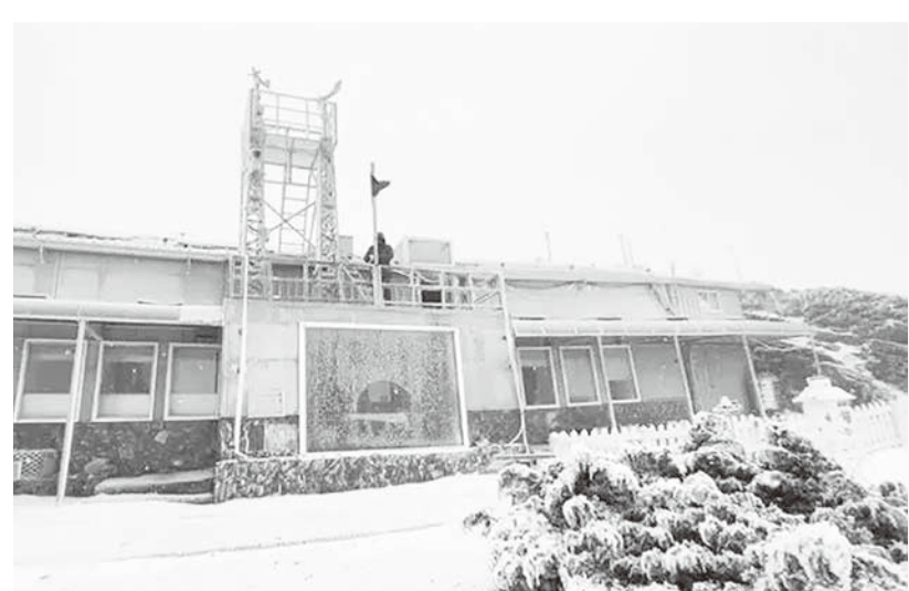
▲ 寒流發威中，全台於 23 日最濕冷，25 日各地開始回溫。

吳聖宇說，受到寒流冷空氣影響，23 日是最濕冷的天氣，尤其山區因為溫度低，水氣足，不少地方都有傳出冰霰、降雪等訊息，甚至連外島馬祖平地都有冰霰發生的狀況出現。