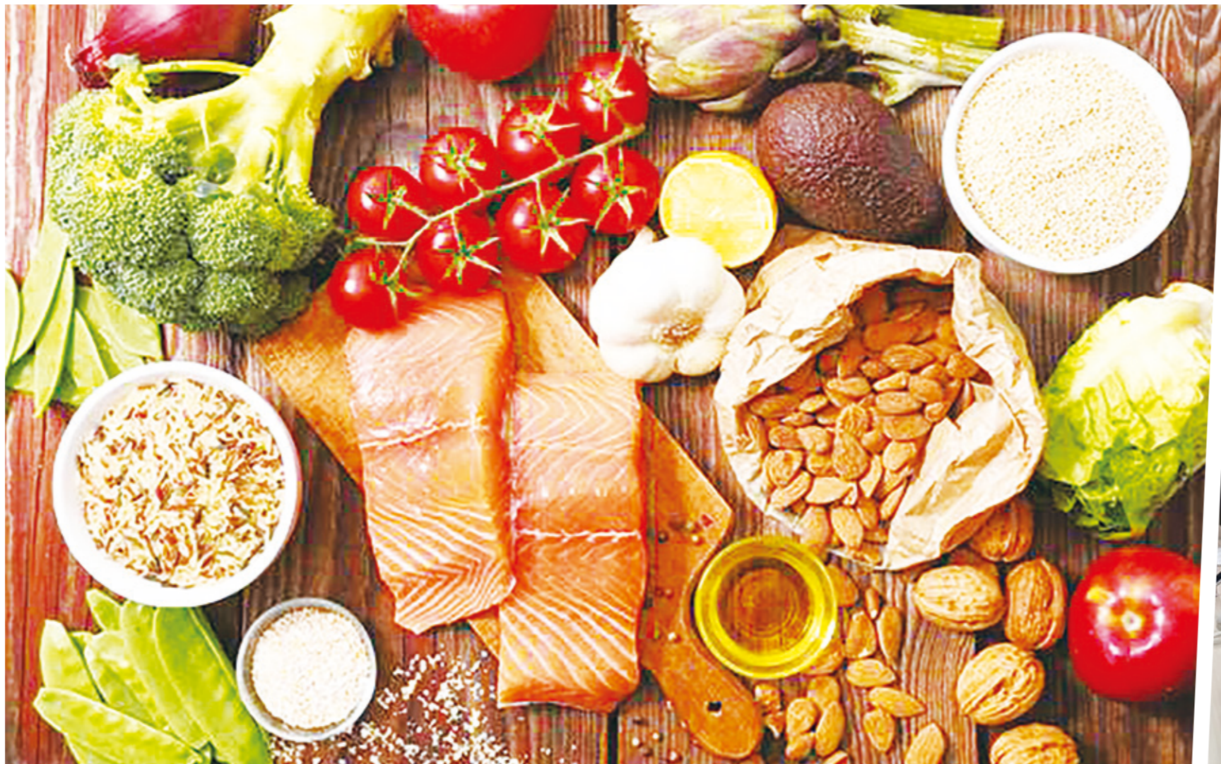
▲有意愈來愈多的研究指出，飲食有能力造成、防止或治療發炎。

如果傷口沒有癒合，發炎就會持續存在，默默地破壞組織，然而卻沒有明顯的症狀，醫生通常檢查不到。