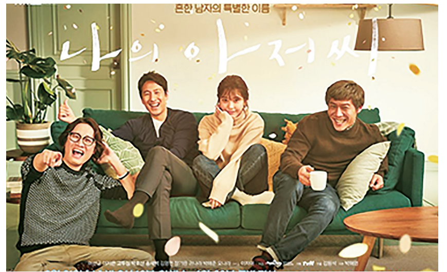
《我的大叔》導演手法高超，編劇書寫深刻，稍有人生歷練的人看了，都會獲得不同程度的安慰與感動。