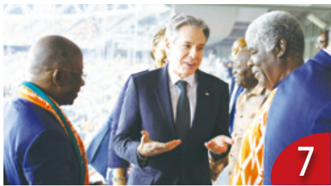
拉攏非洲國家 布林肯出訪西非