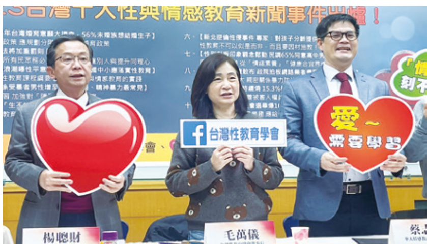
▲ 台灣性教育學會、華人情感教育發展協會公布 2023 年十大性與情感教育新聞事件。

【本報記者簡嘉佑台北報導】2023 年十大性與情感教育新聞出爐，Metoo 浪潮餘悸猶存，曝光台灣性平意識大不足！台灣性教育理事長毛萬儀 23 日呼籲，政府應全面檢討性與情感教育的欠缺，並推動適齡、適性的情感教育。針對青少年不婚、不生的狀況，專家認為，許多年輕人不是不願結婚，而是找不到對象，所以校園與職場應教導「愛情學」。