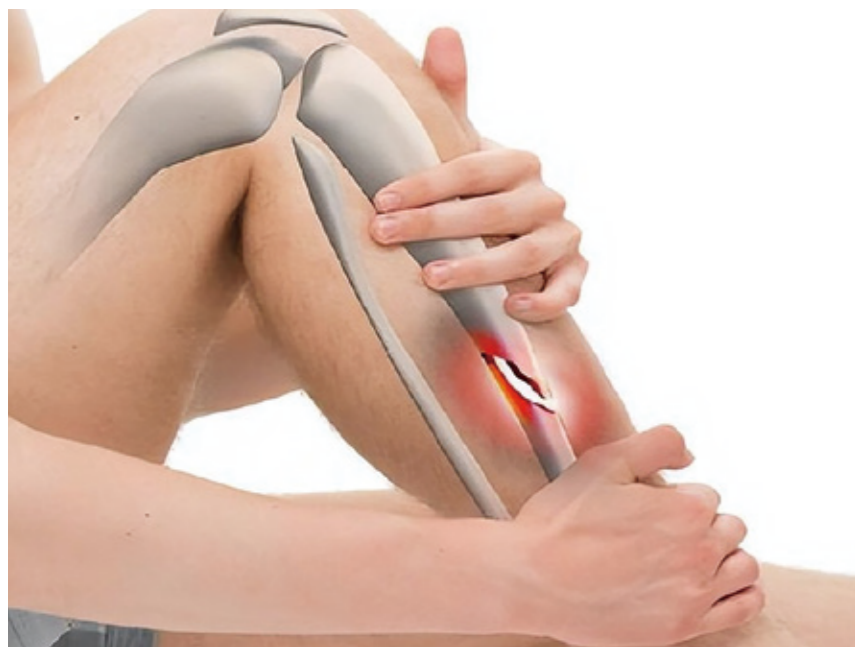
▲傑伊的血液裡有一條線索：肌酸激酶的濃度高得異常，這是肌肉損傷的指標。