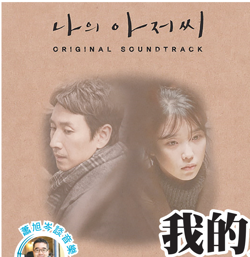
《我的大叔》這齣戲同時也是很多人心中的「神劇」與「人生戲劇」，雋永、耐看，越陳越香。