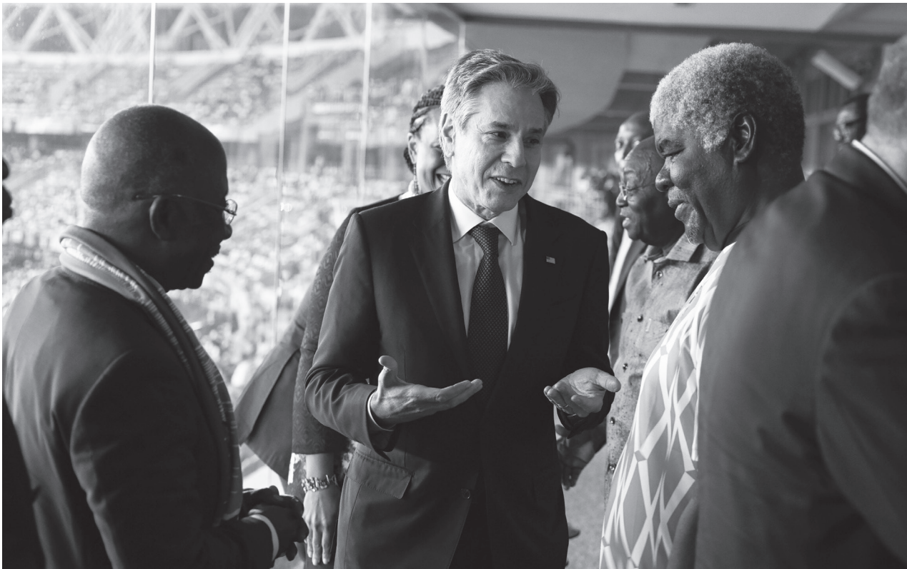
▲ 美國外交官近日分進合擊出訪非洲，盼增加對非關係與制衡中俄勢力崛起。(SecBlinken via Twitter)

【本報記者呂翔禾綜合報導】引言忙完以哈戰爭調停後，美國國務卿布林肯將展開 4 天的非洲訪問之旅，他將前往維德角、象牙海岸、奈及利亞與安哥拉訪問。美國總統拜登 2022 年曾邀請非洲領導人到美國，並宣布要擴大對非洲的綠能與基礎建設投資，但西非地區政變頻傳，因此美國也盼居中協調，以利在非洲擴大影響力。