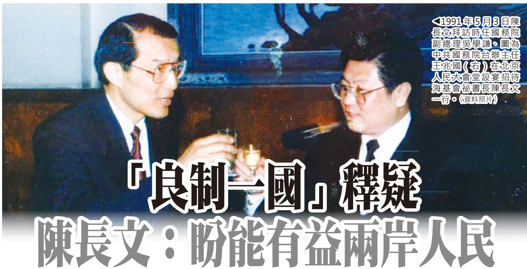
◀1991年5月3日陳長文拜訪時任國務院副總理吳學謙，圖為中共國務院合辦主任王兆國(右)在北京人民大會堂設宴招待海基會秘書長陳長文一行。(資料照片)

他呼籲賴清德要改弦更張，讓兩岸能恢復交流、降低敵意，而國民黨也要好好發揮「中國」的資產，促進兩岸交流。