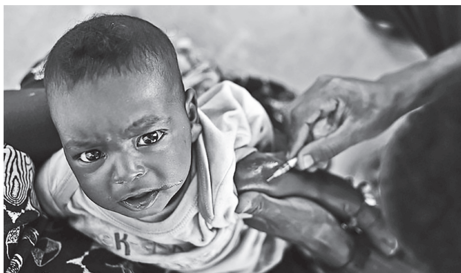
▲ 非洲國家喀麥隆啟動了全球第一個瘧疾常規疫苗計畫，向所有 6 個月以下的嬰兒免費提供疫苗。

在喀麥隆，許多人對疫苗的安全性和有效性，仍抱持懷疑的態度，也對接種疫苗猶豫不決。專門研究瘧疾的公衛生物技術教授姆巴查姆說，「許多人說喀麥隆人被當作實驗白老鼠，但這並非正確觀念」，學界需要教育民眾疫苗有什麼好處，才能平息他們的恐懼。