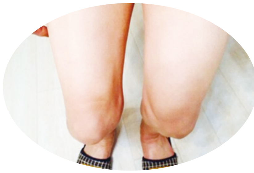
▲起初神經科醫生認為這可能是一種罕見的帕金森氏症，或是剛剛發病的肌萎縮性脊髓側索硬化症(ALS)。(網路截圖)

但是，如果診斷不出典型的發炎被視，現代的「發炎」究竟意味著什麼？哪些檢查可以揪出隱性發炎？隱性發炎是怎麼產生的？它是針對潛在疾病產生的一種反應？還是被環境因素(例如飲食不健康、汙染或壓力)觸發的病症？有多少證據支持隱性發炎與現有的各種慢