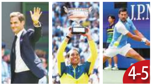
4-5 網球盛世三巨頭 (書摘)