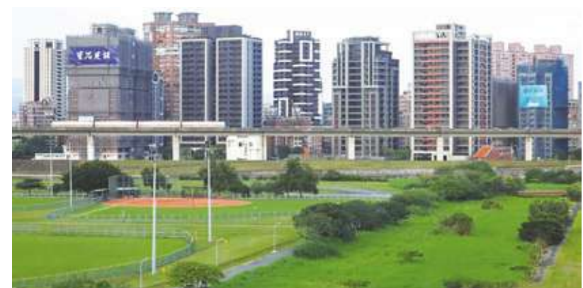
▲內政部推測，待售新成屋創新高，除過去推案逐漸完工，跨部會管制炒房作為也可能造成交易量減少，使待售新成屋增加。(中央社)

新莊區、淡水區及三重區；台北市依序為中正區、大同區、內湖區、中山區與大安區，皆超過 400 宅；桃園市主要集中龜山區、中壢區與桃園區；台中市待售新成屋集中於北屯區、南屯區、烏日區與西屯區；台南市多落在安南區、永康區與善化區；高雄市集中於鳳山區、楠梓區與三民區。