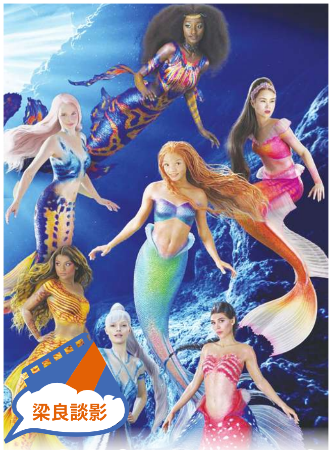
◀「魔改」的真人版《小美人魚》則在爭議聲中以 2.98 億美元票房排在第 6 名。(網路截圖)