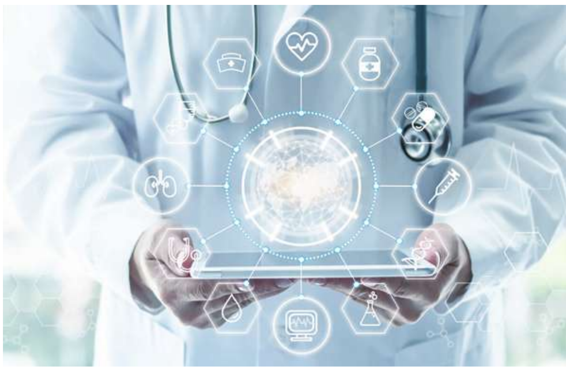
石崇良強調，精準醫療是國際趨勢，更包括基因定序、分子鑑定或代謝等體學檢測。

至於癌友能夠使用 NGS 健保給付的時機，石崇良說，檢測時機預計會在民眾初次罹患癌症或在第二、三線癌症治療失敗時，經與醫師充分溝通後決定。他強調，NGS 納保將採「單一癌症終身給付一次為限」，且不會採統一價全額給付，而是採用定額給付，保留民眾自費擴充檢測範圍的空間。