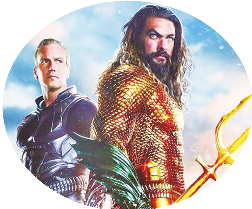
▲ 由溫子仁執導、傑森摩莫亞主演，敘述水行俠必須建立盟友，以保護亞特蘭提斯及世界受到不可逆的破壞。(影集劇照)