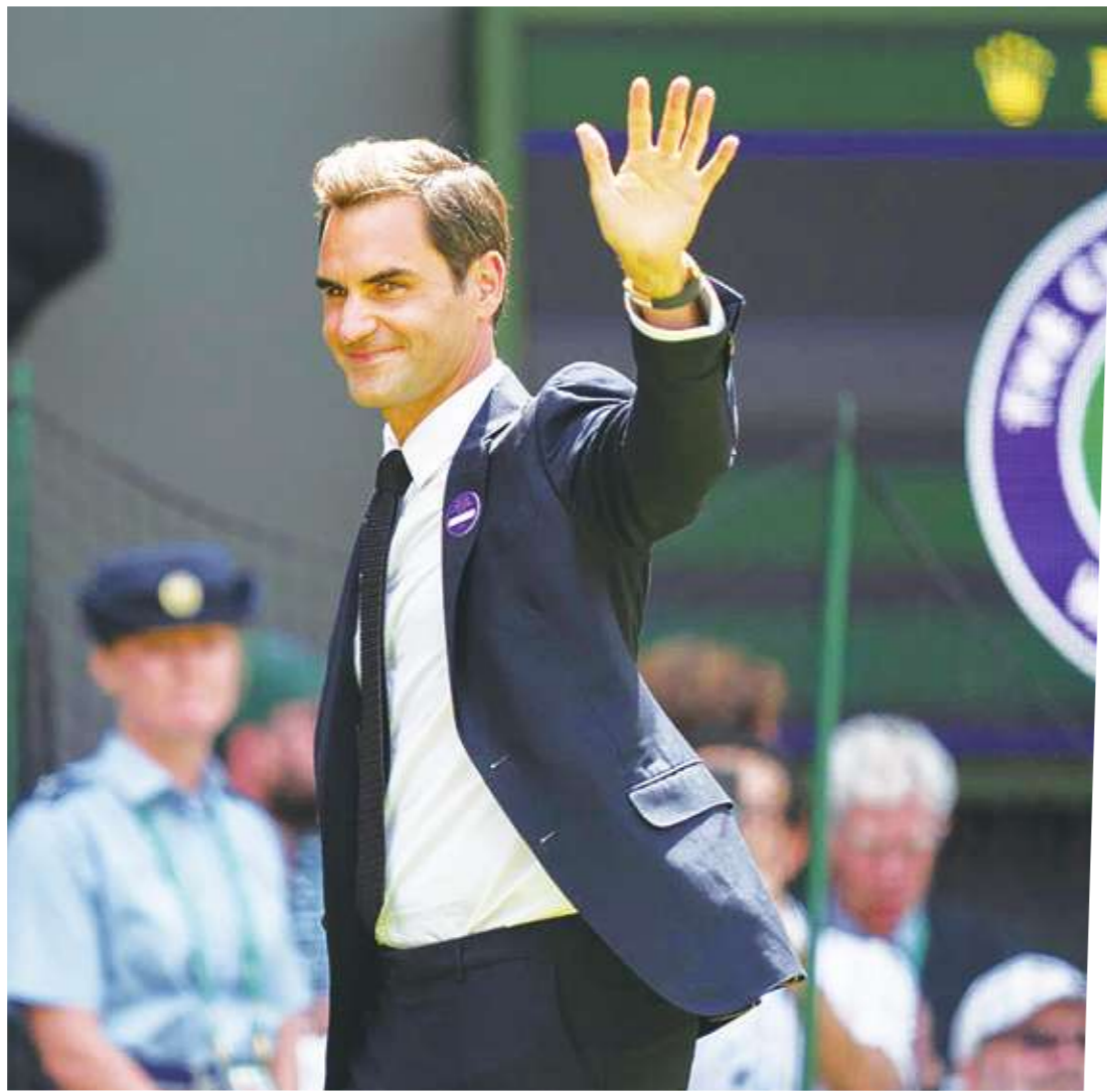
▲「草地之王」費德勒、「紅土之王」納達爾、「硬地之王」喬科維奇，對決 20 年，球風迥異，各擅勝場，是宿敵，是競爭對手，卻也惺惺相惜，是球員和球迷心中的神級人物和殿堂般存在，更是網壇同時擁有三位史上最偉大球員的絕頂盛世。

分析三位天王迥異的個性和球風，深入回顧三位傳奇的宿敵對峙和惺惺相惜，帶領我們重溫三人最輝煌的時刻和最沉重的失敗。