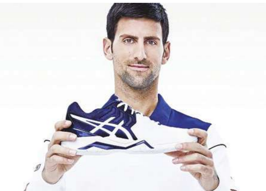
▲新喬科維奇擔任 ASICS 品牌代言人，專屬鞋款 GEL-RESOLUTION N-NOVAK 將在澳網正式亮相。