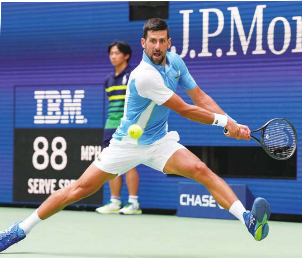
▲「草地之王」費德勒、「紅土之王」納達爾、「硬地之王」喬科維奇，對決 20 年，球風迥異，各擅勝場，是宿敵，是競爭對手，卻也惺惺相惜，是球員和球迷心中的神級人物和殿堂般存在，更是網壇同時擁有三位史上最偉大球員的絕頂盛世。(網路截圖)

長青樹，也促使了交手次數如此之多。一反所有預測和先例，費德勒、納達爾和喬科維奇年過三十好幾，仍維持頂尖的球技水準和成績，費德勒甚至已經四十出頭。結果就是，這三位前無古人的天才仍活躍於網壇，許多世代的網球選手只能眼睜睜看著自己的夢想被擴張截斷。