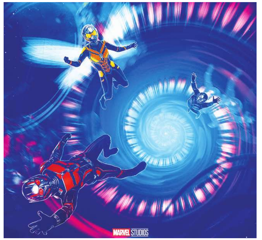
▲ 量子衛星不小心把蟻人保羅路德、黃蜂女伊凡潔琳莉莉、初代蟻人麥克道格拉斯、初代黃蜂女蜜雪兒菲佛與第三代蟻人凱瑟琳紐頓，都傳送到另一個神秘宇宙，展開一場瘋狂探險。(網路截圖)