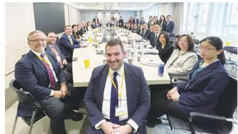
▲美國國會開議，將攸關台美避免雙重課稅協定的法案，打包在其國內大型法案中一起審查。

的美國來源股利，課 30% 扣繳稅率，根據先前釋出的草案內容，扣繳稅率擬降低至 15%，若是持有美國公司 10% 以上股權者，扣繳稅率可望降低至 10%。由於協定是雙向同等互惠，因此赴美投資的台積電、環球晶等台灣龍頭大廠，及來台投資的美國 Google、Facebook 及美光等都將受惠。