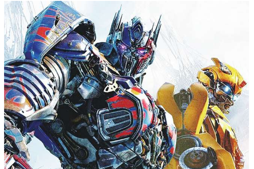
▲《變形金剛：萬獸崛起》將引領觀眾踏上 90 年代的全球冒險之旅，並新加入強大金剛、掠奪金剛和恐懼金剛，參與博派變形金剛和狂派變形金剛在地球上的戰爭。(網路截圖)

倒是馬來西亞文藝小品《富都青年》在金馬獎的加持之下成為大黑馬，在去年底以 9,327 萬新臺幣暫居第 24 名，目前仍在上映中，近日在宣傳上賣力衝刺，作《富都青年》演唱特別場破億倒數！