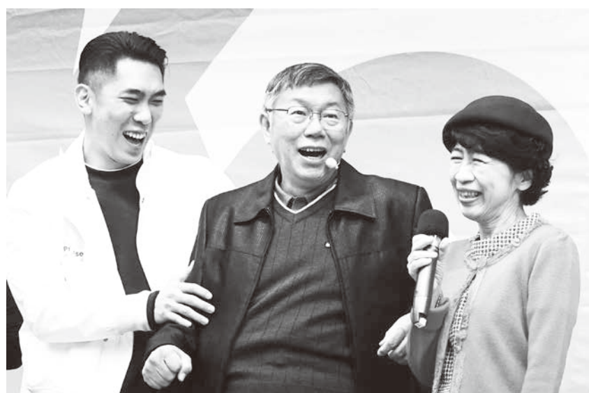
▲ 台灣民眾黨主席柯文哲（中）21日赴台北榮星花園出席選後首場謝票活動「阿北森友會」，與妻子陳佩琪（右）在台上互動熱絡。（中央社）