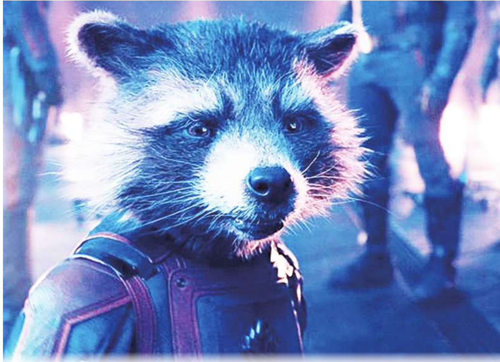
▼《星際異攻隊 3》亮點：片頭曲為火箭浣熊悲慘過往埋下伏筆。(網路截圖)