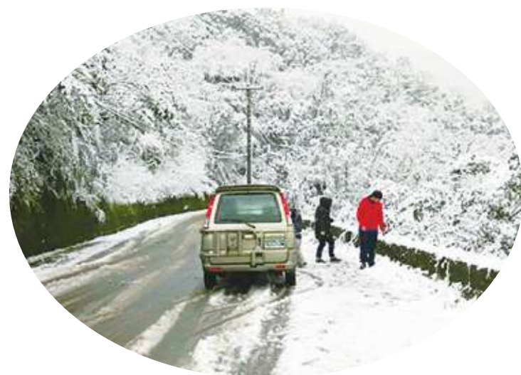
霸王寒流來襲，23、24 日氣溫最低。(示意圖。)

【本報記者簡嘉佑台北報導】霸王寒流來襲，23、24 日氣溫最低，全台溫度都不到 10 度，冷成凍番薯！針對民眾關心是否有「寒流假」可放，勞動部表示，現行法規其實沒有明定低溫或寒流放假的標準，只有地方首長以「天然災害裁量」後，才能宣布全縣市停班停課，例如發生交通困難、水電中斷等狀況。