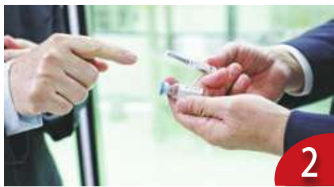
2 高端合約爭論 問題卡在公平度