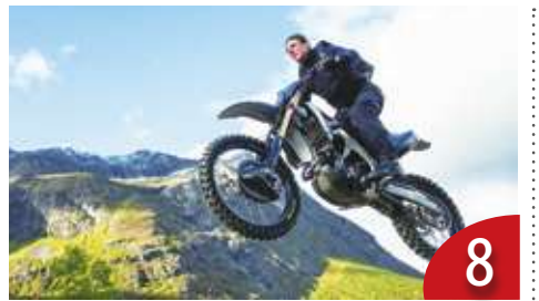
8 臺灣觀眾的電影口味改變了