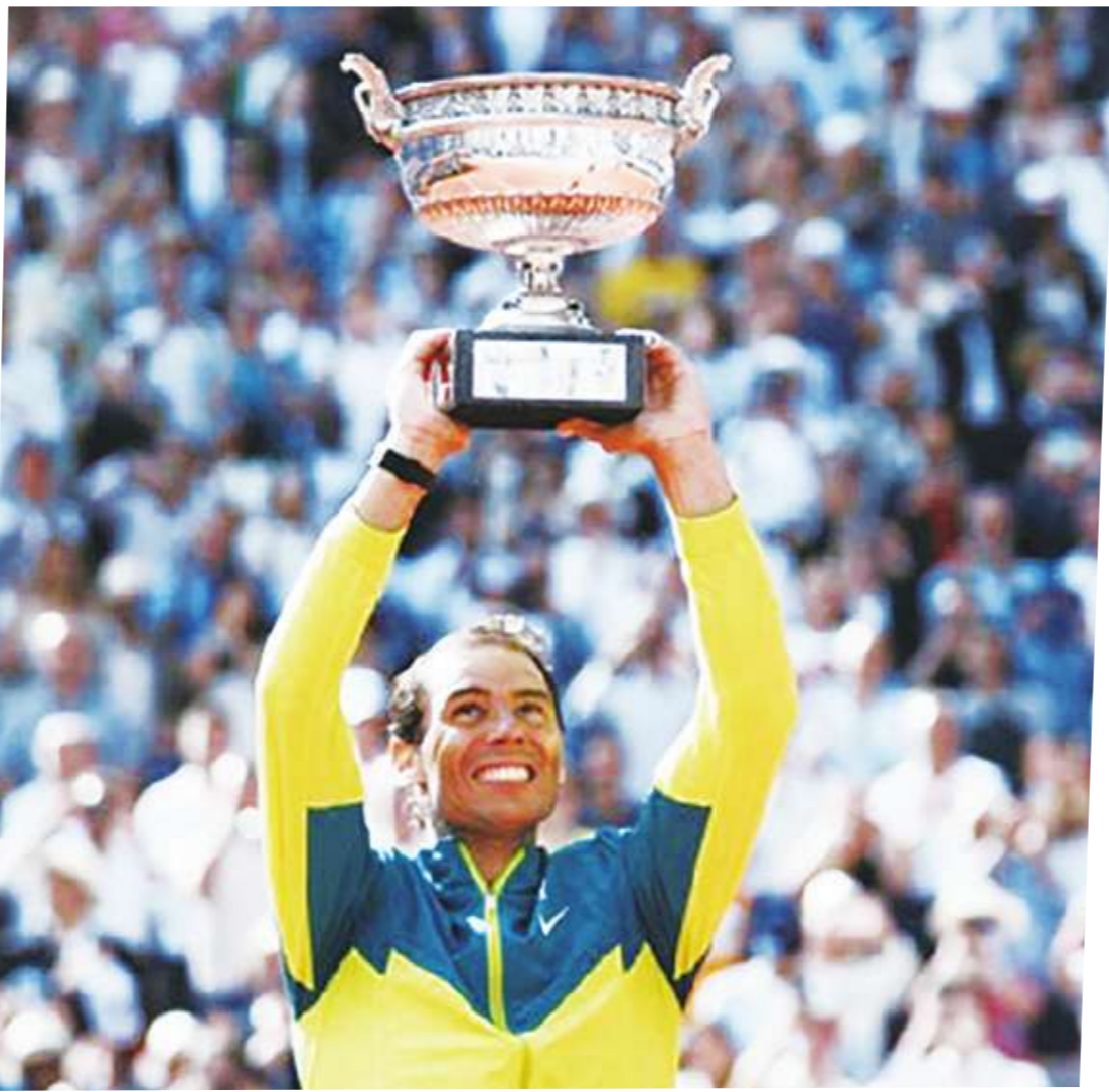
▲「草地之王」費德勒、「紅土之王」納達爾、「硬地之王」喬科維奇，對決 20 年，球風迥異，各擅勝場，是宿敵，是競爭對手，卻也惺惺相惜，是球員和球迷心中的神級人物和殿堂般存在，更是網壇同時擁有三位史上最偉大球員的絕頂盛世。