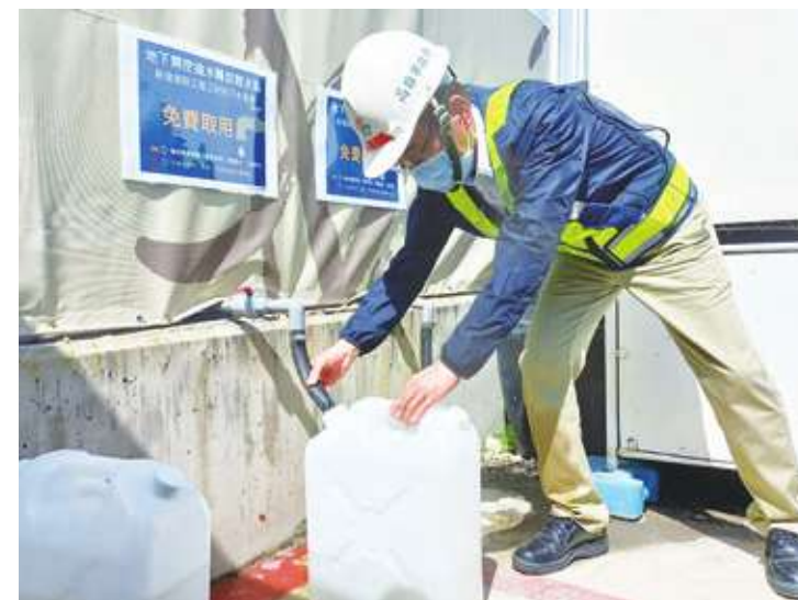
▲經濟部規定 2 月起，每日用水 2 萬噸以上者，需有 50% 用水為再生水。

方公尺（噸）以上者，屬於工業用水部分應使用至少 50% 系統再生水，適用範圍包含新設廠與擴廠案。子法通過後，經濟部給予廠商半年緩衝期，水利署副署長王藝峰提醒，水利署未來會在用水計畫書進行審查，若適用新規的業者未符合新制規定將無法開發。