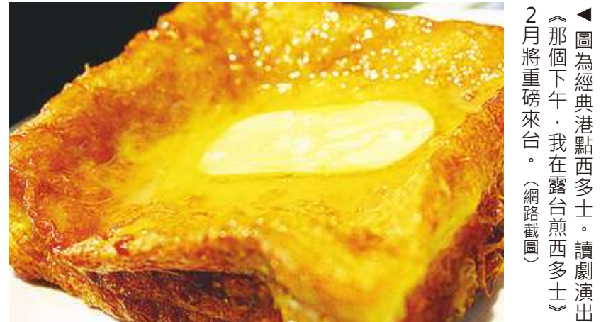
▲圖為經典港點西多士。讀劇演出《那個下午，我在露台煎西多士》2月將重磅來台。(網路截圖)

本次讀劇演出同時加入「無實物表演」的技巧，也就是在舞台上不會有道具，所有的事情都必須由演員的肢體表情動作來表達，呈現開罐、打蛋、開水龍頭、煎西多士等細節。