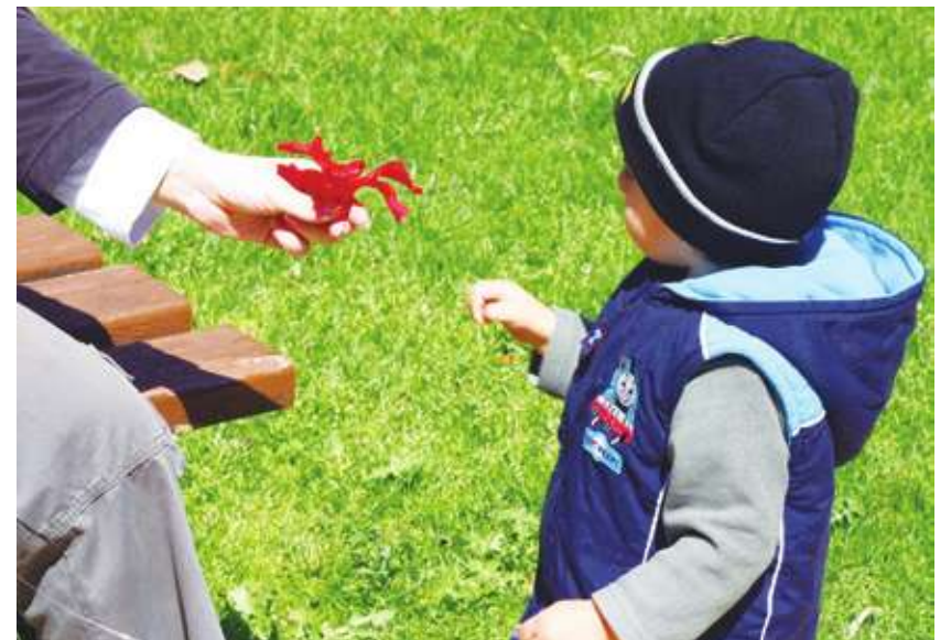
▲美國兒童與雙親居住的比率在增加中。

據《紐約郵報》報導，去年密西根大學公布研究結果，分析27萬名英國人的健康與遺傳資訊後發現，養育兒女可讓人多活到76歲。研究人員張建志說，「很明顯的事情就是，有小孩比沒有小孩更會長壽。」他補充說，「生兩個孩子最長壽，過多或太少都會降低壽命。」研究則認為，歲數增加的原因部分歸功於育兒所帶來的好處。因為稍早研究發現，有子女的人往往有更多的社交互動，例如與其他父母和老師互動，而較高的社交互動則與較長的壽命有關。