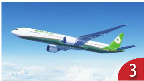
3 長榮違法聘機師 預計春節罷工