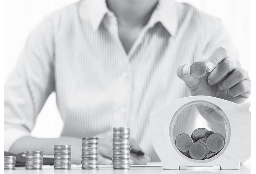
▲賺到的錢有分為三種：1. 股票賺到的價差。2. 股票配發的股息。3. 美股選擇權賺取的現金流。

假如還是不知道該怎麼開始建立自己的採購清單，我們可以參考 13F 持倉報告的資料，從巴菲特投資的公司當靈感。