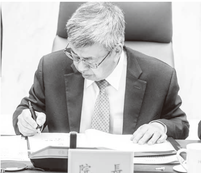
▲行政院長陳建仁18日正式向總統提出內閣總辭，並列舉在任內通過的法案與政策。

陳建仁說，他銜蔡總統之命擔任行政院長至今已將近1年，感謝行政院團隊以通力合作，積極推動撥補勞健保及台電、全民普發現金等穩定物價、振興疫後經濟的政策。