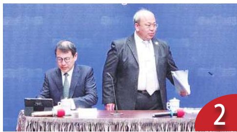
2 電子連署上線 中選會 2 月拍板