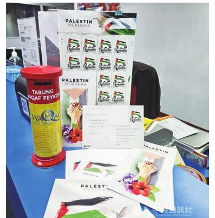
▲馬來西亞力挺巴勒斯坦，發起向聯合國秘書長古特瑞斯寄送特別明信片運動，首相安華呼籲聯合國接納巴勒斯坦為會員國，以色列停止迫害巴勒斯坦人民。大馬人民即日起可以在全國郵局或大馬郵政公司官網購買這款特別明信片。安華也親自執筆，表達馬來西亞人民支持巴勒斯坦立場。