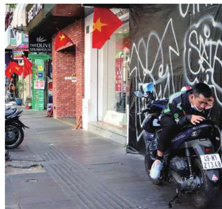
▲ 越南 2023 年景氣低迷，官方看好 2024 年，設定 6% 至 6.5% 的高經濟成長目標。不過民眾觀望氣氛濃，認為經濟雖然轉好，但仍有很多不確定性，尤其是物價不斷上漲。圖為正在胡志明市政府廣場街邊休息的外送員。