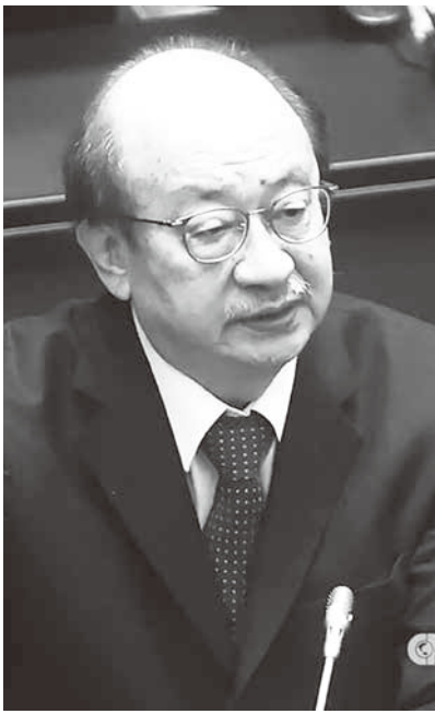
▲民進黨總召柯建銘。