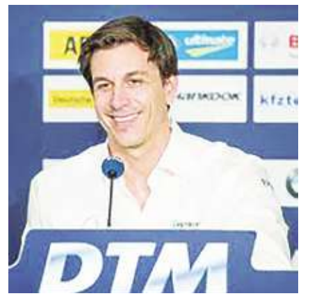
▲ F1 強權梅賓車隊留下「馬桶狼」沃爾夫，他將以領隊身份再掌管車隊 3 年。(photo from Wikimedia)

【本報記者宋秉謙綜合報導】馬桶狼留下！F1 賽車一級方程式的強權梅賓車隊 15 日深夜宣布，「馬桶狼」沃爾夫與車隊簽下 3 年續約，將繼續掌管梅賓車隊、擔任領隊與執行董事。退役車手馬桶狼是車壇少見的策略專家、兼投資客、兼明星領隊，他率領梅賓連霸 7 年廠牌冠軍，但近年來被紅牛車隊力壓一頭，手握 7 冠的沃爾夫不認為有人能做得比他更好，將繼續挑戰紅牛車隊。