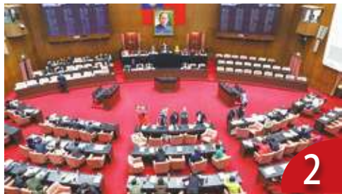
立法院長重要性 排法案與協商