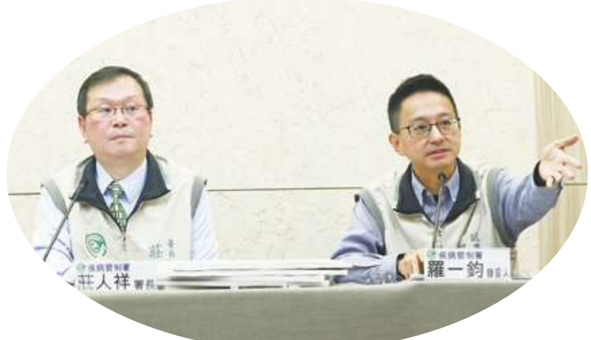
▲ 疾管署長莊人祥(左)重申，疫苗採購與接種計畫推動均秉持專業，以全民健康福祉為優先考量，已充分接受檢驗，一切依法行政。右為疾管署副署長暨發言人羅一鈞。

外界質疑高端疫苗採購價金 810 元與 881 元，為何高於預算編列的 700 元，莊人祥解釋說，當初疫苗採購經費 115 億元，以採購每劑 700 元、採購 1500 萬劑進行估算，不含冷鏈與其他作業費；2021 年 5 月談判過程中，原本高端報價 950 元，最終協調到單劑量 881 元、多劑量 810 元，並增列疫苗配送點從 20 處至 200 處。