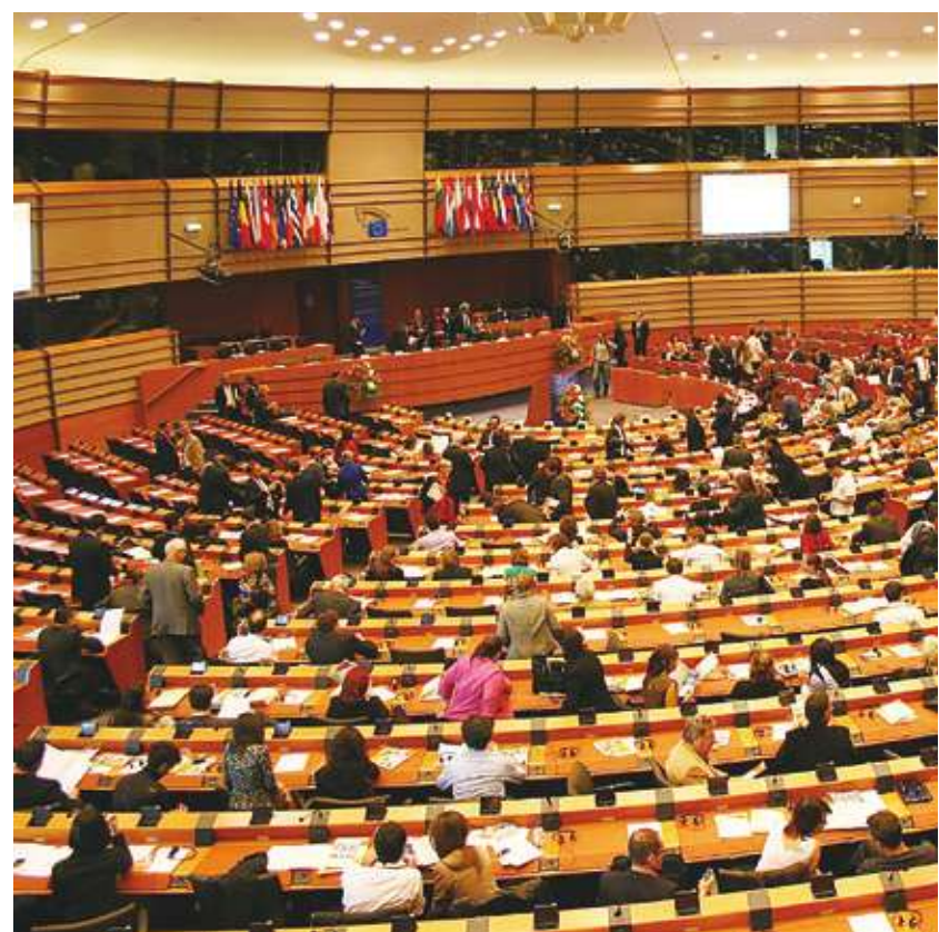
▲ 歐洲議會 6 月將選舉，外媒擔心極右派崛起，影響歐洲議會決策。

由於歐盟將於 6 月選出新一屆的歐洲會議員，將在未來 5 年影響歐洲的政策走向，外界