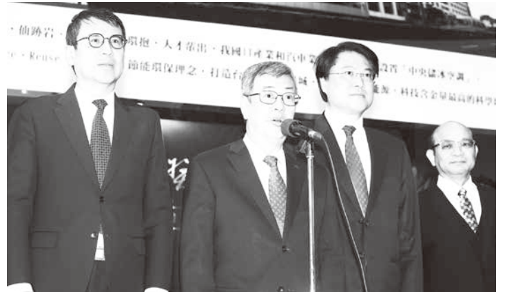
▲行政院長陳建仁(左2)16日出席內政部消防署所舉辦「112年鳳凰獎楷模表揚典禮」，並在會前受訪表示，因應新國會及民意，行政團隊將按憲政慣例提出總辭，希望新國會未來能與行政團隊繼續合作。右2為內政部長林右昌。