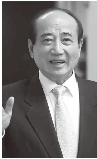
▲王金平曾任立法院長。