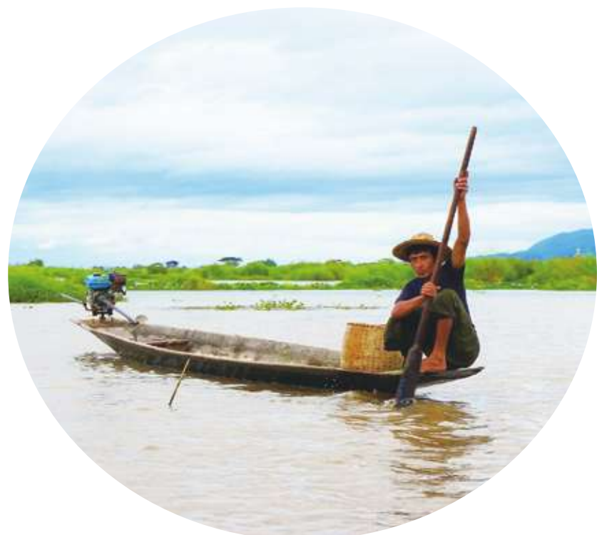
▲ 叛軍攻佔百力瓦鎮後，將控制通往印度邊界的道路與水路運輸。

據報導，軍政府目前正利用空襲與直升機攻擊，試圖阻止若開軍繼續挺進，包括若開邦首府實兌的皎道鎮。