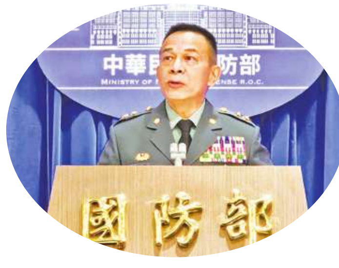
▲ 國防部 16 日公布 1 年義務役相關規劃，並回應國防時事議題。圖為陸軍參謀長陳建義。

【本報記者呂翔禾台北報導】一年義務役實戰訓練內容更多，鑑測沒過的人無法領錢！國防部 16 日公布 1 年義務役準備狀況，指出下部隊服務前將會接受 8 周訓練，包括體能、射擊與綜合戰鬥訓練。陸軍參謀長陳建義指出，下部隊前將進行鑑測，若沒有通過將留訓 1 周，下部隊後若還是沒通過，就無法獲得專業證書與加給 10800 元。