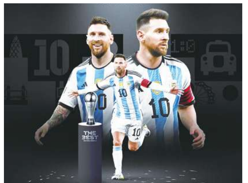
▲ 阿根廷足球巨星梅西 16 日榮獲國際足總最佳男子球員獎(The Best FIFA Men's Player)，他以些微優勢擊敗英格蘭足球超級聯賽曼徹斯特隊隊星哈蘭德，這也是梅西生涯 3 度獲得該獎。