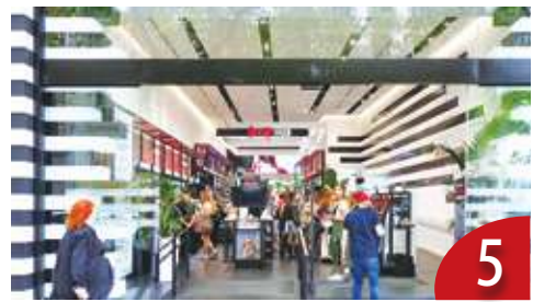
孩童瘋保養 專家：恐傷皮膚功能