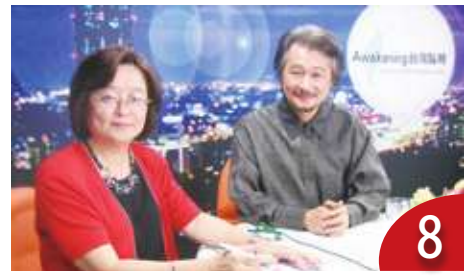
施明德民主夢告終 (15 年前本報專訪)