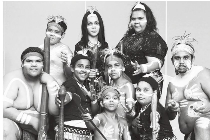
▲澳洲原住民的「傳命」(dreamtime)·以及史耐德(Gary Snyder)的詩文裡都能找到這種智慧。

我本來以為會很辛苦，但開始與自行選出成員的工作小組會面後，這份擔心很快就煙消雲散，工作小組是由我的夥伴藍伯(George Lameboy)與契沙西比克里階陷