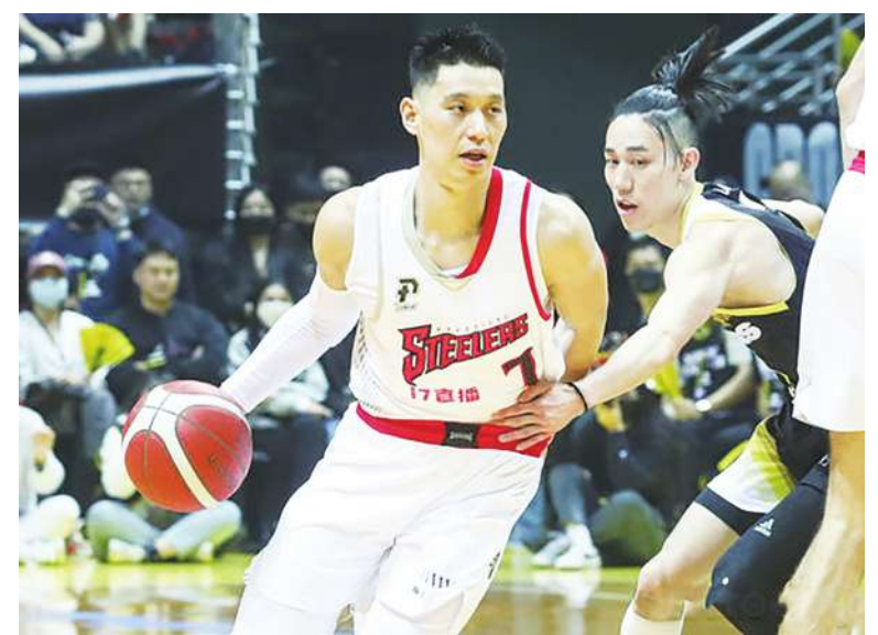
▲ 林書豪這種時時以上帝為中心的年輕人，一生都會勇往直前，因為他有上帝的同在。

有位媽媽帶了個四、五歲的小女孩，在公園散步，突然來了一條大狼狗，小女孩嚇得哭出來，媽媽說：「不要怕，媽媽在！媽媽在！」一把將孩子抱在懷裡，孩子感到安全了。