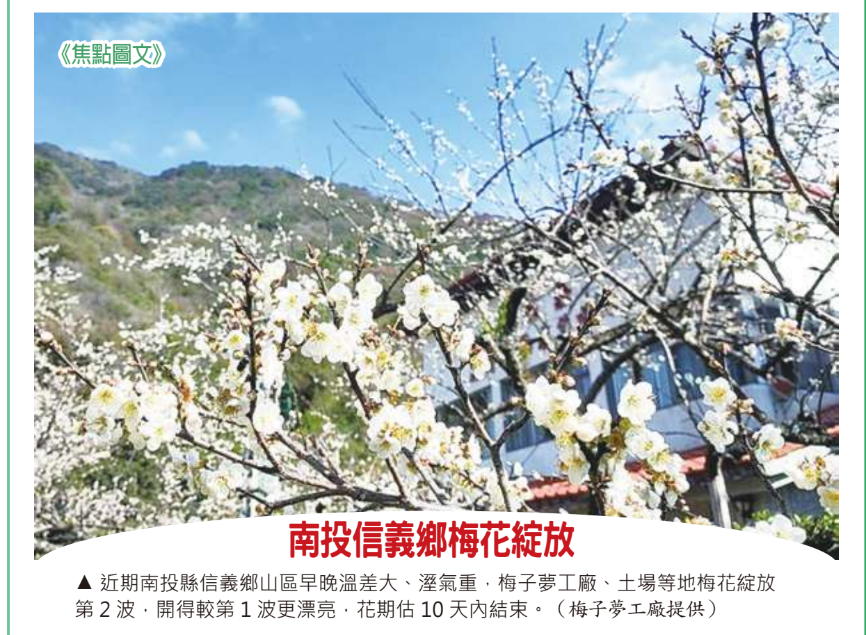
▲ 近期南投縣信義鄉山區早晚溫差大、溼氣重，梅子夢工廠、土場等地梅花綻放第 2 波，開得較第 1 波更漂亮，花期佔 10 天內結束。

有媒體詢問，許多外媒都說中共要在 3 月進行對台軍演，國軍是否有掌握其動向？黃明傑指出，3 月氣候轉好，確實是共軍軍演的好時機，但目前並沒有掌握到共軍軍演的相關資訊，但國軍都會持續以聯合情監偵系統進行監控。