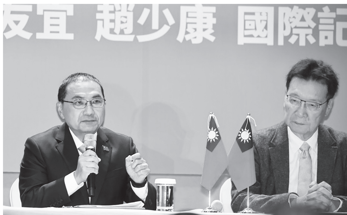
國民黨總統候選人侯友宜 11 日召開國際記者會，表態自己的兩岸立場與前總統馬英九不太相同，交流需循序漸進恢復善意。

侯友宜首先用中文致詞表示，捍衛國家、保障人權，是台灣總統最重要的任務，未來將會設立印太願景辦公室，定期公布台灣印太願景，讓印太國家能夠更了解台灣，一起維護自由開放的氛圍。他強調，兩岸關係上，面對強大對手要有充足武力，同時也要多多溝通，才能化解衝突。