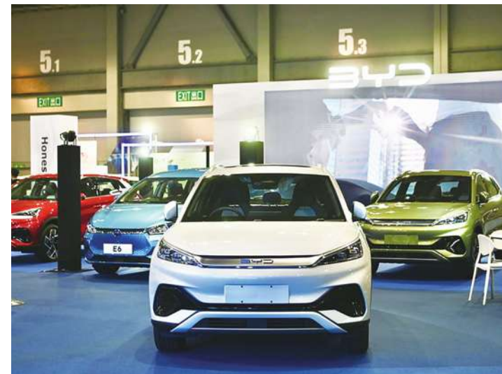
▲中國比亞迪汽車去年第四季銷量首次超過美國電動車大廠特斯拉；專家表示，比亞迪背後的中國政府之手已經令美國和歐洲擔憂，電動車可能成為繼晶片後美中下一個地緣政治戰場，尤其是在電池領域。