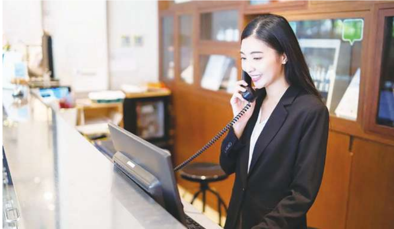
▲旅宿業者紛紛表示，住房、訂席於農曆春節檔期都接近9成。

業者指出，國旅住房率在寒暑假、春節等旺季達9成，是相當正常的狀況，但旅宿業缺工議題猶存，恐導致品質下降。