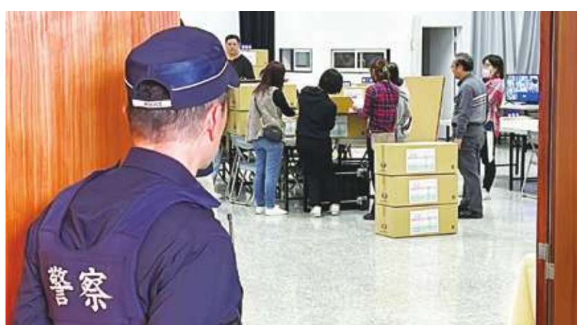
▲台東縣今年236個投票箱中有5個只有1張選票，選民投給誰開票後馬上就曝光，因此有2人申請與附近投票所合併，以避免曝光。