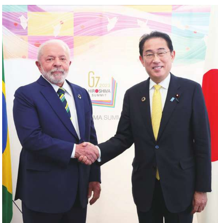
▲日本近日與巴西討論與南美共同體簽訂貿易協定的事情，盼分散糧食進口來源，圖左為巴西總統魯拉，圖右為日本首相岸田文雄。

根據《日經亞洲》報導，岸田與魯拉10日進行電話對談，討論日本與南美共同體是否要簽訂貿易協定，還有如何加強日本與巴西的雙邊關係，岸田甚至考慮未來要訪問巴西。