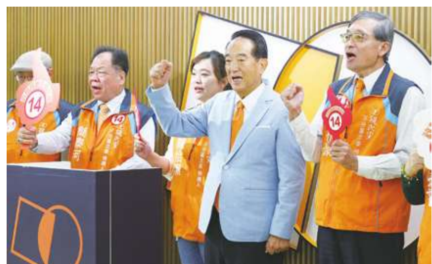
▲親民黨主席宋楚瑜(右2)與黨籍不分區立委候選人李桐豪(右1)等人齊聲高喊「親民黨加油」，全力為政黨票催票。