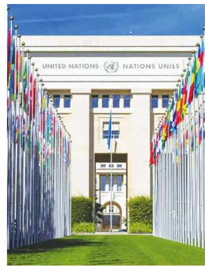
▲聯合國人權理事會成立於2006年，其任務是保護和促進世界各地的人權。

【本報記者呂翔禾綜合報導】壓迫過少數民族的國家，能擔任人權理事會的主席嗎？聯合國人權理事會近日舉行秘密投票，結果由摩洛哥代表奈柏爾打敗南非代表柯西，當選委員會主席。但南非政府質疑，摩洛哥持續壓迫西邊的西撒哈拉政權無法獨立，人權紀錄不佳無法勝任主席。人權理事會常因會員國人權紀錄不佳遭質疑其決策合理性。