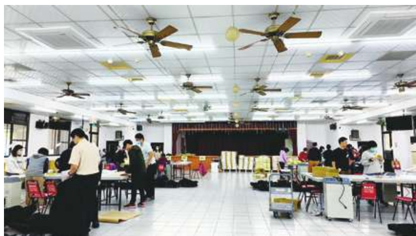
▲選舉投票日倒數計時，台南市各區公所11日點算及包封投開票所的選票。