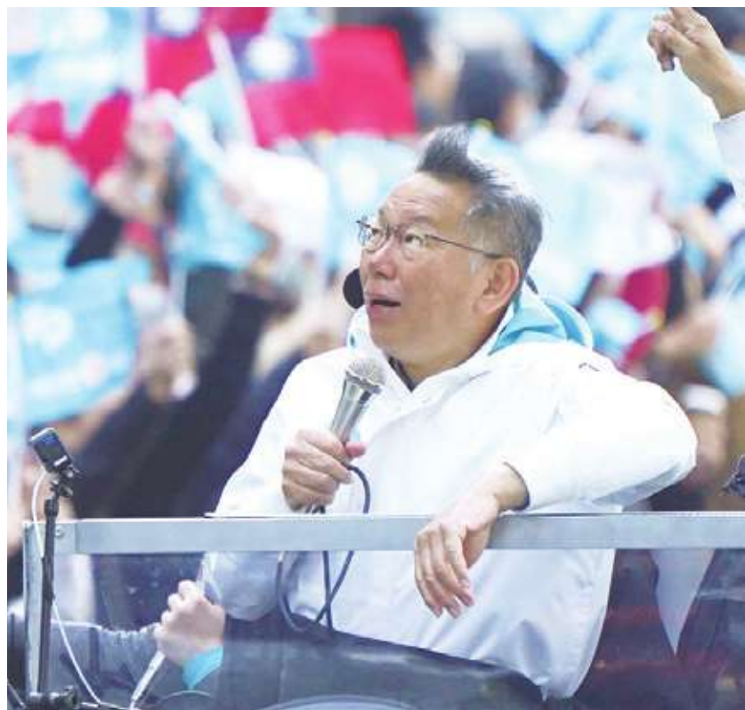
▼大選倒數2天，台灣民眾黨總統候選人柯文哲11日下午在台北市區以車隊掃街拜票。