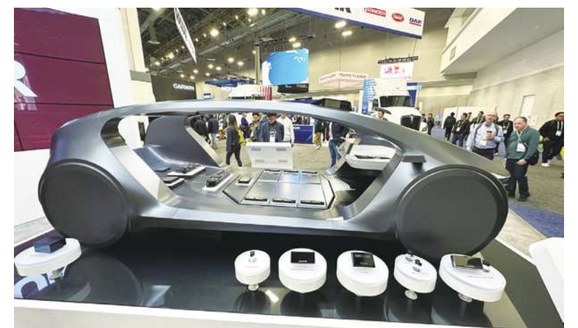
▲ 「軟體定義車」今年在 CES 大放光芒，許多品牌像是美國亞馬遜公司 (Amazon)、韓國 LG、德國博世 (Bosch) 紛紛展示此類型概念車。圖為 LG 概念車。