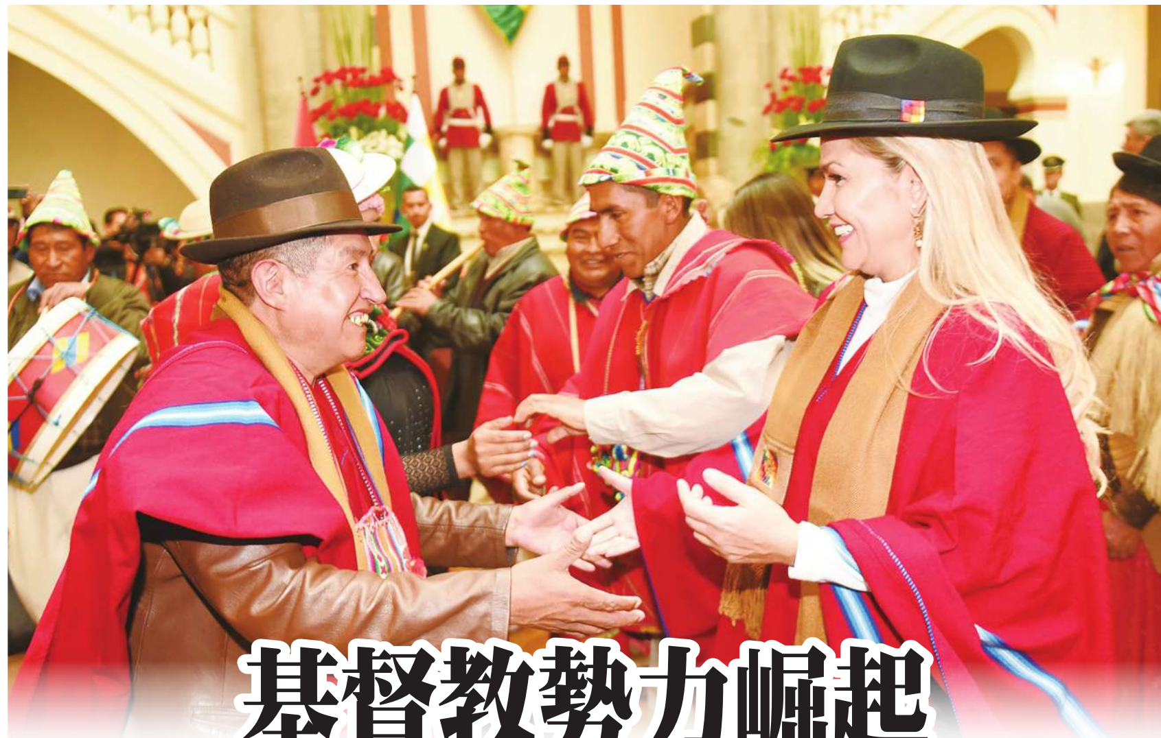
▼艾尼茲(右)上任時，宣示將帶領玻利維亞重回聖經的教導。