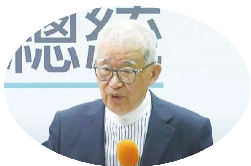
▲新黨不分區提名第一名、前監察院長王建煊說，因為「愛台灣」，所以主張兩岸和平統一，他擔憂台灣像烏克蘭「什麼都沒有了」。