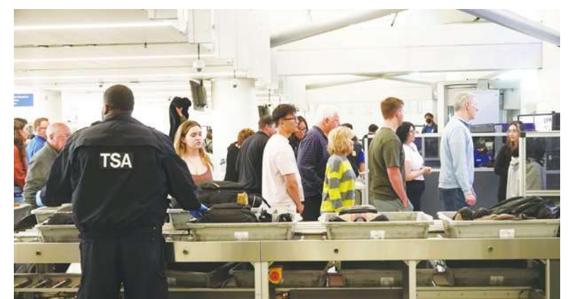
▲ 負責機場安全檢查的美國運輸安全管理局 (TSA) 發表數據，2023 年全美機場安檢共查出 6737 支槍枝，創歷年新高。

早開打。(圖為前年在巡迴賽打到凌晨快 5 點的茲維列夫)。