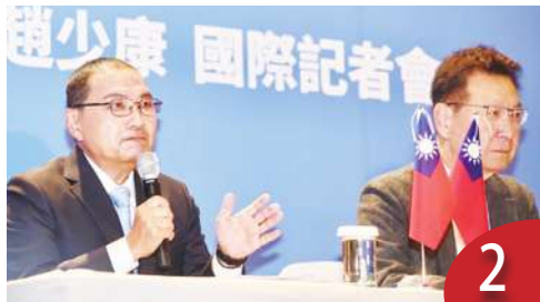
兩岸對話 侯：從民間交流開始