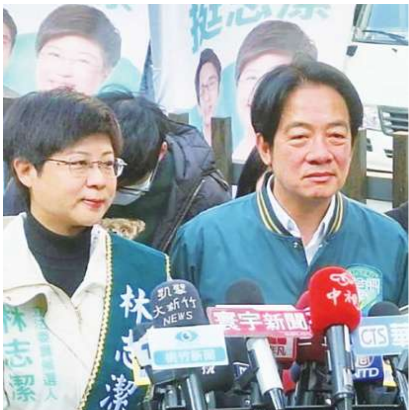
▼民進黨總統候選人賴清德(右)到新竹市陪同黨籍立委候選人林志潔(左)車隊掃街，做最後衝刺。