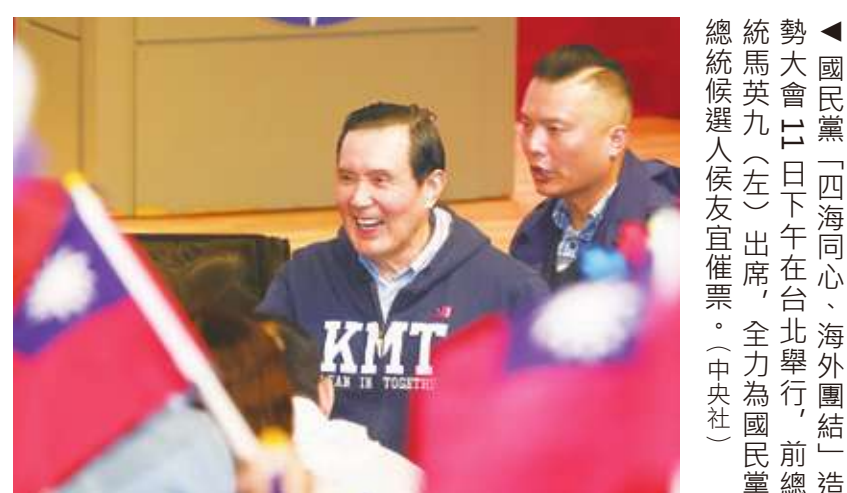
▲國民黨「四海同心、海外團結」造勢大會12日下午在台北舉行，前總統馬英九(左)出席，全力為國民黨總統候選人侯友宜催票。

選票、安排選監人員，不得有任何的疏忽、可以說是忙昏了頭。而且要一直忙到週六晚上開票結束為止。 選舉是台灣的大事，尤其今年碰到非常拉鋸的總統選舉，因為三黨候選人的支持度相近，已經引起全民跟國際社會的關注，希望我們能夠完成一次平和順利的選舉，展現台灣的民主。 選舉結果必然是「幾家歡樂幾家愁」，願大家都能夠平心靜氣地接受選舉的結果，這也是我們衷心的禱告。