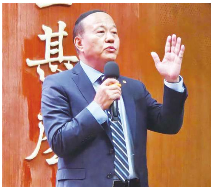
▲ 國防部 11 日在行政院記者會上，再次說明衛星簡訊的處理過程與改進作為。(圖為國防部副部長柏鴻輝。)

【本報記者呂翔禾台北報導】「國軍發布示警簡訊是擔心國人安全，並沒有介選企圖！」國防部副部長柏鴻輝 11 日在行政院記者會上這樣說。針對此次衛星簡訊風波，行政院長陳建仁也表達力挺國軍之意，並指示國軍未來在簡訊內容上進行檢討。國防部官員也說，因為此次衛星發射與原先軌道差異大，且有可能影響台灣，所以發簡訊示警民眾。