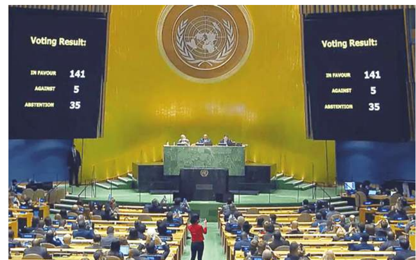
▲摩洛哥代表奈柏爾打敗南非代表柯西，當選聯合國人權理事會主席，引發競爭對手南非不滿，雙方互批人權紀錄不佳。