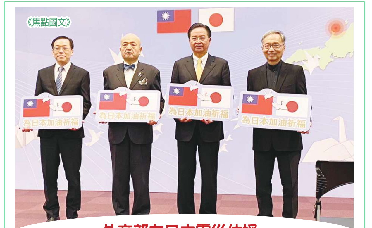
▲ 外交部 4 日舉行「支援能登半島震災，為日本加油祈福」記者會，外交部長吳釗燮(右 2)、衛福部長薛瑞元(右 1)、日本駐台代表片山和之(左 2)等人出席。吳釗燮表示，現在輪到台灣人民展現愛心，「日本有事，就是台灣有事」。

侯競辦發言人江怡臻表示，有民調顯示 70% 民眾不贊成廢死，前總統馬英九任內執行 33 個死刑，民進黨任內僅有 2 次，蔡英文總統說台灣沒有廢死，但這樣技術性拖延就是「實質廢死」，近日割喉案受害家屬也明確「反對廢死」，並呼籲檢討學校安全輔導制度，盼民進黨總統候選人賴清德直球面對是否支持廢死。