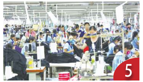
中就業市場惡化 青年積不滿