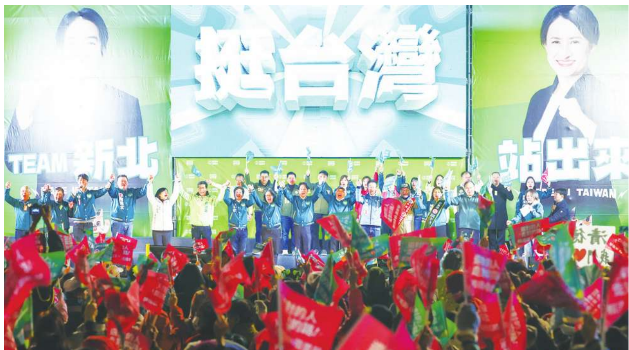
▲ 民進黨在新北市土城區舉行選前造勢晚會，正副總統候選人賴清德、蕭美琴同台造勢，呼籲支持者相挺，讓民進黨贏得國會過半。