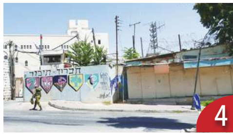
真主黨發動攻擊 以八萬人流離