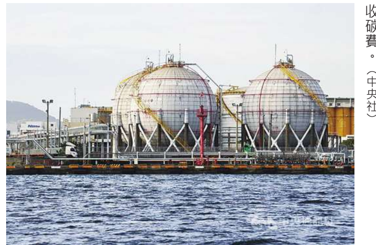
▲石化業者近日反應，產業景氣低迷，未來前景也看淡，盼政府暫緩徵收碳費。

環境部 4 日首度公開碳費收費計算公式，擬以年排放量扣除 2.5 萬噸的剩餘量來徵收碳費。石化業者指出，中國石化產能大幅提升，已嚴重供過於求，若再加上高碳費，台灣石化業的經營將更為艱困，甚至削弱國際競爭力，希望政府體恤石化業經營困境，暫緩徵收碳費。