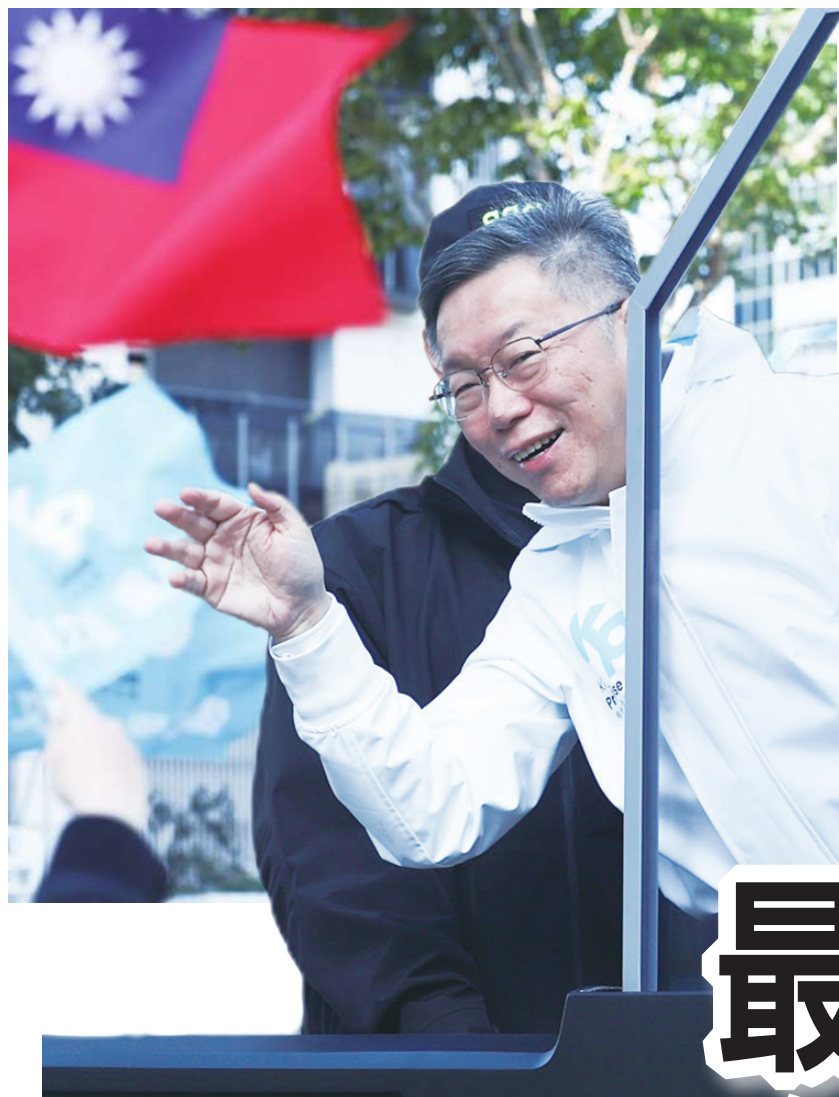
▼ 台灣民眾黨總統候選人柯文哲在新北新莊車隊掃街，向支持者揮手致意；掃街車搭載防彈玻璃帷幕，確保候選人安全。