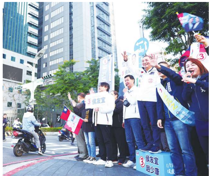
▲ 國民黨總統候選人侯友宜（前右 3）到新北市板橋區縣民大道路口向民眾與車輛揮手拜票，懇請支持「3 號侯康配」。(中央社)