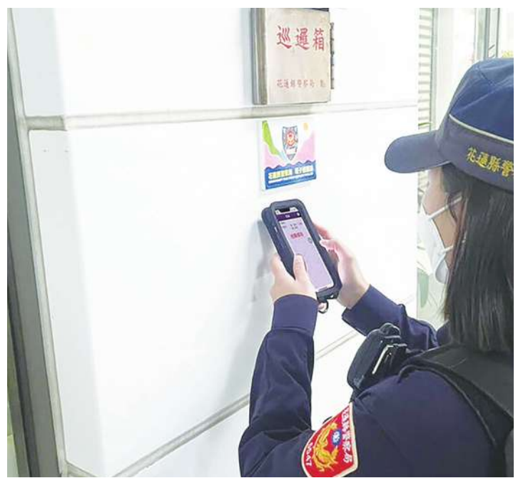
▲數位部近日公告「電子簽章解決方案服務能量登錄申請機制」，盼擴大電子簽章的應用。(中央社)

數位部說明，電子簽章法修法草案已在去年 8 月底預告結束，去年 10 月已經送到行政院，這次公告電子簽章解決方案服務能量登錄申請機制，算是修法後的配套機制。許多企業要導入電子簽章可能還不知道要找什麼樣的技術較好，透過登錄機制，讓外界更清楚有哪些方案可選擇。