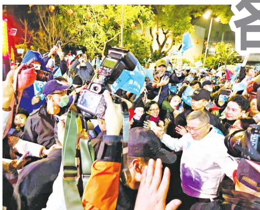
▲ 台灣民眾黨總統候選人柯文哲（前右，白衣者）前往桃園平鎮的造勢大會，民眾不斷高喊「台灣的選擇，柯文哲」。