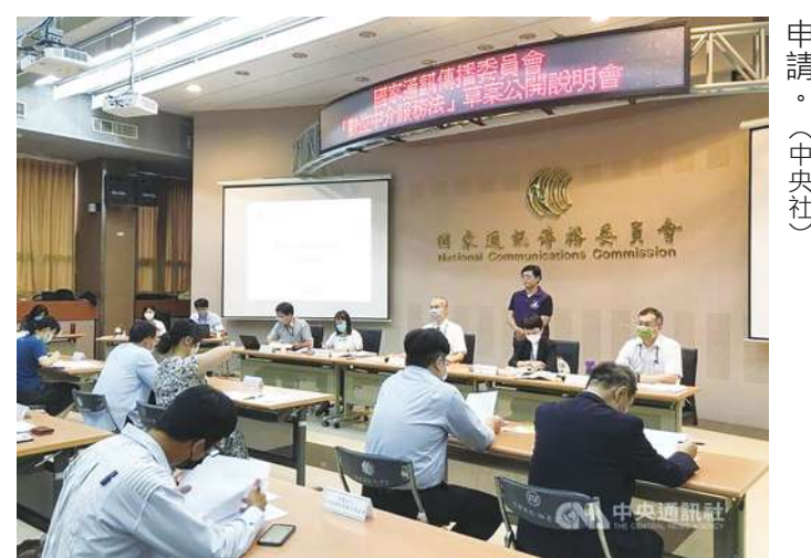
▲NCC 近日表示，已經收到彰化縣有線電視系統「新彰數位」的終止經營申請。

媒體關注新頻道為凱擘旗下系統，如果承接新彰戶數，不會踩到現行 1/3 市占上限規定。NCC 回應，此案由於地緣關係因此規劃由新頻道接手用戶，但委員會針對個案還會再做討論。