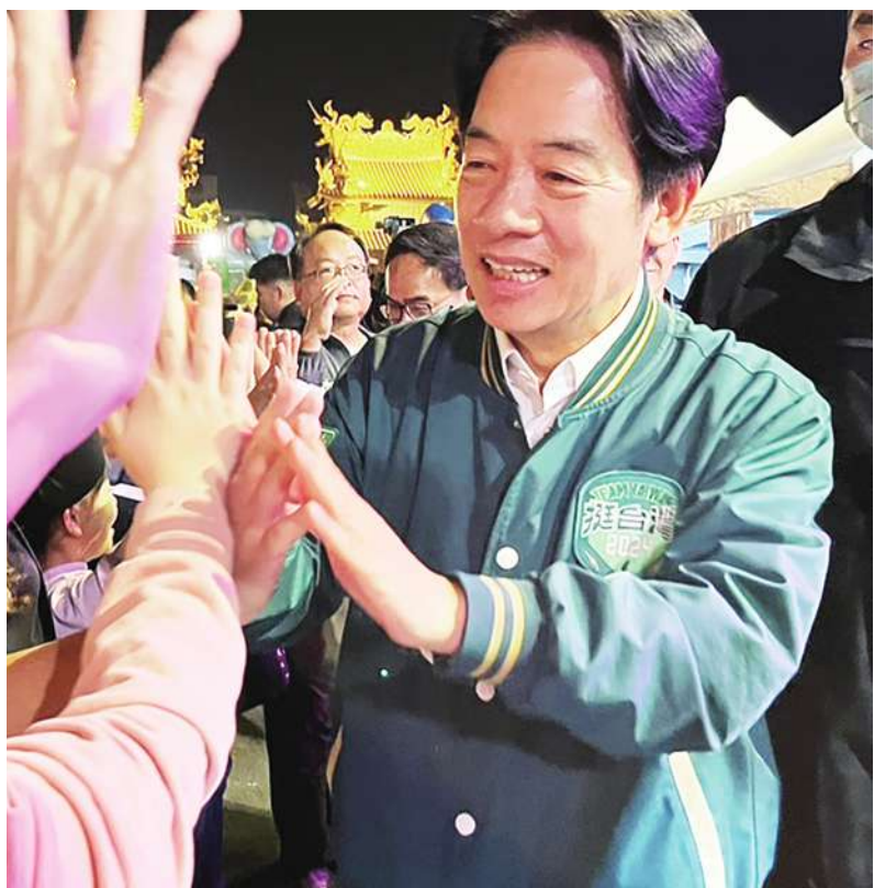
▼ 民進黨總統候選人賴清德現身高雄鳳山，為黨籍立委參選人許智傑站台造勢，現場受到支持者熱烈歡迎。(中央社)