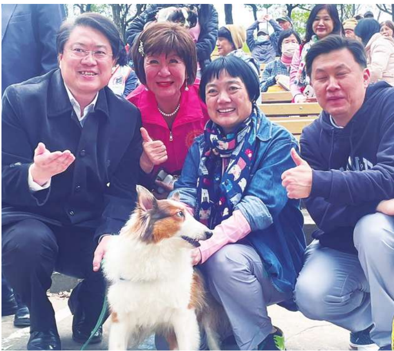
▲我愛毛孩公益嘉年華 4 日於大安森林公園盛大登場，內政部長林右昌 (左一) 與狗狗合照。。

目前晶片登記在案的犬隻有 300 萬隻，好德文化公益協會理事長王義郎指出，狗狗飼養