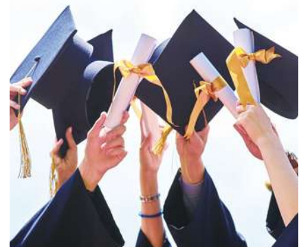
▲ 大學選系，除非孩子有明顯的興趣，都要考慮該系是否有發展前景，是否容易找到工作。(網路截圖)

早年我們大學畢業後，有辦法的人，無不出國留學。拿到學位，多數都不回國，而是在外國打拚，後來成為美國公民。但是台灣發展的很快，台美差距縮小，在台灣打拚似乎更愉快，更有出路。但如果有機會出國，我仍然贊成出去闖蕩，拿到學位後，在美國公司做幾年事，取得經驗，再回台灣。這樣學經歷都不錯，更重要的是英文能力突飛猛進。具備這些基本條件，當然可以大展鴻圖，有所成就。