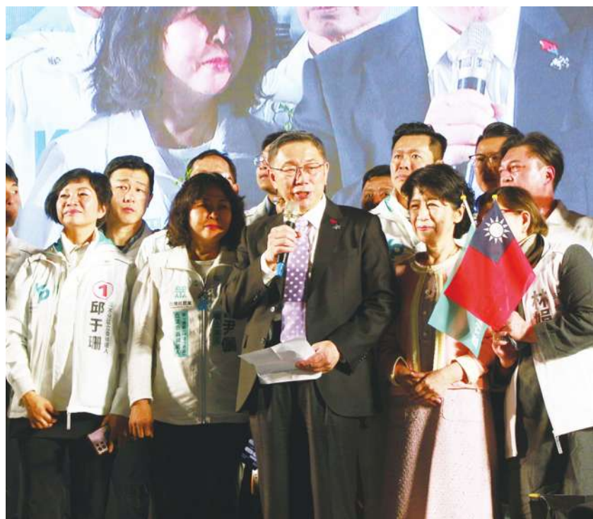
▲ 民眾黨總統候選人柯文哲出席台中造勢晚會表示，「這次我們可以把藍綠都下架，一定要把國家贏回來，還給人民」。

總統大選倒數 10 天，儘管全台各地都出現低溫，但各黨總統候選人 4 日仍都親自到街頭與支持者握手拜票。