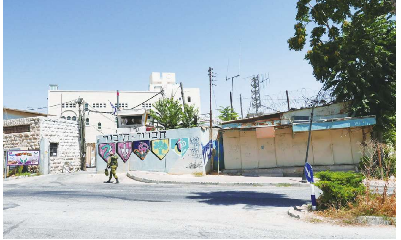
▲以色列邊境村莊民眾為了躲避真主黨發動攻擊，已經撤離家園。

即使盟友美國過去幾個月期竭力阻止，認為這類行動將迫使真主黨以極強硬的方式回應，引發日後難以收拾的衝突。」