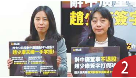
趙握 9 成中廣股份 時力籲出售