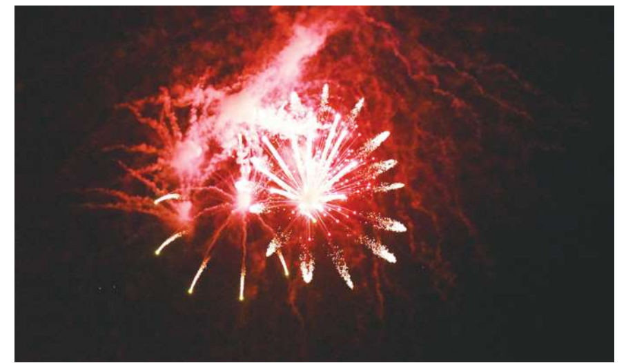
▲ 研究指出，超過三成民眾在新年時都會許下新年新希望，但大多數都會以失敗告終。

研究也指出，無論是跟陌生人交談、享受驚嚇等新事物，都有助於讓民眾感覺更快樂、生活更有彈性，進而降低生活的壓力。同時，如果能學習新技巧、培養全新的嗜好有助於大腦保持年輕，也能激發創造力與解決問題的能力。