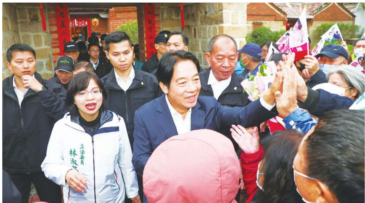
▲ 民進黨總統候選人賴清德（中）於新北市蘆洲，參訪國定古蹟蘆洲李宅，賴清德和支持者擊掌。