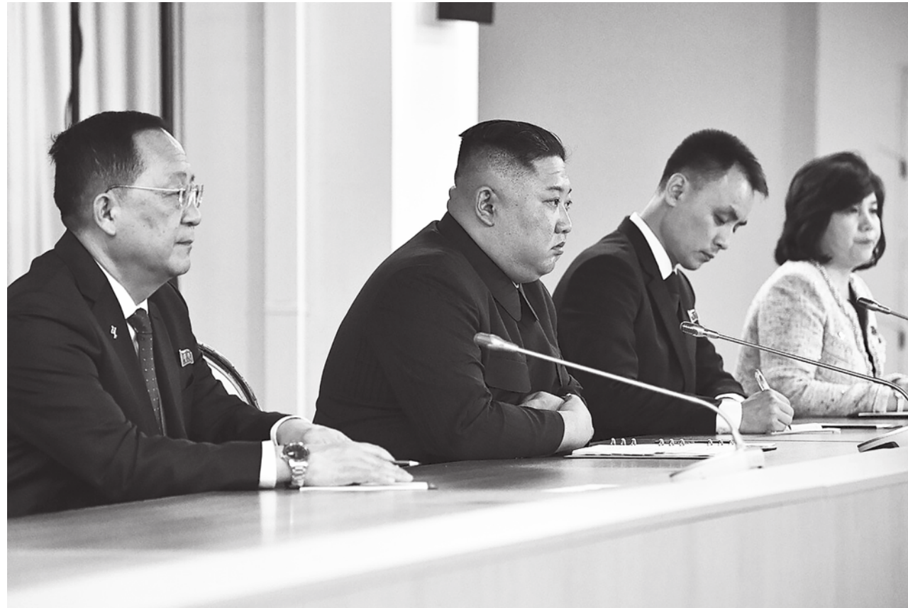
▲ 北韓領導人金正恩 (左 2) 31 日的新年談話中，宣布新年還要再發射 3 枚間諜衛星。

《CNN》提到，金正恩也表示，為了強化軍武戰力，2024 年將會聚焦核武、飛彈與無人機的發展，以因應南韓可能的快速攻擊。梨花女子大學教授艾思利認為，北韓威脅將會強化美日韓的三邊合作機制，尤其是飛彈資訊的共享與因應。