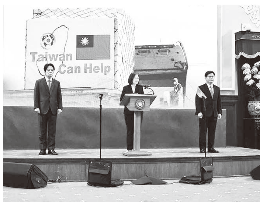
▲總統蔡英文1日發表元旦談話，並接受媒體提問。

由於副手賴清德近日在辯論會直言「中華民國是災難」引發熱議，蔡總統被問及相關問題時緩頰說，擔任總統的人本來就要以《中華民國憲法》與《兩岸關係條例》處理兩岸