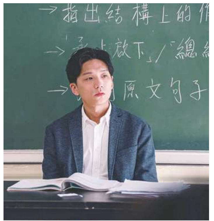
▲《年少日記》關注學童自殺高企的現狀，但有趣的是，這故事分兩線敘事，一者回溯主角男老師昔日的年少記憶，一者追蹤現在正發生的學生尋死線索。(網路截圖)

的港片《年少日記》和《白日之下》，都是氣氛十分壓抑的時代悲劇。《年少日記》是香港第五屆「首部劇情電影計劃」大專組得獎作品，故事寫校園霸凌和家庭暴力，都不是新鮮題材，但編導卓亦謙的敘事技巧高明，感情交代沉穩細膩，以一封沒署名的學生遺書和一本主角的童年日記作串連，以過去與現在的雙線勾勒出主人翁不願面對的傷痛，非常值得「望子成龍」的父母引以為戒。《白日之下》寫記者臥底調查殘障人士看護機構發生的虐待和性侵醜聞，有一定的社會批判價值，拍得也算嚴謹，但探討的層面比較淺，跟取材相近的日本電影《月》(The Moon)相比較，馬上分出高下。