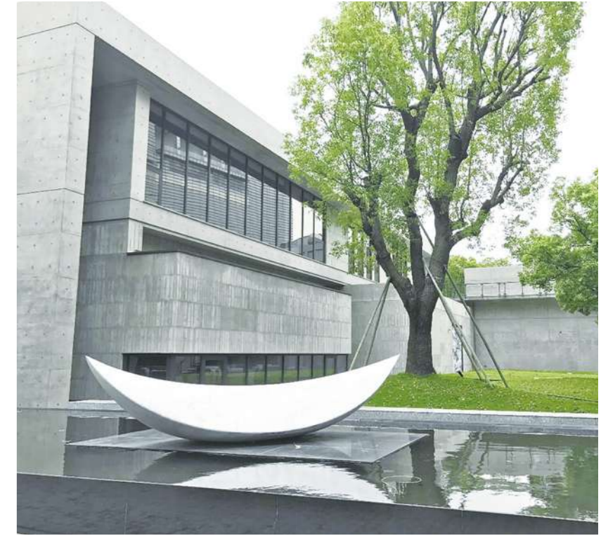
▲台中的「解空間」遇見安藤忠雄清水混凝土的感動。