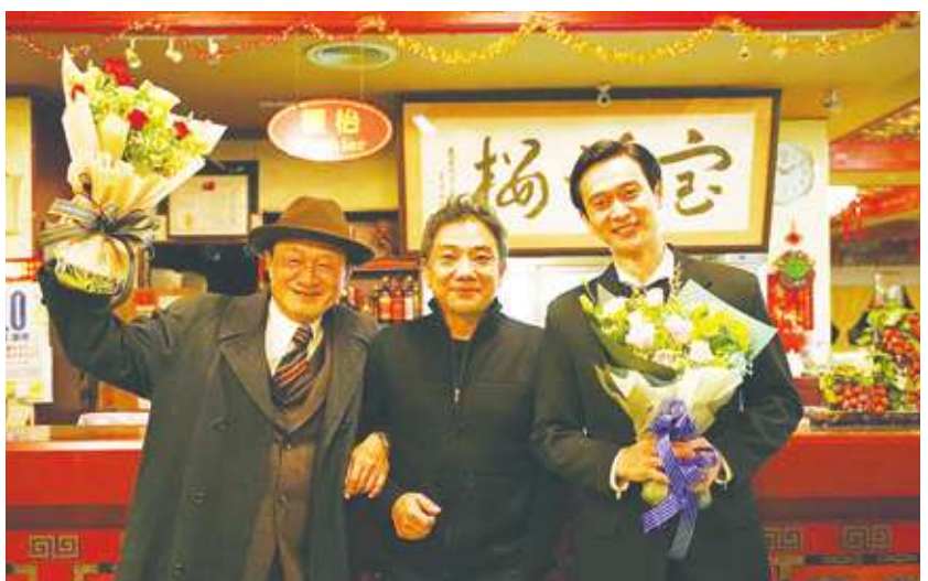
▲《老狐狸》在上映全台之前，就已入圍七項金馬大獎，近期更準備於東京國際影展作世界首映，讓導演與演員們都難掩興奮之情！