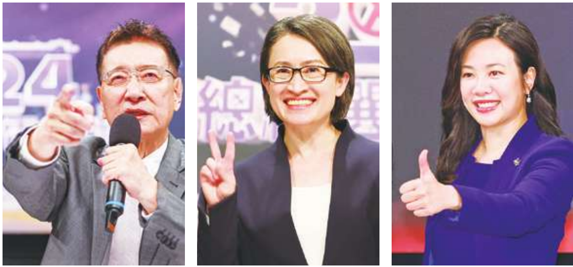
▲2024 副總統候選人電視辯論會在公視登場。圖為國民黨副總統候選人趙少康（左）、民進黨副總統候選人蕭美琴（中）、民眾黨副總統候選人吳欣盈（右）。

國民黨副總統候選人趙少康語出驚人，當場宣布辭去中廣董事長，還宣稱若當選副總統將不領副總統薪水，並將官邸捐出做為社會住宅。