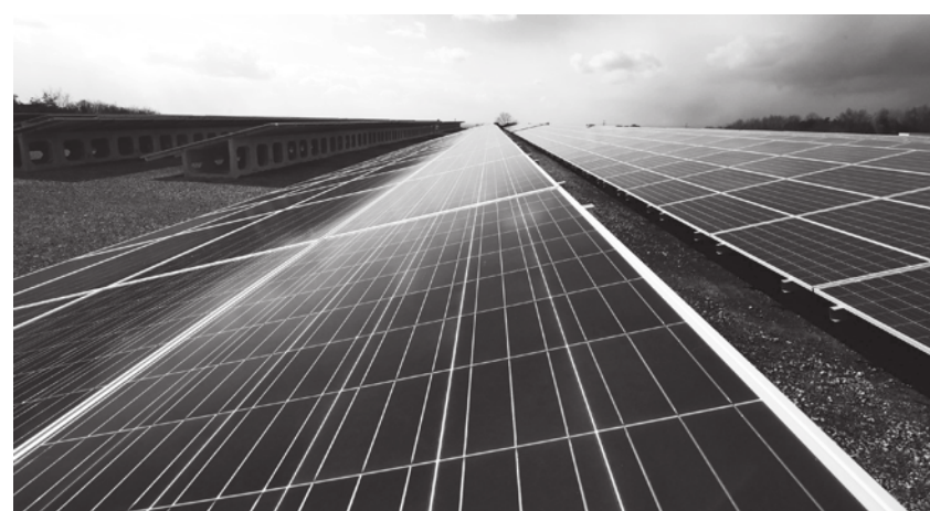
▲ 2023 年將是史上全球能源碳排放量最高的一年，意味著從 2024 年開始，隨著淨零的趨勢，各國都逐漸減少化石燃料的使用。

意「轉型脫離化石燃料」，雖然最終協議並沒有達成大多數國家想要的「汰除或逐步減少」，但這也是首次達成脫離化石燃料的訊息，美國氣候特使凱瑞指出，這已足夠「對全球釋出強而有力的訊息」。