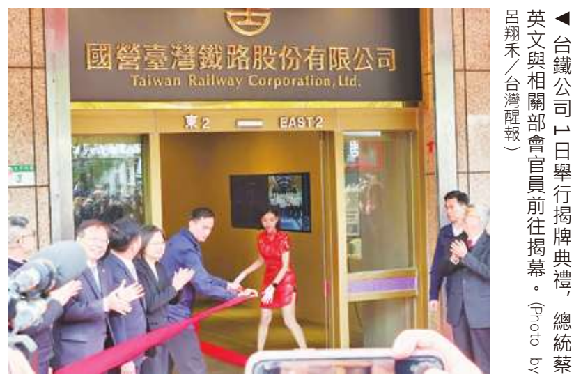
▲ 台鐵公司 1 日舉行揭牌典禮，總統蔡英文與相關部會官員前往揭幕。

行政院長陳建仁則說，他當年從高雄舉家搬到台北，就是坐台鐵的車廂，台鐵不只帶動觀光人潮流動，也對台灣經濟