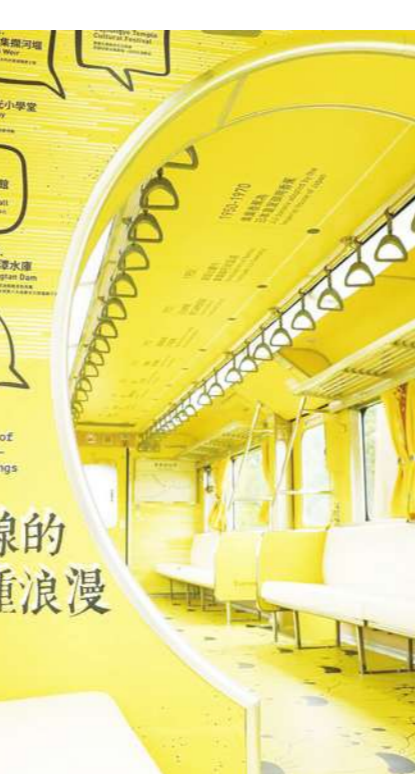
集集線的二十種浪漫

的清晨，感受到歐洲高山湖泊的寧靜與清幽；在台中的「解空間」裡，找到京都的典雅與古趣。