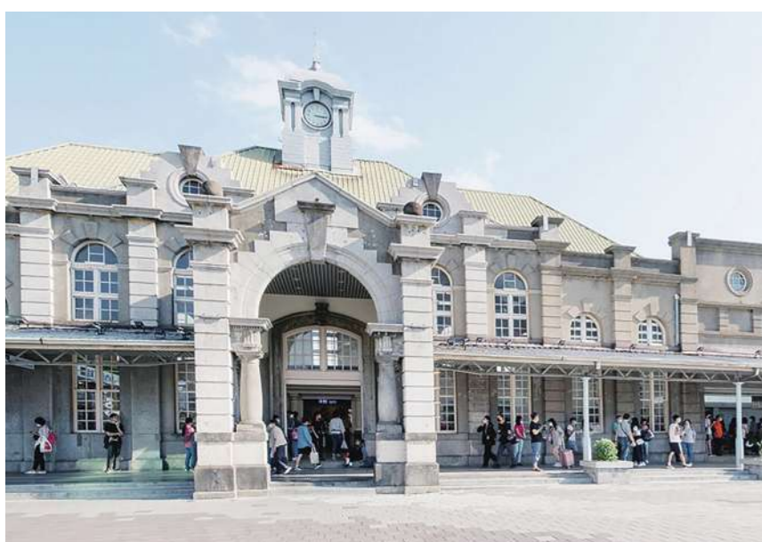
▲新竹車站體會到義大利文藝復興古典建築的黃金比例。