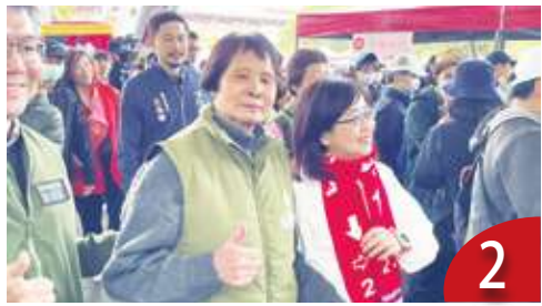
萬人元旦健走 紀政成合照亮點