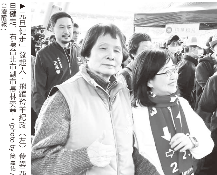
元旦健走活動1日盛大登場，有超過萬人共襄盛舉，包括「飛躍羚羊」紀政本次也參與健走，吸引許多民眾爭相合照。

【本報記者簡嘉佑台北報導】近萬名民眾排成長長人龍，沿著河濱的美景健走，元旦健走活動1日盛大登場！