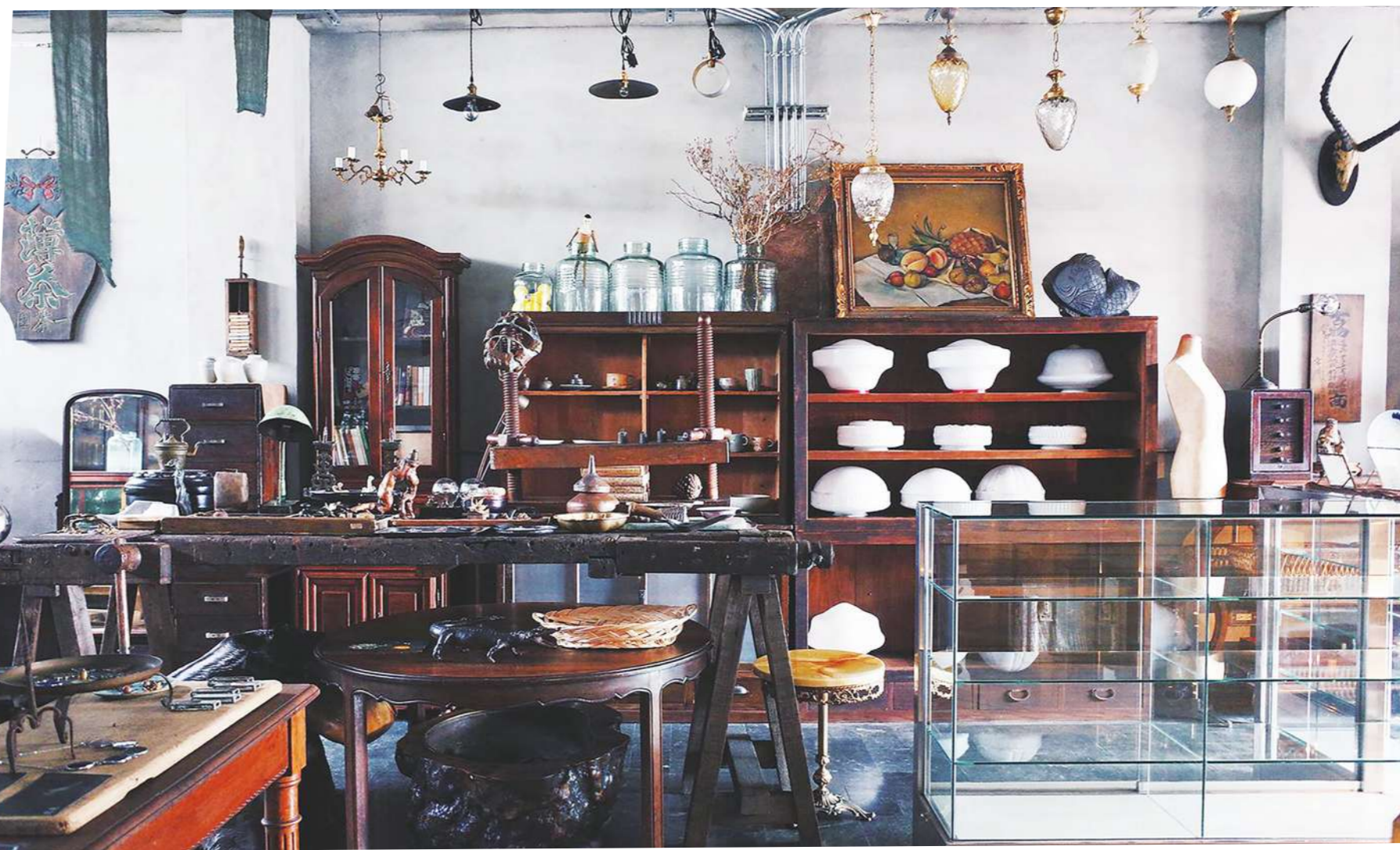
▲台南老房子骨董店「鳥飛」裡，找到京都的典雅與古趣。

本書以台灣城鎮建築旅行為主題，由「都市偵探李清志」領路，帶您走進我們家鄉各地的四十座名建物裡。