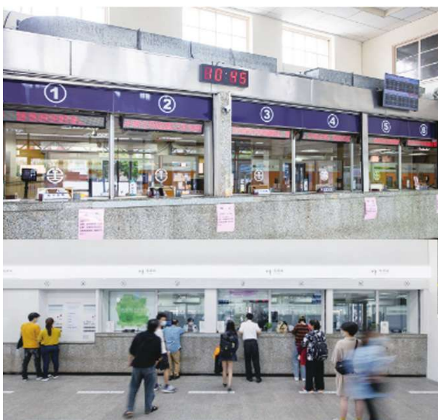
▲售票口改造前(上圖)改造後(下圖)以簡潔燈箱及輕透玻璃改造後，帶來清爽觀感。(網路截圖)