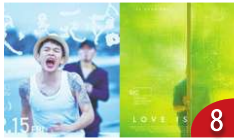
回顧 2023 小而美華語電影