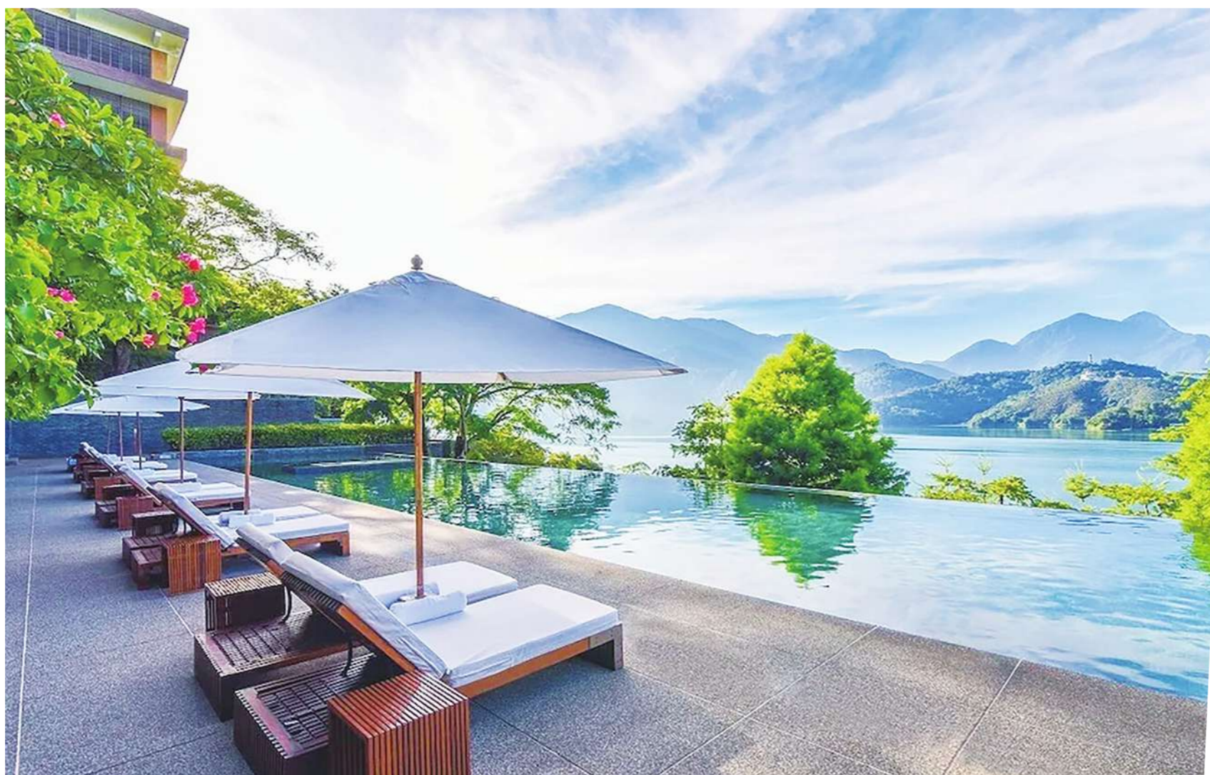
▲日月潭畔「涵碧樓」的清晨，感受到歐洲高山湖泊的寧靜與清幽。(網路截圖)

一段日子，因為似乎大家生活慢下來，病毒才會慢下來！幸運的是，台灣在這波流行疫情肆虐中，在醫藥護理人員，以及全國民眾的努力與配合下，成為世界