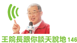
王院長跟你談天說地 146

父母愛孩子，希望他們出人頭地，但不要窮緊張。現在流行的不要輸在起跑點，要贏在起跑點，都是一些傷害孩子、揠苗助長的論調。聰明的父母，請稍安勿躁，按照《聖經》的話語來教導孩子，其他的就都交給上帝吧！