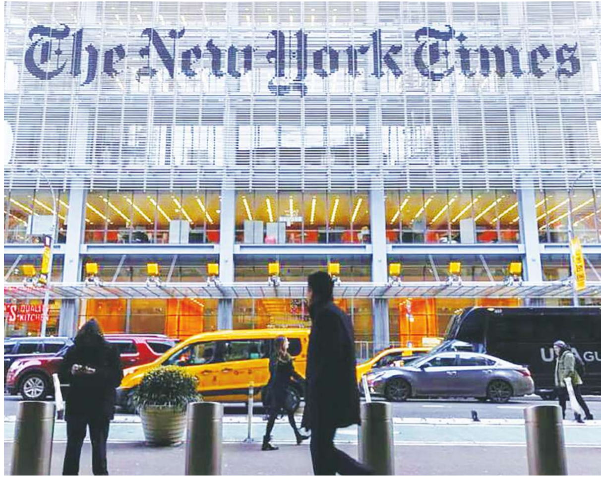
▲紐約時報 27 日控告 OpenAI 與微軟侵害版權，並求償數十億美元。(中央社)

【本報記者呂翔禾綜合報導】不是所有東西都可以拿來餵演算法！紐約時報 27 日控告 OpenAI 與母公司微軟，未經報社同意就使用付費內容訓練 ChatGPT 的大型語言模型 (LLM)。目前 OpenAI 與微軟還面臨其他有關內容許可權的訴訟，也顯示人工智慧發展與智財權維護之間，仍有許多法律爭議待釐清。