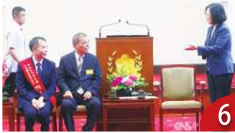
6 比一比總統參選人的農業政見