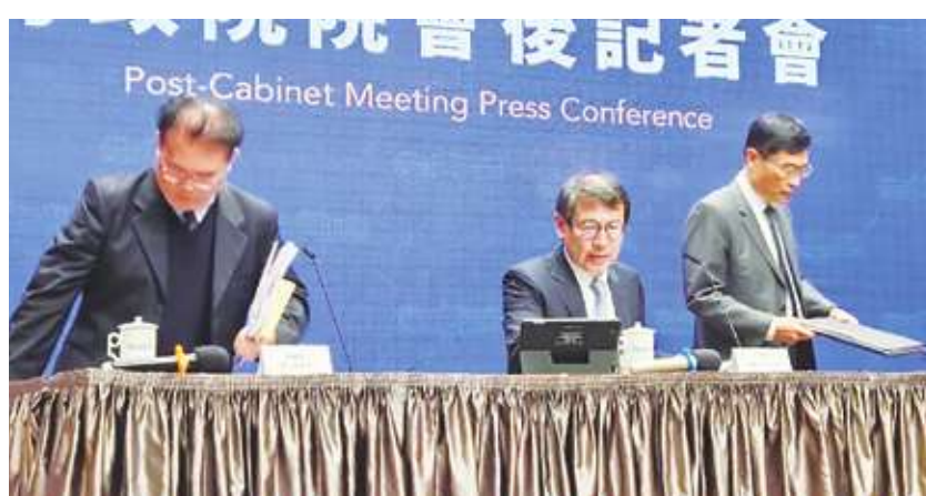
▲ 行政院 28 日提醒 2024 年新制，行政院長陳建仁也要求司法院與六都檢討校安改善措施。

負擔減輕方面，2023 年度每人基本生活費，由 19.6 萬元提高至 20.2 萬元，預估 235 萬戶受惠，並調高綜合所得稅免稅額、標準扣除額、薪資所得及身心障礙特別扣除額等減稅優惠、延長大宗物資降稅措施至