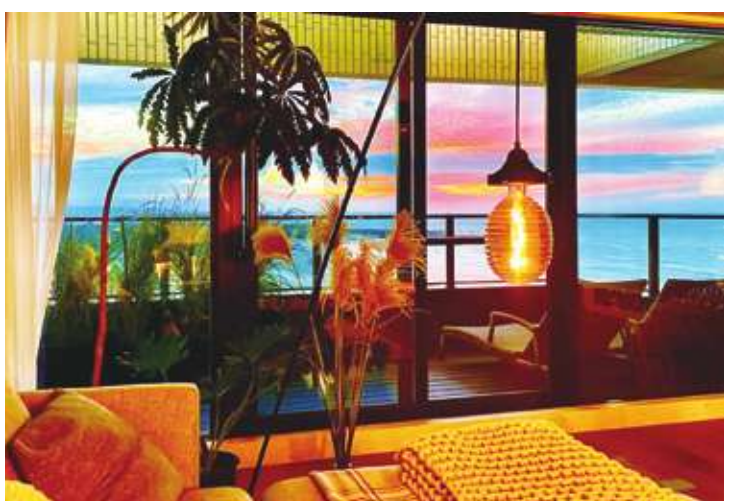
▲▲在三芝鄉的住家大樓上捕捉落日餘暉，只有幾秒的燦爛，卻在鏡頭下留存永恆的記憶。誰打翻了調色盤，讓落日依依不捨？