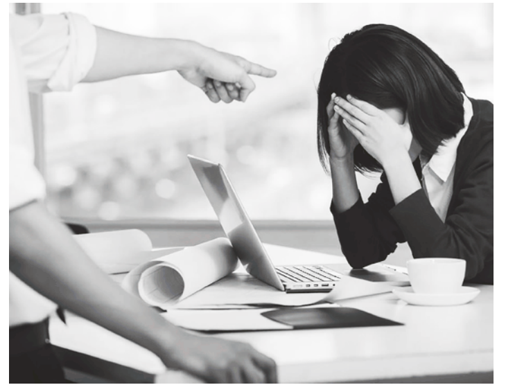
「能做出成績的主管所灌輸的是一「有效的工作方式」，而做不出成績的主管卻會灌輸給下屬「無效的工作方式」。

不需要努力磨練，只要重新安裝即可。就像電腦的作業系統一樣，在腦袋裡安裝「正確的思維演算法」，任何人都能在短時間內做出成果。本書將代替一流的主管，傳授各位能應付各種情況的強大武器。