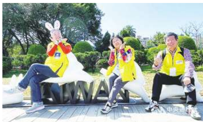
隨著年齡的增長，老年人會越來越像小孩子。