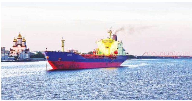
▲今年中國與印度成為俄羅斯石油最大買家。

即使這些銷售合法，但反對者認為，等於為俄羅斯石油開後門，並已破壞制裁的力道。 俄國預計今年石油與天然氣營收有望來到 980 億美元，金額與入侵烏克蘭之前相當，石油與天然氣產業目前則佔俄羅斯 GDP 27%。