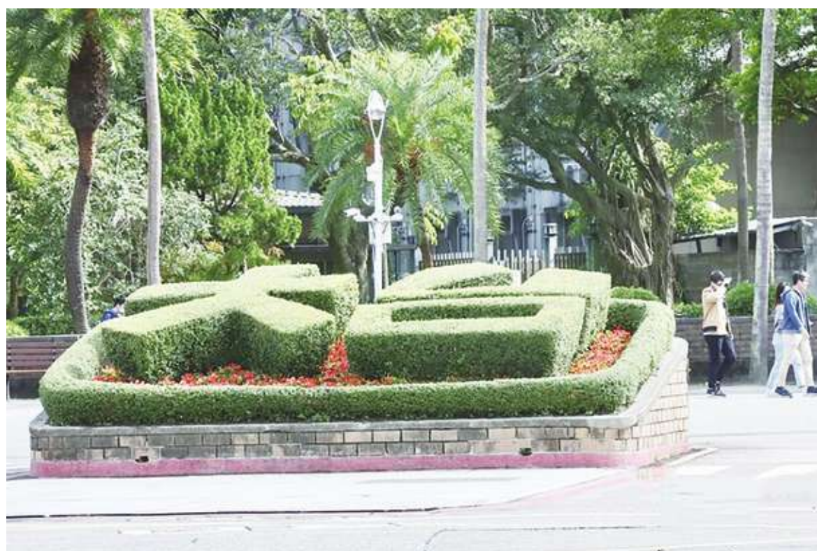
▲教育部 28 日公布 112 學年大專新生註冊率，除了私立大學以外，公立大學也有博班開始出現 0 新生的狀況。(中央社)

31.82%、中華福音神學研究院 44.83%、遠東科大 47.55%、大葉大學 47.87%、玄奘大學 48.60%、元培科大 50.44%。碩士班則有 17 班掛零，其中 5 班為在職專班，8 班為日間部，包括政治大學神經科學所碩士班、清華大學亞際文化研究國際碩士學位學程。