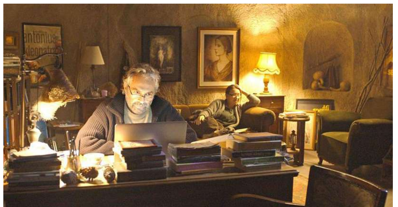
▲《冬日甦醒》片長長達3小時17分鐘，勇奪坎城金棕櫚獎。