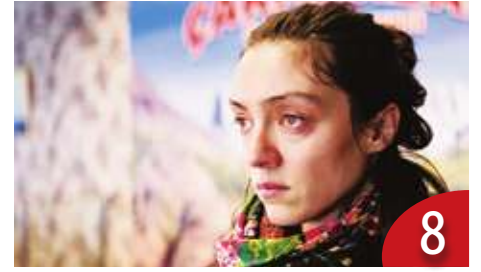
8 《春風勁草》Me2 另類思維