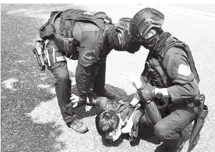
法務部28日提醒境外介選樣態，若檢舉最高有2千萬獎金。

另外，檢舉境外勢力介選最高可獲得2000萬元檢舉獎金，法務部則會透過資金網絡、資訊網絡及人脈網絡等三大面向，