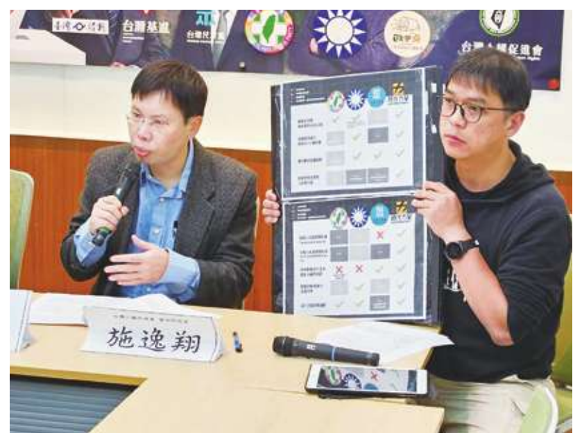
▲ 人權團體 28 日提出對不分區政黨的人權政策觀察，小黨普遍回答較大黨充分。

【本報記者呂翔禾台北報導】「小黨要願意建立難民庇護機制，藍綠白等政黨要再加油！」台灣人權促進會(人促會) 28 日公布各黨對人權政策的看法，資深研究員施逸翔指出，時代力量、綠黨與小歐盟等政黨，幾乎都願意保障遠洋漁工、不強制換發數位 ID 與改革警政系統。會長涂予尹則說，國民黨雖支持制定難民法，但立法院並未提案，殊為可惜。