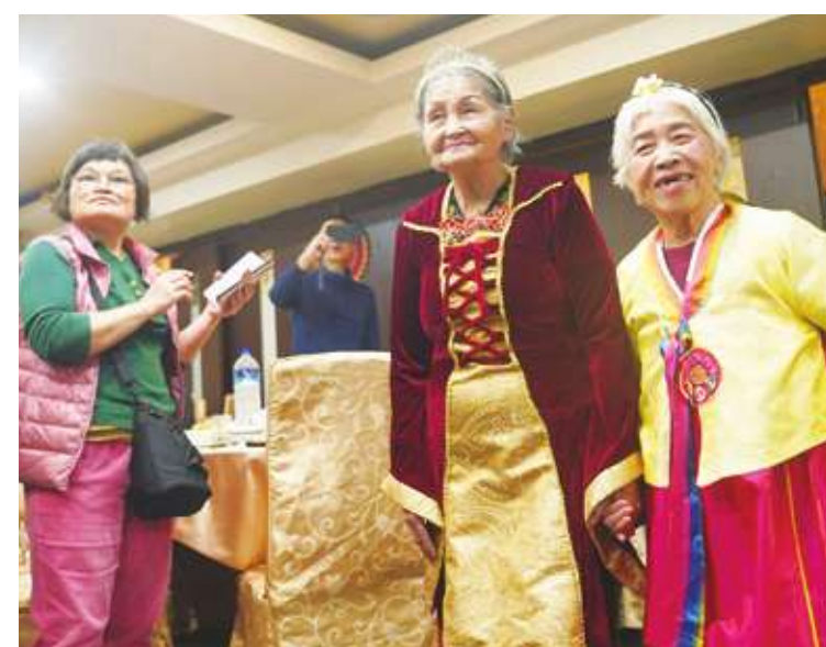
▲ 農曆年節將至，伊甸基金會 28 日在台北舉辦首場「愛圍爐」活動，邀請獨居、弱勢長輩與志工一起辦桌圍爐，共享團圓宴，並透過舉辦走秀活動，希望讓長輩們留下難忘回憶，重拾自信。