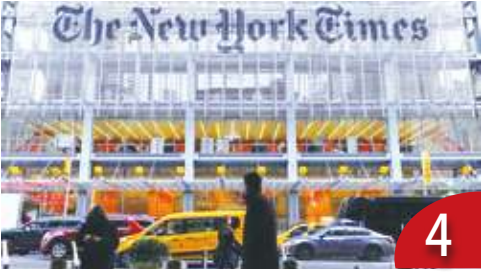
4 紐時控 AI 拿付費內容跟演算法