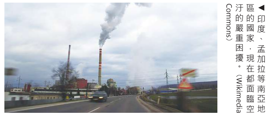
▲南亞空汙嚴重的國家，印度、孟加拉等國現在都面臨空汙問題。

《世界銀行》報導，全世界空汙最嚴重的 10 個城市中，有 9 個就在南亞，且空汙指數比起世界衛生組織 WHO 的建議值超標 20 倍，每年估計造成 200 萬人死亡，但相關問題除了牽涉氣候以外，還有生活型態與產業發展的改變，包括交通、農業與畜牧業等，短時間很難改善。