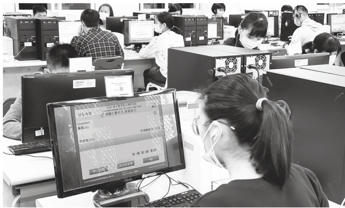
英聽測驗包括：圖片聽解、對答、簡短對話、短文題解與長篇聽解等五種題型。（網路截圖）

【本報記者簡嘉佑台北報導】第二次高中英聽成績出爐，A級10%、B級43.51%、C級42.77%，其他則不及格！大考中心主任張新仁28日召開記者會指出，其中有27356人為重複考生。台大生傳系特聘教授岳修平指出，其中27.14%的學生成績等級有提升，跟過往提升成績的比例差不多。