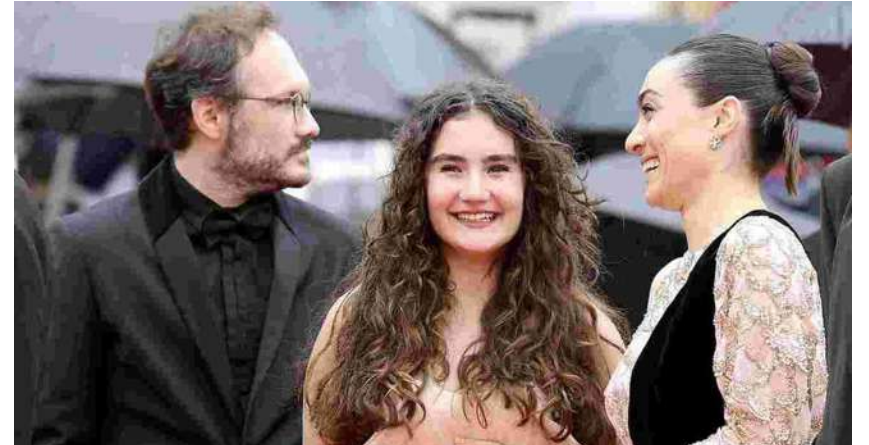
▲電影「春風勁草」是土耳其導演努瑞貝其錫蘭(Nuri Bilge Ceylan)的第9部作品，29日將在台上映，女星梅薇迪茲達(Merve Dizdar)(右)、愛潔巴吉(Ece Bağcı)(中)憑藉該片，分別獲得坎城影后、芝加哥國際影展銀雨果獎最佳配角獎。

案件日增，光2022年就有397名土耳其女性死於暴力，因此今年五月大選結果仍是正義發展黨獲勝，有名20歲的女性因此尋短，並留下遺書說「身為女人，我從未感受到自由，我無法度過童年，也無法度過青春。」