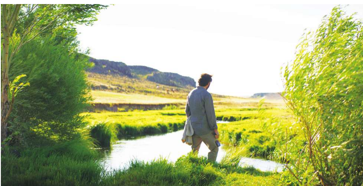
▲「堅持不拍短於三小時電影」的土耳其大師努瑞貝其錫蘭，他藉契訶夫式的角色與劇本架構，輔以呼吸感的攝影與場面調度，再次對人性善惡進行深入的道德探問。