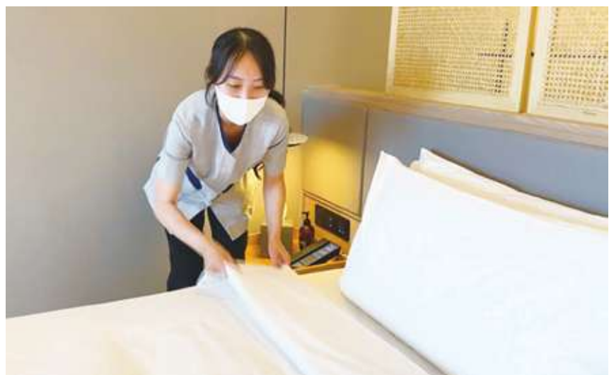
▲ 主計總處 27 日公布職缺統計，8 月職缺比 2 月還要多 2.1 萬個。