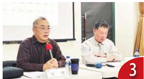
對中順差達千億 政治不利經濟