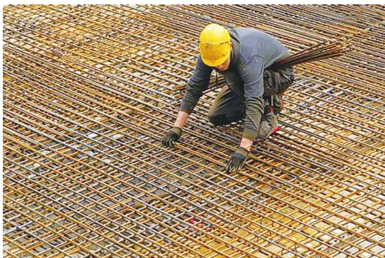
▲ 各職類中，基層技術工及勞力工之職缺平均持續時間達 4.6 個月最長。

各職類中，基層技術工及勞力工之職缺平均持續時間達 4.6 個月最長，技藝有關工作人員、機械設備操作及組裝人員為 4.3 個月次之。