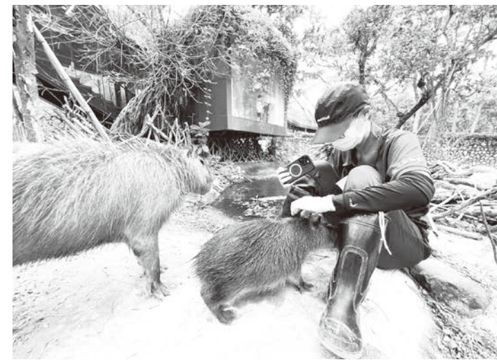
▲高雄市觀光局將提升壽山動物園保育員待遇，按照照顧動物危險性分級，調升為新台幣 3000 至 5000 元不等，自 113 年 1 月 1 日起生效。圖為透過親近訓練使新生水豚跟媽媽願意主動靠近保育員。