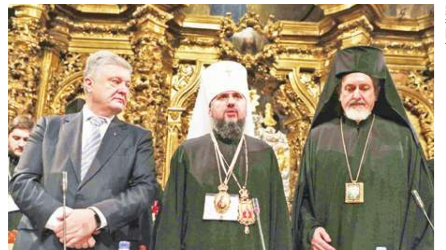
◀ 烏克蘭東正教會正式脫離俄國教會。(網路截圖)

除此之外，採用公曆制也是烏克蘭持續融入歐洲的作法之一。烏克蘭與俄羅斯在文化上彼此共享，同時也相隔成兩個國家，但隨著俄羅斯的侵略，更深化了烏克蘭的自我認同。