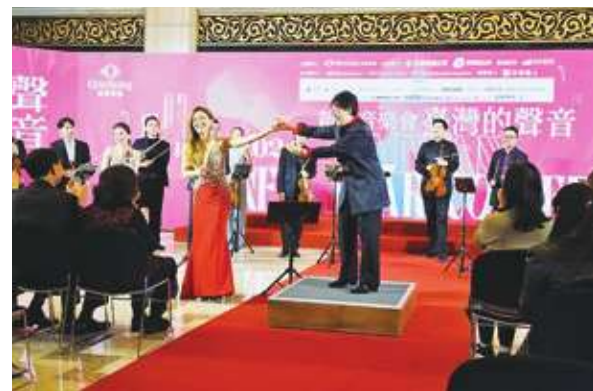
▲灣聲樂團與朱宗慶打擊樂團將於明年1月1日舉行新年音樂會，還邀請到知名長笛天后崔娜卿一同演出。

《劇末了，情待續》與交響組曲《時代的情書》。其中，《劇末了，情待續》將會由國際長笛天后崔娜卿擔綱獨奏。崔娜卿很開心的說，在演奏曲子時，感覺與聽眾的距離拉近，非常親切。