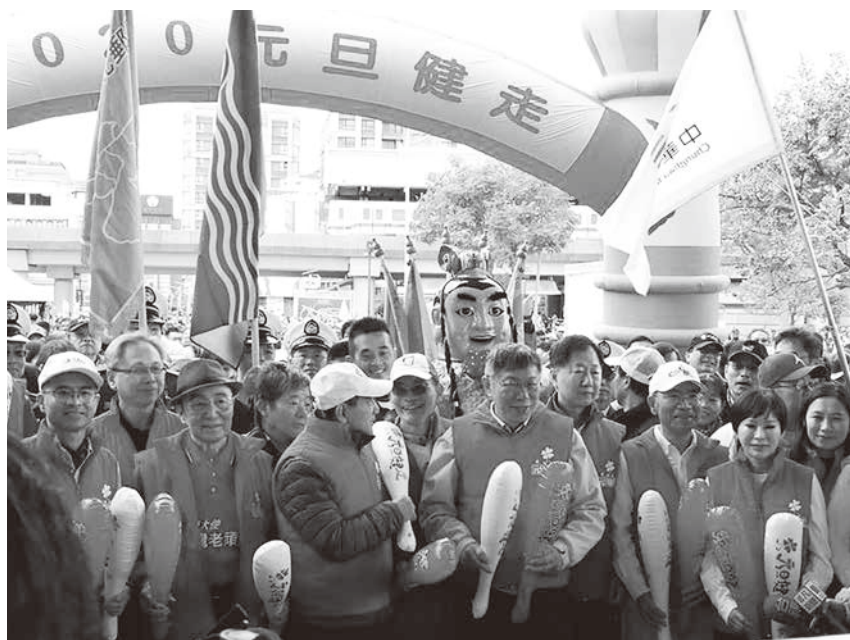
▲台北市府體育局與希望基金會 1 月 1 日將舉辦的「元旦健走」活動。圖為 2020 年元旦健走情景。(資料照)