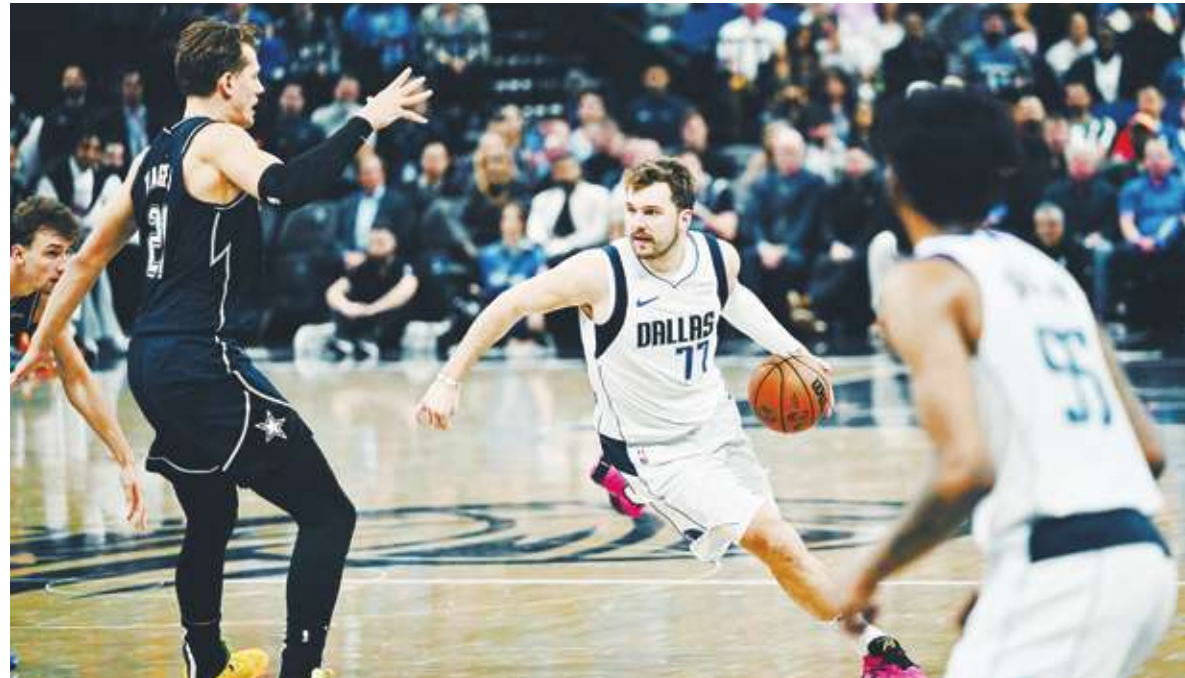
▲獨行俠主將東契奇狂轟 50 分、拿下聖誕大戰勝利。

最後是精彩的聖誕大戰，NBA 的聖誕大戰安排好戲已是傳統，本季聖誕大戰迎來多個復仇劇本，包含 2022 年季後賽東西區的四強戰，當年西區老四的獨行俠與第一種子太陽打滿 7 戰，最後由獨行俠爆冷勝出，賽後獨行俠主將東契奇笑看太