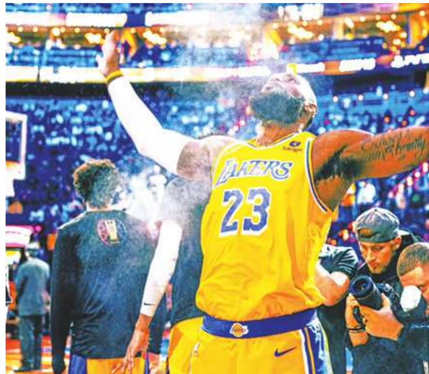
▲詹皇首奪季中賽 MVP。

可惜的是聖誕大戰這 2 個復仇劇本都未上演，獨行俠與熱火雙雙擊退對手，獨行俠仍是上演老劇本，由東契奇狂轟猛炸。