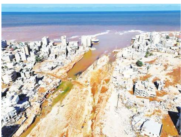
▲利比亞東部德納市11月29日遭遇洪水，估計有成千上萬人喪命。

如今2023即將過去，依照觀測的資料，十二月依然是個高溫月；因此，美國研究組織柏克萊地球已經率先預告，2023的年均溫將是第一個跨越巴黎氣候協定「升溫1.5°C門檻」的年份，不但跌破眾多氣象專家的眼鏡，