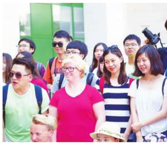
▲ 中國明年大學畢業生人數將再創新高。

人力公司智聯招聘調查發現，2022 年，取得海外文憑的學生中，有 38.8% 希望尋找「鐵飯碗」工作，較前一年增加 9%，而想成為公僕的比率則為 21%。