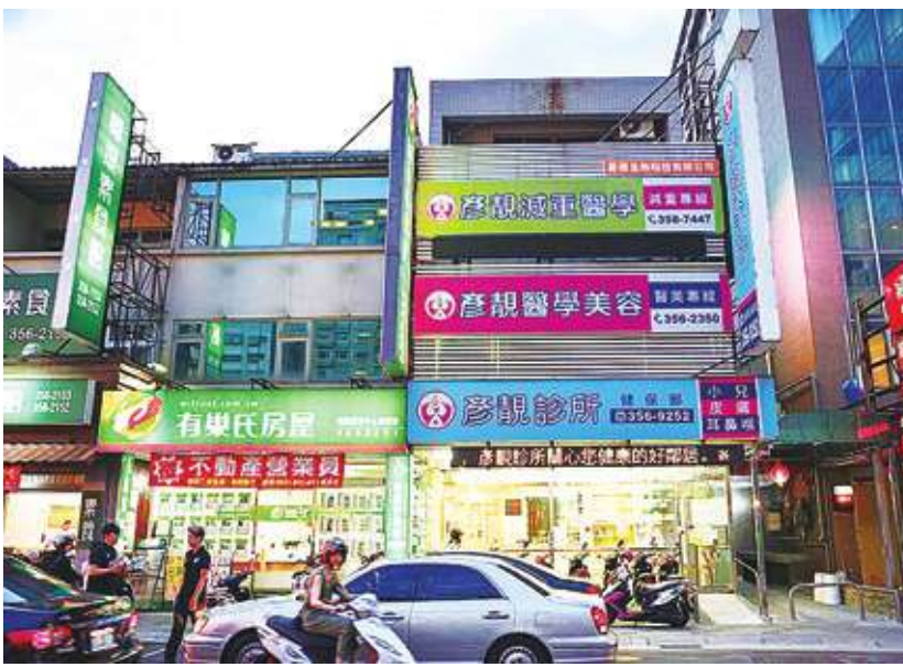
▲示意圖。中央大學台灣經濟發展研究中心27日發布12月消費者信心指數，其中「購買房地產時機」指標為105.61點，仍維持於100點以上的高點。