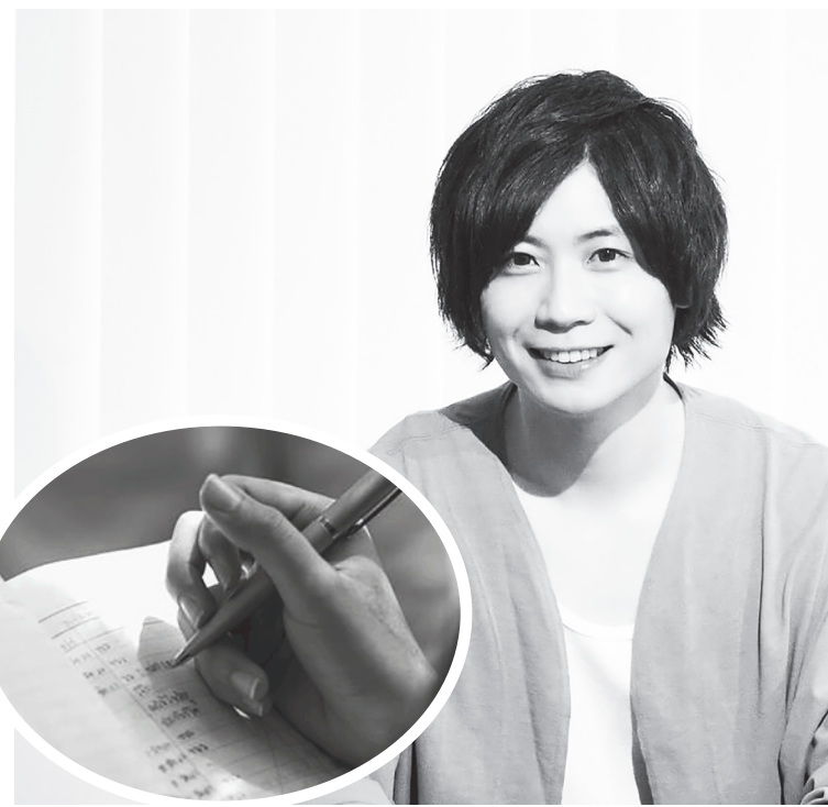
▲作者前田裕二介紹筆記，是可以發揮功能的有力工具。（網路截圖）

許多人都在不了解自我的狀態下生活。因此每當要做重要決定時，總是十分迷惘，無法精準判斷。好不容易奇蹟似地擁有「生而為人，