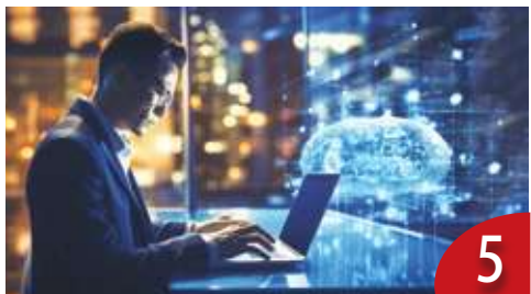
AI 資安風險 專家：不要說秘密