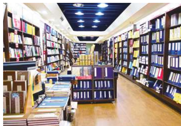
◀ 示意圖。文化部也推出獨立書店購書 2 點加送 1 點等加碼活動。(網路截圖)

間，領取率已高達 8 成，與法國等歐洲國家推行的經驗相當，更顯現台灣青年朋友對於藝文活動參與的熱情。在行政院大力支持下，文化幣政策自明年起編入文化部公務預算，將成為常態化政策。