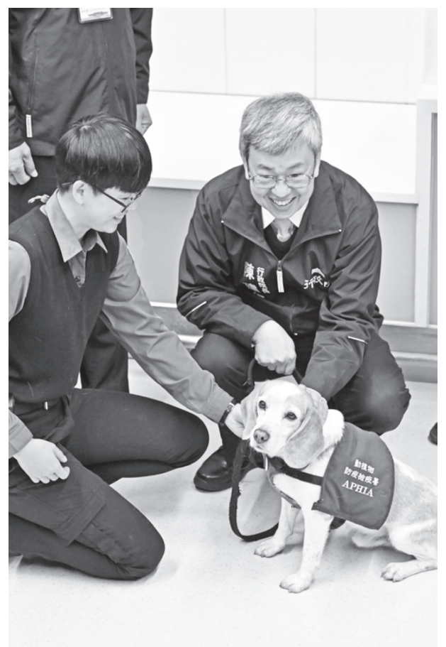
▲行政院長陳建仁(右)25日上午前往桃園機場視察，聽取業務單位的簡報並致贈加菜金，隨後再前往視察X光機查驗行李流程，了解發燒篩檢站近期的檢查狀況，並蹲下撫摸檢疫犬。