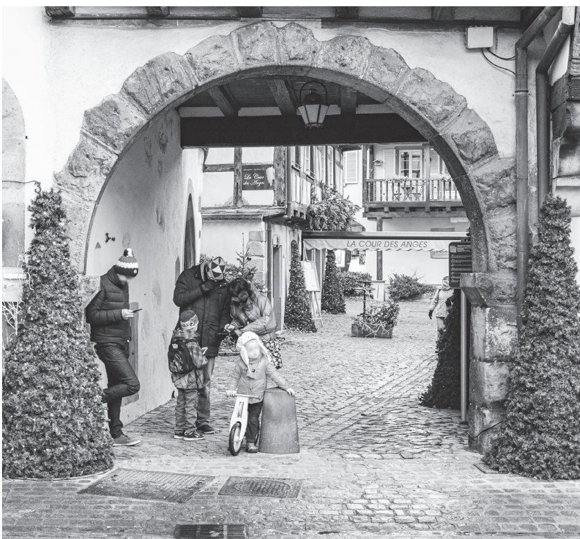
▲ 今年歐洲在聖誕節前夕，逮捕多位涉嫌發動攻擊的有心人士。

德國司法部長布施曼指出，4 名哈瑪斯成員因為涉嫌策劃攻擊歐洲的猶太機構，已在德國與荷蘭被捕。另外，丹麥也以恐怖主義相關罪名拘留 3 位嫌犯。