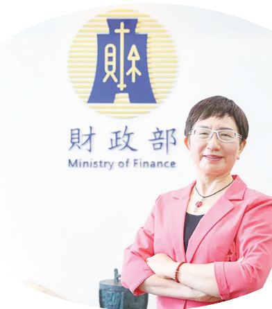
▲中小企業適用的 3 大租稅條款預計明年 5 月落日，其中替員工加薪享租稅抵減，財部持保留意見。

針對加薪減稅，經濟部中小企業署表示，內部已啟動檢討評估，除延長施行，也在研議放寬適用門檻和範圍等，但仍須和財政部協商細節，明年立法院新會期一定會提案。