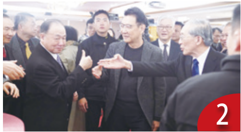
趙批執政外交失當失9邦交國