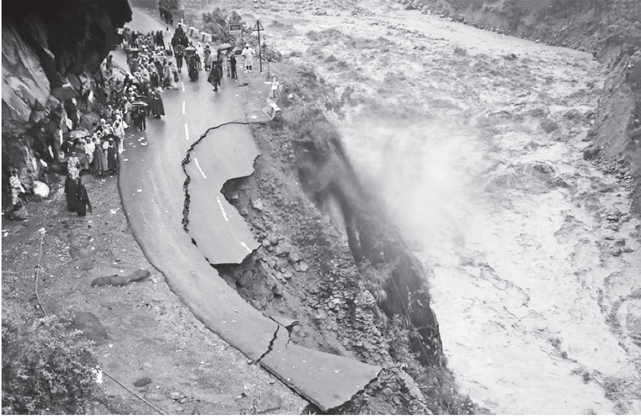
▲ 印度天災頻繁，急需更準確的天氣預報技術。

【本報記者莊瑞萌綜合報導】人工智慧 (AI) 提升氣候變化準確度。印度氣象單位表示，日前已測試利用 AI 來預測洪水、乾旱與暴雨等天災的發生機率，不僅成本大幅降低，更可因此減少天災對於民眾生命財產安全。