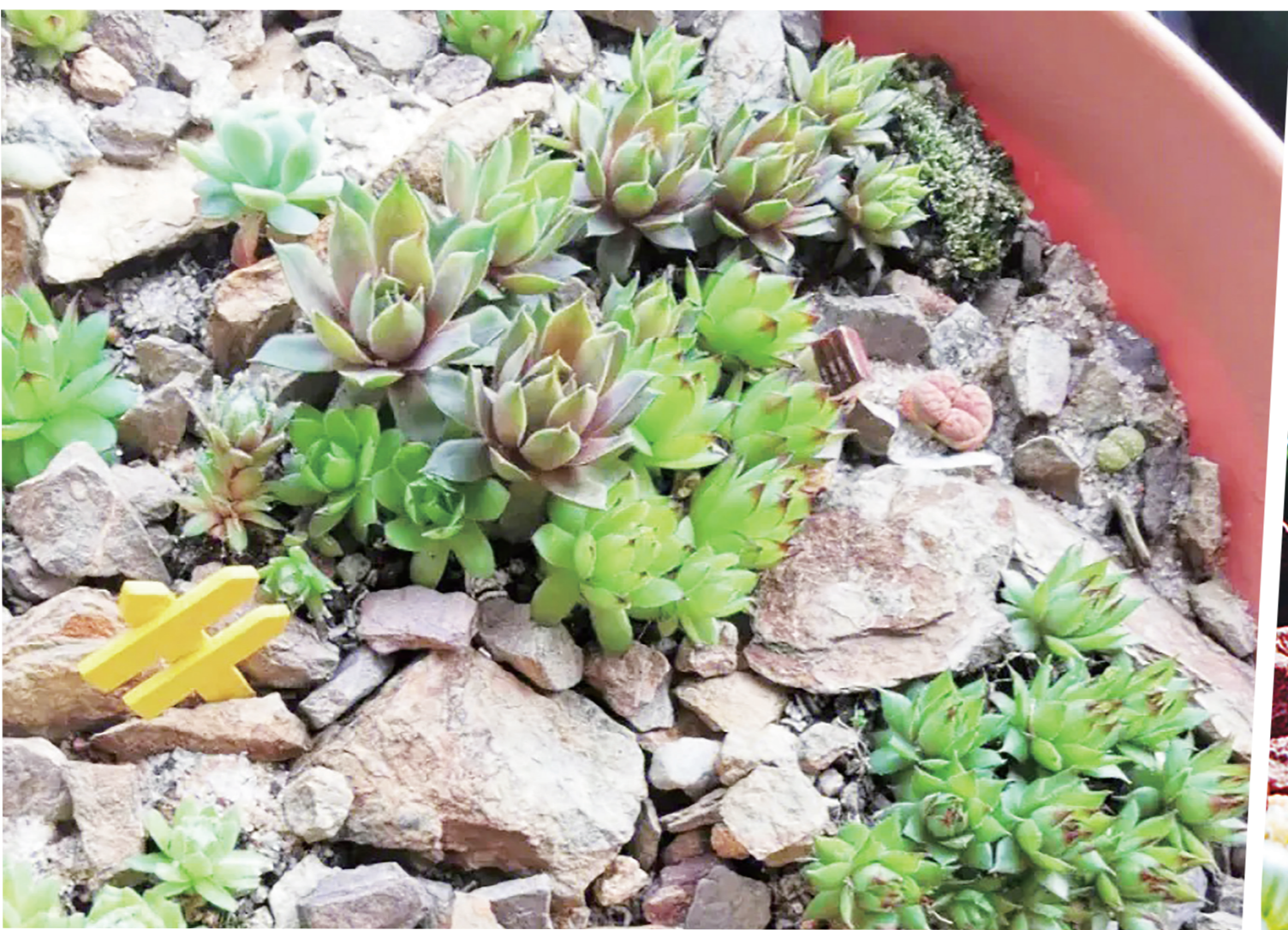
▲球根植物專用土鋪入盆栽中，將球莖擺好，芽點才會向上生長。