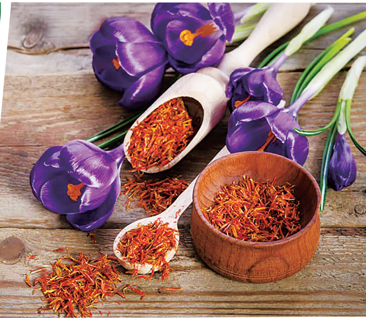
▲藏紅花作為珍貴又著名的藥材，被籠罩著一層神秘氣息。