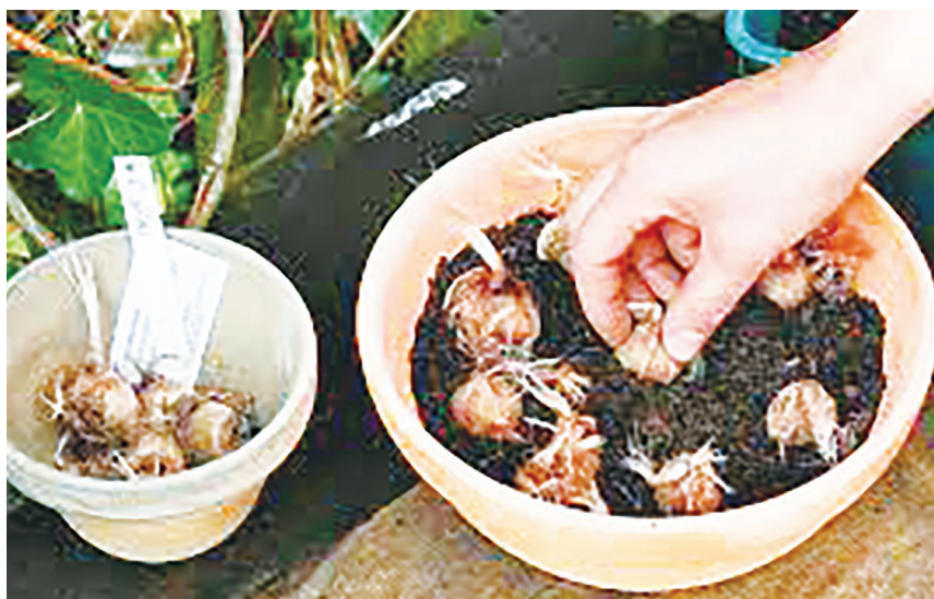
▲作者張辰亮跟幾位植物達人合寫了書中部分文章，他們的種植經驗非常重要，也為本書拍攝了部分照片。