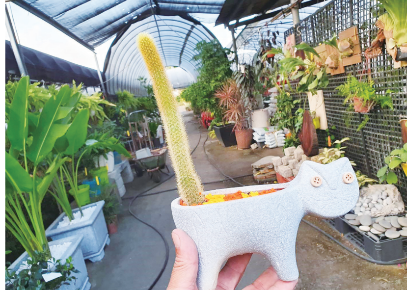
▲本書有 27 種趣味盆栽的教學過程，其中有植物原生地環境的介紹。

對會種花的人來說，條理清楚地把養護知識告訴新手，是一件挺耗精力的事。一方面，要把腦海中的各種知識梳理清楚不是那麼容易；另一方面，新手迫切想知道的東西，也許在園藝高手的眼中連常識都算不上，所以他們常常會忽略介紹這些基本知識。