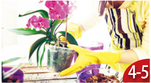
植栽入門不難 教你成園藝達人