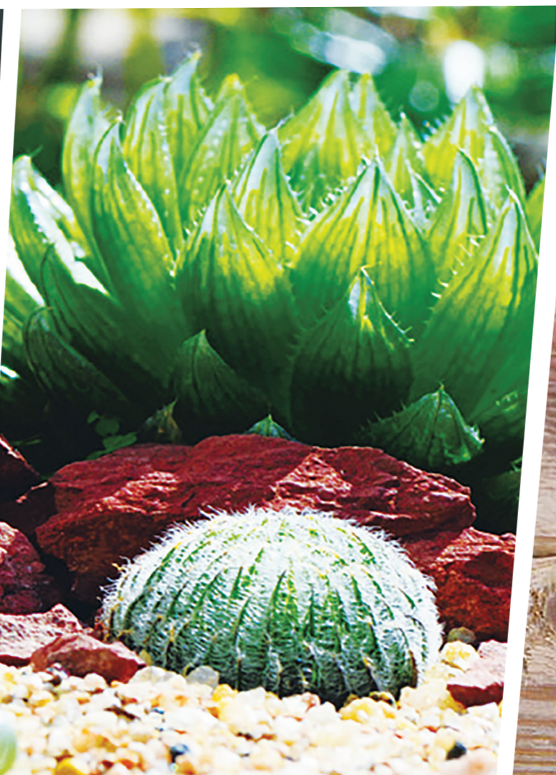
▲長生草生長在石縫裡，它的根喜歡透氣。