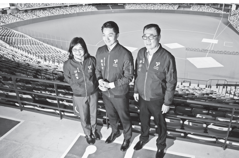
▲台北市長蔣萬安(中)25日上午在台北大巨蛋舉辦就職週年記者會，與副市长林奕華(左)、李四川(右)合影。(中央社)