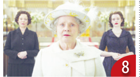
向《王冠》影集說再見 (梁良)