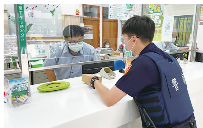
▲金管會統計，近 3 年期間金融機構警示帳戶數已逾百億元。

金管會表示，警示帳戶累計數雖有增加，但透過督促銀行強化開戶審查程序 (KYC)、提升異常金流偵測效能、針對疑涉不法帳戶加強與檢警聯防等 3 措施下，警示帳戶數成長率已明顯趨緩。