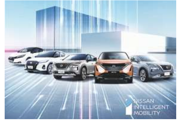
▲2024車展，日產ARIYA純電動休旅首度亮相，裕日車年底車展陣容公開。

2024年台北車展中，裕日車也將首度展出ARIYA新世代電動休旅。ARIYA代表了日產純電車系的能源先驅角色，將概念車的設計融合日式工藝美學，發揮極致的空氣力學表現，該車選榮獲德國「紅點獎(Red Dot Design Award)」、「iF設計獎(iF Design Award)」兩項世界級設計大獎。