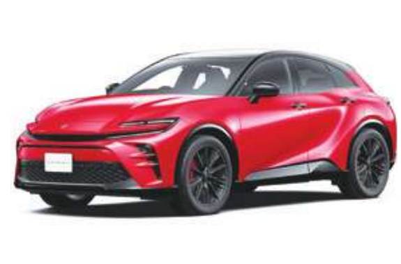
▲追加2.5 PHEV高性能動力後，豐田CROWN SPORT全員到齊。

留美觀設計的同時，也採用駕駛品味的特殊配備，營造更運動化的印象。並且配備大容量鋰離子電池，提升更實用的電動續航里程，讓駕駛樂趣外還能提昇環保形象。