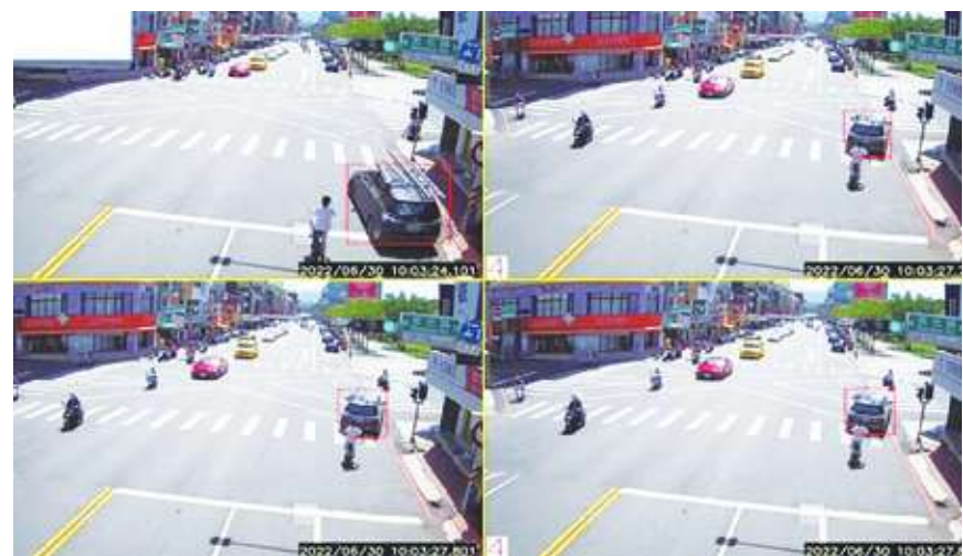
▲科技執法惹得天怒人怨，主要是捉賊與管理心態式的交通政策，未從民眾心裡的無奈出發。