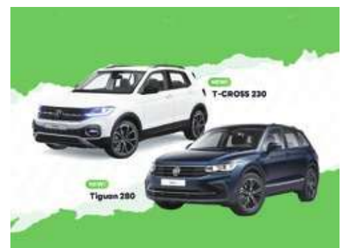
▲台灣福斯汽車拓展共享生活，透過LINE預約租車，可任選純正德系休旅T-Cross、Tiguan等。

車出租服務「自遊租」，藉由廣為使用的通訊軟體LINE租用VW跨界休旅The T-Cross及德系全能休旅The Tiguan等。