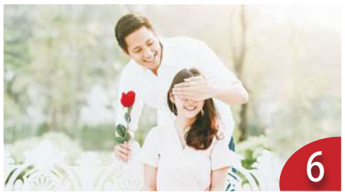
各於讚美 婚姻難美滿