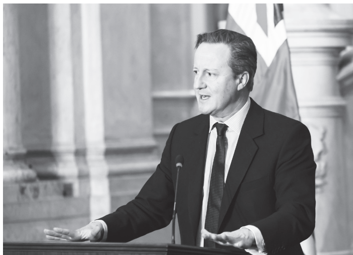
▲英國外交大臣卡麥隆指出，自他2010至2016年擔任首相以來，事態已改變，如今日益具侵略性的中國已是英國面臨的關鍵安全挑戰之一。