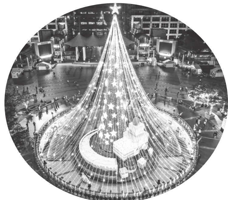
▲新北耶誕城「抹茶蛋糕聖誕樹」，還有最廣的光雕投影秀。