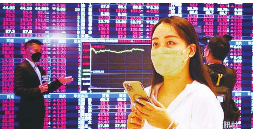
▲2024 年可能降息的效應，有利新興市場資金動能，科技產業完成庫存調整可望開啟新循環，支撐台股多頭走勢。

針對近期盤勢，安聯投信台股團隊表示，美國相關數據、利率政策與市場對於降息預期樂觀程度，仍是左右近期市場氛圍的主要因素。另一方面，相較於其他國家，台股往年