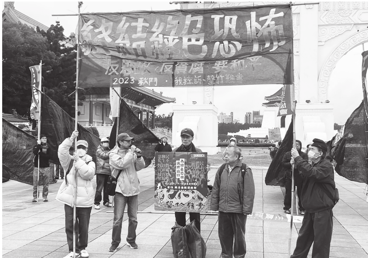
▲超過 25 個勞工團體 24 日發起「秋鬥遊行」，於自由廣場出發。

【本報記者簡嘉佑台北報導】「終結綠色恐怖，反惡政，反貪腐，要和平！」超過 25 個勞工團體 24 日發起「秋鬥遊行」由自由廣場出發，吸引不少觀眾圍觀，更有人現場直播呼籲網友支持秋鬥。秋鬥總召集人黃德北指出，執政黨讓社會民不聊生，更靠著網軍抹黑任何批判的聲音，強調「(秋鬥) 永遠站在統治者的對立面」。