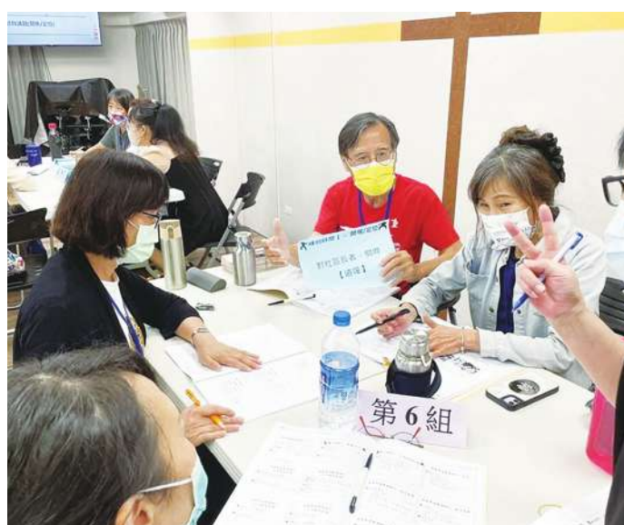
▲示意圖。數位部推動數位賦能計畫，讓高齡者也能輕鬆取得社交及生活服務的資源。

數位部發布新聞稿表示，唐鳳近日率領數位部團隊拜訪嘉義市政府，建立政府資料傳輸平台、資通安全管理法、人口老化及產業數位轉型等議題進行深度交流。唐鳳指出，目前正提前布局各行各業數位轉型所需人才，招募畢業 3 年內的青年，提供企業實作等培育。