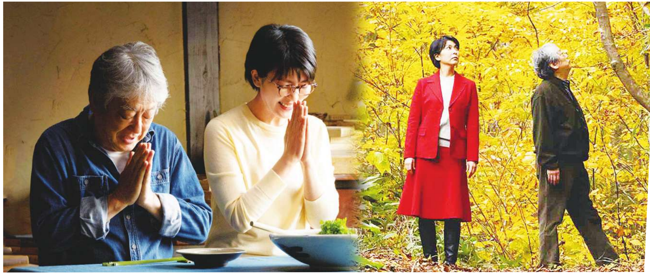
▲電影《舌尖上的禪》改編自作家水上勉的料理散文集，由有日本大衛鮑伊之稱的澤田研二，攜手影后松隆子及一干實力派演員共同演出，電影中的料理則出自料理之神土井善晴之手。