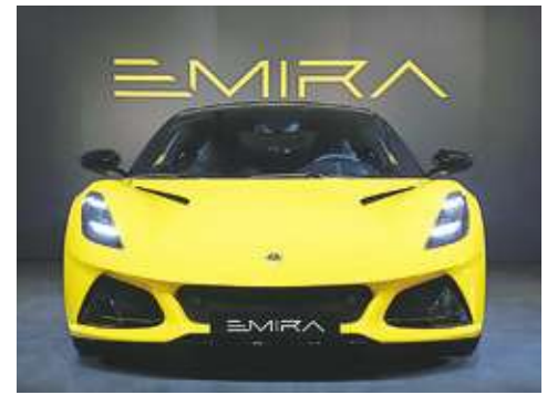
▲Lotus Emira車系，採用3.5升V6機械增壓引擎，預計2024年第一季開始交車。(網路截圖)

Emira車身尺寸長4,413mm，寬2,092mm，高1,226mm，車重1,485公斤，軸距2,575mm。