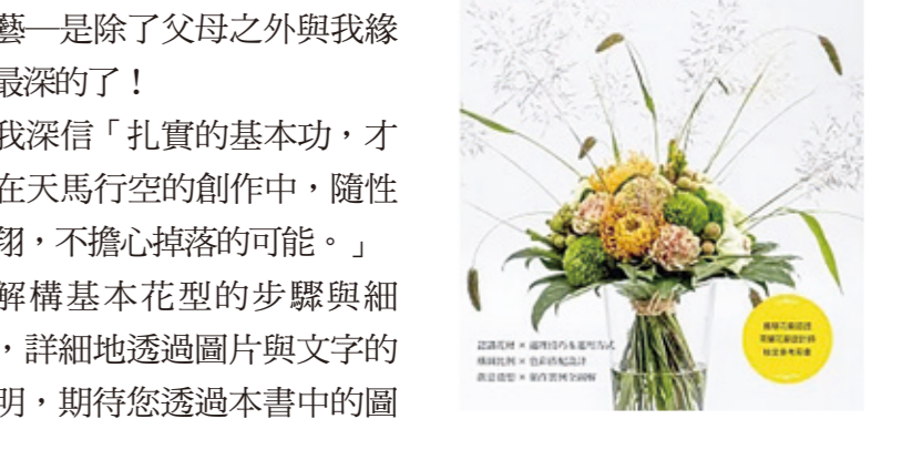
▲解構基本花型的步驟與細節，詳細地透過圖片與文字的說明，期待您透過本書中的圖

作者：陳淑娟 出版社：噴泉文化館 正式踏入花藝教室至今，整整三十年。關注著無數與植物、花藝有關的報導，並剪貼、蒐集成冊保留至今，若從這樣的癡狂舉措算起，一生大半的時間裡，花藝一是除了父母之外與我緣分最深的了！我深信「扎實的基本功，才能在天馬行空的創作中，隨性翱翔，不擔心掉落的可能。」