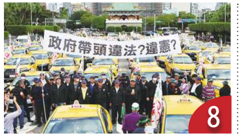
違規記點便宜行事非治理