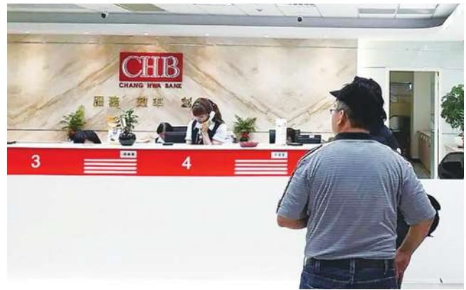
▲示意圖。金管會統計，截至今年 11 月底止金融機構警示帳戶數達 11 萬 5680 戶，年增 32%。

金管會表示，除了遏止警示帳戶數成長率攀高外，也督促金融機構透過 6 大策略執行阻詐作為，包括「臨櫃關懷及時攔阻民眾受損」、「要求銀行與執法機關加強合作」、「通函銀行運用科技防詐」、「立法從源頭阻斷投資詐騙廣告」、「納管虛擬資產交易平台業者」與「防堵第三方支付使用者不當使用虛擬帳號」。