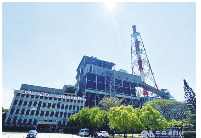
▲經濟部指出，近期最低的電力備轉容量率 1.64% 發生在 2016 年 5 月，凸顯過去機組開發過少的問題。(中央社)

經濟部綜合規劃司透過新聞稿指出，電網投資、新的電力開發都須持續投資，近期最低的電力備轉容量率 1.64% 發生在 2016 年 5 月，凸顯過去機組開發過少的問題。馬前總統任內核定 270 萬瓩，蔡總統目前已核定 1700 萬瓩，電源開發有數據可查。