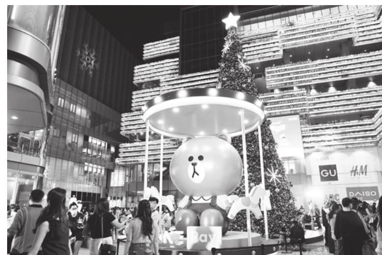
▲南紡購物中心「熊大聖誕樹」。(台南市政府)