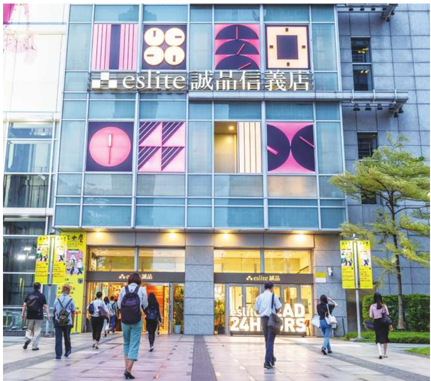
▲ 信義誠品接棒敦南誠品為 24 小時書店，近期因統一集團規劃收回原址，再於 24 日吹熄燈號。