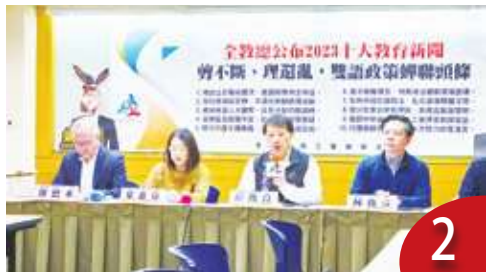
10 大教育沉痾 促候選人提解方