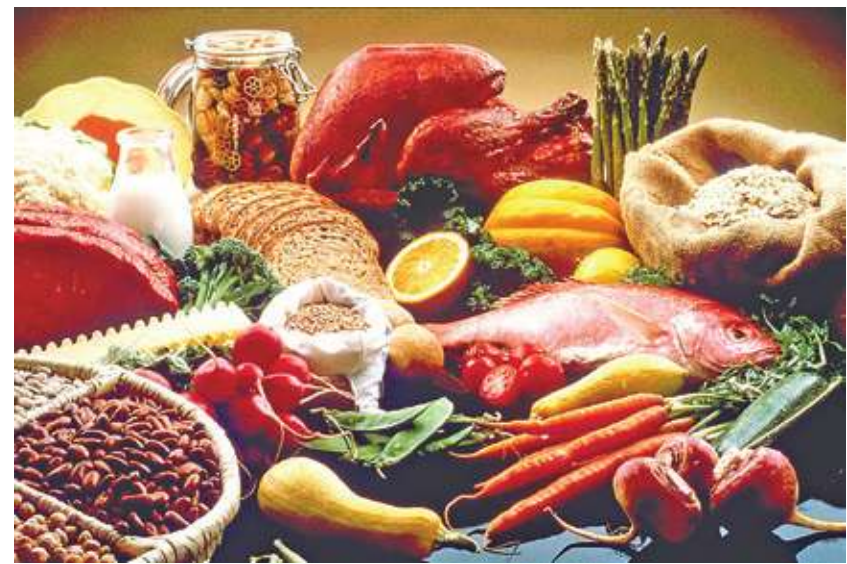
▲ 第 28 屆聯合國氣候變遷大會（COP28）終於有 130 多國共同簽署農業、糧食與氣候行動宣言。(Photo on WikiCommons)

英國 BRC Mondra 聯盟就匯集了各大食品零售商和供應商，採用統一的行業方法來監控、改進和交流產品的環境績效，尤其因應人工智慧興起，使得評估產品碳足跡的方式，能夠更加快速。