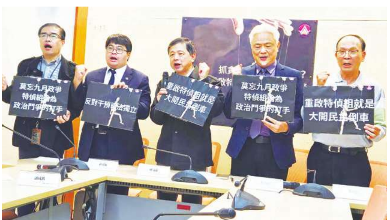
▲司改團體 19 日批評侯友宜重啟特偵組的政見，恐會重蹈過去政治鬥爭的覆轍。

陳為祥也回應說，其他民主國家的檢察官只有起訴權，並沒有偵查權，民眾對法官與檢察官信任的比例都低於 50%，原因就是兩者的權力過大，且亂判也不用負責，因此他們也有提出一系列政見，包括改革法官任用資格、單純私人糾紛案件除罪化等政策，盼各黨能參考。