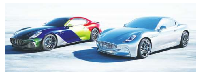
▲ GranTurismo PrimaSerie 75 週年限量版。(網路截圖)

● 曾於 1947 年將賽車性能轉投入公路用車設計，與奢華舒適結合，企圖定義經典 GT 雙門跑車的瑪莎拉蒂，75 年來開創過數款經典車型，也奠定瑪莎拉蒂獨特 GT 跑車傳奇地位，並將 GT 那種壯遊，塑造為獨特生活風格。