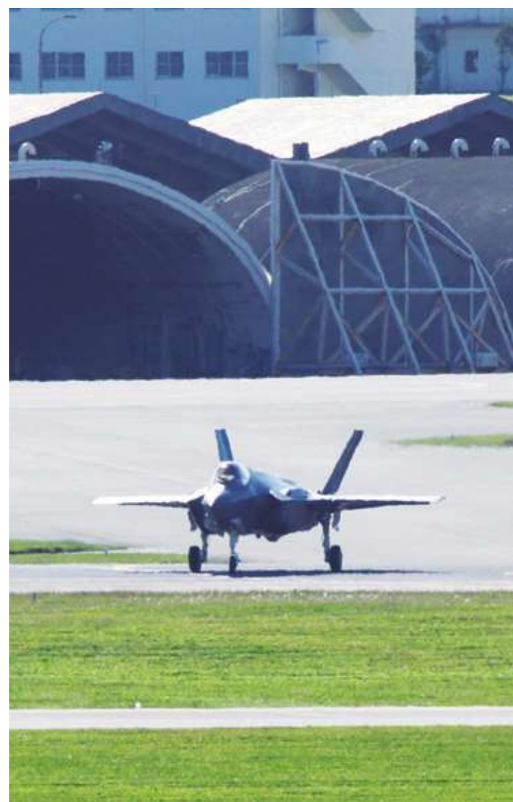
▲「日經亞洲」披露，美軍計劃恢復在沖繩嘉手納基地常駐戰機，日後還擬將能與有人戰機協同作戰的無人戰機派赴沖繩。圖為之前短暫輪調至嘉手納基地的 F-35 隱匿戰機。