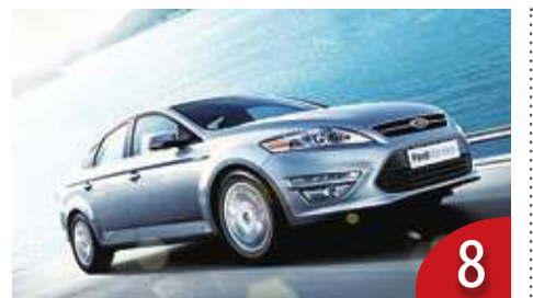
該買什麼車？先思考四個問題