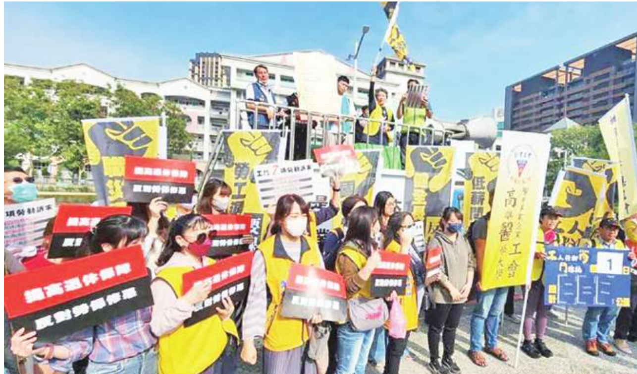
▲2024年總統大選在即，勞工團體2024工鬥行腳隊伍日前從高雄市立文化中心出發，表達7大訴求，呼籲總統參選人正視勞工低薪等問題。

台師大公民活動系教授曾冠球指出，任何政見都是要解決問題，所以判斷政見的第一步就是「問題重要性」，如這個