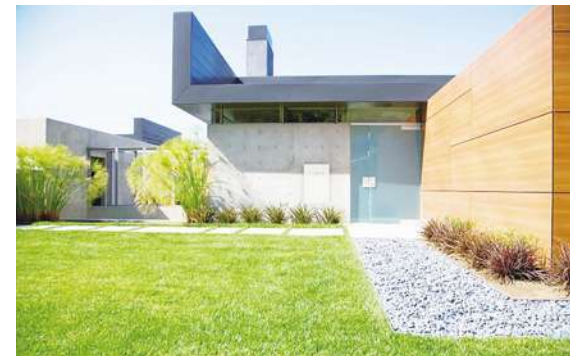
▲ 特斯拉宣佈引進家用儲能產品 Powerwall 登陸台灣。

● 特斯拉宣佈正式進軍許多人期待的家用儲能產品，Powerwall 要正式登陸台灣。台灣消費者已經可以在特斯拉官網登記訂購，申請安裝 Powerwall，成為台灣首批用戶。特斯拉除了販賣電動車，更以「加速全球轉向永續能源」作為使命，致力提供永續能源解決方案。