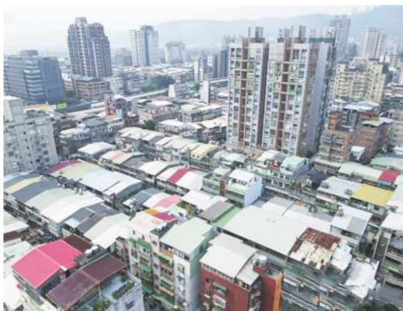
▲立法院19日通過囤房稅2.0，但時代力量認為稅率仍太低，無法有效抑制房價與囤房。

囤房仍存在操作空間 邱顯智指出，台灣擁有1到3房者佔97%，這些人可能修法後稅率增到0.2%，即便採取全國總歸戶，如果算有三戶，最多也是被課0.6%的稅，一直到持有超過7戶空屋時，才會被課以不過4.8%的最高稅率，投資客囤房的操作空間完全沒有消失。