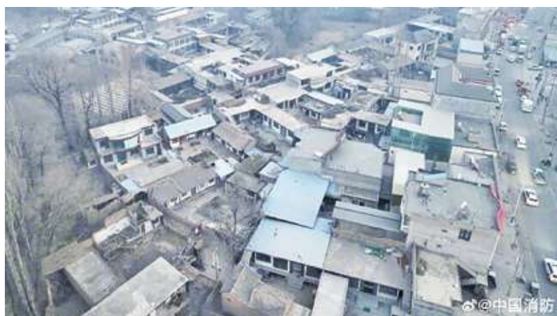
▲中國甘肅省 18 日深夜發生強震，截至目前為止已知造成 118 人死亡。(中國消防微博截圖)

【本報記者呂翔禾台北報導】中國甘肅強震導致超過百人死亡，台灣不分朝野都很關心！總統府 18 日不只發聲明表達願意提供協助，同時還在社群軟體用簡體字發文致哀。國民黨總統候選人侯友宜也在臉書發文，盼當地搶救及復原作業一切平安，在廣東訪問的副主席夏立言也代表國民黨向中國表達慰問。民進黨則樂見民進黨願意提供協助。