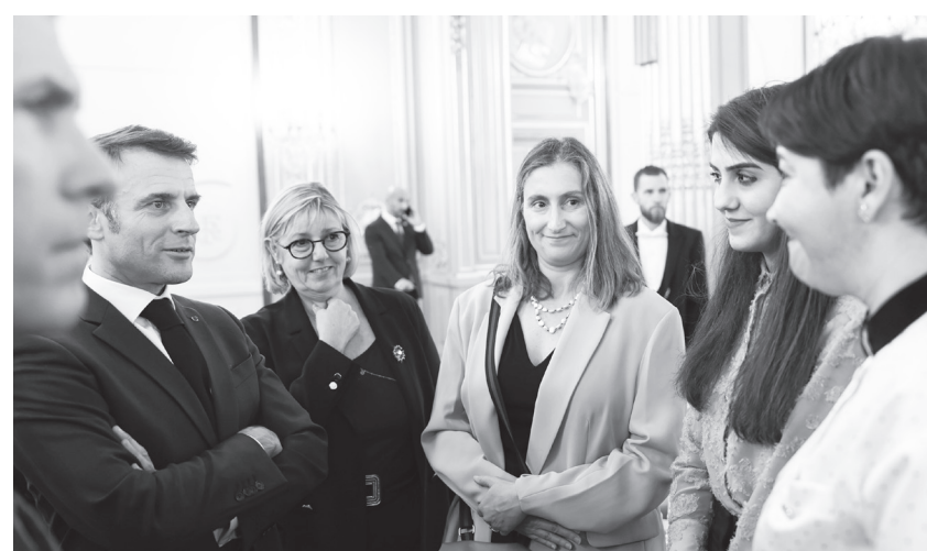
▲法國總統馬克宏(左2)近日盼立法管制移民，但卻遭到左右派聯合封殺。

而因為此法案事關重大，法國總理波恩無法動用憲法中繞過國會通過法律的緊急條文，也讓馬克宏的施政受挫。他在去年 6 月的國會選舉中失去國民議會多數優勢後，在國會通過法案便遇到不少阻礙。