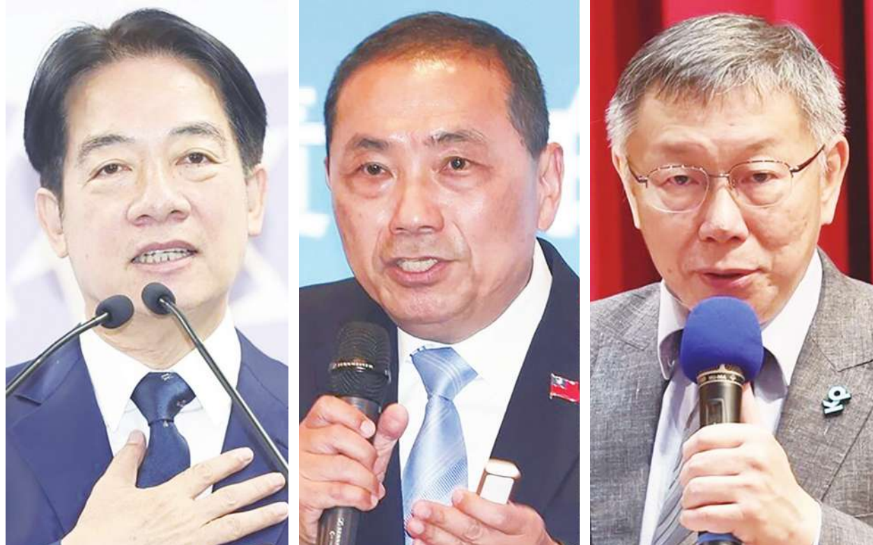
▲三黨總統候選人紛紛提出「最低工資」、「加薪抵稅」或「產業創新」等財經政見。左為民進黨總統參選人賴清德，中為國民黨總統參選人侯友宜，右為民眾黨總統參選人柯文哲。

學者認為3黨距離完整提出產業發展政策還有段距離，可觀察辯論時是否會再拋出相關倡議。