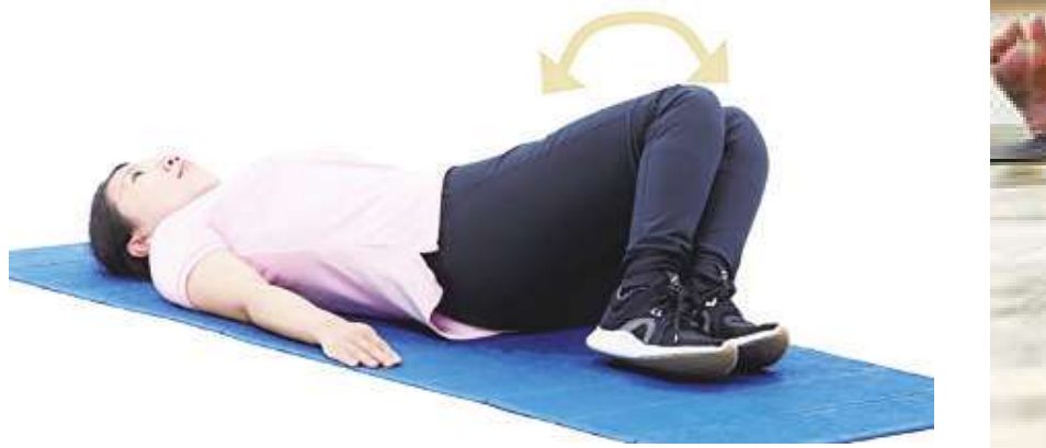
▲ 增強核心肌群的伸展運動：牽拉運動。