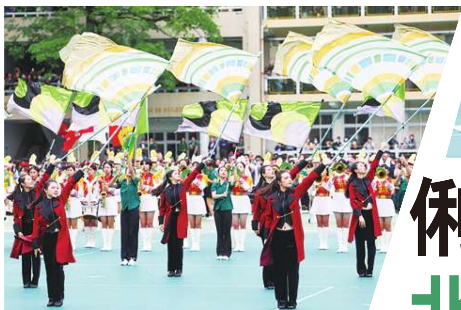
▲ 台北市立第一女子高級中學樂儀旗隊整齊劃一的動作搭配輕快旋律，讓現場觀眾目不轉睛。