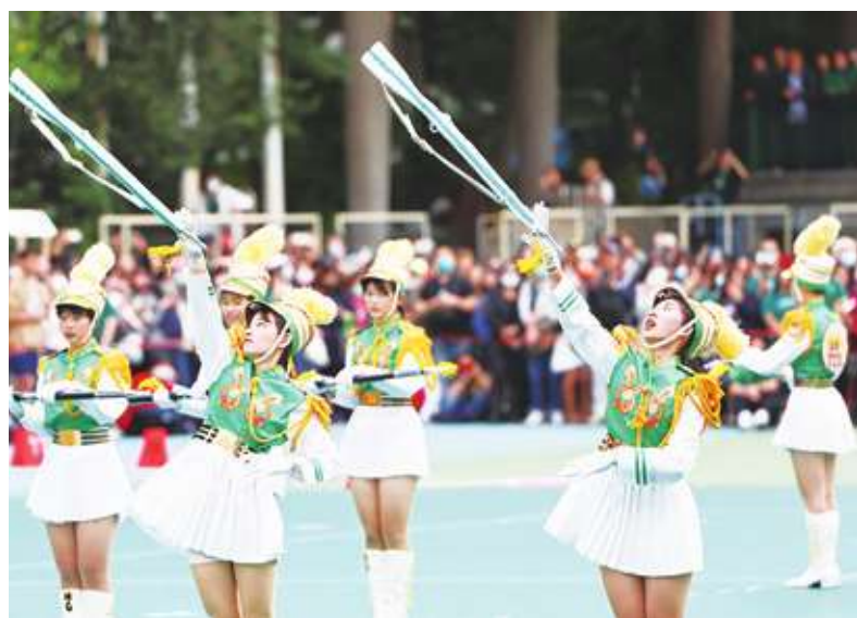
▲ 北一女樂儀旗隊登場演出，展現平日練習成果。(中央社)

地主隊北一女樂儀旗隊帶來5首曲目，展現各式拋槍、轉槍的精彩演出，搭配華麗隊形與輕快活潑的旋律。北一女樂儀旗隊成員一度戴起俏皮的草帽亮相，演出輕快樂曲炒熱氣氛。