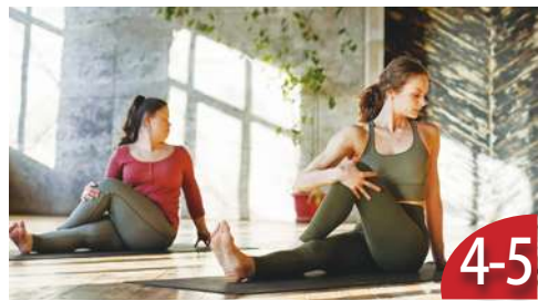
(書摘) 緩解腰部疼痛 健康活百歲