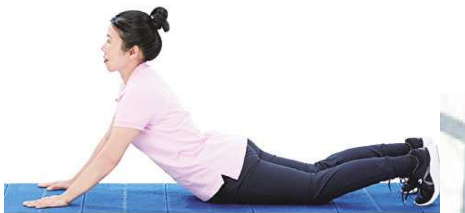
▲ 增強核心肌群的伸展運動：撐背運動。(網路截圖)