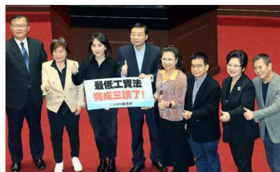
▲ 歷經朝野表決大戰，立法院會 12 日三讀通過最低工資法，國民黨立法院黨團在議場內拍照見證。

審議會未能達成共識者，得經出席委員過半數同意議決之。另外，中央主管機關應於最低工資審議會通過之次日起 10 日內，報請行政院核定後公告實施。