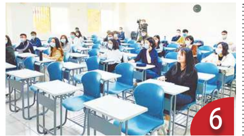
(教育停聽看) 大學人文教育的凋零