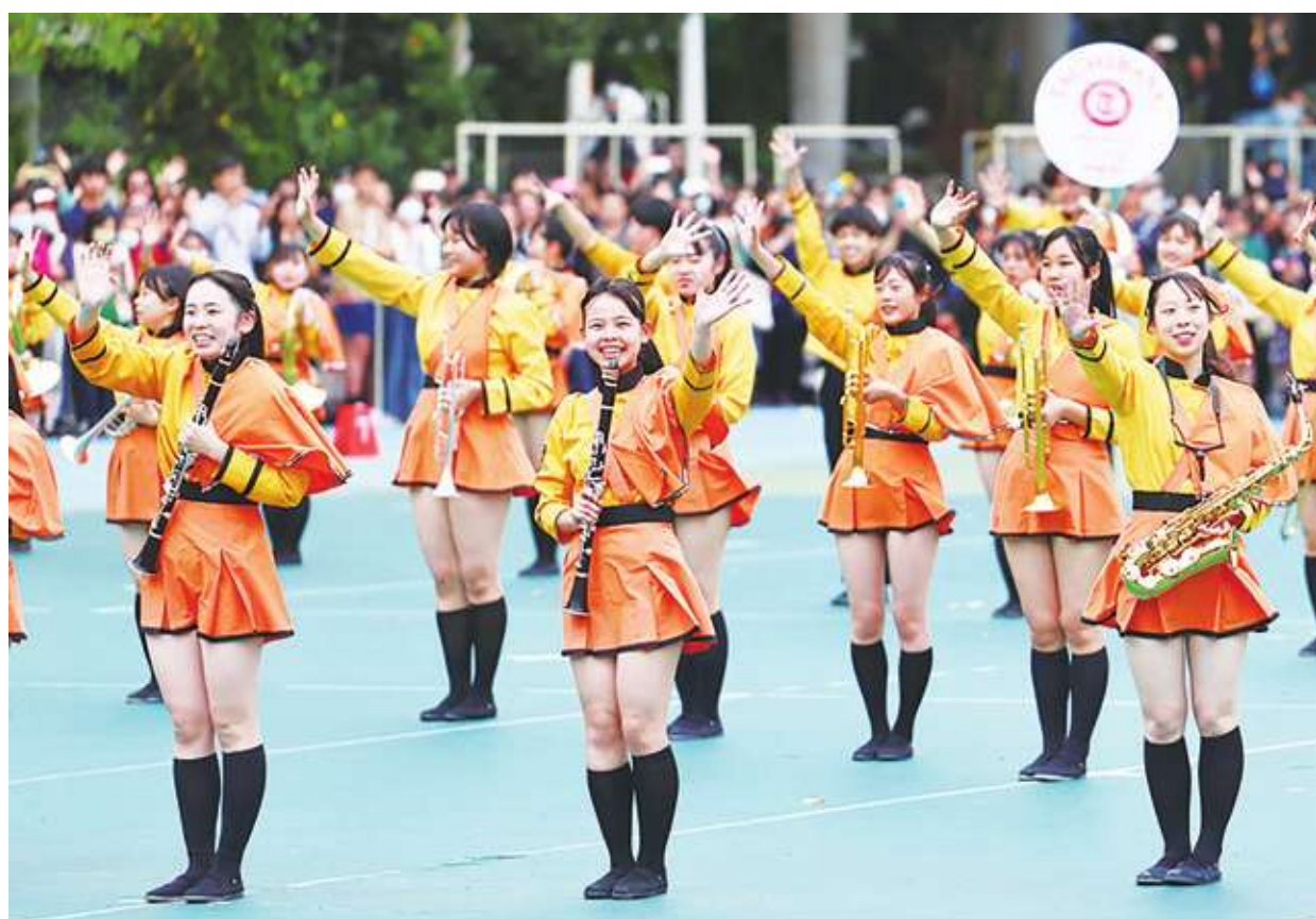
▲ 「橘色惡魔」日本京都橘高校吹奏樂部帶來精彩表演讓現場觀眾給予熱烈掌聲。(中央社)

副總統賴清德12日也到北一女校慶現場，更與不少民眾擊掌、握手，但他並未接受媒體訪問，也沒有上台致詞。