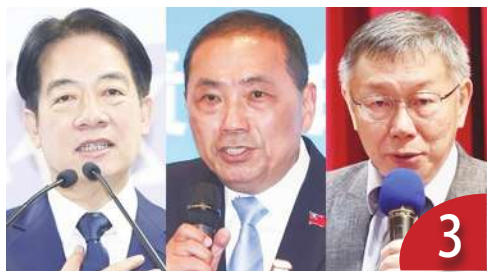
候選人財經政策 應先解決五缺