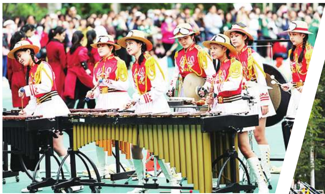
◀ 北一女樂儀旗隊成員戴起草帽亮相，演出輕快樂曲。