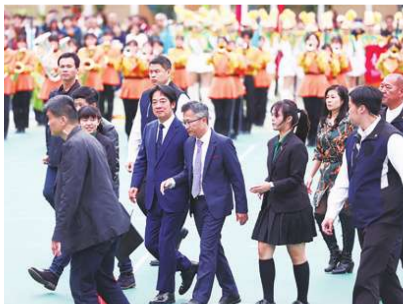
▲ 副總統賴清德(中左)應邀出席台北市立第一女子高級中學120週年校慶，欣賞學生表演。

北一女與日本橘高校樂隊在去年國慶後再度同台，吸引校內各樓層擠滿人潮，現場不斷響起如雷掌聲。