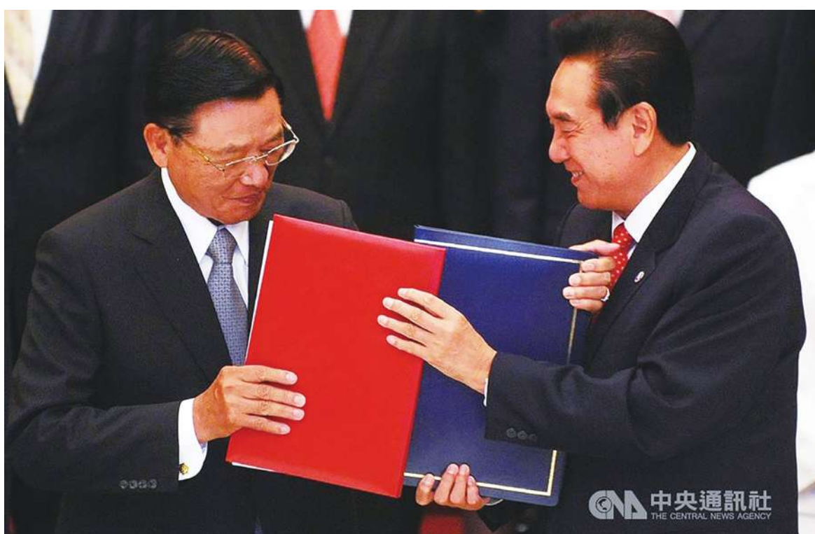
▲兩岸簽訂兩岸經濟合作架構協議 (ECFA) 已經超過十年，有總統候選人提出重新協商的訴求。

淡江大學財金系教授李沃牆也抱持同樣的意見表示，國際經貿協定對台灣來說非常重要，因為我國 65% 以上的 GDP 還是靠出口，所以三位候選人都有提出相關的政見。然而，他強調，最困難的部分還是中國阻擾，所以如果我國與中國