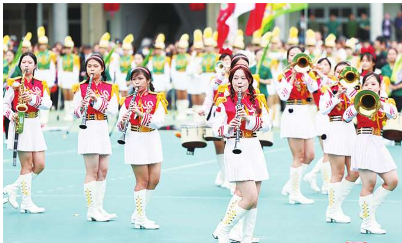
▲ 台北市立第一女子高級中學12日熱鬧舉行創校120週年校慶大會，由樂儀旗隊率先登場演出，以輕快樂曲炒熱現場氣氛。

【本報記者簡嘉佑台北報導】花式走位、跳躍换位，有「橘色惡魔」之稱的日本橘高校吹奏部12日來到北一女校慶交流演出，展現活潑表演。北一女樂儀旗隊也不甘示弱，祭出高難度拋槍、轉槍等技法，相當俐落、靈活。兩隊在去年國慶後再度在北一女120週年校慶同台，校內各樓層擠滿人潮，現場不斷響起如雷掌聲。