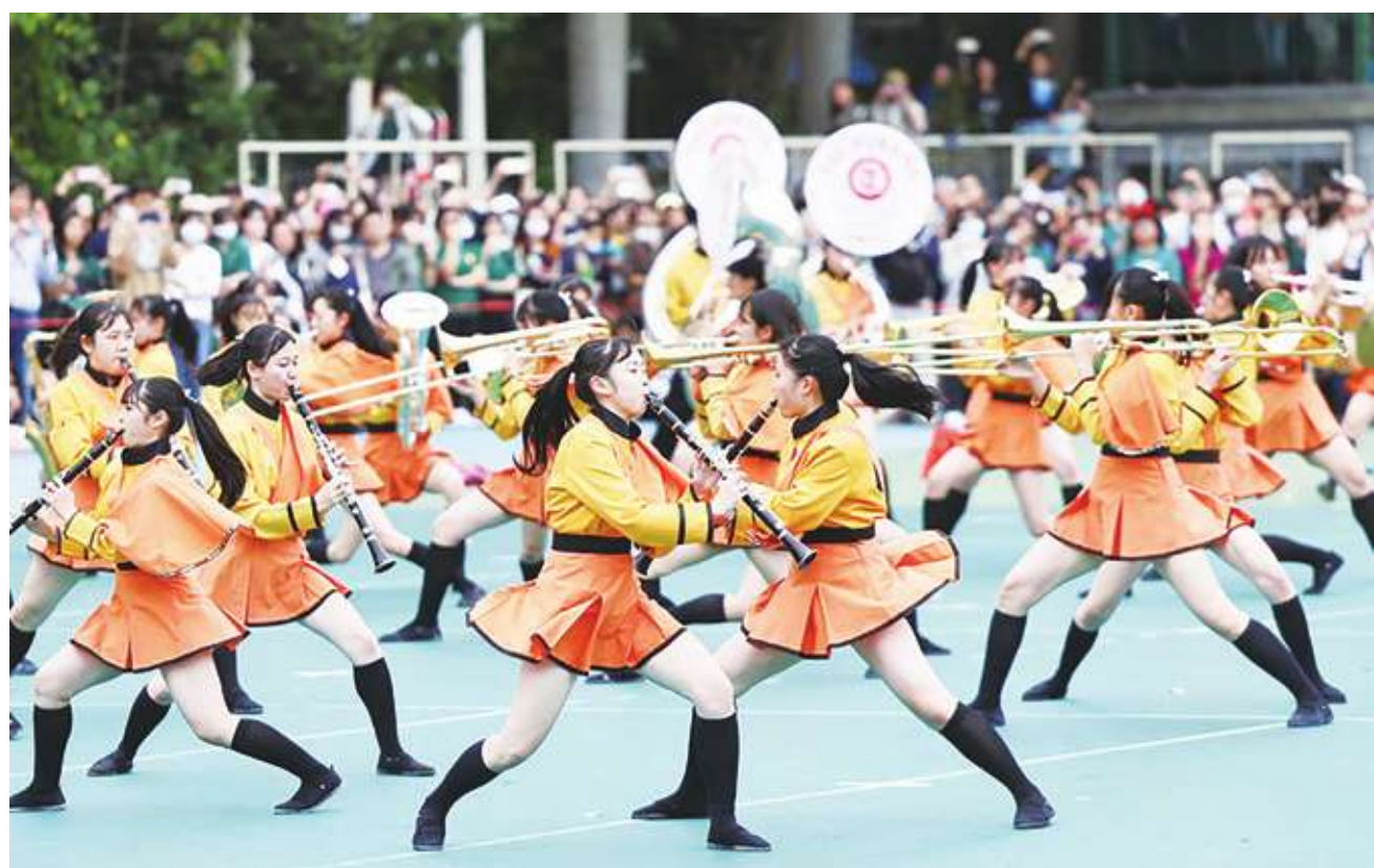
▲ 「橘色惡魔」日本京都橘高校吹奏樂部12日受邀出席台北市立第一女子高中創校120週年校慶大會，以華麗隊形轉換演奏8首經典曲目。