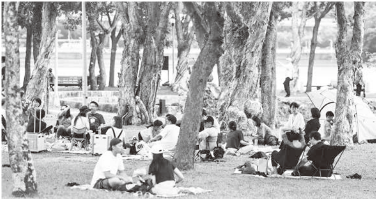
▲ 台北市 15 日天氣舒適微涼，白天北部及東半部高溫落在攝氏 26 到 28 度，大湖公園內隨處可見野餐民眾，享受美好假期。