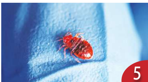
歐洲臭蟲危機 恐影響觀光形象