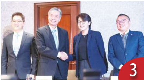
藍白合，誠意幾分？演給誰看？