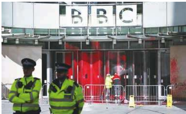
▲ 一個親巴勒斯坦的抗議組織宣稱，英國廣播公司（BBC）總部遭潑紅漆是他們所為，指控 BBC 在以色列和哈瑪斯戰爭的報導上「雙手沾滿鮮血」。