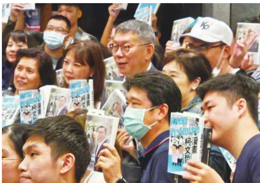
▲ 柯文哲 15 日於簽書會受訪時，直言藍白合下次沒有會面時間表。

【本報記者呂翔禾台北報導】「國民黨的『開放式初選』需要太多資源，我們不打算採納！」民眾黨總統參選人柯文哲 15 日回應藍白合會面時說，國民黨提「開放式初選」，只是要展現其地方樁腳動員能力而已，卻不用民調這種有效率、行之有年的做法，因此對於下次藍白合碰面，他說，等國民黨提修正方案，再討論是否要見面。