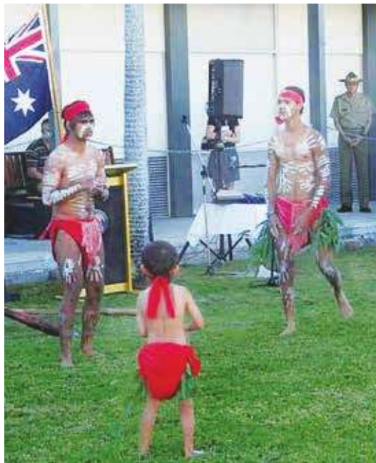
▲ 澳洲 14 日的原住民修憲公投並未通過，讓當地原住民大失所望。

但他也同時呼籲雙方民眾不要因此對立，公投後大家還是澳洲人。澳洲 2600 萬人口中有 3.8% 是原住民，且在澳洲居住約 6 萬年，但澳洲直到 1962 年才給予原住民選舉權，1971 年才將原住民納入人口普查，比起加拿大、紐西蘭與北歐等國家，澳洲改善原住民權益的腳步慢了許多。