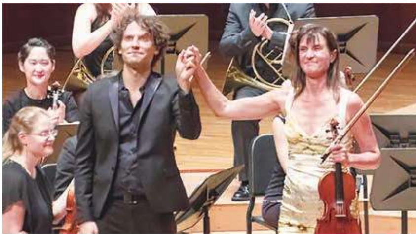
▲ 俄羅斯小提琴藝術家維多利亞·穆洛娃 (前右) 精彩的訪韓演出。

首巨作，題獻給曼紐因，並於 11 月 26 日在紐約首演，再隔年 (1945) 巴爾托克就因白血病在紐約去世。據說，曼紐因在收到樂譜後，驚嘆：「我只知道他經濟拮据，沒想到他會為我寫一曲曠世名作！」好心有好報，曼紐因也成為此曲最重要的推廣人。