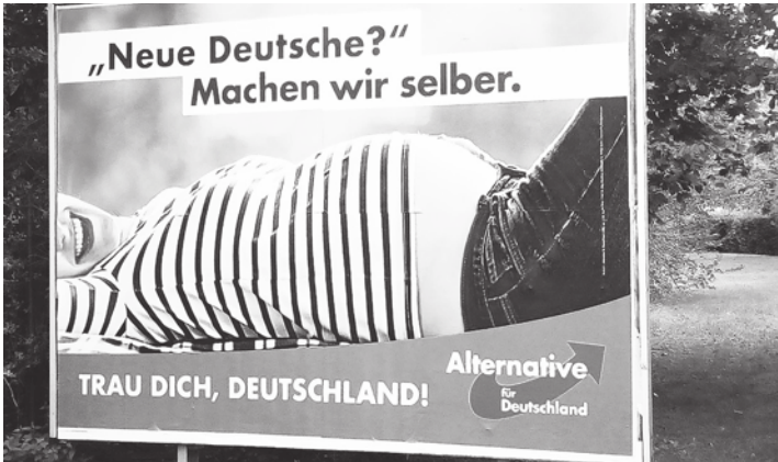
◀德國極右派政黨AfD 25日贏得創黨以來的首次地方大選，替德國政壇帶來大地震。

福特汽車董事長比爾福特稍早表示，「如果美國想要競爭，自己必須提升競爭力。中國發展非常迅速而且大規模發展，現在也正在出口車輛。」