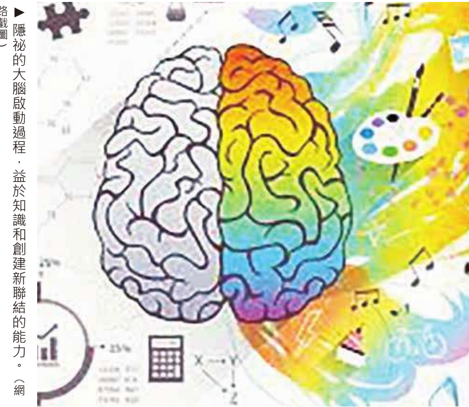
▲隱秘的大腦啟動過程，益於知識和創建新連結的能力。