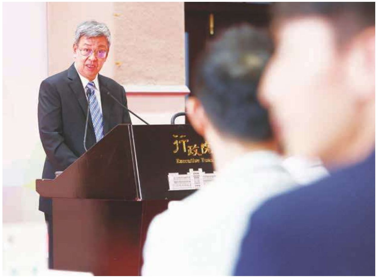
▲ 行政院長陳建仁 26 日表示，3+1 方案是給大學生有更多自我選擇的機會，並沒有強制，請不要以訛傳訛。

教育部也說，為提供學生支持措施，協助學校實施相關配套，除訂定指引協助學校放寬校內修業彈性外，也會補助學校經費，來提供學生所需的教學及輔導支出。