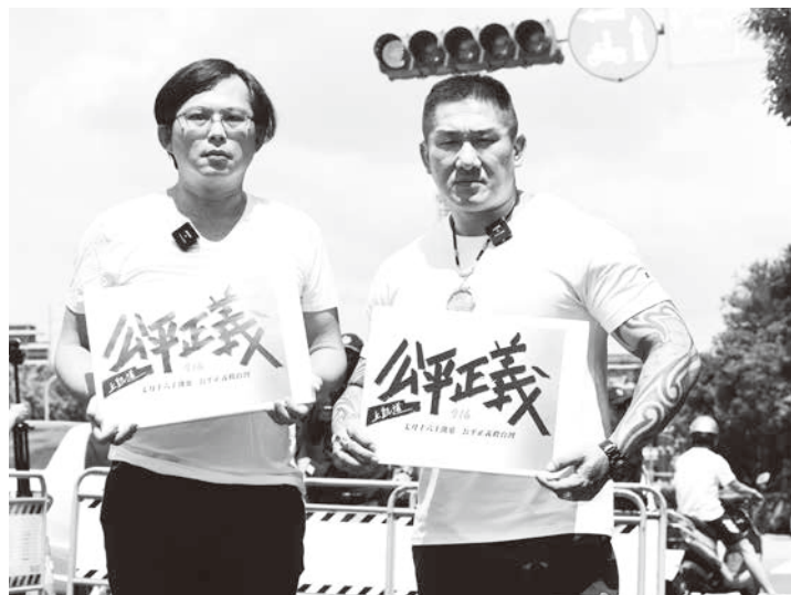
▲ 前立委黃國昌（左）與網紅「館長」陳之漢（右）26 日到總統府前宣傳「7 月 16 日上凱道，公平正義 救台灣」活動，並公布主視覺。