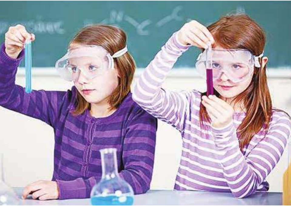
▲不管在學校還是在家裡，老師跟家長都可以鼓勵並引導孩子，來產生好奇心。