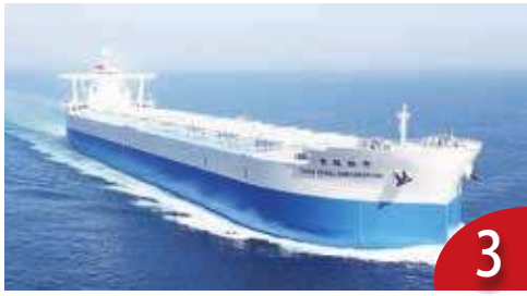
3 關切聘大量中國船員 中運回應