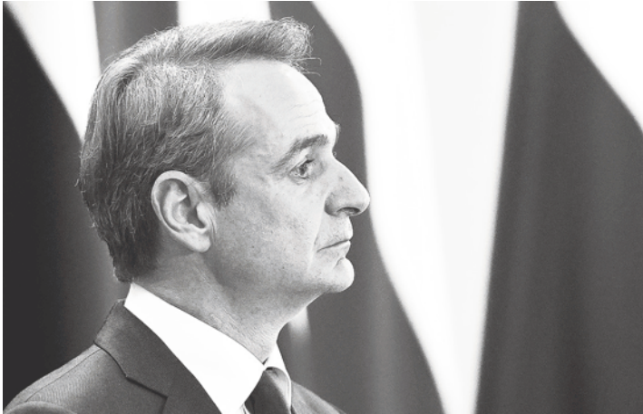
◀希臘大選25日開票顯示，總理米佐塔基斯將繼續執政。

但因為反移民的政黨與激左盟仍在國會中保有席次，米佐塔基斯再來是否能將國家帶向自己想要的方向，就取決於他如何回應反對黨對於難民、墮胎、宗教、與土耳其和俄羅斯的關係等較為尖銳的議題。