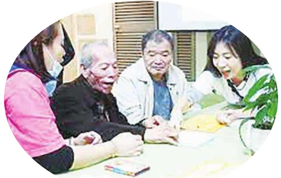
▲教導長輩說故事，打破刻板印象，建立多元想像、理解與包容。（網路截圖）