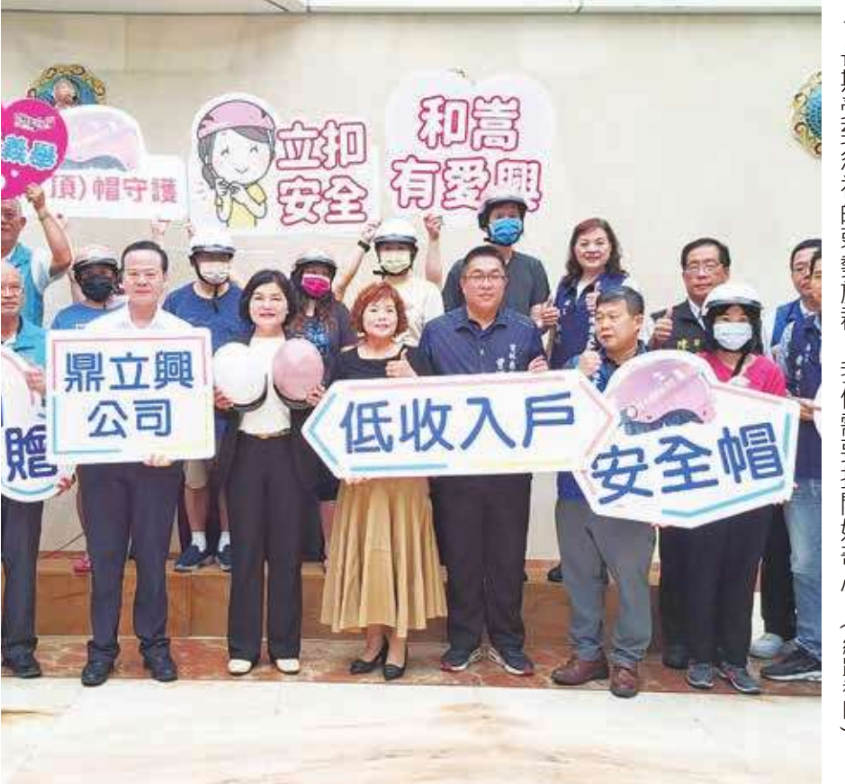
▲長期受到忽視的弱勢族群，我們需要打開好奇心。