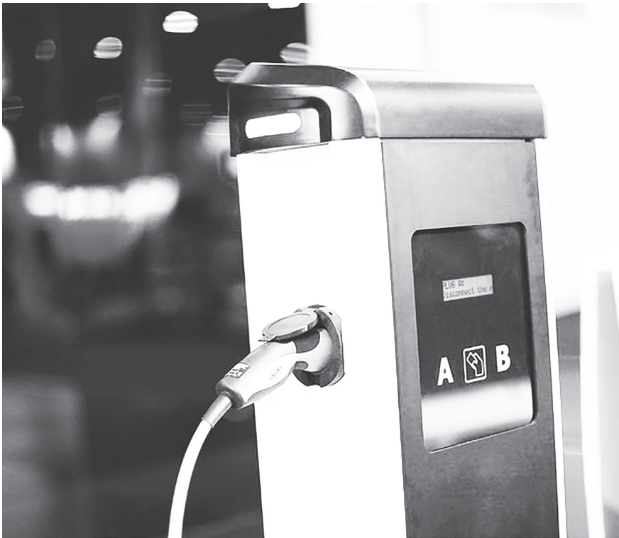
◀電動車銷售數量持續攀升，也將帶動充電站發展跟著水漲船高。

據《A B P Network》報導，截至2022年會計年度，印度電動雙輪車銷出72萬多輛，相較前1年的23萬輛成長3倍。預估到2030年，印度國內電動自行車與電動機