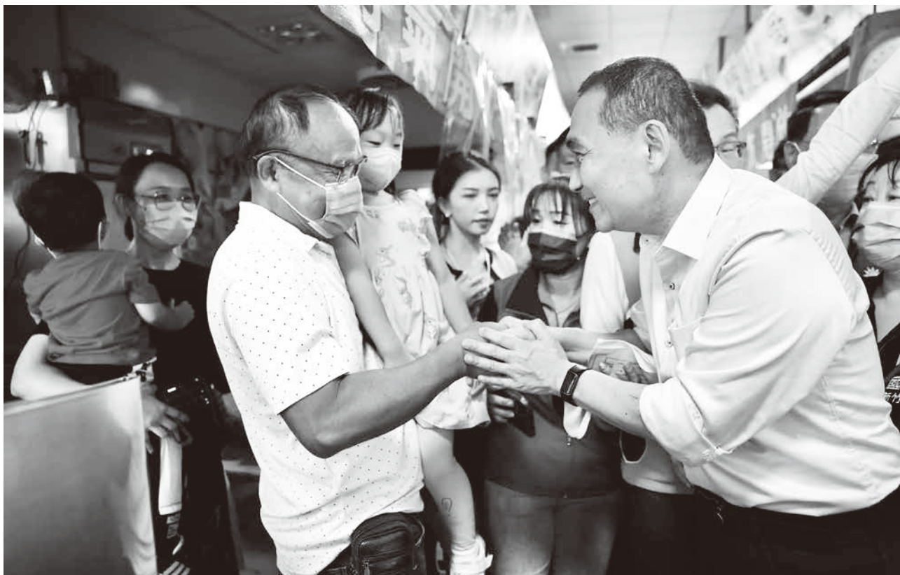
▲ 侯友宜近期勤跑行程，侯競辦表示，只要是跟選舉有關的行程，侯友宜會請假。

侯友宜競選發言人表示，市政交流跟選舉行程都非常重要，只要是跟選舉有關的行程市長都會請假。