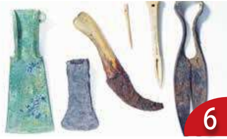
6 鐵器時代 與聖經的記載 (劉公典)