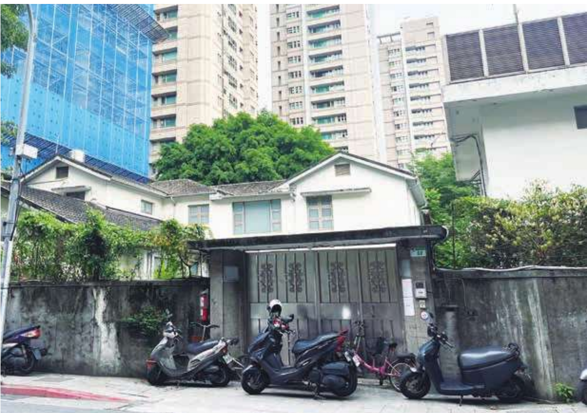
宋楚瑜曾住北市濟南路 3 段 50 號 登錄為歷史建築

台北市文化局文資委員 26 日投票通過，台北市濟南路 3 段 50 號，也是親民黨主席宋楚瑜任台灣省長時曾居住過的地方，獲指定為歷史建築。