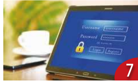
7 自動續訂陷阱 民團：應禁止