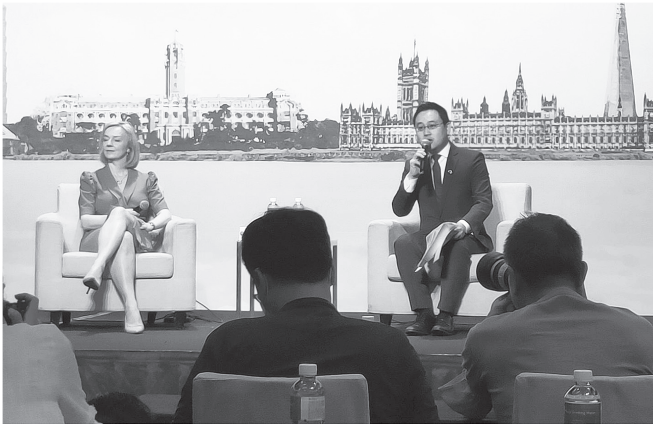
▲ 英國前首相特拉斯(左)17日訪台接受媒體提問。

前英國首相特拉斯呼籲，民主國家需要加強軍事與經濟的合作，並讓中國了解入侵台灣將面臨嚴重後果。