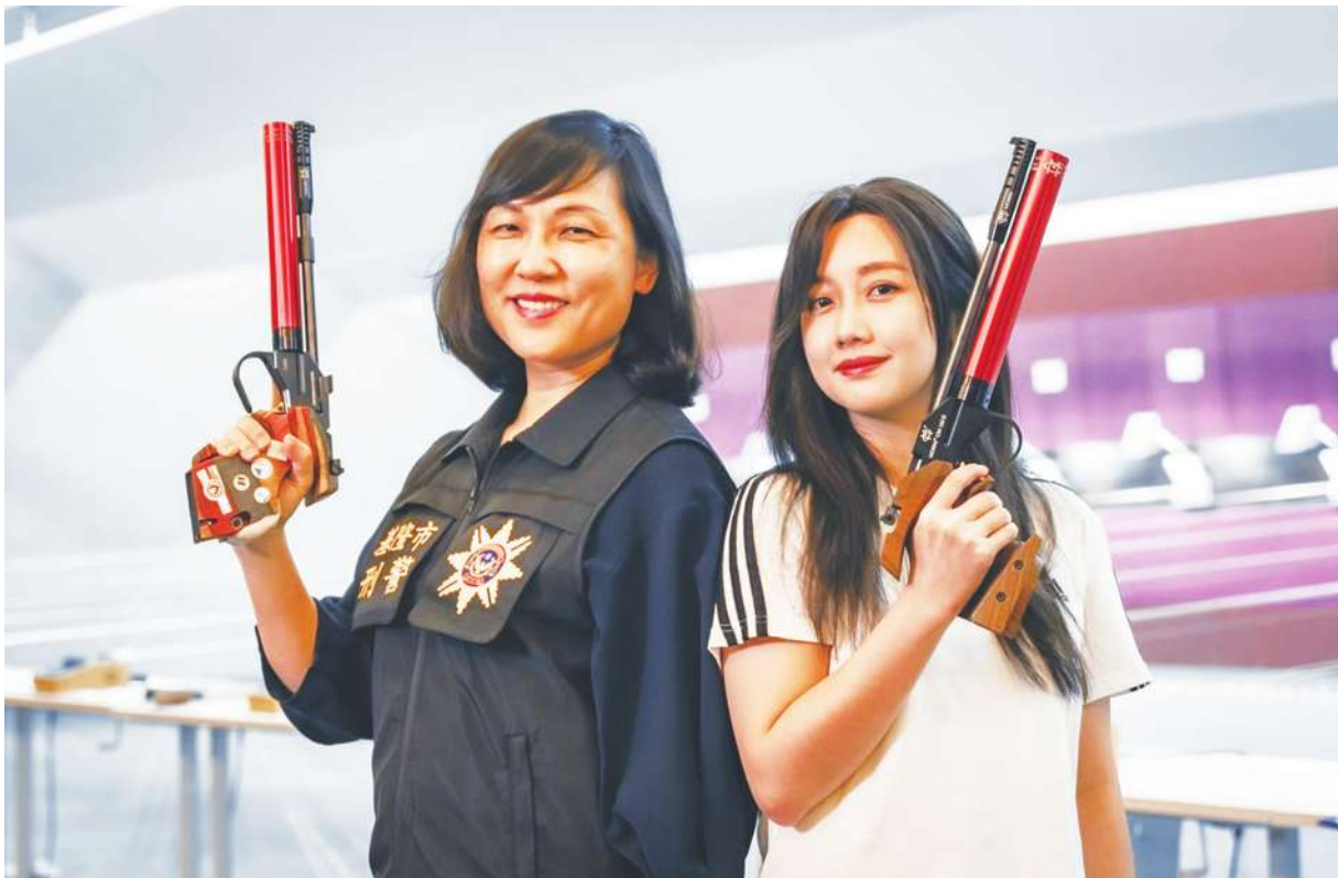
▲ 基隆市警察局邀請射擊國手吳佳穎（右）化身打詐特使，與「打詐基隆隊」拍攝防詐宣導影片。