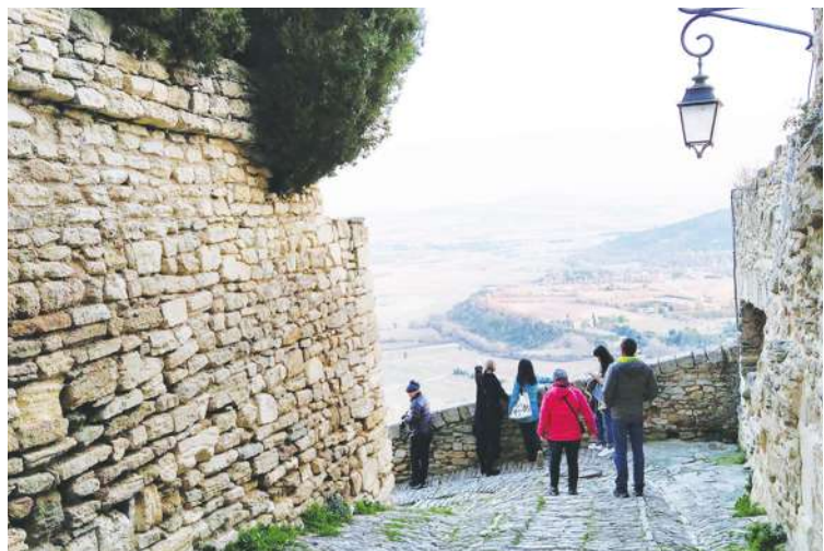
▲ 台灣遊客在疫情後，大量遠赴法國南部普羅旺斯旅遊。