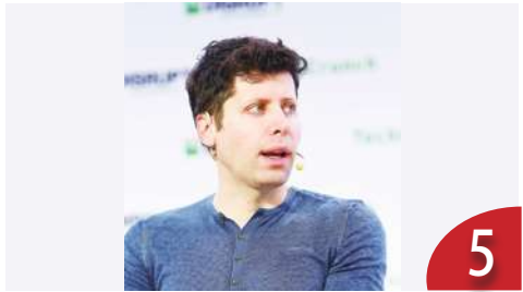
AI 取代就業 籲速監管 OpenAI