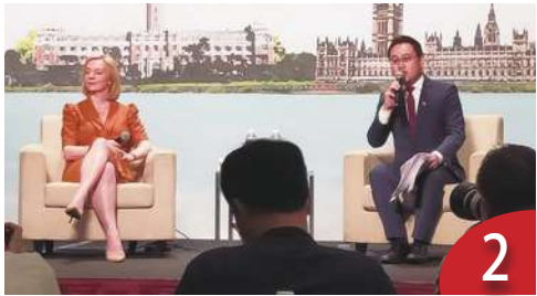
英前首相來訪 籲各國結盟抗中