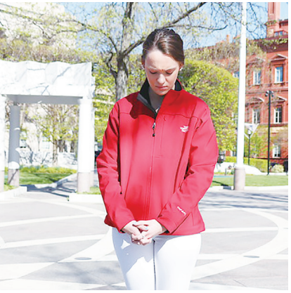
▲人們透過禱告獲得心靈層面上的滿足。