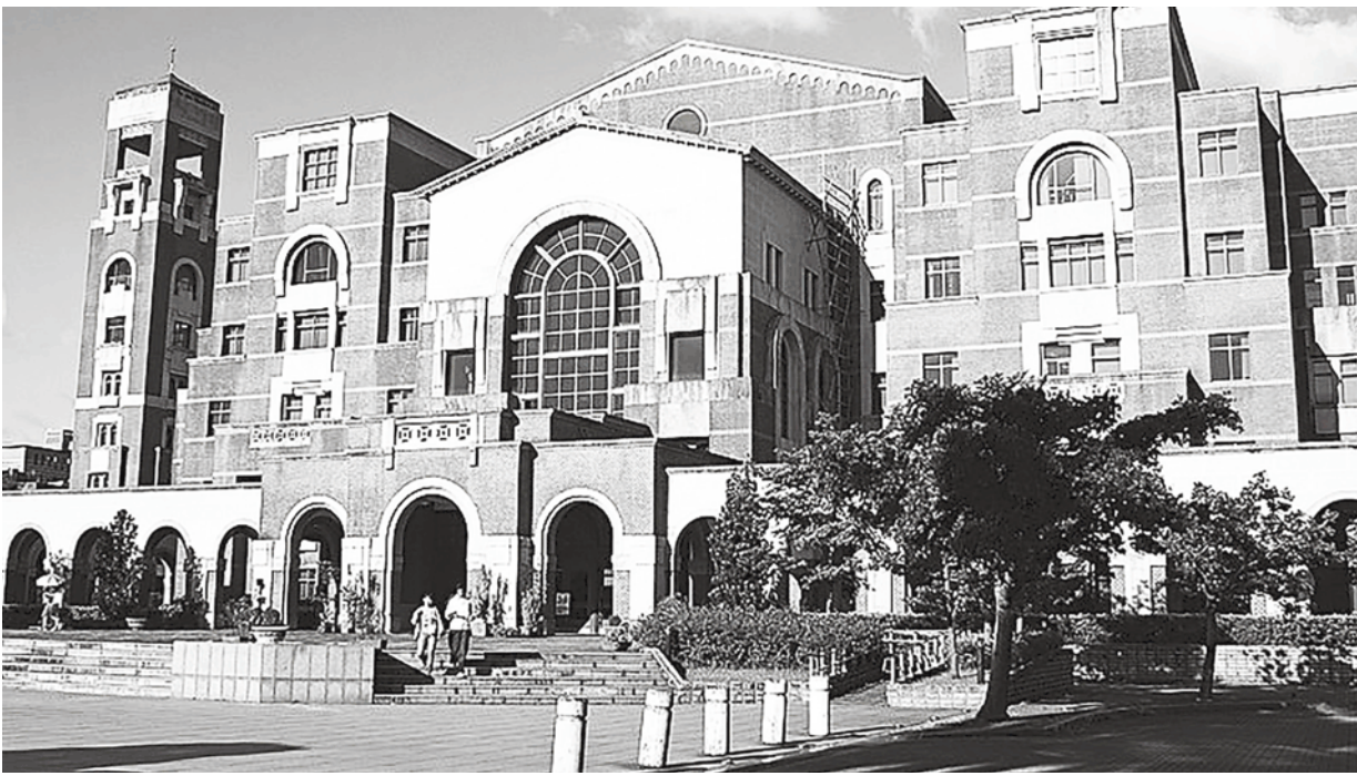
◀台大圖書館。（網路截圖）

特別是隨著冷戰的回潮，世界對抗的加劇，權力者不斷使用金權政治，收買、掌握宣傳機器，擴大話語權，甚至改寫歷史。我因此特別建議，作為當事人，管中閔應該自己來書寫，留下真實的記憶，以免歷史真相遭到扭曲。這是非常有可能的。