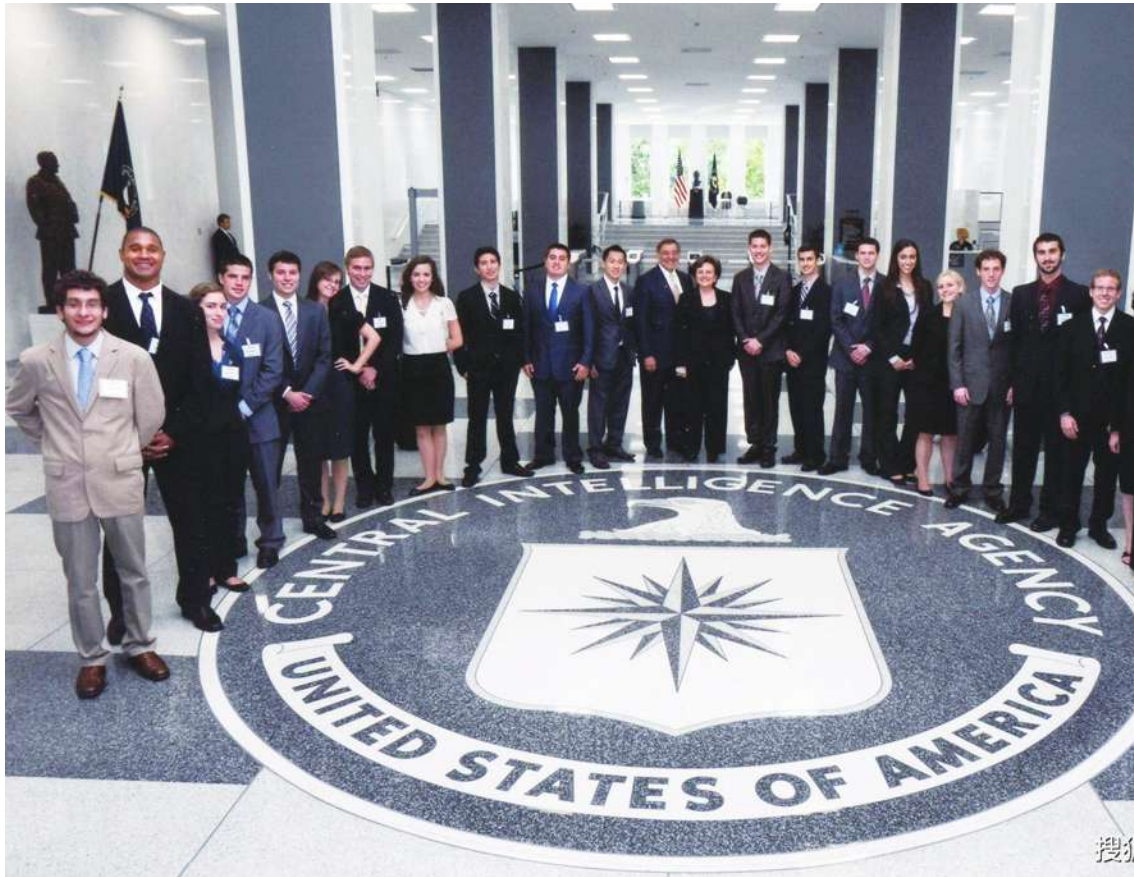
▲美國 CIA 據傳在俄羅斯內部散播投誠影片，俄方表示會密切注意，並提醒民眾。（影片截圖）

CIA 總監馬洛威去年 11 月在喬治梅森大學演講時，也罕見呼籲歡迎對普丁政權厭惡的俄羅斯人加入正義一方。