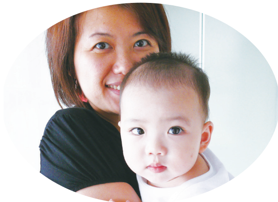
▲為了應對少子女化議題，新加坡、日本等國的生育政策都可追溯至 1990 年代。然而，數據卻指出這些政策效果微乎其微。

專家指出，勞動人口比例逐漸縮減，未來照顧非勞動人口的負擔就會直線上升，最後再無力供養社會中的高齡者。