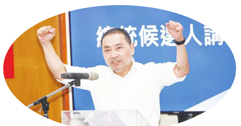
▲ 國民黨 17 日提名新北市長侯友宜為總統候選人。

朱立倫與侯友宜都在致詞時首先感謝郭台銘的成全，侯友宜說，感謝郭台銘對台灣經濟做出巨大貢獻，他願意與郭台銘攜手並進，團結勝選。他還強調，台灣現階段面臨國際兵凶戰危、國內衝突對立，年輕人看不到未來的局面，必須展現大破大立的精神，讓台灣再