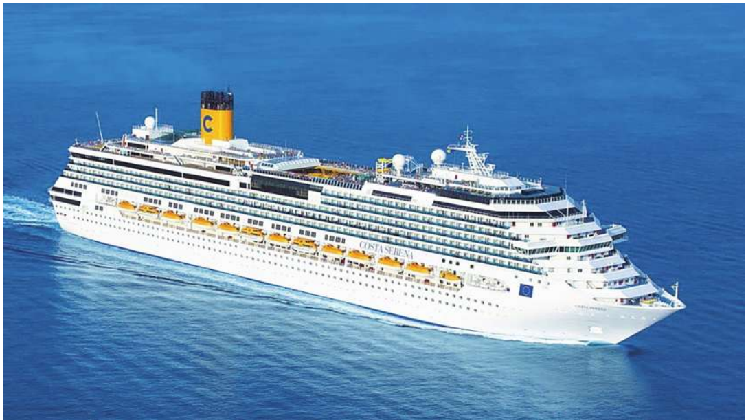
▲ 山富旅行社首季 EPS 是 2.02 元，是旅行社中的每股獲利王，山富在 9 月還獨包歌斯達郵輪航次。