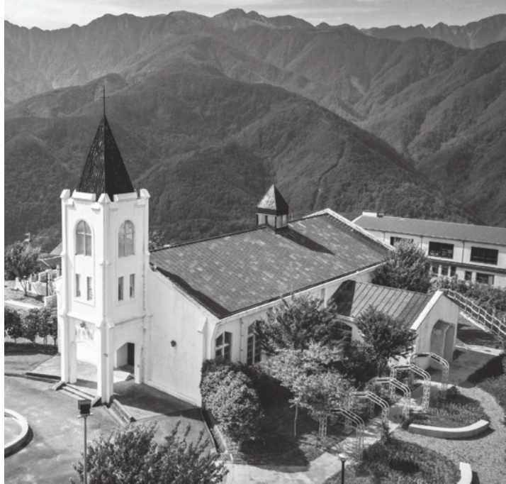
▲ 梨山耶穌堂擁有53年歷史，位於海拔2011公尺高山上，是在地居民重要的信仰中心。此次參加交通部觀光局舉辦的「觀光亮點獎」生態類評選。