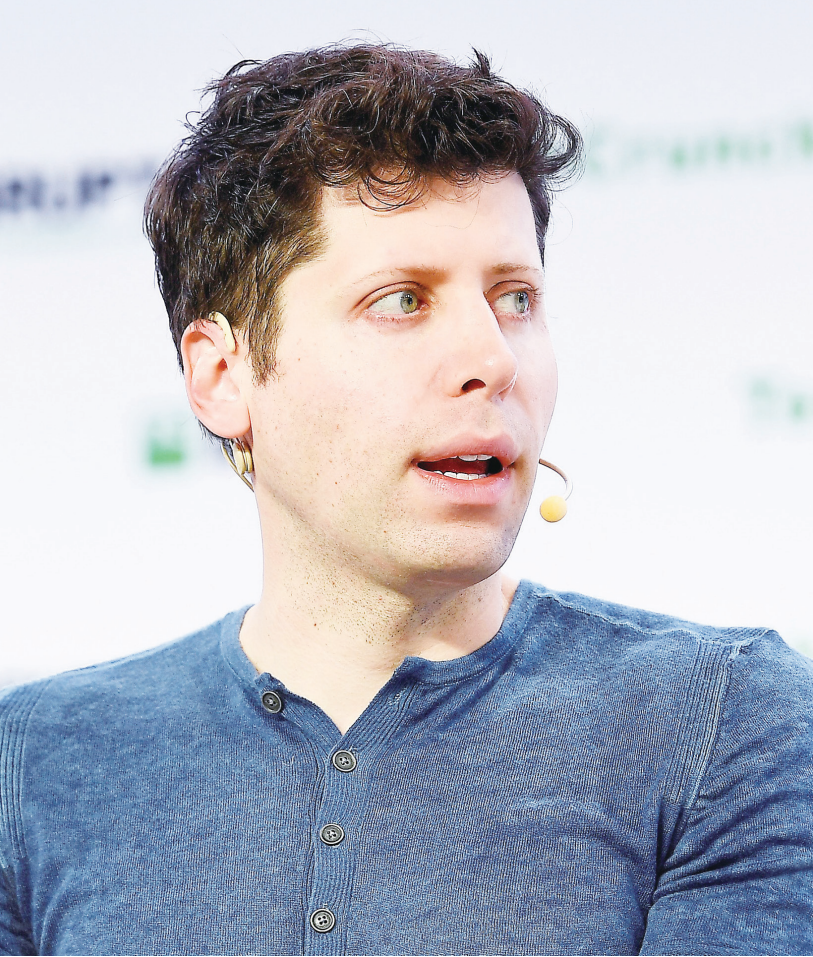
▲OpenAI 的 CEO 出席美國國會聽證會時，呼籲政府儘速立法監管 AI 發展。

OpenAI 的 CEO 奧特曼出席美國國會聽證會時直言，AI 繼續發展將對人類經濟產生重大影響，建議美國政府要立法進行監管。