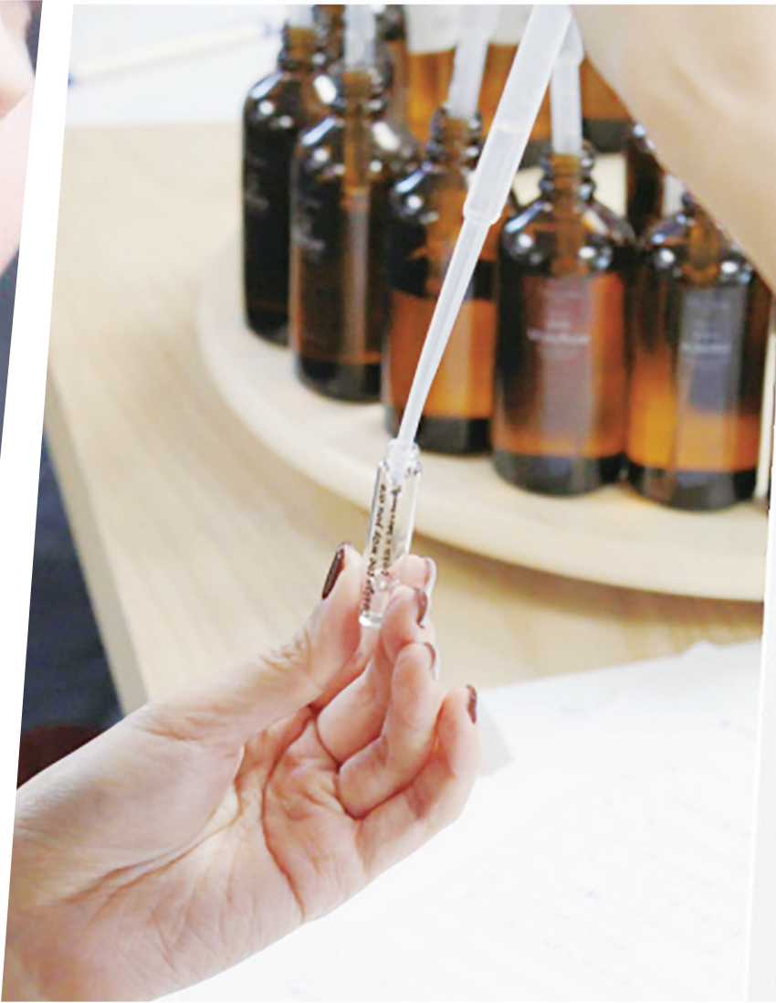
▲香氣形容分為，甜香、花香、果香、蜂蜜、乾草的氣味。（網路截圖）

學會調精油香水，擁有與眾不同的獨特香氣，還能用香氣傳達心意，甚至成為你的斜槓事業。