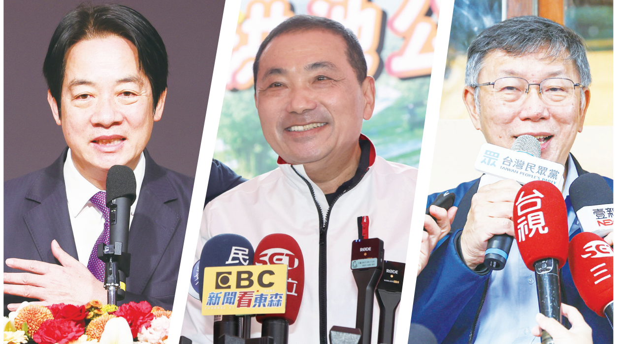
▲ 游盈隆說，侯友宜（中）支持度大跌 7.3%、賴清德（左）激增 5%、柯文哲（右）也增加 4.5%，正顯示沒有人能穩定領先，2024 年總統選舉的變數仍非常高。

關於台灣人的政黨支持傾向，最新調查顯示，20 歲以上的台灣人有 26% 支持民進黨，22% 支持國民黨，20% 支持民眾黨，4.3% 支持時代力量，4.3% 支持台灣基進，21% 中性選民。不過游盈隆也透露，他曾私下對民眾黨做過感情溫度計測量，分數也沒有超過 50 分，顯示民眾對 3 黨都無法信任。 游盈隆分析，柯文哲一定會出來選，而這樣局勢對民進黨較有利，因此民進黨的最高策略就是逼柯文哲出來選，避免讓侯友宜出來選。針對外界質疑賴清德「務實台獨工作者」的立場，游盈隆也說，現在反而是賴清德對外說明其兩岸政策的最好時機，統獨在台灣選戰中是重要議題，若能獲得民眾信任，對賴清德就是加分。