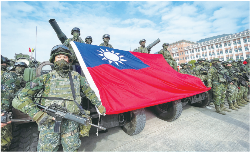
▲ 雖有 72.7% 民眾支持兵役延長，但對於蘇貞昌內閣則有 57% 不滿，僅有 35.8% 滿意，不滿意也是歷史新高。圖為陸軍 564 旅聯合兵種營 11 日在高雄實施實兵對抗演練。（中央社）

【本報記者呂翔禾台北報導】民眾對總統蔡英文處理兩岸、經濟的表現首度不滿大於滿意！台灣民意基金會 17 日公布民調顯示，對蔡總統施政的不滿意度已從 46.4% 飆升到 49.3%，再創蔡總統任內新高，另外民眾對於蔡總統處理兩岸經濟的表現也多表不滿。台灣民意基金會董事長游盈隆分析，蔡總統將進入職困境，對民進黨未來選戰不利。