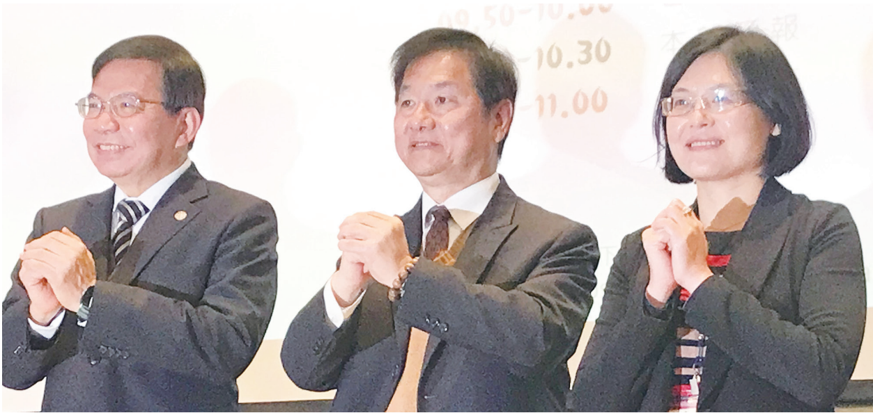
▲ 交通部長王國材（左）17 日出席交通部新春記者會。

議題也甚囂塵上。王國材說，持續推動強化台鐵行車安全的方案，盼未來不再發生重大行車事故，並加速辦理公司化進度，於 113 年 1 月成立台鐵公司，且能持續投入新車，提高營運能量 30%。