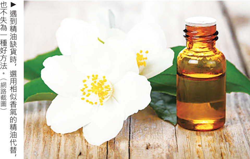
▲遇到精油缺貨時，選用相似香氣的精油代替，也不失為一種好方法。（網路截圖）