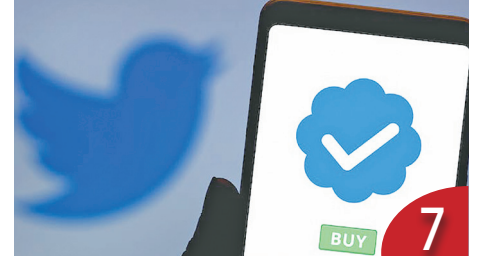
推特售藍勾 塔利班大舉採購