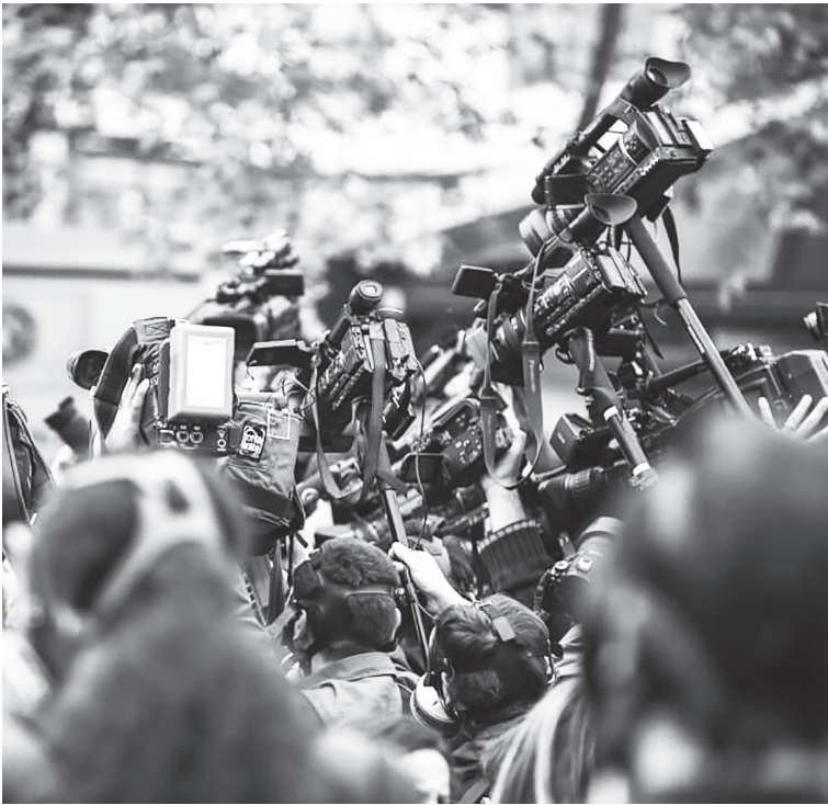
▲聯合國教育、科學及文化組織（UNESCO）17日表示，2022年全球記者和媒體工作者的遇害人數激增50%，達到86人，意即每4天就有1人遭到殺害。