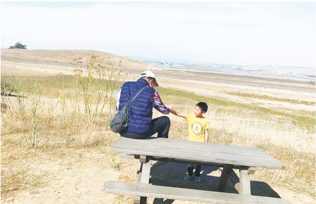
▲ 主，我感謝祢，我不再坐著等死。我雖在邊界之地，祢就近。我雖臨近的憂愁之海，祢就近。( 張文亮臉書 )

患難使人「喪膽」(faint)，苦難令人灰心。上帝卻勸勉我們，不要因著患難而喪膽。