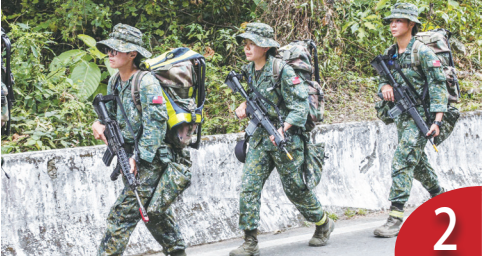
志願教召開放報名 首召訓女性