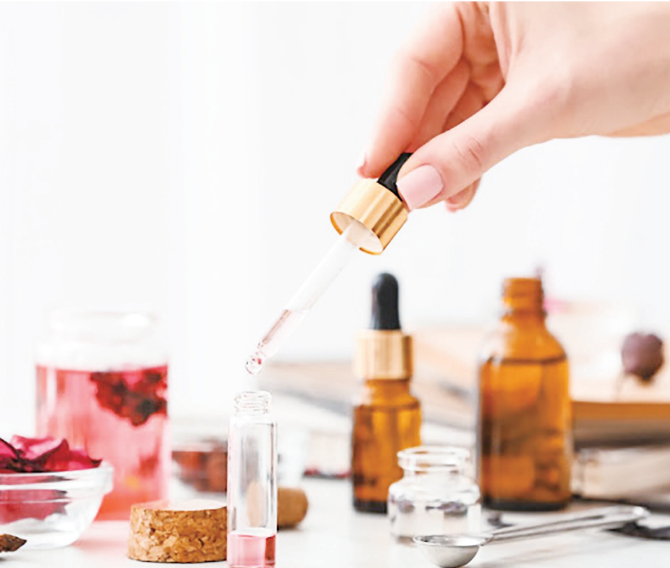
▲一般來說，調配一種香水，配方由原料的三種香氣調性（前調、中調、後調）架構而成。（網路截圖）