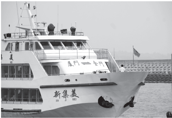
低入 指 境 旅 陽 性 率 僅 7.9%，再創 新 低。

根據指揮中心統計，15 日自中國入境來台旅客採檢結果，自桃園、松山機場入境者合計 2202 人，其中有 173 人陽性，