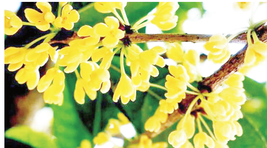
▲ 桂花植物的氣味是極品，每次聞到桂花香氣都是走在路上突然一陣風吹來時，清新、淡雅花香即隨之飄來。

對初學者而言，進行香氣修改時，會不知道從何下手，而失誤率也會變高。因此，我研發出